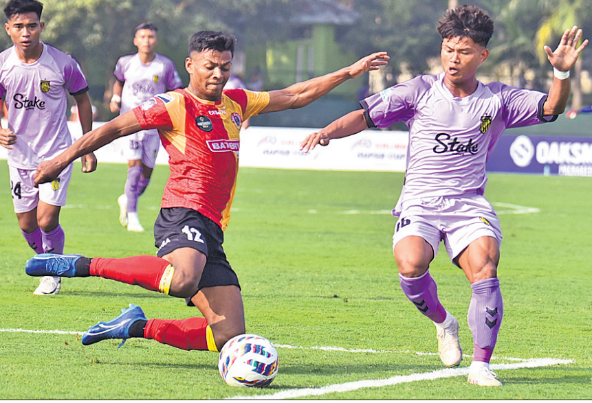
ଇଷ୍ଟ ବେଙ୍ଗାଲ ଓ ହାଇଦ୍ରାବାଦ ଏଫ୍ସି ମଧ୍ୟରେ ଅନୁଷ୍ଠିତ ମ୍ୟାଚର ଏକ ସଂଘର୍ଷପୂର୍ଣ୍ଣ ମୁହୂର୍ତ୍ତ।