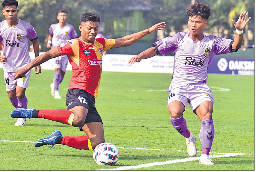
ଇଷ୍ଟ ବେଙ୍ଗାଲ ଓ ହାଇଦ୍ରାବାଦ ଏଫ୍ସି ମଧ୍ୟରେ ଅନୁଷ୍ଠିତ ମ୍ୟାଚର ଏକ ସଂଘର୍ଷପୂର୍ଣ୍ଣ ମୁହୂର୍ତ୍ତ।