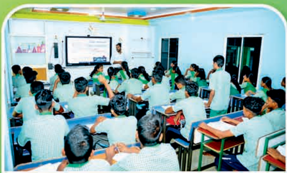
କେନ୍ଦ୍ରାପଡ଼ା ୧୧୨ ହାଇସ୍କୁଲ