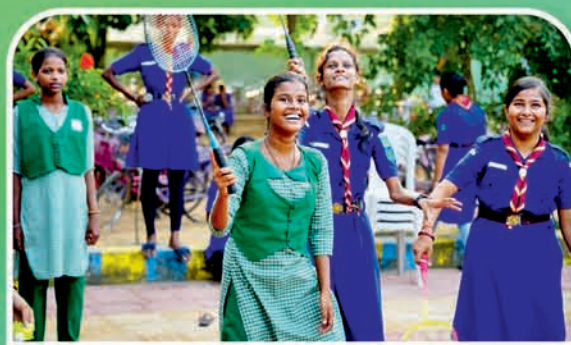
ବରଗଡ଼ ୬୦ ହାଇସ୍କୁଲ