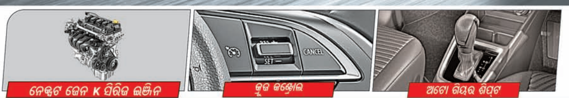
ନେଟ୍‌ସ୍‌ ଡେନ K ପିରିଡ୍ ଇଞ୍ଜିନ