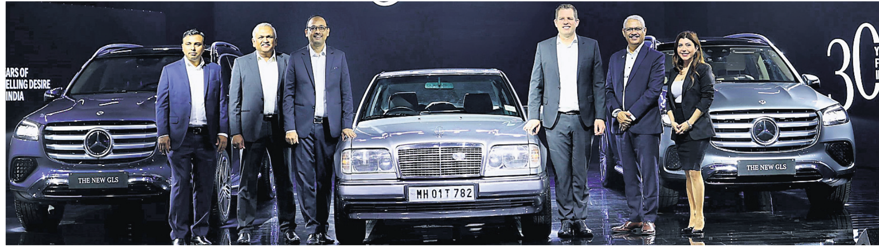
ଭାରତ ବଜାରରେ ମର୍ସିଡିଜ୍-ବେଞ୍ଜ ସଫଳତା ୩୦ତମ ପୂର୍ଣ୍ଣ ଉତ୍ସବ ନିକଟରେ ପାଳିତ ହୋଇଯାଇଛି। ଏହି ପରିପ୍ରେକ୍ଷାରେ ମର୍ସିଡିଜ୍-ବେଞ୍ଜ ଇଣ୍ଡିଆ ଯୁନିଟ୍ ପକ୍ଷରୁ ପ୍ରାୟ ୩୦ ଲକ୍ଷରୁ ଅଧିକ ଡିଲ୍ସ ଲିଭିଲାଣ୍ଡ ରେଞ୍ଜରୁ ଆନୁଷ୍ଠାନିକ ଭାବେ ଉନ୍ନତତମ ସହ ବଜାର ପ୍ରବେଶ ହୋଇଛି। ଏହି ଅବସରରେ ମର୍ସିଡିଜ୍ ବେଞ୍ଜ ଇଣ୍ଡିଆର ଏମ୍ପିଟି ତଥା ସିଇଓ ସମେତ ମୁଖ୍ୟ ଅଧିକାରୀ ଉପସ୍ଥିତ ଅଛନ୍ତି।