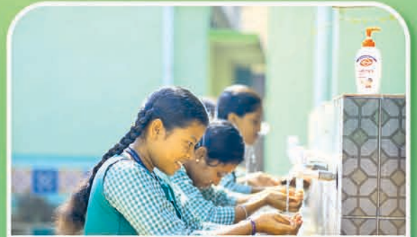
ଜଗତସିଂହପୁର ୫୭ ହାଇସ୍କୁଲ