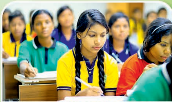
ଝାରସୁଗୁଡ଼ା ୧୧ ହାଇସ୍କୁଲ