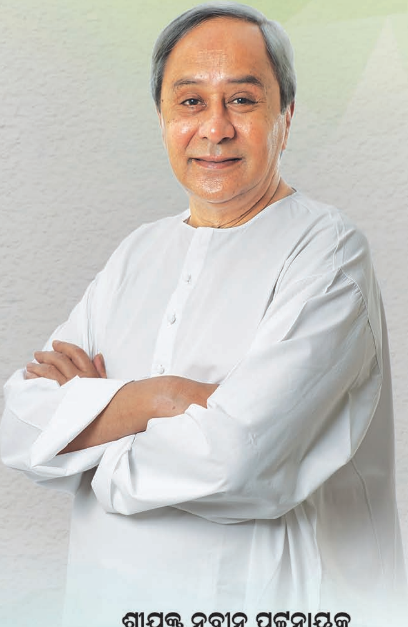
ଶ୍ରୀଯୁକ୍ତ ନବୀନ ପଟ୍ଟନାୟକ ମାନ୍ୟବର ପ୍ରଶାସକ