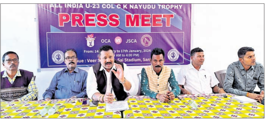
ଜିଲ୍ଲା କ୍ରୀଡା ସଂଘ କର୍ମଚାରୀମାନେ ମ୍ୟାଚ ସମ୍ପର୍କରେ ସୂଚନା ଦେଖିଛନ୍ତି ।

ଓଡ଼ିଶା ଓ ଝାଡ଼ଖଣ୍ଡ ମଧ୍ୟରେ ୨୩ବର୍ଷରୁ କମ୍ ବୟସ୍କ ଶିଳ୍ପୀ କ୍ରିକେଟ ମ୍ୟାଚ ଆସନ୍ତା ୧୪ରୁ ୧୭ତାରିଖ ପର୍ଯ୍ୟନ୍ତ ସମ୍ବଲପୁର ଛିଡ଼ ବାର ସ୍ତରରେ ସାଧ୍ୟ (ଭିଏସ୍‌ଏସ୍) ଷ୍ଟାଡ଼ିୟମରେ ଅନୁଷ୍ଠିତ ହେବ । ଏଥିପାଇଁ ପ୍ରସ୍ତୁତି ଶେଷ ପର୍ଯ୍ୟାୟରେ ପହଞ୍ଚିଛି । ଯଦ୍ୟତଃ ଓଡ଼ିଶା ଦଳ ଖେଳାଳିମାନେ ରୁଧିରା ରାଜିରେ ସମ୍ବଲପୁରରେ ପହଞ୍ଚିଛନ୍ତି । ଗୁରୁବାର ସକାଳେ ଝାଡ଼ଖଣ୍ଡ ଦଳ ସମ୍ବଲପୁରରେ ପହଞ୍ଚିବା କାର୍ଯ୍ୟକ୍ରମ ରହିଛି । ରୁଧିରା ଧୂବ ପାଠ୍ୟ ପଞ୍ଚାଭିତ୍ତିରେ ଆୟୋଜିତ ଖବରଦାତା ସମ୍ମିଳନୀରେ ସମ୍ବଲପୁର ଜିଲ୍ଲା କ୍ରୀଡା ସଂଘ କର୍ମଚାରୀ ସହି ସୁଦୂର ଦେଖାଯାଇଛି । ମ୍ୟାଚରେ ଭଲ ଖେଳ ହେବ ।