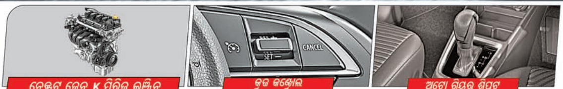
ନେଟ୍‌ର ଡେନ K ପିରିଡ୍ ଇଞ୍ଜିନ