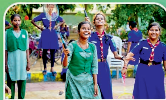
ବରଗଡ଼ ୬୦ ହାଇସ୍କୁଲ