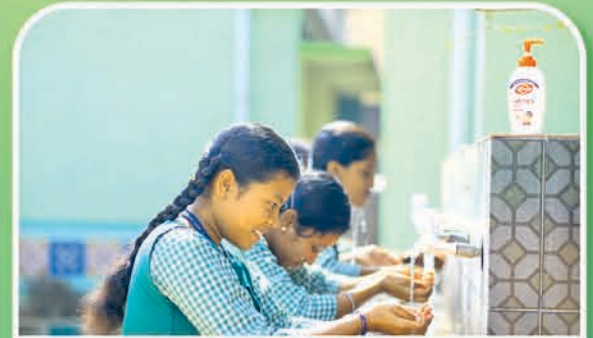
ଜଗତସିଂହପୁର ୫୭ ହାଇସ୍କୁଲ