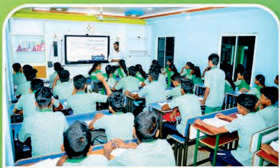
କେନ୍ଦ୍ରାପଡ଼ା ୧୧୨ ହାଇସ୍କୁଲ