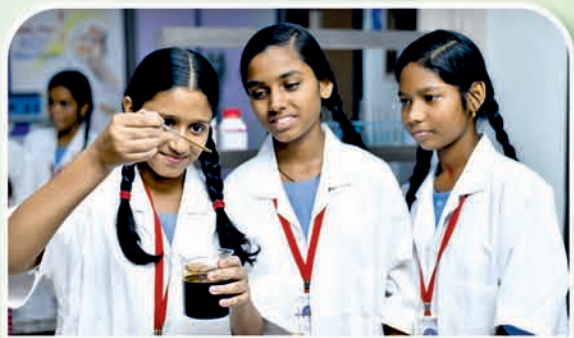
ଗଞ୍ଜାମ ୧୪୯ ହାଇସ୍କୁଲ

ଓଡ଼ିଶାର ମାନ୍ୟବର ମୁଖ୍ୟମନ୍ତ୍ରୀ ଶ୍ରୀଯୁକ୍ତ ନବୀନ ପଟ୍ଟନାୟକଙ୍କ ଦ୍ୱାରା ଲୋକାର୍ପଣ ୧୧ ଜାନୁଆରୀ ୨୦୨୪