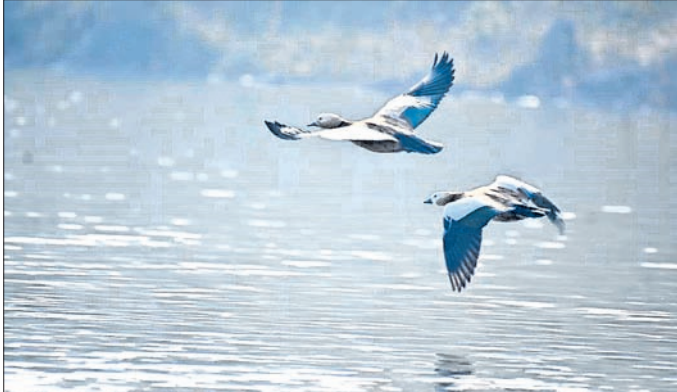
କୋରାପୁଟ କୋଲାବ ଜଳଭଣ୍ଡାରରେ ବ୍ରାମଣୀ ସେଲ୍ ଡକ୍ ପକ୍ଷୀ।

କୋରାପୁଟ ବନାଞ୍ଚଳରେ ଥିବା ୫ ଟି ଜଳଭଣ୍ଡାରରେ ପକ୍ଷୀ ଗଣନା କାର୍ଯ୍ୟ ରୁଧିରୀ କରାଯାଇଛି। ୨୧ ପ୍ରକାରର ପକ୍ଷୀ ୨୩୮୩ଟି ପକ୍ଷୀ ଚିହ୍ନଟ ହୋଇଥିବା କୋରାପୁଟ ବନାଞ୍ଚଳ ଅଧିକାରୀ ବିକାଶ କୁମାର ପାତ୍ର ସୂଚନା ଦେଇଛନ୍ତି। ପୂର୍ବବର୍ଷ ଅପେକ୍ଷା ୫୫୭୦ଟି ପକ୍ଷୀ ଅଧିକ ଗଣନା ହୋଇଛି।