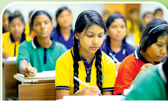
ଝାରସୁଗୁଡ଼ା ୧୧ ହାଇସ୍କୁଲ