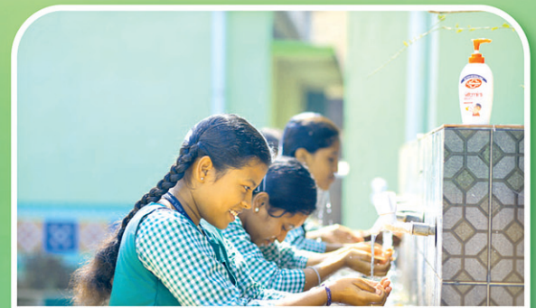
ଜଗତସିଂହପୁର ୫୭ ହାଇସ୍କୁଲ