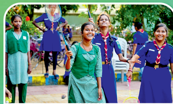
ବରଗଡ଼ ୬୦ ହାଇସ୍କୁଲ