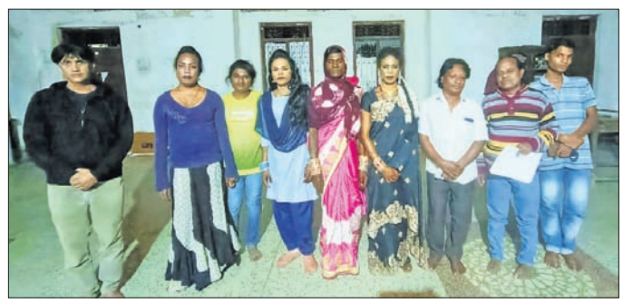
ବୈଠକରେ ଯୋଗଦେଇଥିବା ଜିଲ୍ଲାର ମାନେ।

ନବରଙ୍ଗପୁର ଗାନ୍ଧୀନଗର ତପୋବନ ପରିସରରେ ଜିଲ୍ଲା ଜିଲ୍ଲାର ସଂଘ ଅଧିକାରୀଙ୍କ ସହ ଆଲୋଚନା କରାଯାଇଥିଲା।