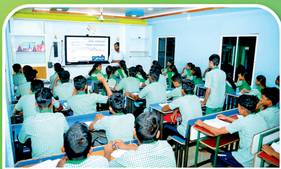
କେନ୍ଦ୍ରାପଡ଼ା ୧୧୨ ହାଇସ୍କୁଲ