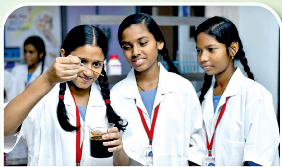
ଗଞ୍ଜାମ ୧୪୯ ହାଇସ୍କୁଲ

ଓଡ଼ିଶାର ମାନ୍ୟବର ମୁଖ୍ୟମନ୍ତ୍ରୀ ଶ୍ରୀଯୁକ୍ତ ନବୀନ ପଟ୍ଟନାୟକଙ୍କ ଦ୍ୱାରା ଲୋକାର୍ପଣ ୧୧ ଜାନୁଆରୀ ୨୦୨୪