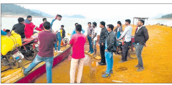
୩୦ ବର୍ଷ ହେଲା ଡ୍ୟାମର ଉଦ୍ଧାର ପାଇଁ ପ୍ରସ୍ତୁତ ହୋଇଥିବା ଲାଲପ୍ ଜ୍ୟାକେଟ ପିନ୍ଧିବା ପାଇଁ ଲୋକମାନଙ୍କୁ ସଚେତନ କରାଯାଇଛି।

ଦଶମକ୍ରମରେ ଲାଲପ୍ ଜ୍ୟାକେଟ ପିନ୍ଧିବା ପାଇଁ ଲୋକମାନଙ୍କୁ ସଚେତନ କରାଯାଇଛି। ଡ୍ୟାମର ଉଦ୍ଧାର ପାଇଁ ପ୍ରସ୍ତୁତ ହୋଇଥିବା ଲାଲପ୍ ଜ୍ୟାକେଟ ପିନ୍ଧିବା ପାଇଁ ଲୋକମାନଙ୍କୁ ସଚେତନ କରାଯାଇଛି।