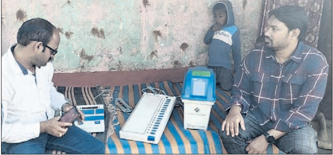
ନାରାୟଣପାଟଣା, ୧୦।୧(ରାଜକିଶୋର କେନା)

କୋରାପୁଟ ସଂସଦୀୟ କ୍ଷେତ୍ର ଲକ୍ଷ୍ମୀପୁର ନିର୍ବାଚନମଣ୍ଡଳର ନାରାୟଣପାଟଣା ବ୍ଲକ୍ରେ ରୁଧିରୀପାଟଣା ଗାଁ ଗାଁରେ ରୁପସ୍ତରୀୟ ଇତିବିଧି ସଚେତନତା ଶିବିର ଅନୁଷ୍ଠିତ ହୋଇଯାଇଛି।