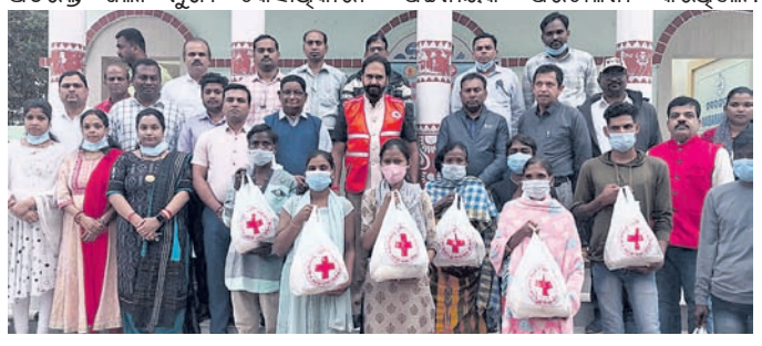
ଜିଲ୍ଲାପାଳ ଓ ଅନ୍ୟ ଅଧିକାରୀଙ୍କ ସହ ସହାୟତା ପାଇଥିବା ଯଶ୍ୱାରୋଗୀ।

ନବରଙ୍ଗପୁର ଜିଲ୍ଲା ରେଡ୍ କ୍ରସ୍ ସୋସାଇଟି ପକ୍ଷରୁ ଲୋକମାନଙ୍କୁ ସଚେତନ କରାଯାଇଛି।