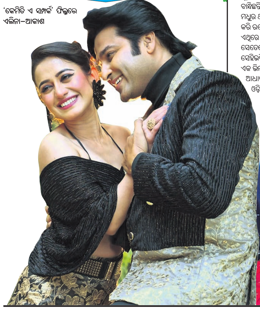
'କେମିତି ଏ ସମ୍ପର୍କ' ଫିଲ୍ମରେ ଏଲିନା-ଆକାଶ