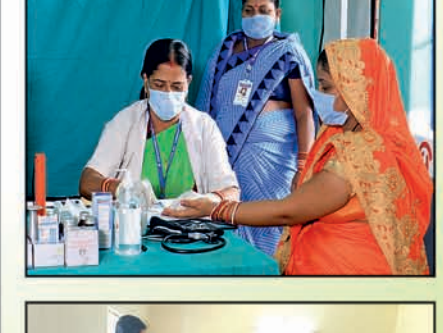
ରକ୍ତହୀନତା ଯୋଗୁଁ ଶାରୀରିକ, ମାନସିକ ଓ ବୌଦ୍ଧିକ ବିକାଶରେ ବାଧା, ଅକ୍ଳାପଣ, ରୋଗ ପ୍ରତିରୋଧକ ଶକ୍ତି ହ୍ରାସ ଓ ଗର୍ଭ ସମୟରେ ବିଭିନ୍ନ ପ୍ରକାର ଜଟିଳତା ଦେଖା ଦେଇଥାଏ।