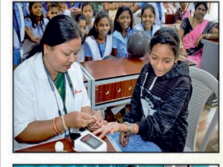
‘ଅମ୍ଳାନ’ କାର୍ଯ୍ୟକ୍ରମ ଅନ୍ତର୍ଗତ ନିମ୍ନ ଲିଖିତ ବୟସ ବର୍ଗର ଉପଭୋକ୍ତା ମାନଙ୍କର ରକ୍ତହୀନତାର ପରୀକ୍ଷା, ଚିକିତ୍ସା ଓ ପରାମର୍ଶ ସେବା ମାଗଣାରେ ଉପଲବ୍ଧ।