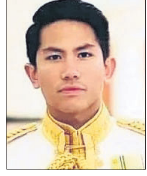
ଯୁବରାଜ ଅବଦୁଲ ମାଜିଦ୍