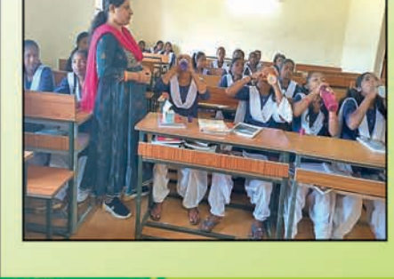
ସମସ୍ତ ଉପଭୋକ୍ତାଙ୍କୁ ଅନୁରୋଧ ସେମାନେ ରକ୍ତହୀନତାର ସ୍ଥିତି ଜାଣିବା ପାଇଁ ରକ୍ତ ପରୀକ୍ଷା କରି ନିଜର ସମ୍ପୂର୍ଣ୍ଣ ଚିକିତ୍ସା କରାଇ ନିଅନ୍ତୁ।