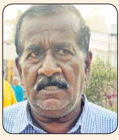
- ଅନୁତ୍ୟାନ୍ତ ଦାଶ, ଭୁବନେଶ୍ୱର।

କାର୍ଯ୍ୟ ସମ୍ପୂର୍ଣ୍ଣ ପରେ ଆହୁରି ଭଲ ଲାଗିବ ପରିବାର ସହ ପୁରୀ ଆସିଥିଲା। ମହାପ୍ରଭୁଙ୍କୁ ଦର୍ଶନ କରି ବେଶ୍ ଖୁସି ଓ ଆନନ୍ଦ ଲାଗିଲା। ପ୍ରଶାସନ ପକ୍ଷରୁ କରାଯାଉଥିବା ଦର୍ଶନ ବ୍ୟବସ୍ଥା ବହୁତ ଭଲ ରହିଛି। ବୟସ୍କ ଲୋକଙ୍କ ପାଇଁ ମଧ୍ୟ ଯେଉଁ ବ୍ୟବସ୍ଥା କରାଯାଇଛି, ତାହା ସ୍ୱାଗତଯୋଗ୍ୟ ପଦକ୍ଷେପ। କାର୍ଯ୍ୟ ସମ୍ପୂର୍ଣ୍ଣ ହେବା ପରେ ଭକ୍ତମାନଙ୍କୁ ଆହୁରି ଭଲ ସୁବିଧା ମିଳିବା ଭିତରେ ମଧ୍ୟ ମହାପ୍ରଭୁଙ୍କ ସେବକ ପାଇଁ ଉତ୍ତମ ବ୍ୟବସ୍ଥା କରାଯାଇଛି। ବ୍ୟାରିକେଡ ମଧ୍ୟରେ ବସିବା ପାଇଁ ଯେଉଁ ବ୍ୟବସ୍ଥା ରହିଛି, ତା' ଗୁଣ ବୟସ୍କ ଓ ଛୋଟ ପିଲାମାନେ ବହୁମାତ୍ରାରେ ଉପକୃତ ହେବେ।