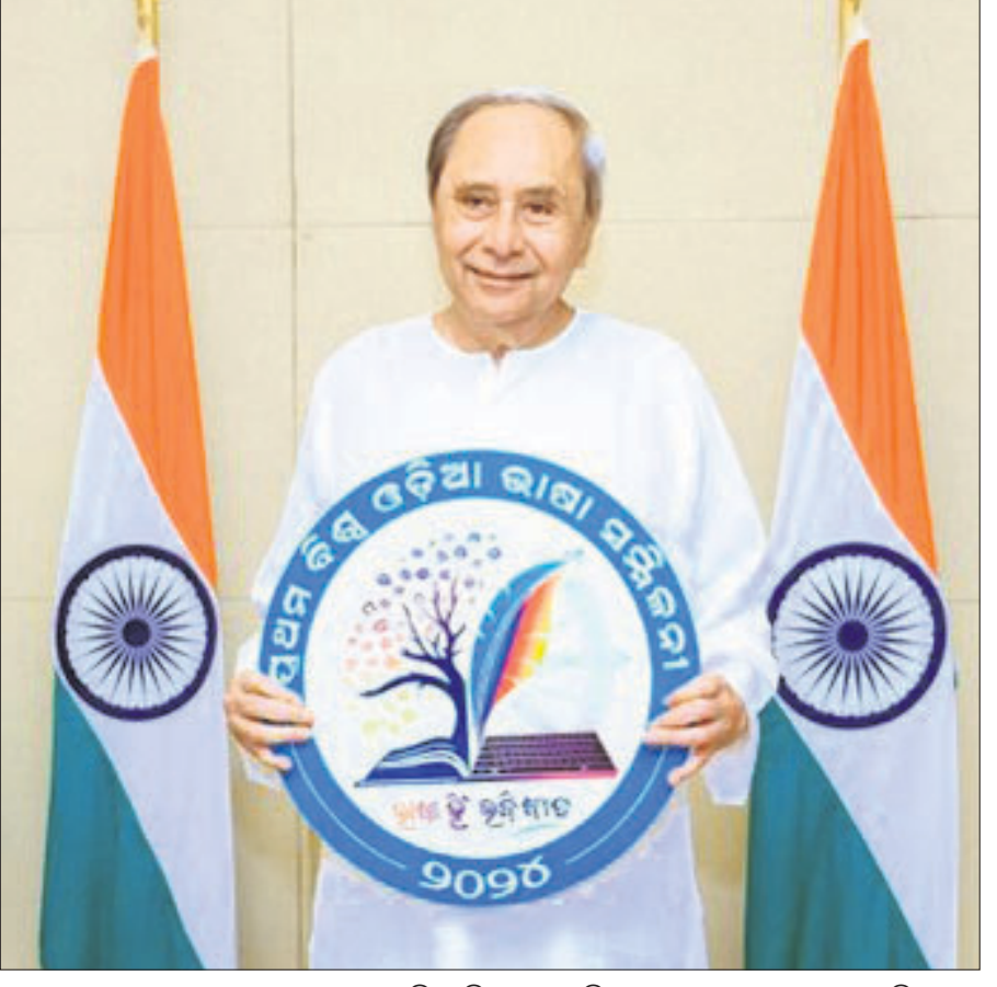
ମୁଖ୍ୟମନ୍ତ୍ରୀ ନବୀନ ପଟ୍ଟନାୟକ ଗୁରୁବାର ପ୍ରଥମ ବିଶ୍ୱ ଓଡ଼ିଆ ଭାଷା ସମ୍ମିଳନୀର ଲୋଗୋ ଉନ୍ମୋଚନ କରୁଛନ୍ତି।

ନେଇ ବରିଷ୍ଠ ସଙ୍ଗମାନେ ତିତ୍ତାବ୍ୟକ୍ତ କରିଛନ୍ତି। ଉତ୍ସବରେ ପ୍ରଧାନମନ୍ତ୍ରୀଙ୍କୁ ଆଗରେ ରଖି ସନାତନ ଶାସ୍ତ୍ର ପାରମ୍ପରିକ ରୀତିନୀତି ଅନୁଯାୟୀ ପୂଜା କରାଯିବା ଆବଶ୍ୟକ ବୋଲି କହିଛନ୍ତି। ପ୍ରାଣପ୍ରତିଷ୍ଠା ଉତ୍ସବକୁ ରାଜନୈତିକ ରଙ୍ଗ ଦିଆଯାଉଥିବାରୁ ସେ ନ ଯିବା ପାଇଁ ନୀତିଗତ ଭାବେ ନିଷ୍ପତ୍ତି ନେଇଥିବା କହିଛନ୍ତି। ପ୍ରଧାନମନ୍ତ୍ରୀ ମନ୍ଦିର ଗର୍ଭଗୃହରେ ରହି ପୂର୍ଣ୍ଣକୁ ସମର୍ଥନ କରିବା, ପ୍ରାଣପ୍ରତିଷ୍ଠା ଉତ୍ସବ ସମ୍ପନ୍ନ କରିବା ରାଜନୈତିକ ରଙ୍ଗ। ଭଗବାନ ରାମଙ୍କ ପ୍ରାଣପ୍ରତିଷ୍ଠା ଆଧ୍ୟାତ୍ମିକ ରୀତିନୀତି ଅନୁଯାୟୀ ହେବା ଆବଶ୍ୟକ। ଅର୍ଦ୍ଧସତ୍ୟ ଓ ଅର୍ଦ୍ଧମିଥ୍ୟାକୁ ଫେଷ୍ଟା ନ ଯାଇ ସବୁକିଛି ଆଧ୍ୟାତ୍ମିକ ଜ୍ଞାନ ଅନୁଯାୟୀ କରାଯାଇ ବୋଲି ପୁରୀ ଶଙ୍କରାଚାର୍ଯ୍ୟ କହିଛନ୍ତି। ଅନ୍ୟପକ୍ଷରେ ଜ୍ୟୋତିର୍ପୀଠ ଶଙ୍କରାଚାର୍ଯ୍ୟ ସ୍ୱାମୀ ଅଭିମୁକ୍ତେଶ୍ୱରାନନ୍ଦ ଭିନ୍ନ ଅଭିମୁଖ୍ୟ ପ୍ରକାଶ କରିବା ସହ ୨୨ ତାରିଖରେ ରାମମନ୍ଦିର ଯିବେ ନାହିଁ ବୋଲି କହିଛନ୍ତି। ମନ୍ଦିର ନିର୍ମାଣ ସନାତନ ଧର୍ମ ପାଇଁ ବିଜୟର ସୂଚନା ଦେଉନାହିଁ। ପୂର୍ବରୁ ଅଯୋଧ୍ୟାରେ ରାମମନ୍ଦିର ଥିଲା। ତେଣୁ ଏହାର ନିର୍ମାଣ ଧର୍ମ ପାଇଁ ଏକ ଉପହାର କିମ୍ବା ବିଜୟୋଲ୍ଲାସ ନୁହେଁ। ରାଜନୈତିକ ପ୍ରତିବନ୍ଧକ ଯୋଗୁଁ ରାଜନେତାମାନେ ସେଦିନ ଅଯୋଧ୍ୟା ଯାଇ ନାହାନ୍ତି। ତେବେ ତାଙ୍କ ଯିବାରେ କୌଣସି ପ୍ରତିବନ୍ଧକ ନ ଥିବା ଅଭିମୁକ୍ତେଶ୍ୱରାନନ୍ଦ କହିଛନ୍ତି। ଦେଶକୁ ଯେଉଁଦିନ ଗୋହତ୍ୟା ବନ୍ଦ ହେବ, ସେଦିନ ସେ ଅଯୋଧ୍ୟା ରାମମନ୍ଦିର ଯାଇ ଉତ୍ସାହର ସହ ପୂଜାର୍ଚ୍ଚନା କରିବେ ବୋଲି କହିଛନ୍ତି। ଅଦାଲତଙ୍କ ନିଷ୍ପତ୍ତି ଅନୁଯାୟୀ ଉଚ୍ଚ ଜମି ହିନ୍ଦୁଙ୍କର। ତାହାର ସେମାନେ ସବୁପ୍ରୟୋଗ କରିବେ କି ବୁଝପ୍ରୟୋଗ, ଫୁଲ୍-୨