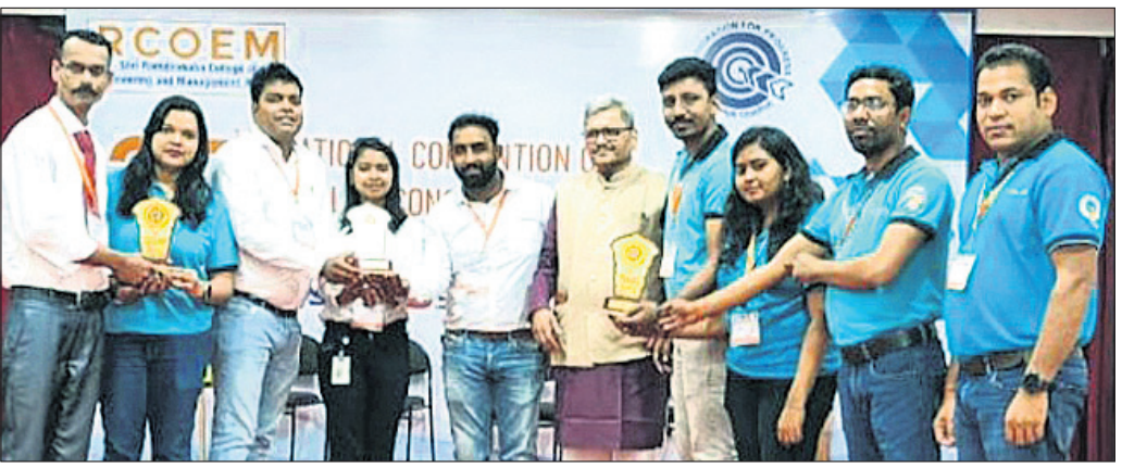
ଭୁବନେଶ୍ୱର, ୧୧।୧ (ଅଭିଜିତ ଦାଶ)

ଜିନ୍ଦଗିକୁ ୧୦ ପାର ଏକ୍ସଲେନ୍ସ ଆଡ଼ାର୍ଡ୍ ପ୍ରଦାନ କରାଯାଇଛି।