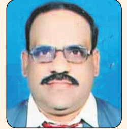
ବନମାଳ ପାଖ, ସଂସ୍କୃତି ଗବେଷଣା

ଅନ୍ୟ, ଆଧ୍ୟାତ୍ମିକ ଚେତନା ପ୍ରତିଷ୍ଠା । ଶ୍ରୀକ୍ଷେତ୍ର ଅନୁଭୂତି ପ୍ରକଳ୍ପ ଲୋକାର୍ପଣ ଉପରେ ପାଇଁ ଉତ୍ସାହପୂର୍ଣ୍ଣ ହୋଇଛି । ଶ୍ରୀକ୍ଷେତ୍ର ଅନୁଭୂତି ପ୍ରକଳ୍ପ ଲୋକାର୍ପଣ ଉପରେ ପାଇଁ ଉତ୍ସାହପୂର୍ଣ୍ଣ ହୋଇଛି ।