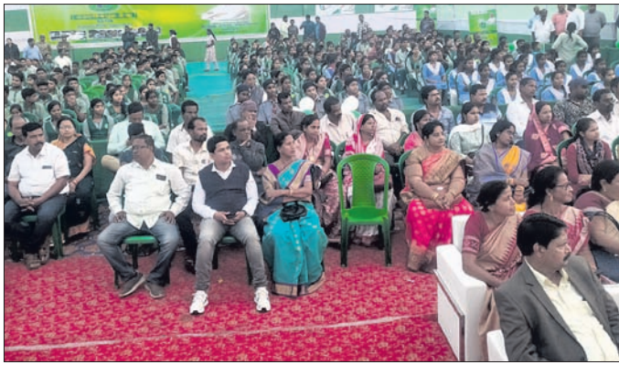
ବିଦ୍ୟାଳୟରେ ଆୟୋଜିତ କାର୍ଯ୍ୟକ୍ରମରେ ଉପସ୍ଥିତ ଅତିଥି ଓ ଅନ୍ୟମାନେ।

ଜଗତସିଂହପୁର, ୧୧୧୧ (ପ୍ରମୋଦ କୁମାର ନାୟକ) ଶିକ୍ଷାର ମାନ ବୃଦ୍ଧି ପାଇଁ ଉତ୍ତମ ପରିବେଶ ସୃଷ୍ଟି କରିବାକୁ ଭିତ୍ତିଭୂମିର ଉନ୍ନତି ଜରୁରୀ।