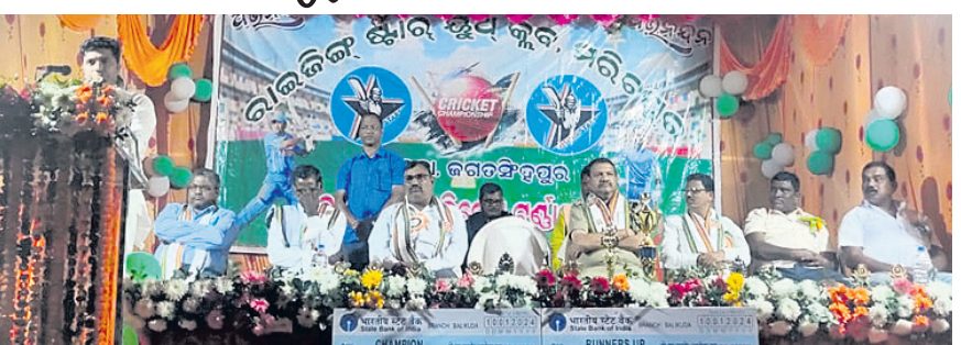
ଆନ୍ଧ୍ର ରାଜ୍ୟ କ୍ରିକେଟ ଚମ୍ପିୟନସ୍ ଉଦ୍ଘାଟନା ଉତ୍ସବରେ ମହାସଭା ଅତିଥିମାନେ।

ବାଲିକୁଆ, ୧୧୧୧ (ତପସ୍ୱୀ ସାହୁ) ରାଜ୍ୟ କ୍ରିକେଟ ଚମ୍ପିୟନସ୍ ଉଦ୍ଘାଟନା ଉତ୍ସବରେ ଆନ୍ଧ୍ରରୁ ଆସିଥିବା ୩୨ ଚମ୍ପିୟନ ଆନ୍ଧ୍ର ରାଜ୍ୟ କ୍ରିକେଟ ଚମ୍ପିୟନସ୍ ଉଦ୍ଘାଟନା ମାଧ୍ୟମରେ ଆନ୍ଧ୍ରରୁ ଆସିଥିବା ପରିବରରେ ଅନୁଷ୍ଠିତ ହୋଇଯାଇଛି।