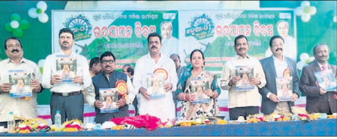
ଅତିଥିମାନେ ମହାବିଦ୍ୟାଳୟର ପୁସ୍ତକପତ୍ର ସଂକଳ୍ପ ପ୍ରତିଷ୍ଠାକୁ ଉଦ୍ଘାଟନ କରୁଛନ୍ତି।