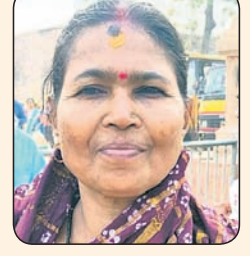
ମାଳତି ପାଖ, ଭୁବନେଶ୍ୱର

ପ୍ରତି ମାସରେ ଆଦି ମହାପ୍ରଭୁଙ୍କୁ ବର୍ଷକୁ ଚାରି ଥର ପୂଜା ଦିଆଯାଏ । ଶ୍ରୀକ୍ଷେତ୍ର ଅନୁଭୂତି ପ୍ରକଳ୍ପ ଲୋକାର୍ପଣ ଉପରେ ପାଇଁ ଉତ୍ସାହପୂର୍ଣ୍ଣ ହୋଇଛି । ଶ୍ରୀକ୍ଷେତ୍ର ଅନୁଭୂତି ପ୍ରକଳ୍ପ ଲୋକାର୍ପଣ ଉପରେ ପାଇଁ ଉତ୍ସାହପୂର୍ଣ୍ଣ ହୋଇଛି ।