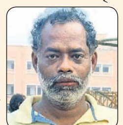
ବେଦନ ମହାଶାଳା, ବିକ୍ରମ ସେବାକେନ୍ଦ୍ର

ମହାପ୍ରଭୁଙ୍କୁ ଧାର୍ଯ୍ୟ କରି ମହାପ୍ରଭୁଙ୍କୁ ଲାଭ କରିବ । ଶ୍ରୀକ୍ଷେତ୍ର ଅନୁଭୂତି ପ୍ରକଳ୍ପ ଲୋକାର୍ପଣ ଉପରେ ପାଇଁ ଉତ୍ସାହପୂର୍ଣ୍ଣ ହୋଇଛି । ଶ୍ରୀକ୍ଷେତ୍ର ଅନୁଭୂତି ପ୍ରକଳ୍ପ ଲୋକାର୍ପଣ ଉପରେ ପାଇଁ ଉତ୍ସାହପୂର୍ଣ୍ଣ ହୋଇଛି ।