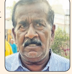
ଅନୁମୋଦନ ପାଖ, ଭୁବନେଶ୍ୱର

ଧାର୍ଯ୍ୟ ସମ୍ପୂର୍ଣ୍ଣ ପରେ ଆତ୍ମା ଲାଭ କରିବ । ଶ୍ରୀକ୍ଷେତ୍ର ଅନୁଭୂତି ପ୍ରକଳ୍ପ ଲୋକାର୍ପଣ ଉପରେ ପାଇଁ ଉତ୍ସାହପୂର୍ଣ୍ଣ ହୋଇଛି । ଶ୍ରୀକ୍ଷେତ୍ର ଅନୁଭୂତି ପ୍ରକଳ୍ପ ଲୋକାର୍ପଣ ଉପରେ ପାଇଁ ଉତ୍ସାହପୂର୍ଣ୍ଣ ହୋଇଛି ।