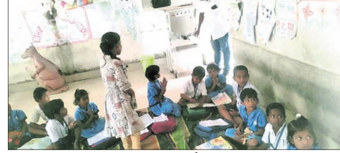
ଖାଦ୍ୟ ଆୟୋଗ ସଦସ୍ୟ ଅଙ୍ଗଣଘାଟି କେନ୍ଦ୍ର ପରିବର୍ତ୍ତନ କରୁଛନ୍ତି ।

୧, ୨ ଅଙ୍ଗଣଘାଟି କେନ୍ଦ୍ର ଏବଂ ଭଙ୍ଗାପୁଣ୍ଡା ଦୁର୍ଗାପୁର ପ୍ରାଥମିକ ବିଦ୍ୟାଳୟ, କମଳାକାନ୍ତ ହାଇସ୍କୁଲ, ମାଟିଆବେଡ଼ା ପ୍ରାଥମିକ ବିଦ୍ୟାଳୟ, ମଙ୍ଗଳପୁର ଉଚ୍ଚ ପ୍ରାଥମିକ ବିଦ୍ୟାଳୟ, କୁରୁପଞ୍ଜା ହାଇସ୍କୁଲ, ବିଭିନ୍ନ ଅଙ୍ଗଣଘାଟି କେନ୍ଦ୍ର ଓ ବିଦ୍ୟାଳୟ ଓ ପରିବର୍ତ୍ତନ କରିଥିଲେ । ଏହି ଅବସରରେ ଖାଦ୍ୟ ଆୟୋଗ ସଦସ୍ୟ ବ୍ଲକ୍ କମଳାକାନ୍ତ-୧ ଓ ୨, ମାଟିଆବେଡ଼ା, ମଙ୍ଗଳପୁର ଉପରେ ୧, ୨, ୩ ଓ ୪, କୁରୁଷ୍ଟିର ନିମ୍ନମାନର ଦେଖି ତାରିକ କରିଥିଲେ ।