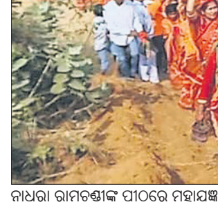
ନାଥରା ରାମଚଣ୍ଡୀଙ୍କ ପୀଠରେ ମହାଯଜ୍ଞ ଅବସରରେ କଳସ ଶୋଭାଯାତ୍ରା ।

ଦେଢ଼ାମାଳ ଜିଲ୍ଲା ଓଡ଼ାପଡ଼ା ବ୍ଲକ୍ ପ୍ରସିଦ୍ଧ ନାଥରାସ୍ଥିତ ମା' ରାମଚଣ୍ଡୀଙ୍କ ପୀଠରେ ଶୁକ୍ରବାର ୦୯ ୨୮ମ ବିଶ୍ୱାସୀ ଶ୍ରୀବିଷ୍ଣୁ ମହାଯଜ୍ଞ ଆରମ୍ଭ ହୋଇଛି । ୩ ହଜାରରୁ ଊର୍ଦ୍ଧ୍ୱ ମହିଳା ଶ୍ରଦ୍ଧାଳୁ କଳସ ଯାତ୍ରାରେ ସାମିଲ ହୋଇଥିଲେ । ଏହାପରେ ଘଟ ଘାପନ କରାଯାଇଥିଲା । ଶନିବାର ପୂର୍ବାହ୍ନରେ ଯଜ୍ଞ ସ୍ଥଳରେ ପୂର୍ଣ୍ଣପୂଜା,