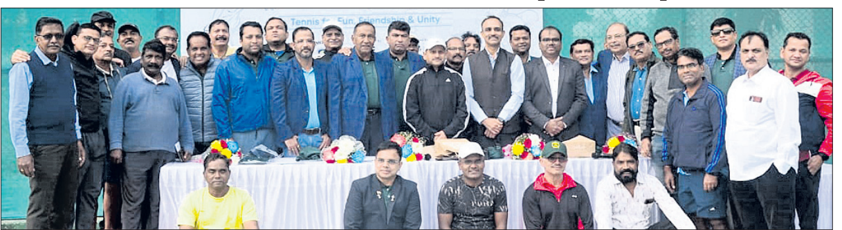
ଉତ୍କଳ ଓପନ ଅଲ୍ ଓଡ଼ିଶା ଚେନିସ୍ ଟୁର୍ନାମେଣ୍ଟ ଉଦ୍‌ଘାଟନ ଅବସରରେ ଅତିଥିକ ଗହଣରେ ଭେଟେରାନ ବର୍ଗର ଖେଳାଳିମାନେ।

ଭୁବନେଶ୍ୱର, ୧୨୧୧ (ତପନ ସାହି) ଏସିଇ ଚେନିସ୍ କ୍ଲବ ଆନୁକୁଲ୍ୟରେ ଉତ୍କଳ ଓପନ ଚେନିସ୍ ଟୁର୍ନାମେଣ୍ଟ ଶୁକ୍ରବାର କଳିଙ୍ଗ ଷ୍ଟାଡ଼ିୟମରେ ଆରମ୍ଭ ହୋଇଛି। ୩ ଦିନ ବିଶିଷ୍ଟ ଏହି ପ୍ରତିଯୋଗିତାରେ ରାଜ୍ୟର ୨୫୦ ଖେଳାଳି ଅଂଶଗ୍ରହଣ କରିଛନ୍ତି। ୮ ବର୍ଗରେ ପ୍ରତିଯୋଗିତା ପାଇଁ ୩.୨୦