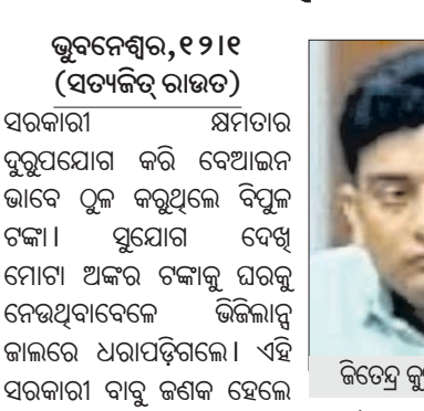
ଭୁବନେଶ୍ୱର, ୧୨।୧ (ସତ୍ୟଜିତ ରାଉତ)

ବାଲେଶ୍ୱର ଚାନ୍ଦିପୁରସ୍ଥିତ ପ୍ରତିରକ୍ଷା ଅନୁସନ୍ଧାନ ଏବଂ ବିକାଶ ସଙ୍ଗଠନ (ଡିଆରଡିଓ) ପକ୍ଷରୁ ଆଇଆର ୩ ନଂ. ଲକ୍ଷ୍ୟପାତ୍ର ଶୁକ୍ରବାର ପୂର୍ବାହ୍ନ ୧୦ଟା ୩୦ମିନିଟ୍‌ରେ ଆକାଶ-ଏନ୍‌ଜି ଜେନେରେଶନ (ଆକାଶ ଏନ୍‌ଜି) କ୍ଷେପଣାସ୍ତ୍ରର ସଫଳତାର ସହ ପରୀକ୍ଷଣ ହୋଇଛି। ସ୍ୱଦେଶୀ ଜ୍ଞାନକୌଶଳରେ ନିର୍ମିତ ଏହି ସ୍ୱଳ୍ପ ସୁରକ୍ଷାମୟ କ୍ଷେପଣାସ୍ତ୍ରର ଲକ୍ଷ୍ୟଭେଦ କ୍ଷମତା ୪୦ କି.ମି.। 'ଆକାଶଏନ୍‌ଜି' ଆକାଶ ସିରିଜର ଏକ ଅତ୍ୟାଧୁନିକ ସଂସ୍କରଣ। ଏହି କ୍ଷେପଣାସ୍ତ୍ର ଯିଏ ଗତିରେ ଆକାଶମାର୍ଗରେ ବେଶୀ ଦୈର୍ଘ୍ୟ ଦୃଢ଼ୀକୃତ ନଷ୍ଟ କରିବାରେ ସକ୍ଷମ ଅଟେ। ଶତ୍ରୁକ୍ଷମର ଯେକୌଣସି ମୁକ୍ତାସ୍ତ୍ରକୁ ଏହା ସହଜରେ ଧ୍ୱଂସ କରିପାରେ। ଏହାର ଲକ୍ଷ୍ୟଭେଦ କ୍ଷମତା, ଗତିବିଧି ଏବଂ ଯୋଗାଯୋଗ କ୍ଷମତାକୁ ଆଇଆରଏନ୍‌ରେ ଟେଲିମେଟ୍ରିକ ରାଡାର ସିଷ୍ଟମ ଦ୍ୱାରା ଅନୁଧ୍ୟାନ କରାଯାଇଥିଲା। ଦ୍ୱାରା ପୃଷ୍ଠା-୨