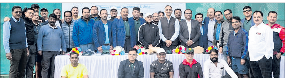
ଉତ୍କଳ ଓପନ ଅଲ୍ ଓଡ଼ିଶା ଚେନିସ୍ ଟୁର୍ନାମେଣ୍ଟ ଉଦ୍‌ଘାଟନ ଅବସରରେ ଅତିଥିକ ଗହଣରେ ଭେଟେରାନ ବର୍ଗର ଖେଳାଳିମାନେ।

ଭୁବନେଶ୍ୱର, ୧୨୧୧ (ତପନ ସାହୁ) ଏସିଇ ଚେନିସ୍ କ୍ଲବ୍ ଆନୁକୁଲ୍ୟରେ ଉତ୍କଳ ଓପନ ଚେନିସ୍ ଟୁର୍ନାମେଣ୍ଟ ଶୁକ୍ରବାର କଳିଙ୍ଗ ଷ୍ଟାଡ଼ିୟମରେ ଆରମ୍ଭ ହୋଇଛି। ୩ ଦିନ ବିଶିଷ୍ଟ ଏହି ପ୍ରତିଯୋଗିତାରେ ରାଜ୍ୟର ୨୫୦ ଖେଳାଳି ଅଂଶଗ୍ରହଣ କରିଛନ୍ତି। ୮ ବର୍ଗରେ ପ୍ରତିଯୋଗିତା ପାଇଁ ୩.୨୦