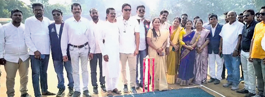
ଅତିଥିମାନେ ବିଜୁ ପ୍ରିୟମର ଲିଗ୍ କୁ ଉଦ୍‌ଘାଟନ କରୁଛନ୍ତି।