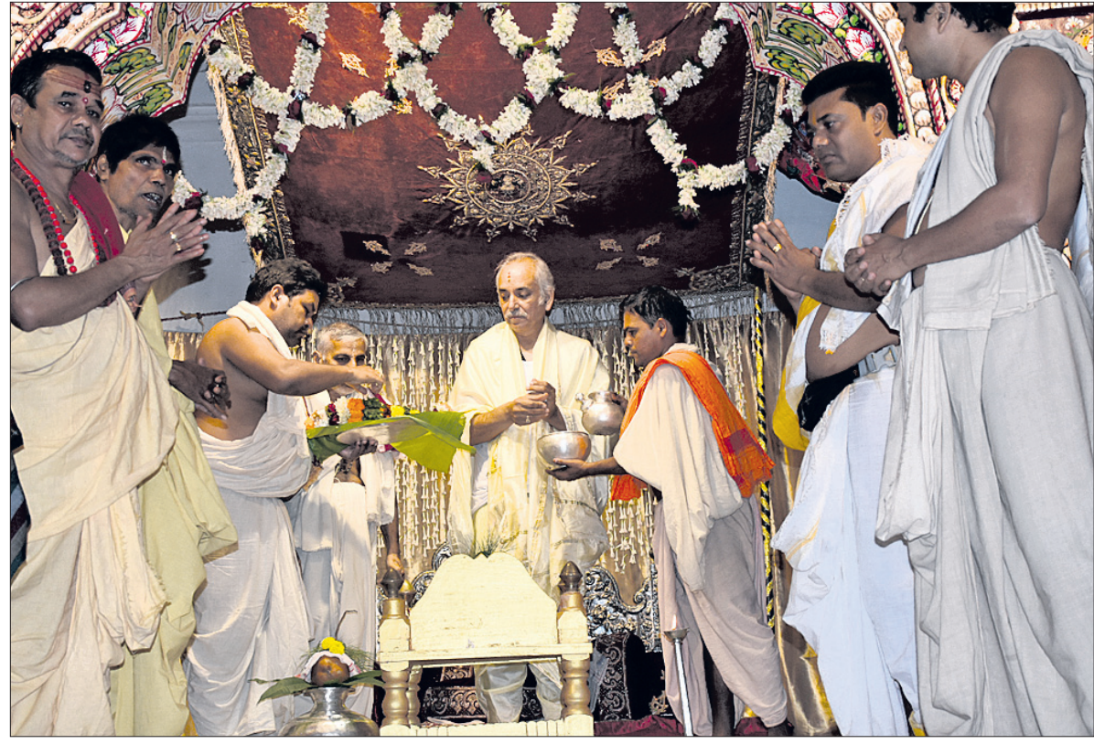
ଶ୍ରୀମନ୍ଦିର ପରିକ୍ରମା ପ୍ରକଳ୍ପର ଆଦ୍ୟ ପର୍ବ ଶୁକ୍ରବାର ସନ୍ଧ୍ୟାରେ ଶ୍ରୀମନ୍ଦିରରେ ଅନୁଷ୍ଠିତ ହୋଇଯାଇଛି। ଗଜପତି ମହାରାଜା ଦିବ୍ୟସିଂହ ଦେବ ବ୍ରାହ୍ମଣ ବରଣ କରୁଛନ୍ତି।

କଲିଙ୍ଗ ସୁପର କପ୍ ଫୁଟବଲ ଟୁର୍ନାମେଣ୍ଟରେ ଶୁକ୍ରବାର ଅନ୍ତତମ ଜାହାଜ୍ ଗୋଲ ବଳରେ ଓଡ଼ିଶା ଏଫ୍ ସି ୧-୦ରେ ବେଙ୍ଗାଲୁରୁ ଏଫ୍ ସିକୁ ପରାସ୍ତ କରିଛି।