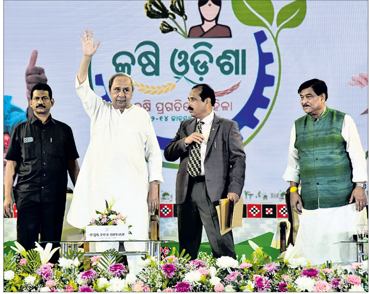
ଭୁବନେଶ୍ୱର ଜନତା ମଇଦାନଠାରେ ଶୁକ୍ରବାର 'କୃଷି ଓଡ଼ିଶା-୨୦୨୪'କୁ ଉଦଘାଟନ କରି ମୁଖ୍ୟମନ୍ତ୍ରୀ ନବୀନ ପଟ୍ଟନାୟକ ଉପସ୍ଥିତ କୃଷକ, କୃଷି ଉଦ୍ୟୋଗୀ, କୃଷି ବିଜ୍ଞାନୀ ଓ ବିଶେଷଜ୍ଞଙ୍କୁ ଶୁଭେଚ୍ଛା ଜଣାଉଛନ୍ତି। (ଫଟୋ- ବିକାଶ ନାୟକ)