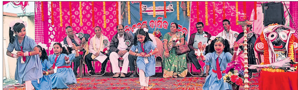
ନୂତନ ମାଧ୍ୟମରେ ଅତିଥିଙ୍କୁ ସ୍ୱାଗତ କରୁଛନ୍ତି ଛାତ୍ରୀମାନେ।

ନୟାଗଡ଼ ଜିଲ୍ଲା ନୂଆଗାଁ ବ୍ଲକ୍ କୋରଡ଼ା ସରକାରୀ ପ୍ରାଥମିକ ବିଦ୍ୟାଳୟର ବିଶେଷତା ବାର୍ଷିକ ଉତ୍ସବ ଶୁକ୍ରବାର ଉଦ୍‌ଘାଟିତ ହୋଇଯାଇଛି।