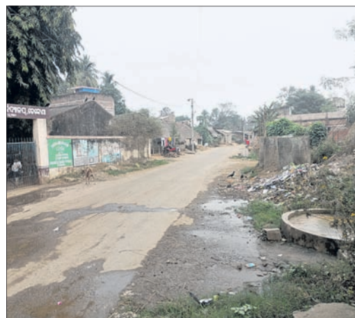
ଭେକେଣା ପଞ୍ଚାୟତ ନକଲୁପ ନିକଟରେ କମି ରହିଛି ଆବର୍ଜନା ।

ସେଲ୍ଫି ପଠାଇବା ସମୟରେ ନିଜର ନାମ ଏବଂ ମୋବାଇଲ ନମ୍ବର ଦେବାକୁ ଭୁଲନ୍ତୁ ନାହିଁ । ଯୋଗାଯୋଗବେଳେ ଫଟୋ ପ୍ରକାଶ ପାଇବ ।