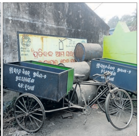
କାମରେ ଲାଗୁନି ବର୍ଷକୁ ପକାଇବାକୁ ଥିବା ଟ୍ରାକ୍ ।

ଯୋଜନା ଓ କାର୍ଯ୍ୟକ୍ରମ ମାଧ୍ୟମରେ ଜନସଚେତନତାକୁ ଆରମ୍ଭ କରି କର୍ମଚାରୀ ନିୟୋଜନ ନିମନ୍ତେ ଅର୍ଥ ବ୍ୟୟ କରାଯାଇଛି । ସପ୍ଲାଇ ପ୍ରତି ପଞ୍ଚାୟତରେ କଠିନ ବର୍ଷକୁ ପକାଇବାକୁ ଦେହ ଲକ୍ଷ ଟଙ୍କା ବ୍ୟୟ କରି ଆବର୍ଜନା ଗୃହ ନିର୍ମାଣ କରିବା ସହ ସେଠାକୁ ଆବର୍ଜନା ବୋହି ନେବା ପାଇଁ ଟ୍ରାକ୍ ଯାଇକେଲ ମଧ୍ୟ ଯୋଗାଇ ଦିଆଯାଇଛି ।