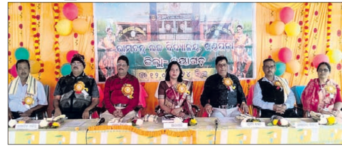
ବାର୍ଷିକୋତ୍ସବରେ ମଞ୍ଚାସୀନ ଅତିଥି।

ଖଣ୍ଡପଡ଼ା, ୧୨୧ (ଅକସ୍ମ କୁମାର ମହାରିଶା) ଖଣ୍ଡପଡ଼ା ରାମଚନ୍ଦ୍ର ଭଞ୍ଜ ବିଦ୍ୟାଳୟର ବାର୍ଷିକ ଉତ୍ସବ ଶୁକ୍ରବାର ଅନୁଷ୍ଠିତ ହୋଇଯାଇଛି।