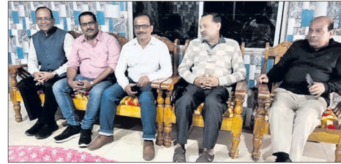
ସାମାଜିକ ସମ୍ମିଳନୀରେ ପ୍ରତିଯୋଗିତା ସମ୍ପର୍କରେ ସୂଚନା ଦିଆଯାଇଛି।

ରଣପୁର, ୧୨୧ (ସୁଜାତା କିଶୋର ଦାଶ) ରଣପୁର 'ସଙ୍ଗୀତଧାରା' (ସ୍ୱର ସଙ୍ଗୀତର ମଧୁମୟ ଝଙ୍କାର) ନୟାଗଡ଼ ଆୟୋଜିତ ଲିଭାପ୍ରସାଧ ଭକ୍ତି ସଙ୍ଗୀତ ପ୍ରତିଯୋଗିତା ୩ଟି ପର୍ଯ୍ୟାୟରେ ଅନୁଷ୍ଠିତ ହେଉଛି।