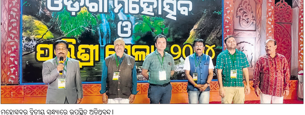
ମହୋତ୍ସବର ଦ୍ୱିତୀୟ ସନ୍ଧ୍ୟାରେ ଉପସ୍ଥିତ ଅତିଥିଙ୍କୁ।

ବକ୍ତ୍ରାମାନେ କହିଥିଲେ। କାର୍ଯ୍ୟକ୍ରମ ଶେଷରେ ଓଡ଼ିଆ ଭାଷା ସାହିତ୍ୟ ଓ ସଂସ୍କୃତି ବିଭାଗ ସହାଧିକାରୀରେ ବିଭିନ୍ନ ସ୍ତରରୁ ଆସିଥିବା କଳାକାରମାନଙ୍କ ଦ୍ୱାରା ସଂସ୍କୃତିକ କାର୍ଯ୍ୟକ୍ରମ ପାରିବେଶିତ ହେବା ସହ ବହୁ ଉତ୍ସାହୀ ମୁବକଙ୍କୁ ପୁରସ୍କୃତ କରାଯାଇଥିଲା।