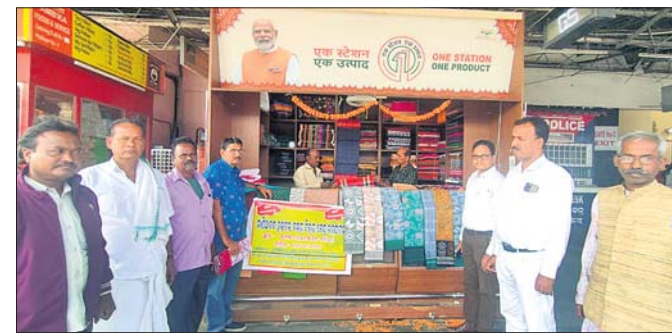
ରେଳ ଷ୍ଟେଶନର ମାଣିଆବନ୍ଧ ହସ୍ତତନ୍ତ ସାମଗ୍ରୀ ଷ୍ଟଲକୁ ଉଦ୍ଘାଟନ କରାଯାଇଛି।