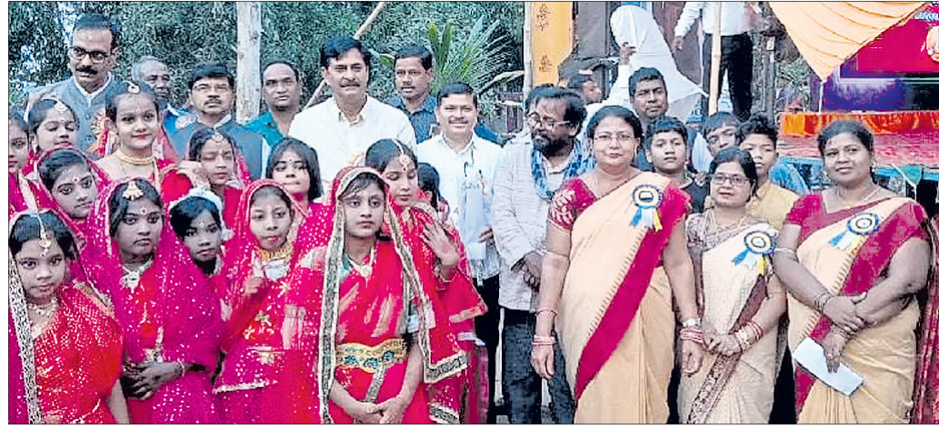
ଉତ୍ସବ ଅବସରରେ ଅତିଥିଙ୍କ ଗହଣରେ ପିଲା ଓ ଶିକ୍ଷୟିତ୍ରୀ ଓ ଶିକ୍ଷକମାନେ ।