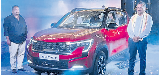
ଭୁବନେଶ୍ୱର, ୧୨।୧ (ଅଭୟ ବାଣ)

ସୋନେଟ୍‌ର ଫେସ୍‌ଲିଫ୍ଟ ମଡେଲର ପାରମ୍ପରାଗତ ତୃତ୍ୱି କିଆରେ ନୂଆ ଆନନ୍ଦଦାୟକ ହିଙ୍ଗଲିଫ୍ କମାଣ୍ଡ ଏବଂ ସରାଉଣ୍ଡ ଷ୍ଟୁମ୍ ମିରର ଭଳି ପ୍ୟୁରରିଷ୍ଟିକ୍ ଡିଜାଇନ୍ ଉପରେ ଆଧାରିତ ଏହି ନୂଆ ମଡେଲରେ ସାମିଲ କ୍ରମ ମୂଲ୍ୟର ଯଥାର୍ଥତା ପ୍ରତିପାଦନ କରୁଛି।