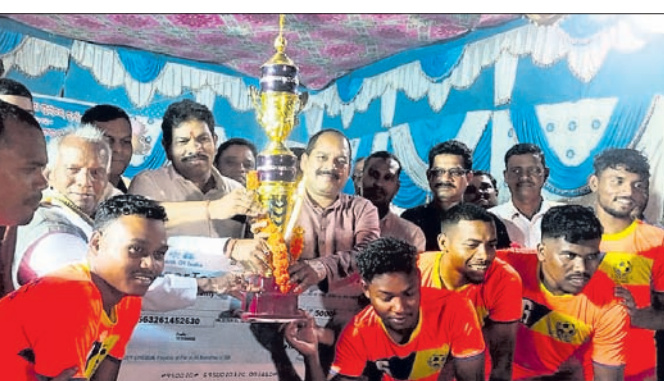
ଅତିଥିଙ୍କଠାରୁ ଖେଳାଳି ଟ୍ରଫି ଗ୍ରହଣ କରୁଛନ୍ତି।

ବୋଲଗଡ଼ ବ୍ଲକ୍ ଅନ୍ତର୍ଗତ ହାଟବର ପଞ୍ଚାୟତ ଉଚ୍ଚ ବିଦ୍ୟାଳୟ ଖେଳପତିଆରେ ମା' ଯୋଗମାୟା ପୁରୁବଲ ଆସୋସିଏଟସ ଆନୁକୂଲ୍ୟରେ ଚାଲିଥିବା କାଳିଆ ମହାପାତ୍ରଙ୍କ ପୁରୁବଲ ଟୁର୍ଣ୍ଣାମେଣ୍ଟରେ ଘାଟିକିଆର ବଜରଙ୍ଗୀ କ୍ଲବ ଚାମ୍ପିୟନ ହୋଇଛି। ଶୁକ୍ରବାର ଫାଇନାଲ ମ୍ୟାଚ୍ ଭୁବନେଶ୍ୱରର ଏମ୍.ଏସ୍.ପି. ପୁରୁବଲ ଟିମ୍ ଓ ଘାଟିକିଆର ବଜରଙ୍ଗୀ କ୍ଲବ ମଧ୍ୟରେ ହୋଇଥିଲା। ମ୍ୟାଚର ପ୍ରଥମାର୍ଦ୍ଧରେ ଏମ୍.ଏସ୍.ପି. ଟିମ୍ ଗୋଟିଏ ଗୋଲ ହୋଇଥିବା ବେଳେ ଦ୍ୱିତୀୟାର୍ଦ୍ଧରେ ବଜରଙ୍ଗୀ ଟିମ୍ ମଧ୍ୟ ଗୋଟିଏ ଗୋଲ ଦେଇଥିଲା। ତେବେ ନିର୍ଦ୍ଧାରିତ ସମୟ ମଧ୍ୟରେ ଭଲିବଲ ଟିମ୍ କେହି କହାରିନୁ ଆଉ ଗୋଲ ଦେଇପାରି ନ ଥିଲା। ଫଳରେ ଗାଳତ୍ରେକରରେ ୫-୪ ଗୋଲରେ