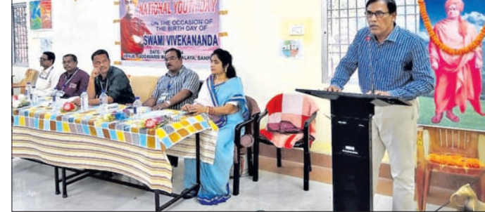
କାର୍ଯ୍ୟକ୍ରମରେ ଉପସ୍ଥିତ ଅତିଥି ଏବଂ ଅନ୍ୟମାନେ।

ନିରାକାରପୁର/ ଗମ୍ଭାରୀପୁଣ୍ଡା, ୧୨।୧ (ମାନସ ଚନ୍ଦ୍ର ପଟ୍ଟନାୟକ/ ବିକାସ ସାଲ୍)