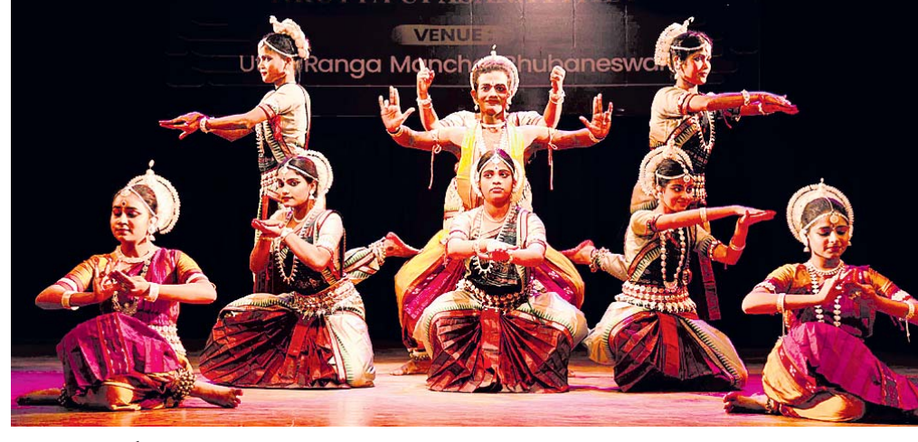
'ଭିନ୍ନ ପ୍ରୟାସ' କାର୍ଯ୍ୟକ୍ରମରେ ଶିଳ୍ପୀମାନେ ନୃତ୍ୟ ପରିବେଷଣ କରୁଛନ୍ତି।

ନୃତ୍ୟ ଉପାସନା ପାଠ ପକ୍ଷରୁ ଶୁକ୍ରବାର ଭଞ୍ଜକଳା ମଣ୍ଡପାଠରେ ଦିବ୍ୟାଙ୍ଗଙ୍କ ପାଇଁ 'ଭିନ୍ନ ପ୍ରୟାସ' କାର୍ଯ୍ୟକ୍ରମ ଅନୁଷ୍ଠିତ ହୋଇଯାଇଛି।