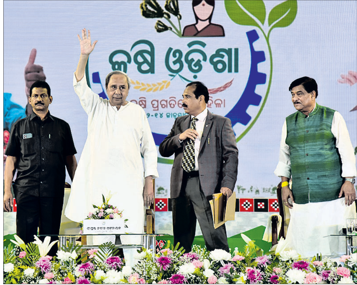
ଭୁବନେଶ୍ୱର ଜନତା ମଇଦାନଠାରେ ଶୁକ୍ରବାର 'କୃଷି ଓଡ଼ିଶା-୨୦୨୪'କୁ ଉଦଘାଟନ କରି ମୁଖ୍ୟମନ୍ତ୍ରୀ ନବୀନ ପଟ୍ଟନାୟକ ଉପସ୍ଥିତ କୃଷକ, କୃଷି ଉଦ୍ୟୋଗୀ, କୃଷି ବିଜ୍ଞାନୀ ଓ ବିଶେଷଜ୍ଞଙ୍କୁ ଶୁଭେଚ୍ଛା ଜଣାଉଛନ୍ତି।