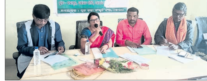
କାର୍ଯ୍ୟକ୍ରମରେ ଉପସ୍ଥିତ ଅଧିକାରୀ ଏବଂ ଅନ୍ୟମାନେ।