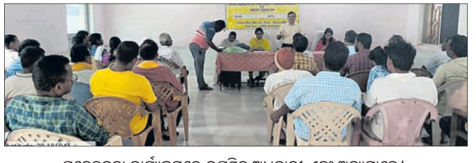
ସଚେତନତା କାର୍ଯ୍ୟକ୍ରମରେ ଉପସ୍ଥିତ ଅଧିକାରୀ ଏବଂ ଅନ୍ୟମାନେ।

ଜମିରେ ପ୍ରତ୍ୟେକ ପଦ୍ମଳ କରିବା ପୂର୍ବରୁ ମୃତ୍ତିକା ପରୀକ୍ଷା କରିବା ଏବଂ ଏହାର ଆବଶ୍ୟକ କାର୍ତ୍ତବ୍ୟ, ଚୈତିକ ସାର ପ୍ରୟୋଗର ସ୍ୱଳ୍ପତ୍ୱର ଅଧିକ ଅନୁକରଣ କରିପାରିବେ। ସରକାରଙ୍କ ବିଭିନ୍ନ କୃଷି ଯୋଜନା ଉପରେ ଆଲୋଚନା କରାଯାଇଥିଲା। ଏହି ଅବସରରେ ଖୋର୍ଦ୍ଧା ମୁକ୍ତପ୍ରସାଦର ଚାଷୀ ଦୁଃଖୀସହ।