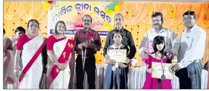
ବାଲିଅନ୍ତା, ୧୨।୧ (ନୀଳମାଧବ ସାହୁ) - ନନ୍ଦକରଖଣ୍ଡିତ ସରସ୍ୱତୀ ଶିକ୍ଷାନିକେତନ ୧୯ତମ ବାର୍ଷିକ କ୍ରୀଡ଼ା ପ୍ରତିଯୋଗିତା ଶୁକ୍ରବାର ଉଦ୍ଘାଟିତ ହୋଇଯାଇଛି।