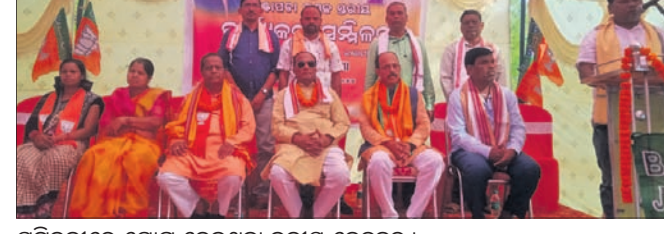
ସମ୍ମିଳନୀରେ ଯୋଗ ଦେଇଥିବା ଦଳୀୟ ନେତୃବୃନ୍ଦ।