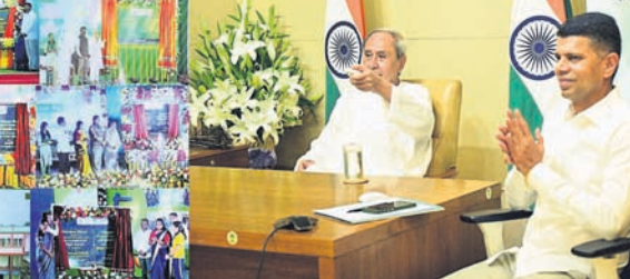
ଆରମ୍ଭ କରି ହେଉଛି, ପର୍ଯ୍ୟନ୍ତ ସୁପରି ପର୍ଯ୍ୟାୟରେ ବିକାଶରେ ପ୍ରମୁଖ୍ୟମନ୍ତ୍ରୀ ନବୀନ ପଟ୍ଟନାୟକ ଶନିବାର ମାଲକାନଗିରି, ବାଲେଶ୍ୱର, ଗଜପତି, ଡେଢ଼ାଲକ, କେନ୍ଦୁଝର ଓ କଟକ ଆଦି ୬ଟି ଜିଲ୍ଲାରେ ୧୨୬ଟି ରୂପାନ୍ତରଣ ସ୍କୁଲକୁ ଲୋକାର୍ପିତ କରିଛନ୍ତି।