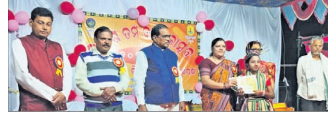
କୃତୀ ପ୍ରତିଯୋଗୀଙ୍କୁ ପୁରସ୍କାର ପ୍ରଦାନ କରାଯାଇଛି।