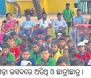
କ୍ରୀଡ଼ା ଉତ୍ସବରେ ଅତିଥି ଓ ଛାତ୍ରାଛାତ୍ରୀ।

ବୌଦ୍ଧ ଜିଲ୍ଲା ହରଭଙ୍ଗା ବ୍ଲକ୍ ବଡ଼ବାଗବର ପ୍ରାଥମିକ ବିଦ୍ୟାଳୟର ବାର୍ଷିକ କ୍ରୀଡ଼ା ଉତ୍ସବ ଶନିବାର ଦିନ ଉଦ୍‌ଘାଟିତ ହୋଇଛି।