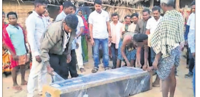
ଓଡ଼ିଶା ମୋ ପରିବାରର ସହଯୋଗରେ ମୃତଦେହ ଆଣିବାରେ ସହଯୋଗ କରୁଛନ୍ତି।