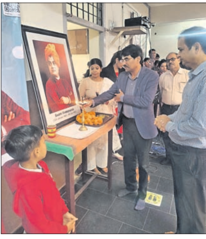
ଗୋବିନ୍ଦପାଲି ସ୍କୁଲରେ ଅତିଥିକ ଗହଣରେ କୁଟା ଛାତ୍ରାଛାତ୍ରୀ । ବିକାଶରେ ସାମାଜିକ ବିବେଚନା ପ୍ରତିଛବିରେ ଶ୍ରଦ୍ଧାପୂର୍ଣ୍ଣ ଅର୍ପଣ କରାଯାଇଛି ।