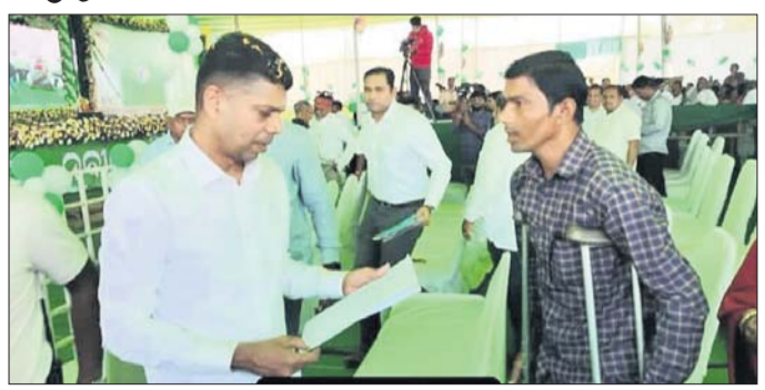
କଣେ ଭିନକ୍ଷମକଠାଉ ଅଭିଯୋଗ ଗ୍ରହଣ କରୁଛନ୍ତି ୫-ଟି ଅଧ୍ୟକ୍ଷ।

କୃତିକ୍ଷା, ୧୩୧ (ବିରଞ୍ଚ ଦଳ) ମୁଖ୍ୟମନ୍ତ୍ରୀ ଆଦିବାସୀ ଅଧିକାର ଅଞ୍ଚଳ ହୋଇଥିବାରୁ ଆଦିବାସୀଙ୍କ ସ୍ୱାର୍ଥ ପାଇଁ ସରକାର କିଛି କରିନାହାନ୍ତି। ଲହରୀ, ଖର୍ଲା, ଲକ୍ଷ୍ମୀଦେବୀ, ଶଙ୍ଖାଭାଗୁଣୀ ଆଦି ନବୀନ ମେଡ଼ା ଜଳସେଚନ ପ୍ରକଳ୍ପ ପାଇଁ ମୁଖ୍ୟମନ୍ତ୍ରୀ ଦେଇଥିବା ପ୍ରତିଶ୍ରୁତି କୁଆଡ଼େ ଗଲା ବୋଲି ପ୍ରଶ୍ନ କରିଛନ୍ତି। ଏହାଛଡ଼ା ୨୦୧୪ରେ ବିଜେଡିର ନିର୍ବାଚନ ଲଢ଼ାଉରେ ଥିବା ୩୫୦ଟି ଜମିକୁ ଜଳସେଚନ ବ୍ୟବସ୍ଥାକୁ କାର୍ଯ୍ୟକାରୀ କରିବାକୁ ନାହାନ୍ତି ବୋଲି ନାଏକ କହିଛନ୍ତି। କୃତିକ୍ଷାକୁ ସଂଯୋଗ କରୁଥିବା ଖୁଲ୍ଲାନ ପୋଲ ଦୀର୍ଘ ଦିନ ହେବ ଭାଙ୍ଗି ଯାଇଥିଲେ ମଧ୍ୟ ବିଜେଡି ସରକାର ଏ ପର୍ଯ୍ୟନ୍ତ ମରାମତି କରିପାରି ନ ଥିବାରୁ ଯୋଜନା ନାମରେ କେବଳ କଲେଜ ଛାତ୍ରଛାତ୍ରୀଙ୍କୁ ପଥଚ୍ୟୁତ କରୁଥିବା କହି ସମାଲୋଚନା କରିଛନ୍ତି। ଏହି ସମ୍ମିଳନୀରେ ସମ୍ବଲପୁର ଭାଜପା ସାଧାରଣ ସମ୍ମାନ ଶୁଣି କର ଉପସ୍ଥିତ ଥିଲେ।