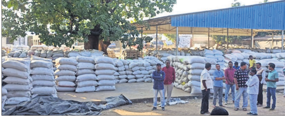
ରାଜବୋଡାସମ୍ବଲପୁର କୃଷକ ସଙ୍ଘଠନ ସଦସ୍ୟମାନେ ଧାନମଣ୍ଡି ପରିଦର୍ଶନ କରୁଛନ୍ତି।