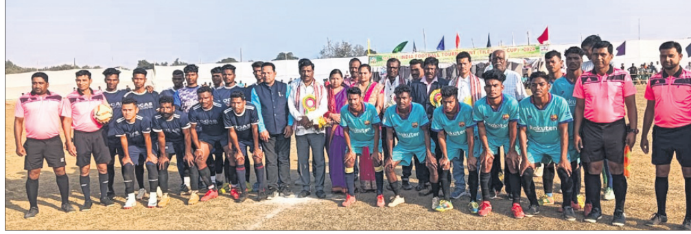
ଖେଳର ଅତିଥି ଓ ଖେଳାଳି।

ବୌଦ୍ଧ ଜିଲ୍ଲା ହରଭଙ୍ଗା ବ୍ଲକ୍ ଉତ୍କଳମ ପାଣିଆ ଉପପଞ୍ଚାୟତରେ ପ୍ରେକ୍ଷ୍ୟ ଆସୋସିଏସନ ଉତ୍କଳମ ପାଣିଆ ଉପପଞ୍ଚାୟତର ଶନିବାର ଦିନ ଗ୍ରୀଷମ ଅନୁଷ୍ଠିତ ହୋଇଛି।