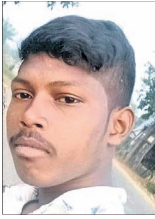
ମୃତ ଅଧ୍ୟୁତ ନାଏକ(ଫାଇଲ ଫଟୋ) ଅମରପାଲି, ୧୩୧(ପାଠାୟନ ସାହୁ)

ସୁବର୍ଣ୍ଣପୁର ଜିଲ୍ଲା ବୀରମହାରାଜପୁର ବ୍ଲକ୍ ଖଣ୍ଡହତା ପଞ୍ଚାୟତର ବଡ଼ବର୍ତ୍ତକଟା ମାହେଶ୍ୱରୀ ଦେବୀଙ୍କ ନବକଳେବର ଉତ୍ସବ ଅନୁଷ୍ଠିତ ହୋଇଯାଇଛି।