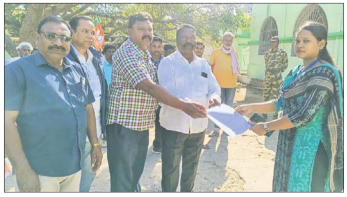
ରାଜ୍ୟପାଳଙ୍କ ଉଦ୍ଦେଶ୍ୟରେ ବାବିପତ୍ର ଦିଆଯାଇଛି।

କୃତିକ୍ଷା, ୧୩୧ (ବିରଞ୍ଚ ଦଳ) ଭାଜପା କୃଷକ ମୋର୍ଚ୍ଚା ପକ୍ଷରୁ ଧାନର ଅଭାବୀ ବିକ୍ରି ଓ ମଣ୍ଡି ଅବ୍ୟବସ୍ଥା ନେଇ ଶନିବାର ରାଜ୍ୟପାଳଙ୍କ ଉଦ୍ଦେଶ୍ୟରେ କୃତିକ୍ଷା ଉପକଳାପାଳଙ୍କୁ ଏକ ବାବିପତ୍ର ପ୍ରଦାନ କରିଯାଇଛି। ଏଥିରେ ୯୮ଭାଗ ସଭାପତି ରୂପେ ଧାନ, ମିଳଭାବ ନିୟନ୍ତ୍ରଣରେ ମଣ୍ଡି ପରିଚାଳିତ ହେବା, ଅଧିକା କର୍ମୀ ଛବନୀ ହେଉଥିବା ଦର୍ଶାଯାଇଛି। ଗଣ୍ୟ ମାନଙ୍କୁ ଶୋଷଣର ଶିକାର ହେଉଥିବାରୁ ଏହାର ସିଧିଆଳ ତଦନ୍ତ ପାଇଁ ବାବିପତ୍ରରେ