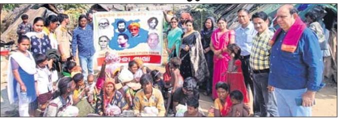
ମହିଳା ଶାଖା ପକ୍ଷରୁ ସେବା କାର୍ଯ୍ୟ କରାଯାଇଛି ।

ଦେଢ଼ାମାଲ, ୧୩।୧ (ରବିବାର ନାୟାର) ଦେଢ଼ାମାଲ ସଚେତନ ନାଗରିକ ଫୋରମ ମହିଳା ଶାଖା ପକ୍ଷରୁ ଶନିବାର ସହରସ୍ଥିତ ଷ୍ଟେଶନରୋଡ଼ ଶାଫଟି ବସ୍ତିରେ ସେବାକାର୍ଯ୍ୟରେ ଶୁଭିଳା ଖାଦ୍ୟ ବନ୍ଧନ କରାଯାଇଛି । ମହିଳା ଶାଖା ସଭାପତି