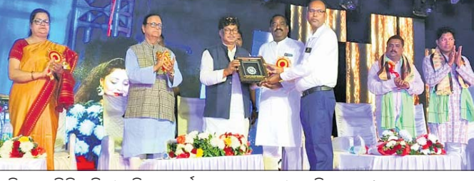
ପୁଅନିମ୍ନ ଛୁଟିଲିର ଦ୍ୱିତୀୟ ଦିବସ କାର୍ଯ୍ୟକ୍ରମରେ ମଞ୍ଚାସୀନ ଅତିଥିମାନେ।