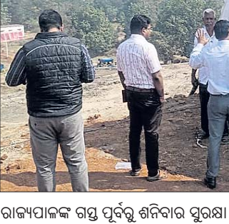
ରାଜ୍ୟପାଳଙ୍କ ଗନ୍ତୁ ପୂର୍ବରୁ ଶନିବାର ପୁରୁଣା ବ୍ୟବସ୍ଥା ଯାଞ୍ଚ କରାଯାଇଛି।

ଆଠମାଲିକ ରୁକ୍ଷ ଆୟତ୍ତରମୁଣ୍ଡାଠାରେ କଂଗ୍ରେସ ଠାକୁରଙ୍କ ମନ୍ଦିରର ପ୍ରତିଷ୍ଠା ଉତ୍ସବ ଓ ନବନିର୍ମିତ ଦାଣ୍ଡ ବିଗ୍ରହଙ୍କ ଆୟତ୍ତର ବିଜେ କାର୍ଯ୍ୟକ୍ରମ ରବିବାର ଅନୁଷ୍ଠିତ ହେବ। ଏ ନେଇ ଗୋଖଣ୍ଡୀନା ପରିଷଦ (ଆଠମାଲିକ) ପକ୍ଷରୁ ବ୍ୟାପକ ପ୍ରସ୍ତୁତି ରାଜିଛି। ଏହି କାର୍ଯ୍ୟକ୍ରମରେ ମୁଖ୍ୟ ଅତିଥି ଭାବେ ରାଜ୍ୟପାଳ ରଘୁବର ଦାସ, କେନ୍ଦ୍ର ଶିକ୍ଷାମନ୍ତ୍ରୀ ଧର୍ମେନ୍ଦ୍ର ପ୍ରଧାନ ଯୋଗଦେବାର