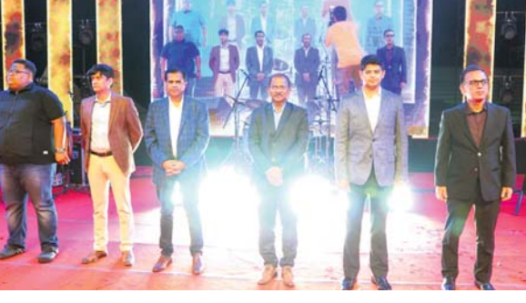
ଅନୁଗୋଳ ଜିଲ୍ଲା ମହୋତ୍ସବର ଦ୍ୱିତୀୟ ସନ୍ଧ୍ୟାରେ ସାଂସ୍କୃତିକ କାର୍ଯ୍ୟକ୍ରମ ପରିବେଷଣ କରାଯାଇଛି।