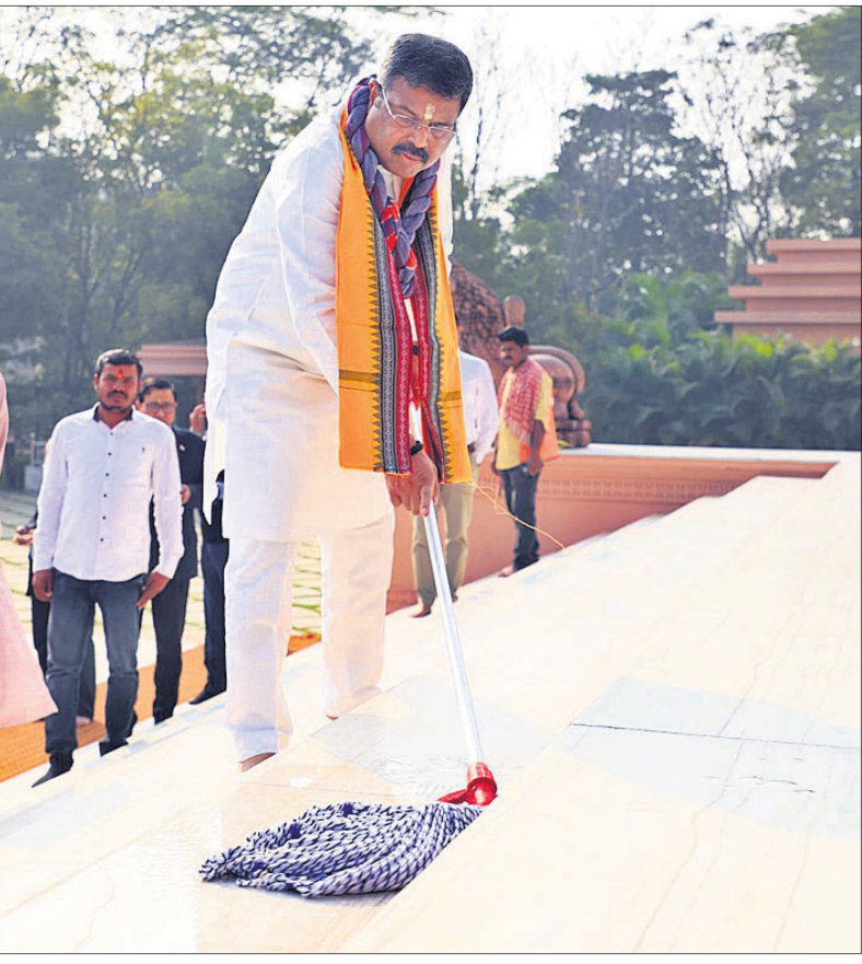
ଜିଲ୍ଲାନଗରସ୍ଥିତ ଶ୍ରୀଜଗନ୍ନାଥ ମନ୍ଦିରରେ ସଫେଇ କାର୍ଯ୍ୟ କରୁଛନ୍ତି କେନ୍ଦ୍ରମନ୍ତ୍ରୀ ଧର୍ମେନ୍ଦ୍ର ପ୍ରଧାନ ।