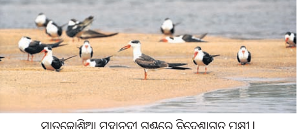
ସାତକୋଶିଆ ମହାନଦୀ ଗଣ୍ଡରେ ବିଦେଶୀଗତ ପକ୍ଷୀ ।