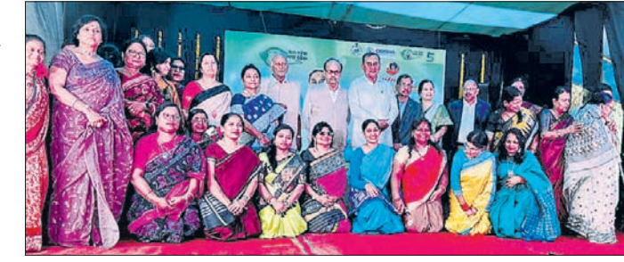
ସତ୍ୟବାଇ ମହିଳା ମହାବିଦ୍ୟାଳୟରେ ଆୟୋଜିତ କାର୍ଯ୍ୟକ୍ରମରେ ଉପସ୍ଥିତ ଅତିଥି ଏବଂ ଅନ୍ୟମାନେ ।

ଏହି ଅଭିନବ ପ୍ରୟୋଗ ମାଧ୍ୟମରେ ପ୍ରତ୍ୟେକ ଛାତ୍ରଛାତ୍ରୀ ନିଜ ଦକ୍ଷତା ଓ ପ୍ରତିଭା ପ୍ରଦର୍ଶନ କରି ଏକ ସ୍ୱତନ୍ତ୍ର ପରିଚୟ ସୃଷ୍ଟି କରିପାରିବେ । ଏହା ବିଦ୍ୟାର୍ଥୀଙ୍କ ଅନ୍ତର୍ନିହିତ ପ୍ରତିଭାକୁ ସମଗ୍ର କରୁଛି ବୋଲି ସେ କହିଥିଲେ ।