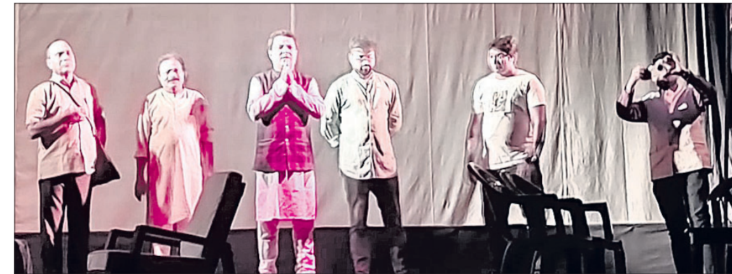
ଲୋକ ନାଟକ ପ୍ରତିଯୋଗିତାରେ ପୁରସ୍କୃତ ନାଟକ ‘ପଶାପାଲି’ର ଏକ ଦୃଶ୍ୟ ।

ଯାଏ ଚାଲିଥିଲା । ଏଥିରେ ଓଡ଼ିଶାର ବିଭିନ୍ନ ସ୍ଥାନରୁ ୬୦ଟି ନାଟ୍ୟଦଳ ଅଂଶ ଗ୍ରହଣ କରିଥିଲେ । ଗଣତନ୍ତ୍ର ବନାମ ପଞ୍ଚାୟତ ନିର୍ବାଚନ ଉପରେ ପର୍ଯ୍ୟବସିତ ‘ପଶାପାଲି’ ନାଟକଟି ଦର୍ଶକଙ୍କୁ ବେଶ୍ ମହାନ୍ତି ଥିଲେ । ଏହି ଲୋକ ନାଟକ ମହୋତ୍ସବ ଜାନୁଆରୀ ୪ରୁ ୧୦ ତାରିଖ ପର୍ଯ୍ୟନ୍ତ ଚାଲିଥିଲା ।