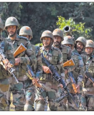
ଅପରେଶନ 'ସର୍ବଶକ୍ତି' ଆରମ୍ଭ କଲା ସେନା

ଜମ୍ମୁ-କଶ୍ମୀରରେ ଆତଙ୍କବାଦୀ କାର୍ଯ୍ୟକ୍ରମ ବଢ଼ାଇବା ପାଇଁ ପାକିସ୍ତାନ ଉଦ୍ୟମ ଚଳାଇଥିବାବେଳେ ଏହାକୁ ରୋକିବା ଲାଗି ଭାରତୀୟ ସେନା ଅପରେଶନ 'ସର୍ବଶକ୍ତି' ଆରମ୍ଭ କରିଛି। ଏହି ଅଭିଯାନରେ ସେନା ପିର୍ ପଞ୍ଜଳ ପର୍ବତମାଳାର ଉଭୟ ପାର୍ଶ୍ୱରେ ରହିଥିବା ଆତଙ୍କବାଦୀଙ୍କୁ ଚାର୍ଜେଜ୍ କରିବା ପାଇଁ ପାକିସ୍ତାନୀ ପ୍ରକ୍ତି ଆତଙ୍କବାଦୀ ଗୋଷ୍ଠୀ ପିର୍ ପଞ୍ଜଳର ଦକ୍ଷିଣ ପାର୍ଶ୍ୱ ବିଶେଷ କରି ରାଜୌରୀ ପୁଞ୍ଜ ସେକ୍ଟରରେ ଆତଙ୍କବାଦ ବଢ଼ାଇବାକୁ ଉଦ୍ୟମ କରୁଛି। ଗତ କିଛି ମାସ ମଧ୍ୟରେ ଉକ୍ତ ଅଞ୍ଚଳରେ ଆତଙ୍କବାଦୀଙ୍କ ଆକ୍ରମଣରେ ପ୍ରାୟ ୨୦ ଜଣ ଯବାନଙ୍କ ଜୀବନ ଗଲାଣି। ଗତ ମାସ ୨୧ରେ ତେରା କି ଗଲି ଅଞ୍ଚଳରେ ଆତଙ୍କବାଦୀ