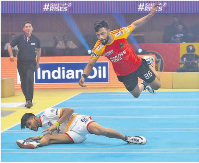
ଓଡ଼ିଶା ଜଗରନଟ୍ ଓ ଚେଲ୍ସି ଯୋଦ୍ଧାଙ୍କ ମଧ୍ୟରେ ଅନୁଷ୍ଠିତ ମ୍ୟାଚ ।