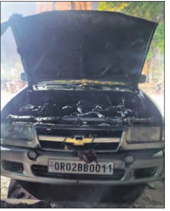
ପୁରୁଣା ଭୁବନେଶ୍ୱର, ୧୩୧୧: (ସୁବାସ ଚନ୍ଦ୍ର ପ୍ରଧାନ): ଶ୍ରୀଲଙ୍କାରାଜ ମନ୍ଦିର ପୂର୍ବ-ଦକ୍ଷିଣ କୋଣ ପାର୍ଶ୍ୱଭାଗରେ ଶନିବାର ଅପରାହ୍ନରେ ଏକ କାର୍ (ଓଆର୍୧୦୨ବିଏ ୦୦୧୧)ରେ ହଠାତ୍ ନିଆଁ ଲାଗିଯାଇଥିଲା ।

ଫଳରେ ସେଠାରେ ଥିବା ପର୍ଯ୍ୟଟକ ଓ ଉପସ୍ଥିତ ଲୋକେ ଭୟଭୀତ ହୋଇପଡ଼ିଥିଲେ । ଅଗ୍ନିଶମ କର୍ମୀଦ୍ୱାରା ପହଞ୍ଚିବା ପୂର୍ବରୁ ଗ୍ଲାନାୟ ଲୋକଙ୍କ ଦ୍ୱାରା ନିଆଁକୁ ଆୟତ୍ତ କରାଯାଇଥିଲା । ସୂଚନା ମୁତାବକ, କେତେକଜଣ ପର୍ଯ୍ୟଟକ ଉକ୍ତ କାରରେ ଲିଙ୍ଗରାଜ ମନ୍ଦିରକୁ ଆସିଥିଲେ ।