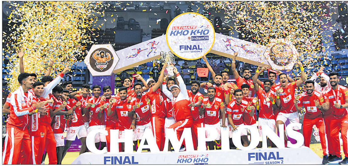
ତୃପ୍ତି ସହ ଚାମ୍ପିୟନ ଗୁଜରାଟ ଜାଏଣ୍ଟ୍ସ ।