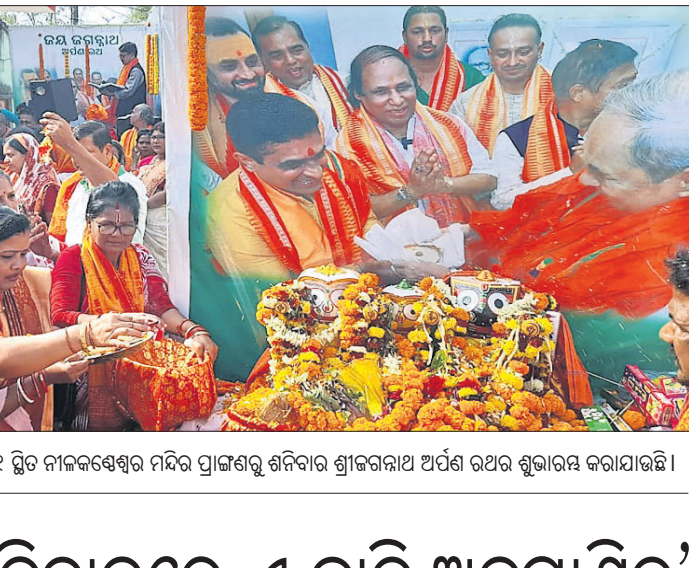
ଭରତ ନିର୍ବାଚନ ମଣ୍ଡଳୀ ଅନ୍ତର୍ଗତ ଖର୍ଚ୍ଚ ନଂ-୧୧ ସ୍ଥିତ ନାଳକଣ୍ଠେଶ୍ୱର ମନ୍ଦିର ପ୍ରାଙ୍ଗଣରୁ ଶନିବାର ଶ୍ରୀଜଗନ୍ନାଥ ଅର୍ପଣ ରଥର ଶୁଭାରମ୍ଭ କରାଯାଇଛି ।

ଫଳରେ ସେଠାରେ ଥିବା ପର୍ଯ୍ୟଟକ ଓ ଉପସ୍ଥିତ ଲୋକେ ଭୟଭୀତ ହୋଇପଡ଼ିଥିଲେ । ଅଗ୍ନିଶମ କର୍ମୀଦ୍ୱାରା ପହଞ୍ଚିବା ପୂର୍ବରୁ ଗ୍ଲାନାୟ ଲୋକଙ୍କ ଦ୍ୱାରା ନିଆଁକୁ ଆୟତ୍ତ କରାଯାଇଥିଲା । ସୂଚନା ମୁତାବକ, କେତେକଜଣ ପର୍ଯ୍ୟଟକ ଉକ୍ତ କାରରେ ଲିଙ୍ଗରାଜ ମନ୍ଦିରକୁ ଆସିଥିଲେ ।