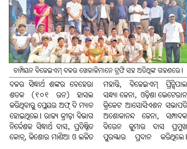
ରାଜ୍ୟ ସ୍କୁଲ କ୍ରିକେଟ ଟୁର୍ନାମେଣ୍ଟରେ ବିଜେଇଏମ୍ ସ୍କୁଲ ଦଳର ପ୍ରତିଯୋଗୀମାନେ ଗ୍ରହଣ କରିଥିବା ଉପରାଜ୍ୟ ୩-୧ ଗୋଲରେ ହକି ଦଳକୁ ପରାସ୍ତ କରିଥିବା ଦଳର ସଭ୍ୟମାନଙ୍କ ସହିତ ଫୋଟୋ ଗ୍ରହଣ କରିଛନ୍ତି।

ଭୁବନେଶ୍ୱର, ୧୪।୧ (ତପନ ସାହୁ) ମୁନି-୨ ବାଲିକା ଉଚ୍ଚ ବିଦ୍ୟାଳୟ ପକ୍ଷରୁ ଆନ୍ଧ୍ର ସ୍କୁଲ କ୍ରିକେଟ ଟୁର୍ନାମେଣ୍ଟରେ ବିଜେଇଏମ୍ ସ୍କୁଲ ଦଳକୁ ପରାସ୍ତ କରିଛି।