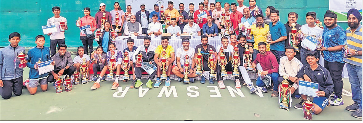
ଭୁବନେଶ୍ୱରରେ ଚାଲିଥିବା ରତ୍ନପୁରୀ ଆଦିତ୍ୟଙ୍କୁ ଚାଲଚଳ ଟୁର୍ନାମେଣ୍ଟରେ ଉପରାଜ୍ୟ ୩-୧ ଗୋଲରେ ହକି ଦଳକୁ ପରାସ୍ତ କରିଥିବା ଦଳର ସଭ୍ୟମାନଙ୍କ ସହିତ ଫୋଟୋ ଗ୍ରହଣ କରିଛନ୍ତି।

ଭୁବନେଶ୍ୱର, ୧୪।୧ (ତପନ ସାହୁ) ଓଡ଼ିଶା ଦଳ ଉପରାଜ୍ୟ ୩-୧ ଗୋଲରେ ହକି ଦଳକୁ ପରାସ୍ତ କରିଛି।