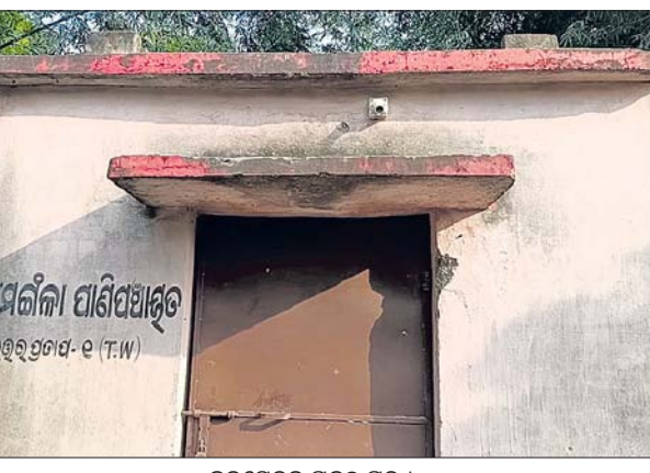
ଜଳସେଚନ ପ୍ରକଳ୍ପ ରୁ।

ହେଲୁଲ ଗାଈ ଜମିକୁ ଜଳସେଚିତ କରିବା ଲକ୍ଷ୍ୟ ନେଇ ଧର୍ମଶାଳା ଉଠାଇଲସେତନ ନିଗମ ଉପକ୍ଷେପ ପକ୍ଷରୁ ୨୦୧୯ରେ ପ୍ରାୟ ୨୫ ଲକ୍ଷ ଟଙ୍କା ବ୍ୟୟରେ ଉତ୍ତରପ୍ରାଚ୍ୟ ପ୍ରାନ୍ତରେ ବୋର୍ଡି ପଏଣ୍ଟ ନିର୍ମାଣ ହୋଇଛି। ଏଠାରେ ବୋର୍ଡି କରାଯିବା ସହିତ ଗୋଟର ଘର, ପାଣି ମୋଟର ସ୍ଥାପନ ଓ ବିଦ୍ୟୁତ୍ ଟ୍ରାନ୍ସଫର୍ମର ମଧ୍ୟ ବସାଯାଇଛି। ହେଲେ ଏହି ପ୍ରକଳ୍ପ କାର୍ଯ୍ୟକ୍ରମ ହୋଇଛି ନ ହୋଇ ରହିବାକୁ ବି କେହିନାହାନ୍ତି। ମୋଟର ଘର ତାଳା ଖୁଲୁଥିବାବେଳେ ବିଦ୍ୟୁତ୍ ଟ୍ରାନ୍ସଫର୍ମର ପଏଣ୍ଟରେ ଗଛଲତା ମାଡ଼ିଯାଇଛି। ତଳତବର୍ଷ ଆବଶ୍ୟକ ବର୍ଷା ଅଭାବରୁ ଧାନ ଓ ଚିନାବାଦାମ ଗାଈ ବାଧାପ୍ରାପ୍ତ ହୋଇଥିଲା। ଏହି ସମୟରେ ଉକ୍ତ ପ୍ରକଳ୍ପକୁ