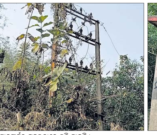
ଟ୍ରାନ୍ସଫର୍ମର ଗଛଲତାରେ ଲୁଚି ଯାଇଛି।

ଧର୍ମଶାଳା କୁଳ ଉତ୍ତରପ୍ରାଚ୍ୟ ପଞ୍ଚାୟତରେ ୫ ବର୍ଷ ହେଲା ନିର୍ମାଣ ହୋଇଥିବା ଉଠାଇଲସେତନ ପ୍ରକଳ୍ପ କାର୍ଯ୍ୟକ୍ରମ ଶେଷ ହୋଇପାରୁନାହିଁ। ବିଦ୍ୟୁତ୍ ବିଭାଗ ସଂଯୋଗ ଦେଇଥିବାବେଳେ ପ୍ରକଳ୍ପ ଅସଫଳ ଅବସ୍ଥାରେ ପଡ଼ିରହିଛି। ଅନ୍ୟପକ୍ଷରେ ନିରୀକ୍ଷିତ ଏବଂ ଗଛଲତାରେ ଲୁଚିଗଲାଣି। ପ୍ରକଳ୍ପ ନିର୍ମାଣ କରିବେ ଉଠାଇଲସେତନ ନିଗମର ଖୋଳ ଖବର ନାହିଁ। ଫଳରେ ସମସ୍ତଙ୍କୁ ଅଭାବରୁ ଶତାଧିକ ଗାଈ ବୁଣିଗଲାଣି। ସୂଚନା ଅନୁସାରେ, ଏହି ପଞ୍ଚାୟତରେ ଧାନ, ଚିନାବାଦାମ, ବିରି ଓ ପିପିରିବା ଗାଈ କରି ଅନେକ ଗାଈ ପରିବାର ପ୍ରତିପୋଷଣ କରିଆଣି। ଗାଈଜମିକୁ ଜଳସେଚିତ କରିବା ଲକ୍ଷ୍ୟରେ ସ୍ଥାନୀୟ ଶତାଧିକ ଗାଈକୁ ବେଳ ପାଳି ପଞ୍ଚାୟତ ଗଠନ କରାଯାଇଛି। ୩୦ରୁ ୪୦ଜଣ ଗାଈକୁ ନେଇ ଗୋଟିଏ ଗୋଟିଏ ପାଣି ପଞ୍ଚାୟତ କରାଯାଇଛି। ମା' ମଙ୍ଗଳା, ମହାଲକ୍ଷ୍ମୀ ଓ ବାଲୁକେଶ୍ୱର ନାମରେ ତିନୋଟି ପାଣି ପଞ୍ଚାୟତ ରହିଛି। ପାଖାପାଖି ୧୦୦