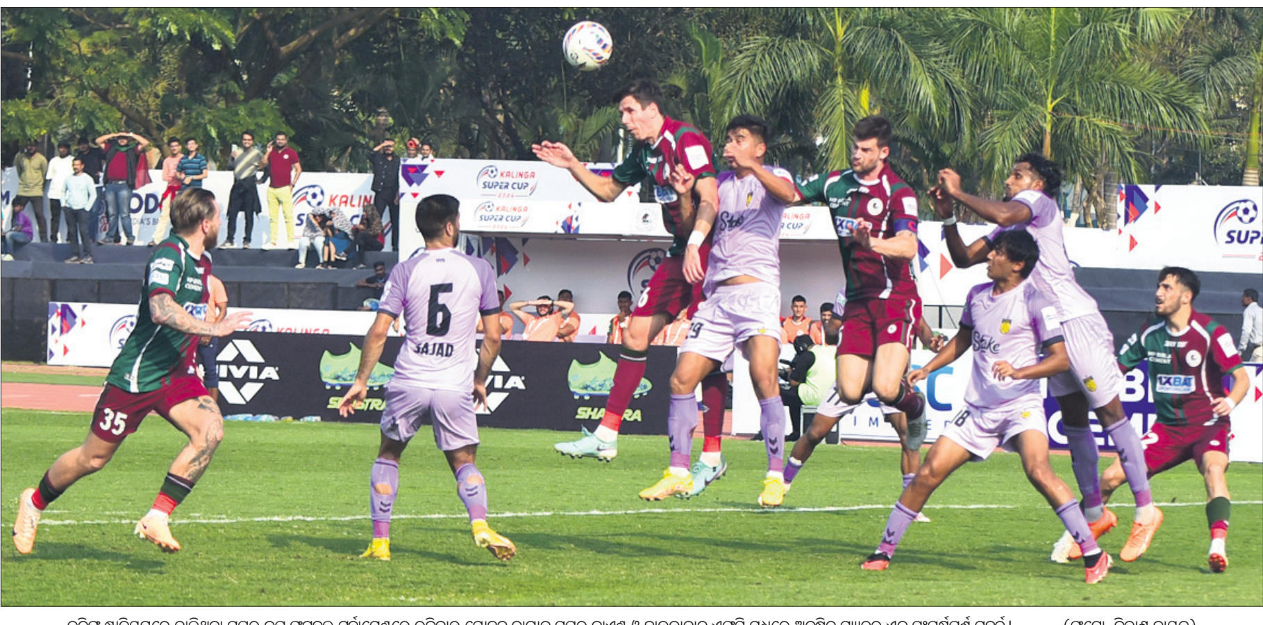
କଳିଙ୍ଗ ଷ୍ଟାଡ଼ିୟମରେ ଚାଲିଥିବା ସୁପର କପ୍ ଟୁର୍ନାମେଣ୍ଟରେ ଭାରତୀୟ ମହିଳା ଦଳର ଉପରାଜ୍ୟ ୩-୧ ଗୋଲରେ ହକି ଦଳକୁ ପରାସ୍ତ କରିଛି।

ରାଷ୍ଟ୍ର, ୧୪।୧ (ପି.ଟି.) ଏପ୍ରିଲ୍‌ଆଇଏମ୍ ମହିଳା ଅଲିମ୍ପିକ୍ କ୍ୱାଲିଫାୟର ଟୁର୍ନାମେଣ୍ଟର ପୂର୍ବ 'ବି'ରେ ଭାରତ ଉପରାଜ୍ୟ ୩-୧ ଗୋଲରେ ହକି ଦଳକୁ ପରାସ୍ତ କରିଛି।