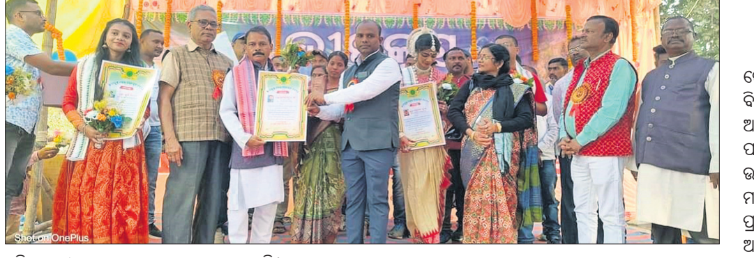
ପ୍ରତିଭାଧାରୀଙ୍କୁ ମହୋତ୍ସବରେ ପୁରସ୍କୃତ କରାଯାଇଛି।

‘ପାଣିପାଗ ପୂର୍ବାନୁମାନ କ୍ଷେତ୍ରରେ ବୈପ୍ଳବିକ ପରିବର୍ତ୍ତନ ଆସିଛି’