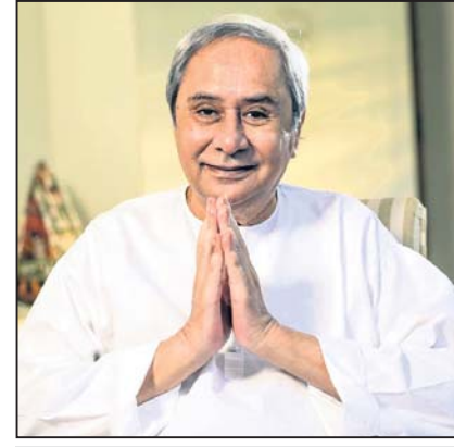
ନବୀନ ପଟ୍ଟନାୟକ, ମୁଖ୍ୟମନ୍ତ୍ରୀ