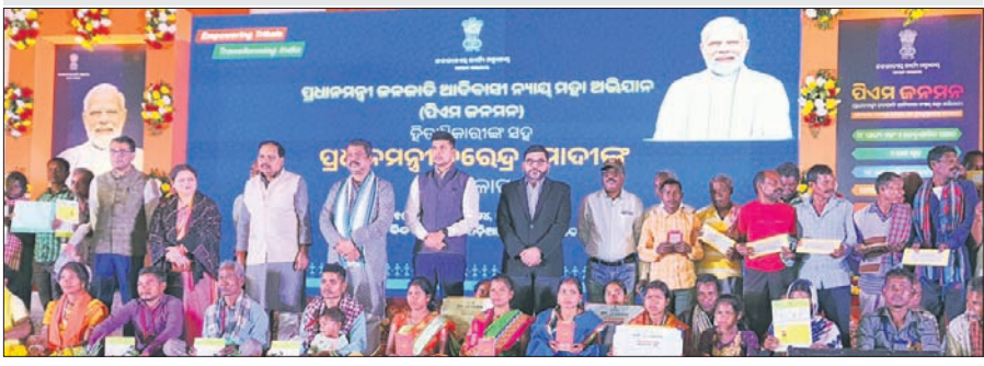
କାର୍ଯ୍ୟକ୍ରମରେ କେନ୍ଦ୍ରମନ୍ତ୍ରୀ ଧର୍ମେନ୍ଦ୍ର ପ୍ରଧାନଙ୍କ ସହ ଅତିଥି ଓ ଗ୍ରାମବାସୀ।

ବିଏସ୍ ଜନଜାତି ନ୍ୟାୟ ଯୋଜନାରେ କାର୍ଯ୍ୟକ୍ରମରେ କେନ୍ଦ୍ରମନ୍ତ୍ରୀ