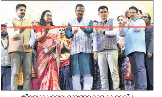
ଅତିଥିମାନେ ଧନୁଯାତ୍ରା ମହୋତ୍ସବକୁ ଉଦ୍‌ଘାଟନ କରୁଛନ୍ତି।