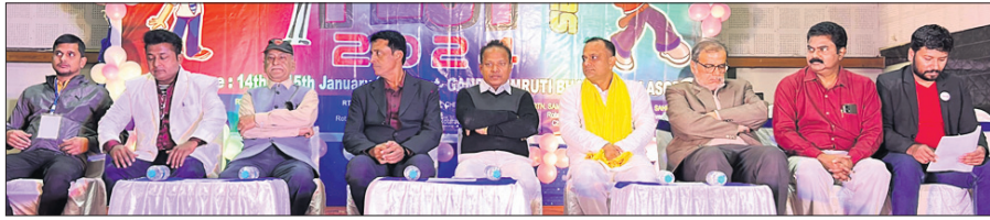
କାର୍ଯ୍ୟକ୍ରମରେ ମଞ୍ଚାଧୀନ ଅତିଥିଗଣ ।