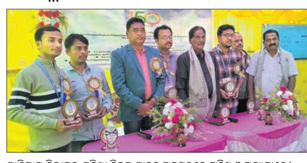
ପାଣିପାଗ ବିଭାଗର ପ୍ରତିଷ୍ଠା ଦିବସ ପାଳନ ଅବସରରେ ଅତିଥି ଓ ଅନ୍ୟମାନେ।