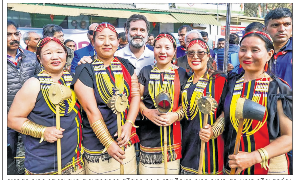
କଂଗ୍ରେସର ଭାରତ ଯାତ୍ରା ଅବସରରେ ମଣିଷ୍ଟର ଇମାମ୍ ଶେଖ୍ ବିଲାରେ ରାଜ୍ୟ ଗାୟକ ସହ ଘୁମାଣ୍ୟ ମହିଳା ସମୂହ ସମାବେଶ।

ପୁ-ଫିଙ୍ଗର ଚେଷ୍ଟାକୁ ନେଇ ଡାକ୍ତରଙ୍କୁ ହାଇକୋର୍ଟଙ୍କ ଉର୍ଦ୍ଦା କରାଯାଇଛି।