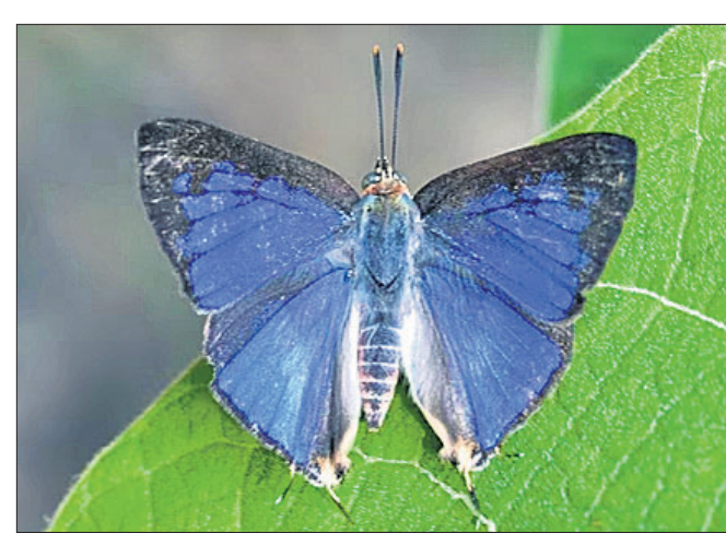
ପଶ୍ଚିମଘାଟରେ ଦୁର୍ଲଭ ନୀଳ ରଙ୍ଗର ପ୍ରଜାପତି।