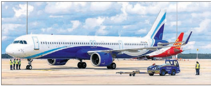
୨୫ମ ଦିନ, ୧୫:୧୫

ଏୟାରଲାଇନ୍ସ କମ୍ପାନୀର ବିମାନ ବାତିଲ ହେବା ପରେ ଯାତ୍ରୀମାନଙ୍କୁ ଅନୁପାଳନ କରିବାକୁ ଅନୁରୋଧ କରାଯାଇଛି।