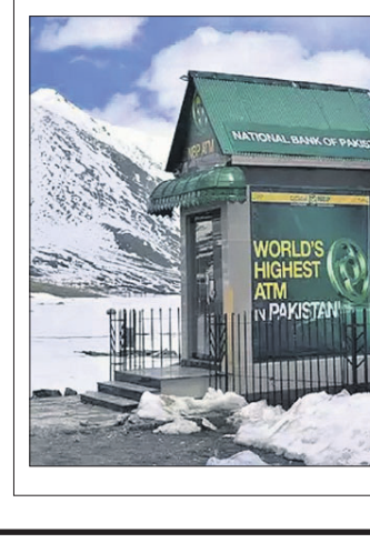
ପଶ୍ଚିମଘାଟରେ ଦୁର୍ଲଭ ନୀଳ ରଙ୍ଗର ପ୍ରଜାପତି।