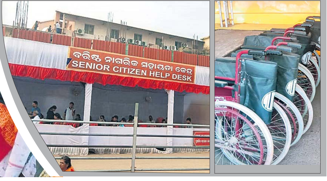
ବରିଷ୍ଠ ନାଗରିକ ସହାୟତା କେନ୍ଦ୍ର SENIOR CITIZEN HELP DESK