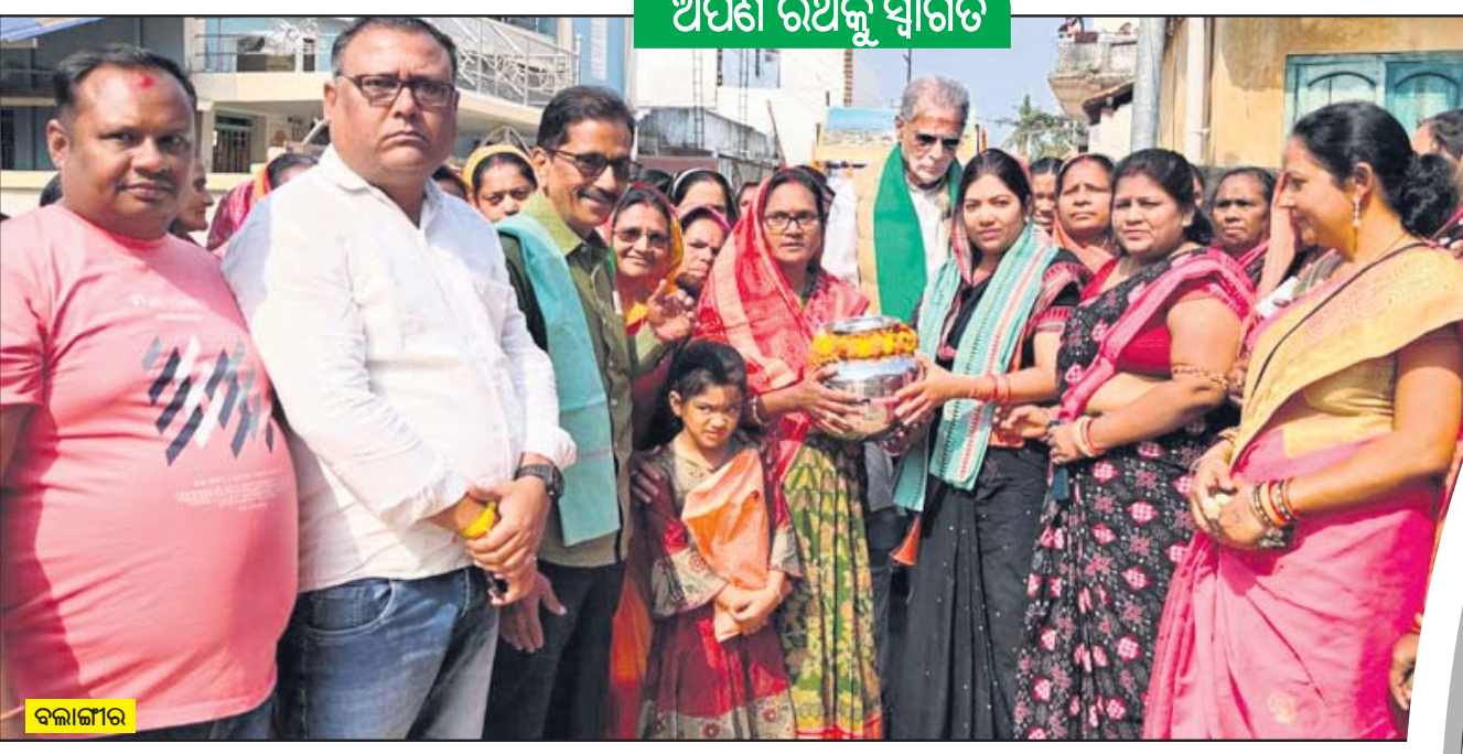
ଅର୍ପଣ ରଥକୁ ସ୍ୱାଗତ