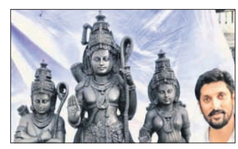
ନୂଆ ଦି.ଏସ୍. ଯେ.ପ୍ର.ସା. ପୂର୍ବରୁ ପୁରୀରୁ ପୁରୀ ଯାତ୍ରା ପାଇଁ ପ୍ରସ୍ତୁତ ହେଉଥିବା ଯୋଗୀରାଜଙ୍କ ନିର୍ମିତ ମୂର୍ତ୍ତି।

ରାମମନ୍ଦିରରେ ଛାପନ ହେବ ଯୋଗୀରାଜଙ୍କ ନିର୍ମିତ ମୂର୍ତ୍ତି।