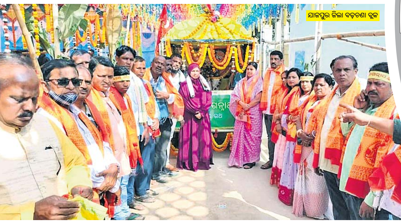
ଯାକପୁର ଜିଲା ବଡ଼ଚଣା ବୁକ