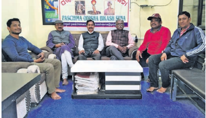
କାର୍ଯ୍ୟକ୍ରମରେ ମଞ୍ଚାଧୀନ ଅତିଥି।

ଦିଆଗଲା। ମାତ୍ର ପରିତାପ ବିଷୟ, ଏଯାବତ୍ ଆରୁବମ୍ବି ଉପାଦେୟାଙ୍କୁ ଦେଇଥିବା ପ୍ରତିଶ୍ଠିତି ପୂରଣ ହେଲାନାହିଁ।