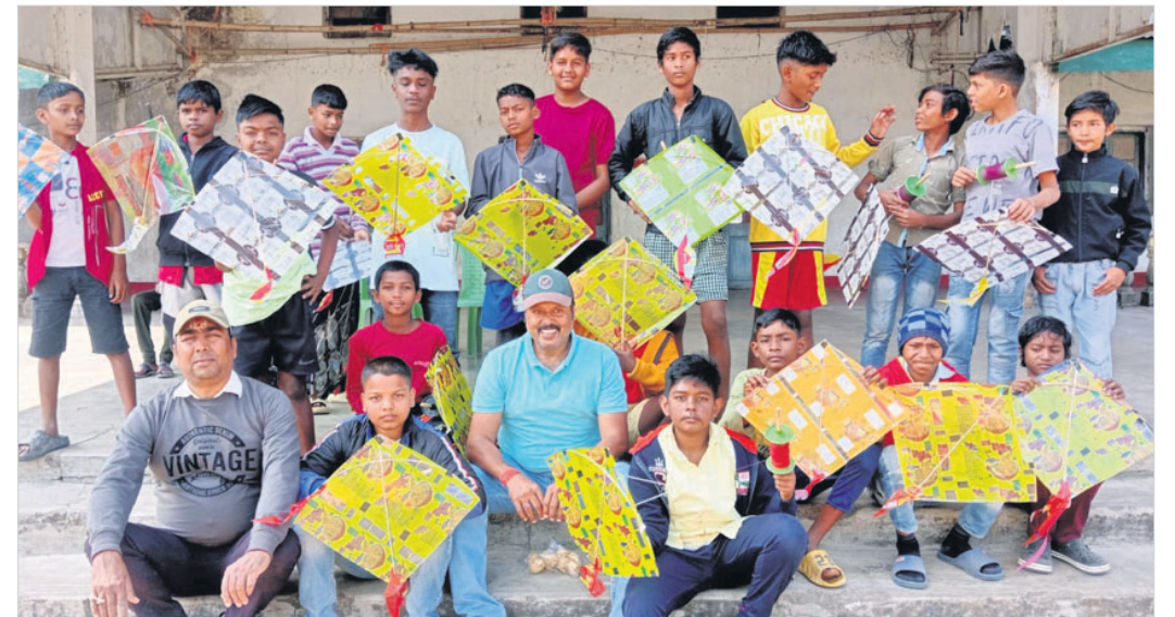
ମନର ସଂକ୍ରାନ୍ତି ଅବସରରେ ବାରମିତ୍ରପୁର ବିଆରଆଇ କ୍ଲବ ପଢ଼ିଆରେ ଅନୁଷ୍ଠିତ ଚିତ୍ର ପ୍ରତିଯୋଗିତାରେ ଅଂଶଗ୍ରହଣ କରିବା ପାଇଁ ଉପସ୍ଥିତ ପ୍ରତିଯୋଗୀମାନେ।