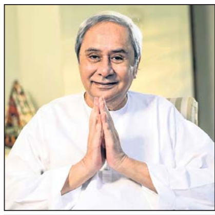
ନବୀନ ପଟ୍ଟନାୟକ, ମୁଖ୍ୟମନ୍ତ୍ରୀ