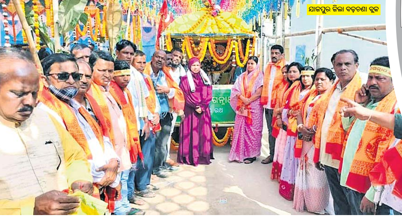
ଯାକପୁର ଜିଲା ବଡ଼ଚଣା ବୁକ