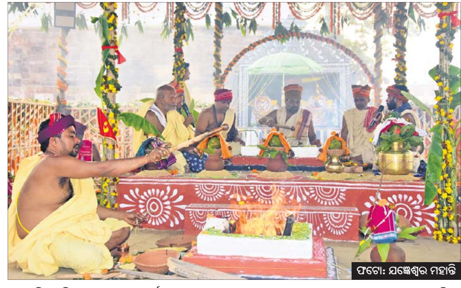
ଶ୍ରୀମନ୍ଦିର ପରିକ୍ରମା ପ୍ରକଳ୍ପର ଲୋକାର୍ପଣ ଉତ୍ସବ ଅବସରରେ ସୋମବାର ଯଜ୍ଞସ୍ଥଳରେ ବାହୁଶମାନେ ଯଜ୍ଞ କରୁଛନ୍ତି।

ଶ୍ରୀମନ୍ଦିର ପରିକ୍ରମା ପ୍ରକଳ୍ପର ଲୋକାର୍ପଣ ଉତ୍ସବ ଆସନ୍ତା ୧୭ ତାରିଖରେ ଅନୁଷ୍ଠିତ ହେବାକୁ ଯାଉଛି। ଏଥିପାଇଁ ଏବେ ଶ୍ରୀକ୍ଷେତ୍ର ଚଳଚ୍ଚଳନ ହୋଇଚାଲିଛି। ୧୨ ତାରିଖରେ ଶ୍ରୀମନ୍ଦିରରେ ଗଜପତି ମହାରାଜା ଶ୍ରୋତ୍ରୀୟ ବାହୁଶମାନଙ୍କୁ ରୁଆଟେକା ଓ ବରଣ କରିବା ପରେ ପ୍ରକଳ୍ପ ଲୋକାର୍ପଣ ଉତ୍ସବର ଆଦ୍ୟପର୍ବ ଆରମ୍ଭ ହୋଇଥିଲା। ବରଣ ହୋଇଥିବା ବାହୁଶମାନେ ଯଜ୍ଞସ୍ଥଳକୁ ଯାଇ ଅଙ୍କୁରା ରୋପଣ, ଅଙ୍କୁର ପୂଜନ, ଅଧିବାସ ସହ ଅନ୍ୟାନ୍ୟ ନୀତି ସାରିବା ପରେ ସୋମବାରଠାରୁ ମହାଯଜ୍ଞ ଆରମ୍ଭ ହୋଇଛି। ଏହା ଦିନ ଧରି ଚାଲିବ।