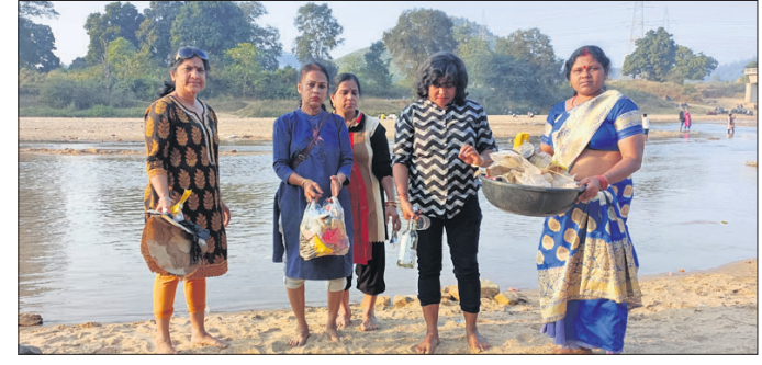
ସ୍ୱେଚ୍ଛାସେବୀମାନେ ନଦୀ କୂଳରେ ସଫେଇ କରୁଛନ୍ତି।