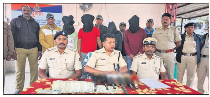
ପୋଲିସ୍ ଜଗତର ୪ ଅଭିଯୁକ୍ତ।