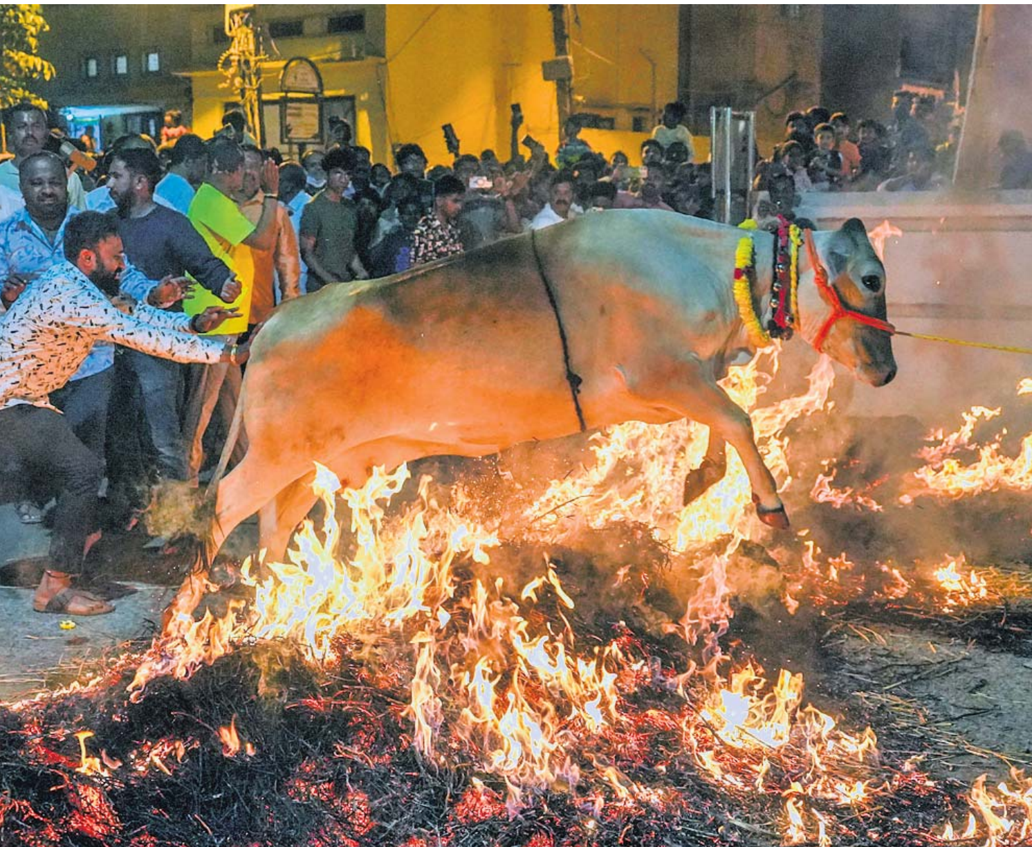
ମକର ସଂକ୍ରାନ୍ତି ଉତ୍ସବ ଅବସରରେ ବେଙ୍ଗାଲୁରୁରେ ଯୋମବାର ନିଆଁ ଉପରେ ରାଜା ତେଜିବା ପରମ୍ପରା ପାଳନ କରାଯାଇଛି।