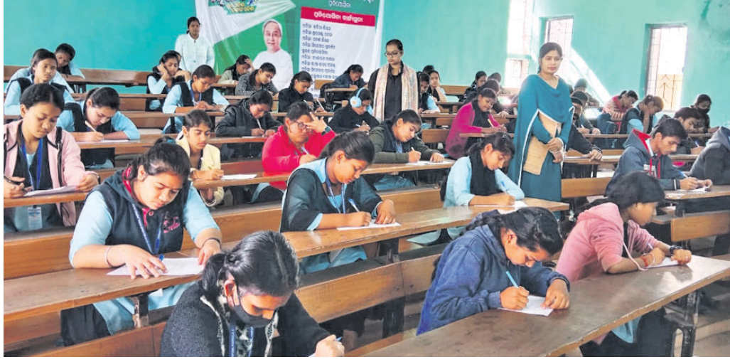
ଛାତ୍ରୀଛାତ୍ରମାନେ ପ୍ରତିଯୋଗିତାରେ ଅଂଶଗ୍ରହଣ କରିଛନ୍ତି।