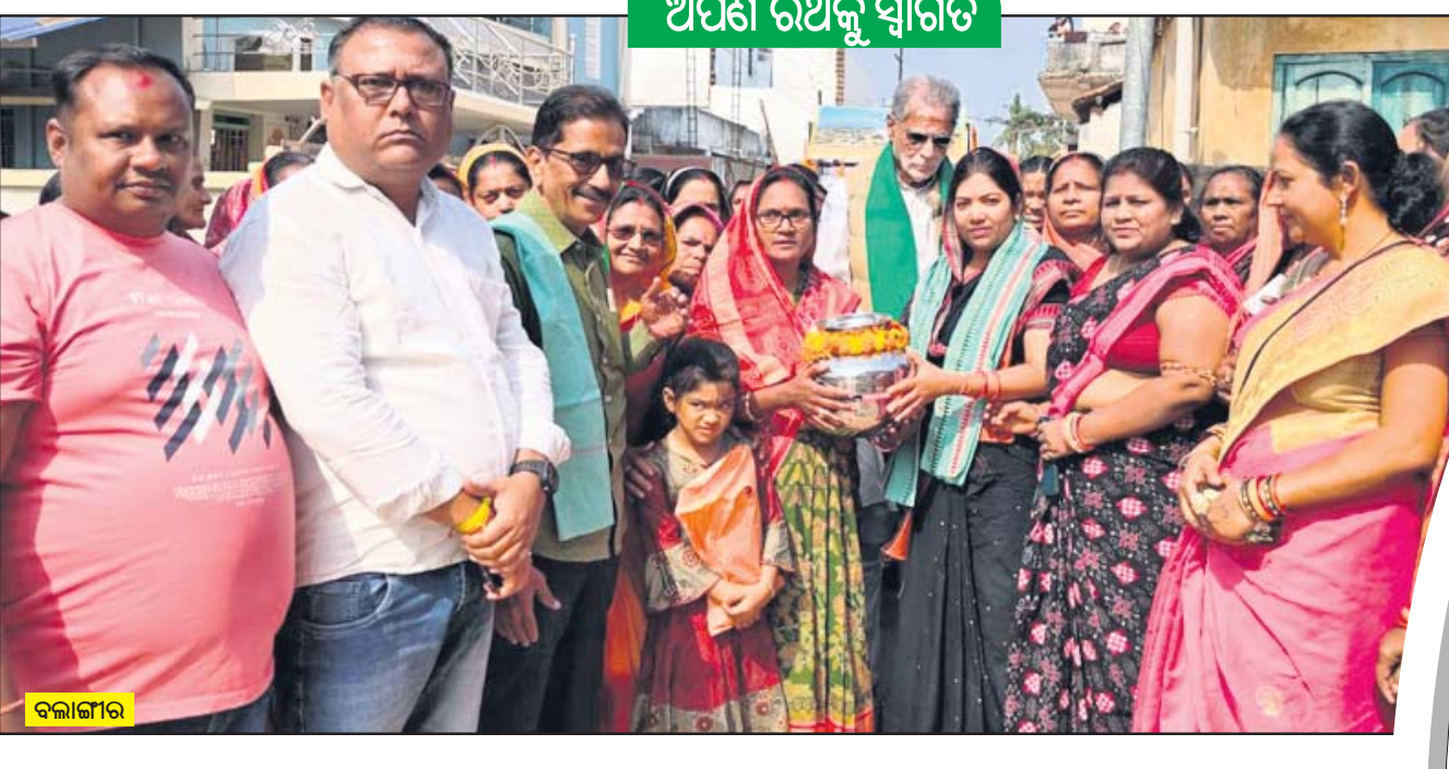
ଅର୍ପଣ ରଥକୁ ସ୍ୱାଗତ