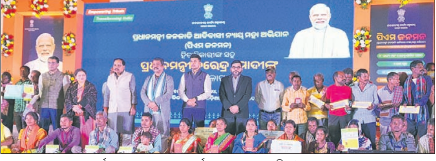
କାର୍ଯ୍ୟକ୍ରମରେ କେନ୍ଦ୍ରମନ୍ତ୍ରୀ ଧର୍ମେନ୍ଦ୍ର ପ୍ରଧାନଙ୍କ ସହ ଅତିଥି ଓ ଗ୍ରାମବାସୀ।

ସେମାନଙ୍କର ଅନୁଭୂତି ଶୁଣିଥିଲେ କେନ୍ଦ୍ରମନ୍ତ୍ରୀ। ଜଳ ଜୀବନ ମିଶନରେ ଘରକୁ ପାନୀୟ ଜଳ, ପିଏମ୍ କିଷାନ ସମ୍ମାନ ନିଧି ଏବଂ ଜନଧନ ଯୋଜନାରେ ଆର୍ଥିକ ସହାୟତା ପାଇଁ ସେମାନେ ସଶକ୍ତ ଓ ଆତ୍ମନିର୍ଭର ହୋଇଥିବା ହିତାଧିକାରୀମାନେ ମତ ପ୍ରକାଶ କରିଥିଲେ। ସେମାନଙ୍କ ସହ ଆଲୋଚନା କରିବା ଅବସରରେ ପ୍ରଧାନ କହିଛନ୍ତି, ପ୍ରଧାନମନ୍ତ୍ରୀଙ୍କ ନିଜ୍ଜନାରେ ସମାଜର ଅନ୍ଧିମ ଶ୍ରେଣୀରେ ଥିବା ଲୋକଙ୍କୁ ସଶକ୍ତ କରିବା ପାଇଁ ଅତ୍ୟାବଶ୍ୟକ ଲକ୍ଷ୍ୟ ଦିଗରେ ପିଏମ୍-ଜନମନର ଶୁଭାରମ୍ଭ କରାଯାଇଛି। ଓଡ଼ିଶା ଏକ ଜନଜାତିବହୁଳ ରାଜ୍ୟ। ଜନଜାତିକ ବିକାଶ ଦିନା ରାଜ୍ୟ ଓ ଦେଶର ବିକାଶ ଅସମ୍ପୂର୍ଣ୍ଣ। ମୋଦି ଗ୍ୟାରେଣ୍ଟିରେ ବାଦ ଦିବାଦର ଗାଗା ନାହିଁ। ମୋଦି ସରକାରରେ ଶତ ପ୍ରତିଶତ ଲୋକେ ଯୋଜନାର ଲାଭ ପାଇବାର ଲକ୍ଷ୍ୟ ରଖାଯାଇଛି। ପ୍ରଧାନ ଆହୁରି କହିଛନ୍ତି ଯେ, ପିଏମ୍ ଜନମନ ବିକଶିତ ଭାରତର ସଂକଳ୍ପର ଏକ ପ୍ରତୀକ୍ଷା ଆଧାର। ତାଙ୍କତର ବିମଳାଗତ ରେଳ ଲାଇନର ଦ୍ରୁତ କାମ ଆରମ୍ଭ ହୋଇଛି। ଖାରସୁରୁଡ଼ାକୁ ବାରକୋଟ୍ ପର୍ଯ୍ୟନ୍ତ ନୂଆ ରେଳ ଲାଇନ ତିଆରି କରିବା ପାଇଁ ସର୍ଭେ ଆରମ୍ଭ ହୋଇଛି ବୋଲି