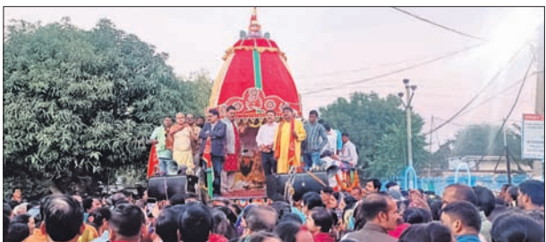
ରଥାଚଳୁ ଠାକୁରଙ୍କୁ ନଗର ପରିକ୍ରମା କରାଯାଇଛି।