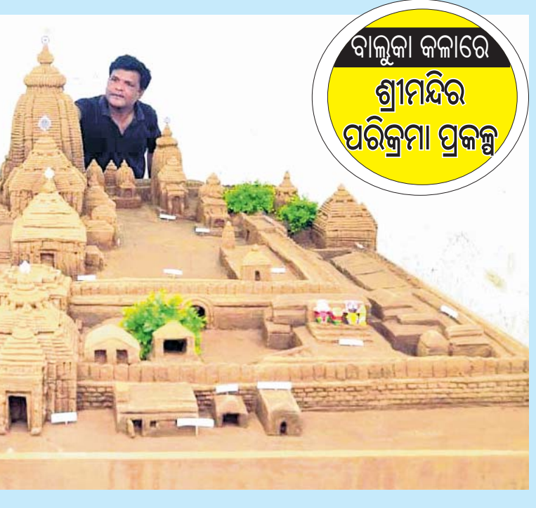
ବାଲୁକା କଳାରେ ଶ୍ରୀମନ୍ଦିର ପରିକ୍ରମା ପ୍ରକଳ୍ପ