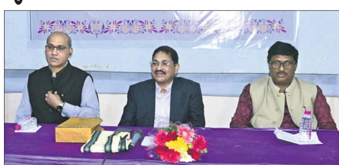
କାର୍ଯ୍ୟକ୍ରମରେ ଯୋଗଦେଇଥିବା ଅତିଥି।