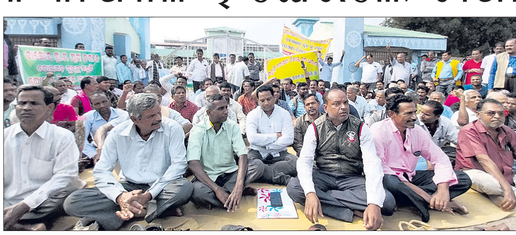
ଜିଲ୍ଲାପାଳଙ୍କ କାର୍ଯ୍ୟାଳୟ ଆଗରେ ଚାଷୀମାନେ ଧାରଣାରେ ବସିଛନ୍ତି।