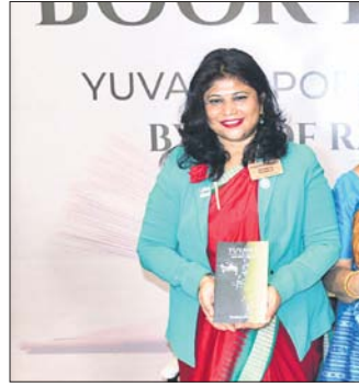
କାର୍ଯ୍ୟକ୍ରମରେ ଅତିଥି ପୁସ୍ତକ ଉନ୍ମୋଚନ କରୁଛନ୍ତି।