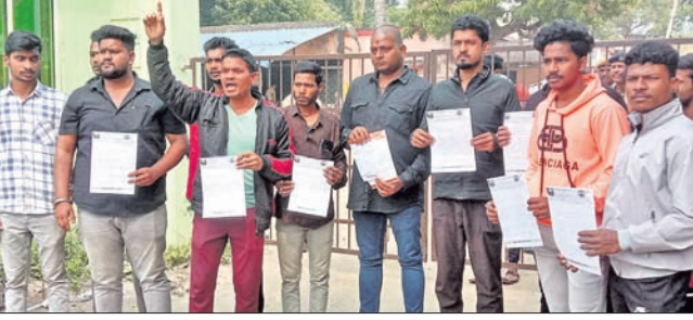
ପ୍ରାଣୀ ଚିକିତ୍ସାଳୟର ଅବ୍ୟବସ୍ଥାକୁ ନେଇ ହିନ୍ଦୁସେନା ପକ୍ଷରୁ ବିରୋଧ ପ୍ରଦର୍ଶନ।

କଟକ, ୧୬୧୧ (ଶିଳ୍ପ ପ୍ରଦର୍ଶନୀ) ସେହି ଅନୁସାରେ କମିଶନ ଡାକ୍ତର କମ୍ପାଉଣ୍ଡର ବ୍ୟାଙ୍କ ଖାତାରୁ ଯାଉଥିବା ସମ୍ପତ୍ତି ଅଭିଯୋଗ କରିଛି। ତୁରନ୍ତ ଏହି ଦାବିପତ୍ର ସରକାରୀ ପ୍ରାଣୀ ଚିକିତ୍ସାଳୟର ଡାକ୍ତରଙ୍କୁ ପ୍ରଦାନ କରାଯାଇଛି। ଏ ନେଇ ଡାକ୍ତର ବେହେରା ଶିକ୍ଷଣ ଦୋକାନର ପ୍ୟାଟ୍ରେର ଔଷଧ ଲେଖୁଥିବା ଅଭିଯୋଗ ହୋଇଛି। ଏପରି କି ଉକ୍ତ ଦୋକାନରୁ ସବୁ ଔଷଧ କିଣିବାକୁ ଲୋକଙ୍କୁ ବାଧ୍ୟ କରାଯିବା ସହ ପ୍ରେସ୍‌ସିସ୍‌ସ୍‌ରେ ଡାକ୍ତରଙ୍କ ଫୋନ୍ ନମ୍ବର ଦେଇ ଫୋନ୍ ରେ ମାଧ୍ୟମରେ ଟଙ୍କା ଦାବି କରାଯାଉଥିବା ହିନ୍ଦୁସେନା କର୍ମୀମାନେ ଅଭିଯୋଗ କରିଛନ୍ତି। ସରକାରୀ ପ୍ରାଣୀ ଚିକିତ୍ସାଳୟରେ ସିରିକ୍ସ, ଔଷଧ ନ ଥିବା ଅଭିଯୋଗ ହୋଇଛି। ଔଷଧ ନ ଥିବା ଆକରେ ପ୍ରେସ୍‌ସିସ୍‌ସ୍‌ରେ ଲେଖାଥିବା ଔଷଧ ଉକ୍ତ ଦୋକାନରୁ ଆଣିବାକୁ ଡାକ୍ତରଖାନା ପକ୍ଷରୁ କୁହାଯାଇଛି। ଔଷଧ ପାଇଁ ଯେତେ ଟା ଉକ୍ତ ଦୋକାନକୁ ଯାଉଛି ସେ କହିଛନ୍ତି।