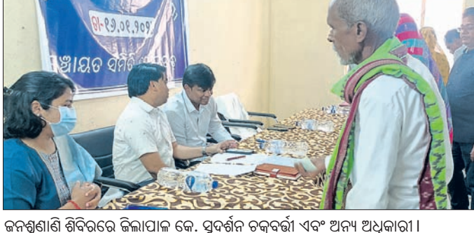
ଜନଶୁଣାଣି ଶିବିରରେ ଜିଲାପାଳ କେ. ସୁବର୍ଣ୍ଣ ଚକ୍ରବର୍ତ୍ତୀ ଏବଂ ଅନ୍ୟ ଅଧିକାରୀ ।