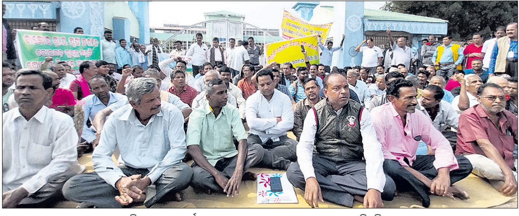
ଜିଲାପାଳଙ୍କ କାର୍ଯ୍ୟାଳୟ ଆଗରେ ଚାଷୀମାନେ ଧାରଣାରେ ବସିଛନ୍ତି ।