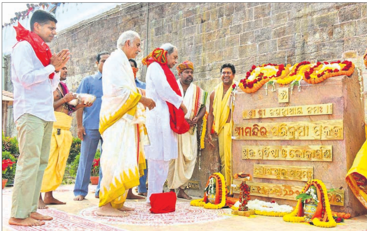
ମୁଖ୍ୟମନ୍ତ୍ରୀ ନବୀନ ପଟ୍ଟନାୟକ ରୁଧିରା ବନ୍ଧୁ ଗଜପତି ମହାରାଜା ଦିବ୍ୟସିଂହ ଦେବ ଏବଂ ୫-ଟି ଅଧ୍ୟକ୍ଷ କାର୍ଯ୍ୟକ୍ରମ ପାଠ୍ୟାମଳ ଉପସ୍ଥିତିରେ ଶ୍ରୀମନ୍ଦିର ପରିକ୍ରମା ପ୍ରକଳ୍ପକୁ ଲୋକାର୍ପଣ କରୁଛନ୍ତି।

ପୌଷ ଶୁକ୍ଳ ସପ୍ତମୀ ରୁଧିରା ବନ୍ଧୁ ପ୍ରତୀକ୍ଷିତ ଶ୍ରୀମନ୍ଦିର ପରିକ୍ରମା ପ୍ରକଳ୍ପର ଲୋକାର୍ପଣ ହୋଇଛି, ଯାହାକି ଶ୍ରୀକ୍ଷେତ୍ର ଐତିହ୍ୟରେ ନୂଆଫର୍ଦ୍ଦ ଯୋଡ଼ି ଦେଇଛି। ବିଶ୍ୱନିଉଜାକ ଲାଳାକ୍ଷେତ୍ରର ଆକର୍ଷଣୀୟ ରୂପକୁ ଦୁର୍ଗା ଦେଖିବାକୁ ପାଇଛି। ପୂର୍ବ ନିର୍ଦ୍ଧାରିତ କାର୍ଯ୍ୟକ୍ରମ ଅନୁସାରେ ମୁଖ୍ୟମନ୍ତ୍ରୀ ନବୀନ ପଟ୍ଟନାୟକ ସର୍ବସାଧାରଣଙ୍କ ଉଦ୍ଦେଶ୍ୟରେ ଅପରାହ୍ଣ ୧୯ଟିକା ୨୬ମିନିଟ୍ରେ ପରିକ୍ରମା ପ୍ରକଳ୍ପକୁ ଲୋକାର୍ପଣ କରିଛନ୍ତି। ଏହାପରେ ଗତ ୩ଦିନ ଧରି ଚାଲିଥିବା ମହାଯଜ୍ଞକୁ ଗଜପତି ମହାରାଜା ଦିବ୍ୟସିଂହ ଦେବ ପୂର୍ଣ୍ଣସ୍ତୁତି ଦେଇଛନ୍ତି।