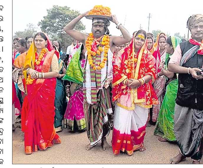
ରଘୁମୁଦ ଲାଗି କର୍ତ୍ତା ଶସ୍ୟ ନେଇ ଯାଉଛନ୍ତି।