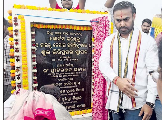
ମନ୍ତ୍ରୀ ପ୍ରତିରଞ୍ଜନ ଘଡ଼ାକ ସ୍ପୋର୍ଟ୍ କମ୍ପ୍ଲେକ୍ସର ଭିତ୍ତିପ୍ରସ୍ତର ସ୍ଥାପନ କରୁଛନ୍ତି ।