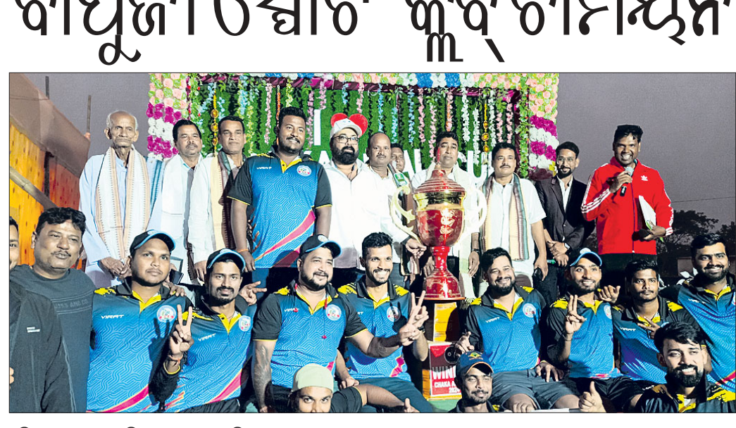
ଅତିଥି ଗଣନରେ ଚାମ୍ପିୟନ ଦଳର ଖେଳାଳିମାନେ ।

କେନାପୁର, ୧୭୧ (ଅଶୋକ ଦାସ): ଧର୍ମଶାଳା ବ୍ଲକ୍ ଅନ୍ତର୍ଗତ ରାମଚନ୍ଦ୍ରପୁରଠାରେ ୭ ଦିନଧରି ଚାଲିଥିବା ୨୭ତମ ବାପୁଜୀ ସ୍ପୋର୍ଟ୍ କ୍ଲବ୍ କ୍ରିକେଟ୍ ଟୁର୍ଣ୍ଣାମେଣ୍ଟ ଉଦ୍‌ଘାଟିତ ହୋଇଯାଇଛି। ଏଥିରେ ଫାଇନାଲ ମ୍ୟାଚ୍‌ରେ ଭୁବନେଶ୍ୱର ବାପୁଜୀ ସ୍ପୋର୍ଟ୍ କ୍ଲବ୍ ଚାମ୍ପିୟନ ହୋଇଛି। ଫାଇନାଲ ମ୍ୟାଚ୍ ବାପୁଜୀ ସ୍ପୋର୍ଟ୍ କ୍ଲବ୍ ଭୁବନେଶ୍ୱର ଓ ଖୋର୍ଦ୍ଧା ରେଲୱେ ଟିମ୍ ମଧ୍ୟରେ ଅନୁଷ୍ଠିତ ହୋଇଥିଲା।