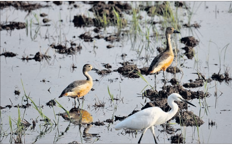
ସାତକୋଶିଆରେ ଇଣ୍ଡିଆନ ସ୍କିମର ଓ ଅନ୍ୟାନ୍ୟ ପକ୍ଷୀ ।

ନୟାଗଡ଼/ଗଣିଆ, ୧୭।୧ (ଲୋକନାଥ ମିଶ୍ର/ସଂକ୍ଷେପ କୁମାର ପ୍ରଧାନ)