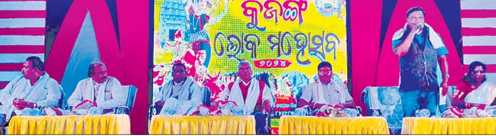
ମହୋତ୍ସବରେ ଯୋଗ ଦେଇଥିବା ଅତିଥିମାନେ।