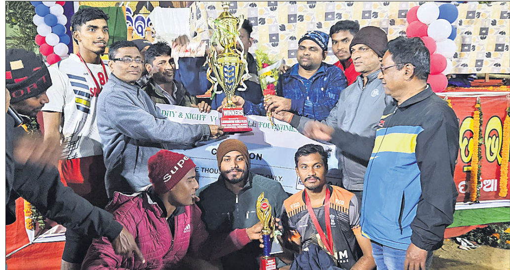
ଅତିଥିକଠାରୁ ଚାମ୍ପିୟନ ଚିମ୍ପର ଖେଳାଳିମାନେ ଟ୍ରଫି ଗ୍ରହଣ କରୁଛନ୍ତି।