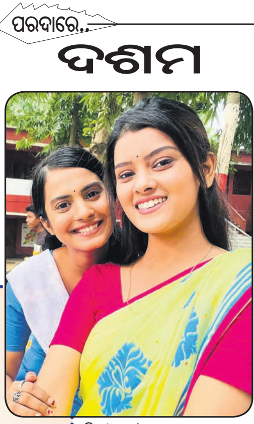
ଫିଲ୍ମ 'ଦଶମ'ର ଏକ ଦୃଶ୍ୟ

ସାଜିବାକୁ ଅଫର ଦେଇଛନ୍ତି । ଖାସ୍ କଥା ହେଲା ଏହି ତିନୋଟି ଫିଲ୍ମର କାହାଣୀ ଏବଂ ସେଥିରେ ମୋତେ ମିଳିଥିବା ଭୂମିକା ବେଶ୍ ବଦଳିବ । ତେଣୁ ତାହାକୁ ପାଆନ୍ତୁ କରି ଅଭିନୟ କରିବାକୁ ରାଜି ହୋଇଛି । ଏହାର ଶୁଟିଂ ପଛକୁ ପଛ ହେବ । ତେଣୁ ଦେବୁ ନେଇ ଚେନ୍ନାଇ ନେଉନାହିଁ । ଏ ନେଇ ମୁଖାଳ ମଧ୍ୟ ପ୍ରାୟ ପ୍ରସ୍ତୁତି ଆରମ୍ଭ କରିଦେଇଛନ୍ତି । ତେବେ ଫିଲ୍ମ ତିନୋଟି ତାଙ୍କ କ୍ୟାରିୟର ପାଇଁ କେତେ ଶୁଭପ୍ରଦ ସାବ୍ୟସ୍ତ ହେଉଛି ତାହା ରିଲିଜ୍ ପରେ ହିଁ ଜଣାପଡ଼ିବ ।