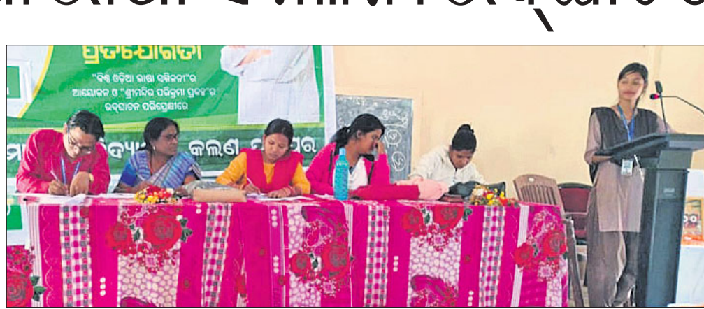
ଉଦ୍‌ଘାଟନା ଉତ୍ସବରେ ଯୋଗଦେଇଥିବା ଅତିଥିମାନେ।

ରଘୁଲପୁର କୁଳ ଅନ୍ତର୍ଗତ ମଧୁପୁର କଲେଜ-କଲଣସିତ୍ର ଡିଗ୍ରୀ ଓ ଉଚ୍ଚ ମାଧ୍ୟମିକ ବିଦ୍ୟାଳୟରେ ବିଶ୍ୱ ଓଡ଼ିଆ ଭାଷା ସମ୍ମିଳନୀ ଉଦ୍‌ଘାଟିତ ହୋଇଯାଇଛି। ରାଜ୍ୟ ସରକାରଙ୍କ ନୂଆ-ଓ କାର୍ଯ୍ୟକ୍ରମ କରିଆରେ କଲେଜସ୍ତରରେ ଓଡ଼ିଆ ଭାଷା ସାହିତ୍ୟକୁ ପ୍ରତିଷ୍ଠିତ କରିବା ସହ ଯୁବପିଢ଼ିଙ୍କ ମଧ୍ୟରେ ଏଥିପ୍ରତି ପ୍ରତିବନ୍ଧତା ଆଣିବାରେ ପ୍ରୋତ୍ସାହିତ କରିବାକୁ ପ୍ରୟାସ କରାଯାଇଛି। ଓଡ଼ିଆ କାବିତା ବିଶ୍ୱସ୍ତରରେ ପ୍ରତିଷ୍ଠିତ କରିବାକୁ ହେଲେ ବିଦ୍ୟାର୍ଥୀ ଭାଷା ସାହିତ୍ୟ ଅନୁଗାମୀ