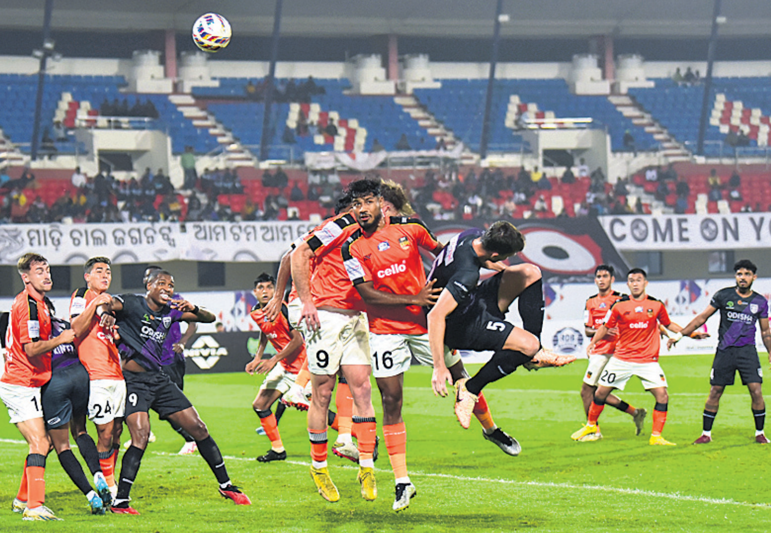
କଳିଙ୍ଗ ଷ୍ଟାଡ଼ିୟମରେ ଚାଲିଥିବା ସୁପର କପ୍ ପୁରୀ ପୁରୀ ଚଳଚ୍ଚିତ୍ର ଦ୍ୱିତୀୟ ମ୍ୟାଚରେ ଏକ ସଂଘର୍ଷପୂର୍ଣ୍ଣ ମୁହୂର୍ତ୍ତ।

ବୁଧବାର ଅନୁଷ୍ଠିତ ପ୍ରଥମ ମ୍ୟାଚରେ ଏସ୍ପି ଗୋଥା ୧-୦ ଗୋଲରେ ବେଙ୍ଗାଲୁରୁ ଏସ୍ପିକୁ ପରାସ୍ତ କରିଛି। ମ୍ୟାଚ୍ରେ ଡାକ୍ତରୀ ସଂଘର୍ଷପୂର୍ଣ୍ଣ ହୋଇଥିଲା। ୯୦ ମିନିଟ୍ ପର୍ଯ୍ୟନ୍ତ କେହି କାହାରିକୁ ଗୋଲ ଦେଇପାରି ନ ଥିଲେ। ମାତ୍ର ଇସ୍ମିର ଟାଲମ୍ପରେ ଗୋଥାକୁ ଭାଗ୍ୟଦେବା ସହାୟ ହୋଇଥିଲା। ୯୦+୪ ମିନିଟରେ ବ୍ରିସନ ବୁବେନ ଫର୍ମାଣ୍ଡୋ ଏକ ଗୋଲ ଦେଇ ଗୋଥା ଶିବିରରେ ଉତ୍ସାହ ଖେଳାଇ ଦେଇଥିଲେ। ଗୋଲ ପରିଶୋଧ ପାଇଁ ଆଉ ଦମୟ ନ ଥିଲା। ଫଳରେ ଗୋଥା ବିଜୟ ହାସଲ କରିଥିଲା। ବେଙ୍ଗାଲୁରୁ ଦଳର ୨ ଖେଳାଳି ହର୍ଷ ଶୈଲେଶ୍ ପ୍ରିତି ଓ ସ୍ୱାଭୁକୋ ଡମ୍ବାଜୋଭିକ୍ ଯେଲୋ କାର୍ଡ ପାଇଥିଲେ। ୨ ମ୍ୟାଚରୁ ୨ ବିଜୟ ସହ ଗୋଥା ୬ ପଏଣ୍ଟରେ ପହଞ୍ଚି ଯାଇଛି। ଅନ୍ୟପକ୍ଷରେ ବେଙ୍ଗାଲୁରୁ ଏସ୍ପି ଖେଳିଥିବା ୨ଟି ଯାକ ମ୍ୟାଚ ହାରିଥିବାକୁ ଗ୍ରୁପ୍ ପର୍ଯ୍ୟାୟରୁ ଅଭିଯାନ ଶେଷ କରିବା ନିଶ୍ଚିତ ହୋଇଛି।