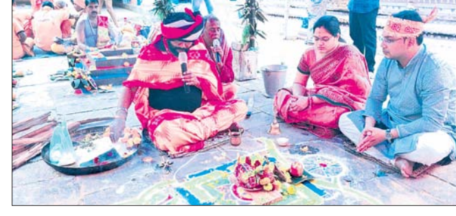
ଦଶରଥପୁରର ଶ୍ୟାମସୁନ୍ଦରଜୀଉ ମଠରେ ଯଜ୍ଞ ଅନୁଷ୍ଠିତ ହେଉଛି।