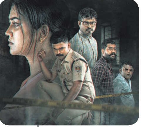
'ଶକ୍ତି ଆପାର୍ଟମେଣ୍ଟ' ଫିଲ୍ମର ଏକ ଦୃଶ୍ୟ