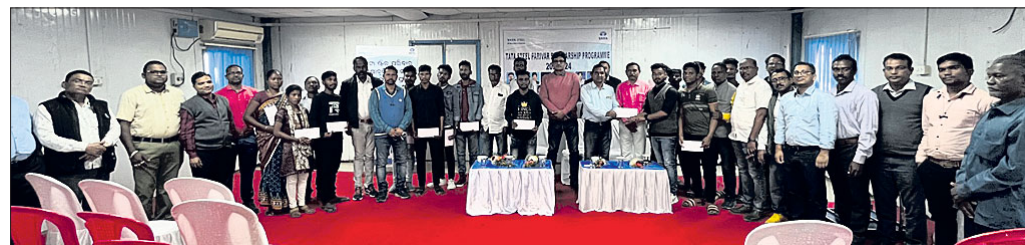
ଟାଟା ଷ୍ଟିଲ୍ ପରିବାର ପକ୍ଷରୁ ଶିକ୍ଷାବୃତ୍ତି ପାଇଥିବା ଛାତ୍ରାଛାତ୍ରୀ ଏବଂ ଅନ୍ୟମାନେ ।

କଳିଙ୍ଗନଗର, ୧୭୧ (ଶୁଭାଶିଷ ରାଉତ): କଳିଙ୍ଗନଗର ଟାଟା ଷ୍ଟିଲ୍ ପକ୍ଷରୁ ବିପ୍ଳାବିତ ପରିବାରର ୧୭ ଜଣ ଛାତ୍ରାଛାତ୍ରୀଙ୍କୁ ଟୁରୁର ନିକଟ ଟାଟା ଷ୍ଟିଲ୍ କଳିଙ୍ଗନଗର କର୍ପୋରେଟ୍ ସଭାରେ ସଭାରେ ହଲ୍‌ଠାରେ ଗଣା ଷ୍ଟିଲ୍ ପରିବାର ଶିକ୍ଷାବୃତ୍ତି ୨୦୨୩-୨୪ ପ୍ରଦାନ କରାଯାଇଛି। ଏଥିରେ ଟାଟା ଷ୍ଟିଲ୍ କର୍ପୋରେଟ୍ ସଭାରେ ପୁଣ୍ୟ ଦେବଦୁର ମହାନ୍ତି ପୁଣ୍ୟ ଅଧିକାରୀଙ୍କୁ ଶିକ୍ଷାବୃତ୍ତିରେ ଉପସ୍ଥାପନ କରାଯାଇଛି।