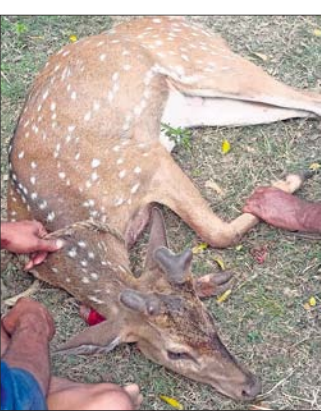
ରଘୁନାଥପୁର, ୧୭୧୧ (ରାଜେନ୍ଦ୍ର ନାରାୟଣ ସିଂହ) ରଘୁନାଥପୁର ନିକଟସ୍ଥ ନିଶ୍ଚିତକୋଇଲି

ରୁକ ଅନ୍ତର୍ଗତ ସିଲ ନବ ଗ୍ରାମପଞ୍ଚାୟତ ବ୍ରାହ୍ମଣଖଣ୍ଡରୁ ରୁଧିବାର ସକାଳୁ ଆହତ ଅବସ୍ଥାରେ ଏକ ହରିଣକୁ ଉଦ୍ଧାର କରି ଗ୍ରାମବାସୀ ବନ ବିଭାଗକୁ ହସ୍ତାନ୍ତର କରିଛନ୍ତି । ଷଡ଼ାଙ୍ଗ ହରିଣଟିର ଗୋଟିଏ ଗୋଡ଼ ଭାଙ୍ଗି ଯାଇଥିବାବେଳେ ସେ କୁଆଡ଼େ ଯାଇ ନ ପାରି ଗୋଟିଏ ସ୍ଥାନରେ ପଡ଼ିରହିଥିଲା । ଖାଦ୍ୟ ଅଭେଦରେ ହରିଣଟି ବାଟ ଚୁଲି ଗ୍ରାମକୁ ପଶିଆସିଛି । ଶିକାରୀ, ବୁଲି କୁକୁର କିମ୍ବା ଦୁର୍ଗଣା ଯୋଗୁ ଏପରି ଆହତ ହୋଇଥିବା ଅନୁମାନ କରାଯାଇଛି । ଗ୍ରାମବାସୀ କଟକ ବନ କର୍ମଚାରୀଙ୍କୁ ଏ ସମ୍ପର୍କରେ ଖବର ଦେବାପରେ ସେମାନେ ଆସି ଆହତ ହରିଣଟିକୁ ଚିକିତ୍ସା ପାଇଁ ନେଇଯାଇଛନ୍ତି ।