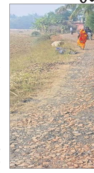
ଖଣ୍ଡିଆଖାବରା ହେଉଛନ୍ତି। କେବଳ ସେତିକି ନୁହେଁ ଦହିପାଳ ଉଚ୍ଚ ବିଦ୍ୟାଳୟ, ଦହିପାଳ ଉଚ୍ଚ ପ୍ରାଥମିକ ବିଦ୍ୟାଳୟ ମଧ୍ୟ ଏହି ରାସ୍ତା ପାଖରେ ଅବସ୍ଥିତ। ଏହି ରାସ୍ତା ଦେଇ ଏବେ କୌଣସି ଗାଡ଼ି ଆସି

ନାଉଗାଁ ବ୍ଲକ ଅନ୍ତର୍ଗତ ନାଉଗାଁ-ତାବର ରାସ୍ତାର ସମ୍ପ୍ରସାରଣ ଓ ପୁରୁଣ ନିର୍ମାଣ କାର୍ଯ୍ୟ ଜାରି ରହିଛି। ଏହି ରାସ୍ତା ପ୍ରଧାନମନ୍ତ୍ରୀ ଗ୍ରାମ ସଡ଼କ ଯୋଜନାରେ ଅନ୍ତର୍ଭୁକ୍ତ ହୋଇଥିବା ବେଳେ ଗ୍ରାମ୍ୟ ଅଭୟନ ବିଭାଗ ଜଗତୀଧର ପ୍ରସନ୍ନ ମୋଲାର ଉଦ୍ଦେଶ୍ୟରେ ୯ ଦିନ ହେବ ଉଚ୍ଚ ରାସ୍ତାର ଗୋଠା ଗାଦିମଠରୁ ଅଭିଭାବ ପର୍ଯ୍ୟନ୍ତ ଉପର ପିଛୁକୁ ଉଠାଯିବା ସହ ଗୋଟିଏ ପାଖରେ ନାଳ ଖୋଳାଯାଇଛି। ନିମ୍ନ ଠିକାଦାର ପ୍ରାୟ ଦେଢ଼ କି.ମି.ରୁ ଉର୍ଦ୍ଧ୍ୱ ରାସ୍ତା ଖୋଳି ପକାଇଛନ୍ତି। ମାତ୍ର ନିର୍ମାଣ କାର୍ଯ୍ୟ କରୁନାହାନ୍ତି। ଏହି ରାସ୍ତାର ଦହିପାଳ ନିକଟରେ ଓଡ଼ିଶା ଆର୍ଦ୍ଧ ବ୍ୟୟାଳୟ ରହିଛି। ଉଚ୍ଚ ବିଦ୍ୟାଳୟକୁ ବୁକର ବିଭିନ୍ନ ପଞ୍ଚାୟତରୁ ଛୋଟ ପିଲାମାନେ ସାଲକେଲ ମାଧ୍ୟମରେ ଆସିଥାନ୍ତି। ମାତ୍ର ରାସ୍ତା ଖୋଳାଯାଇଥିବାରୁ ସେମାନେ ଅଧିକାଂଶ ସମ୍ପୂର୍ଣ୍ଣ ହେଉଛନ୍ତି। ଏପରିକି ପିଲାମାନେ ରାସ୍ତାରେ ପଡ଼ି