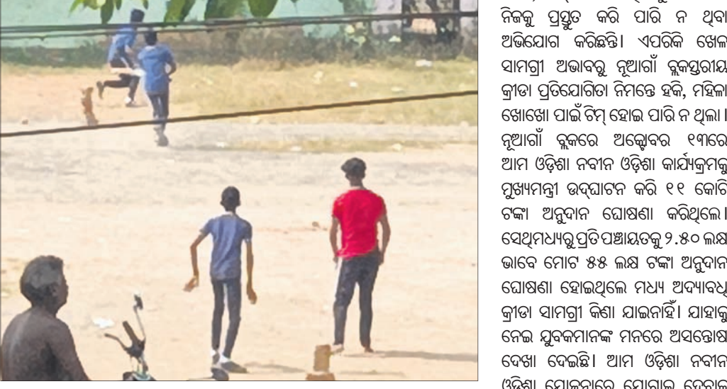
ନୂଆଗାଁ ପଞ୍ଚାୟତରେ ଇଟା ଓ କାଠିକୁ ଉଇକେଟ୍ କରି ପିଲାମାନେ କ୍ରିକେଟ୍ ଖେଳୁଛନ୍ତି ।

ନୟାଗଡ଼ ଜିଲା ନୂଆଗାଁ ବ୍ଲକର ଯୁବକମାନଙ୍କ ପାଖରେ ଖେଳିବା ପାଇଁ ଆବଶ୍ୟକ ସରଞ୍ଚନା ନାହିଁ । ଚେଷ୍ଟା ଯୁବକମାନେ କ୍ରିକେଟ୍ ଖେଳିବା ସମୟରେ କିଛି ଇଟା ଓ କାଠିକୁ ଉଇକେଟ୍ ଭାବେ ବ୍ୟବହାର କରି ଖେଳୁଥିବା ଅଭିଯୋଗ ହେଉଛି । ଜ୍ରାତା କ୍ଷେତ୍ରରେ ବିକାଶ ଆଣିବା ସହ ଯୁବମାନଙ୍କୁ ନିୟମିତ ଭାବରେ ବିକାଶ ପାଇଁ ସରକାର ଜ୍ରାତା ପ୍ରତି ବୁଦ୍ଧି ଦେଉଛନ୍ତି । ବିଭିନ୍ନ ଯୋଜନା ମାଧ୍ୟମରେ ଜ୍ରାତାର ବିକାଶ ପାଇଁ ଅନୁଦାନ ଦିଆଯାଇଛି । ସରକାର ଜ୍ରାତା ପାଇଁ ବହୁ ପରିନାଶର ଅର୍ଥ ବ୍ୟୟ କରୁଥିଲେ ମଧ୍ୟ ବାହା ଲୋକଙ୍କ ପାଖରେ ପହଞ୍ଚି ପାରୁ ନାହିଁ କିମ୍ବା ଯୁବକମାନେ ତାହାର ସୁଯୋଗ ପାଇ ପାରୁ ନ ଥିବା ଅଭିଯୋଗ ହେଉଛି । ନୂଆ - ଓ ଯୁବ ଓଡ଼ିଶା ନବୀନ ଓଡ଼ିଶା ଯୋଜନାରେ ଉକ୍ତ ମାଧ୍ୟମିକ ବିଦ୍ୟାଳୟର ଛାତ୍ରାଛାତ୍ରୀମାନଙ୍କ ଜ୍ରାତା ନିମନ୍ତେ ପ୍ରତି କଲେଜକୁ ୩ ଲକ୍ଷ ଟଙ୍କା ଅନୁଦାନ ଦିଆଯାଇଛି । ସେହିପରି ବ୍ଲକସ୍ତରରେ ଜ୍ରାତା ପ୍ରତିଯୋଗିତା ନିମନ୍ତେ ପ୍ରତି ବ୍ଲକକୁ