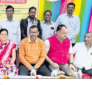
ମଣ୍ଡି ଉଦ୍ଘାଟନ ଉତ୍ସବରେ ଉପସ୍ଥିତ ଅତିଥି।