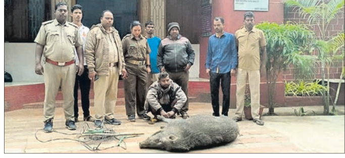
ଜବତ ମୃତ ବାରହା ଓ ଗିରଫ ଶିକାରୀ ।

ସମୟରେ ଦୁର୍ଘଟଣାପୂର୍ଣ୍ଣ ସେହି ରାସ୍ତା ଦେଇ ଯାଉଥିବାବେଳେ ସନ୍ଦେହରେ ତାକୁ ଅଟକାଇ ପତରା ଉତ୍ତରା କରାଯାଇଥିଲା । ଘଟଣାସ୍ଥଳକୁ ବିଦ୍ୟୁତ୍ ଚାଉଳ, ଲିଆଇ ଚାଉଳ ଓ ମୃତ ବାରହାକୁ ଜବତ କରାଯାଇଥିଲା । ମୃତ ବାରହାର ଆନୁମାନିକ ବୟନ ୩ବର୍ଷ ଓ ଓଜନ ୭୦କେଜି ବୋଲି ବିଭାଗୀୟ କର୍ମଚାରୀମାନେ କହିଛନ୍ତି । ମୃତ ବାରହାକୁ ଗଣିଆ ପ୍ରାଣୀଧାନ ଚିକିତ୍ସାଳୟକୁ ଆଣି ବ୍ୟବଚ୍ଛେଦ କରିବା ପରେ ବନାଞ୍ଚଳ କାର୍ଯ୍ୟାଳୟ ପରିସରରେ ପୋତି ଦିଆଯାଇଛି । ଉକ୍ତ ଘଟଣାରେ ଓଆର ୪/୨୪ ମାମଲା ରୁଜୁ ହୋଇଛି ବୋଲି ବିଭାଗୀୟ ଅଧିକାରୀ କହିଛନ୍ତି ।