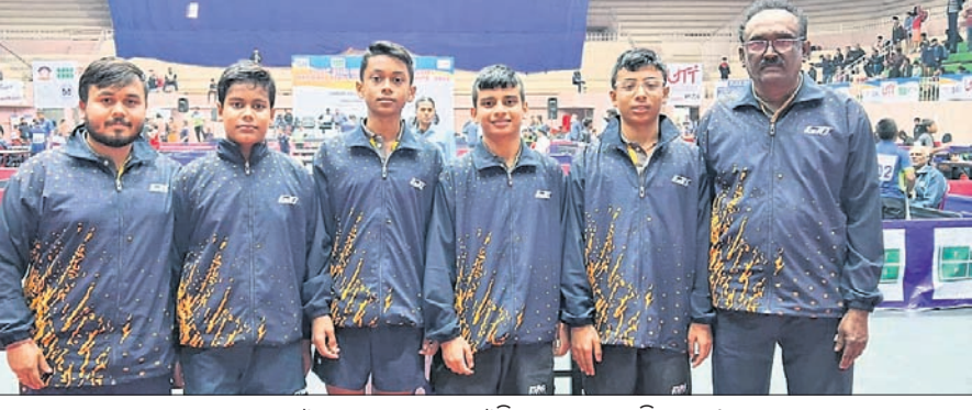
କୋର୍ଡ଼ ଓ ମ୍ୟାନେଜରଙ୍କ ସହ ଓଡ଼ିଶା ଟେକ୍ନିକାଲ ଟେନିସ୍ ଦଳ ।