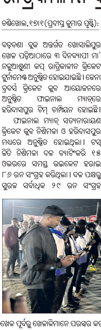
ଖେଳ ପୂର୍ବରୁ ଖେଳାଳିମାନେ ପରସ୍ପର କରମର୍ଦ୍ଦନ କରୁଛନ୍ତି ।