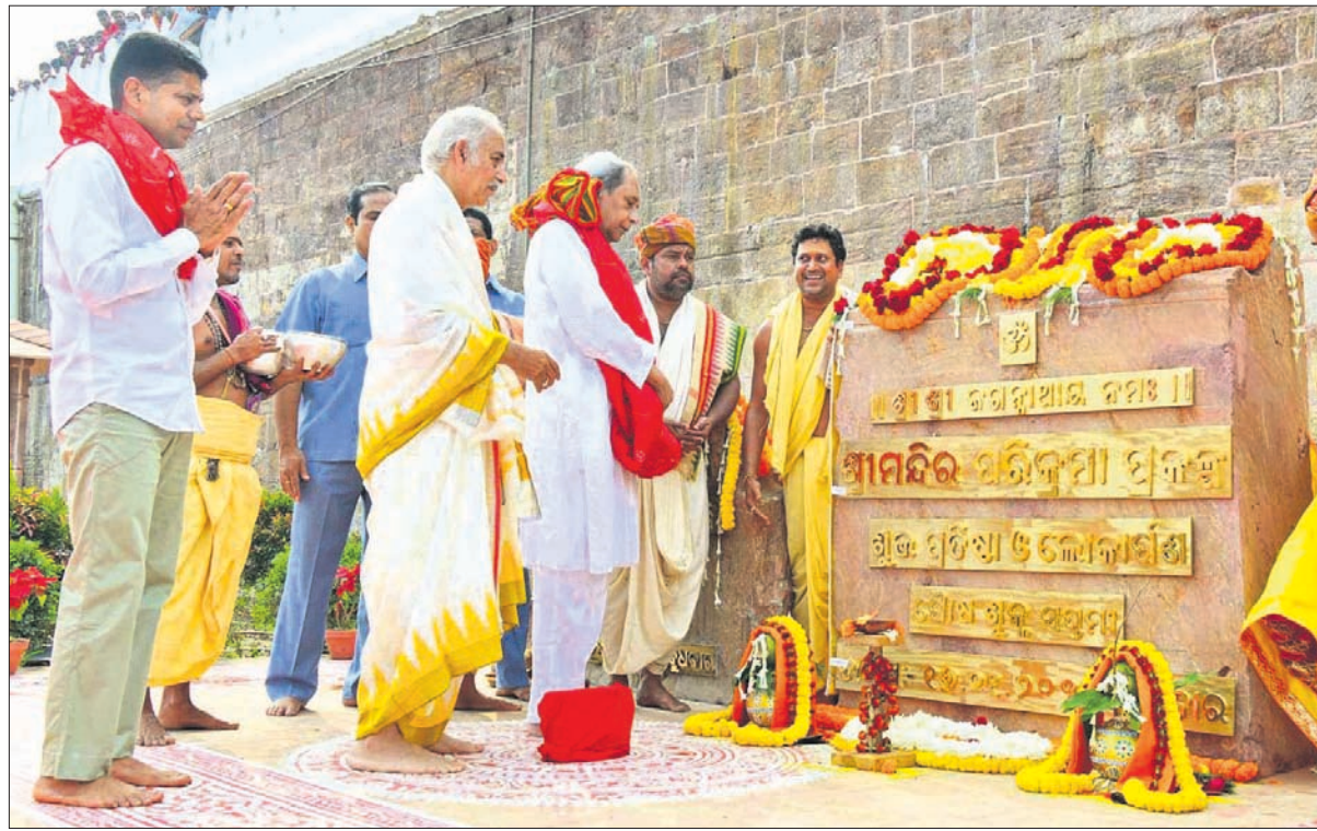
ମୁଖ୍ୟମନ୍ତ୍ରୀ ନବୀନ ପଟ୍ଟନାୟକ ରୁଧିରା ବନ୍ଧୁ ଗଜପତି ମହାରାଜା ଦିବ୍ୟସିଂହ ଦେବ ଏବଂ ୫-ଟି ଅଧ୍ୟକ୍ଷ କାର୍ଯ୍ୟକ୍ରମ ପାଠ୍ୟାମଳ ଉପସ୍ଥିତିରେ ଶ୍ରୀମନ୍ଦିର ପରିକ୍ରମା ପ୍ରକଳ୍ପକୁ ଲୋକାର୍ପଣ କରୁଛନ୍ତି।

ପୌଷ ଶୁକ୍ଳ ସପ୍ତମୀ ରୁଧିରା ବନ୍ଧୁ ପ୍ରତୀକ୍ଷିତ ଶ୍ରୀମନ୍ଦିର ପରିକ୍ରମା ପ୍ରକଳ୍ପର ଲୋକାର୍ପଣ ହୋଇଛି, ଯାହାକି ଶ୍ରୀକ୍ଷେତ୍ର ଐତିହ୍ୟରେ ନୂଆଫର୍ଦ୍ଦ ଯୋଡ଼ି ଦେଇଛି। ବିଶ୍ୱନିଉଜାଳ ଲାଳାକ୍ଷେତ୍ରର ଆକର୍ଷଣୀୟ ରୂପକୁ ଦୁର୍ଗା ଦେଖିବାକୁ ପାଇଛି। ପୂର୍ବ ନିର୍ଦ୍ଧାରିତ କାର୍ଯ୍ୟକ୍ରମ ଅନୁସାରେ ମୁଖ୍ୟମନ୍ତ୍ରୀ ନବୀନ ପଟ୍ଟନାୟକ ସର୍ବସାଧାରଣଙ୍କ ଉଦ୍ଦେଶ୍ୟରେ ଅପରାହ୍ଣ ୧୯ଟିକା ୨୬ମିନିଟ୍ରେ ପରିକ୍ରମା ପ୍ରକଳ୍ପକୁ ଲୋକାର୍ପଣ କରିଛନ୍ତି। ଏହାପରେ ଗତ ୩ଦିନ ଧରି ଚାଲିଥିବା ମହାଯଜ୍ଞକୁ ଗଜପତି ମହାରାଜା ଦିବ୍ୟସିଂହ ଦେବ ପୂର୍ଣ୍ଣସ୍ତୁତି ଦେଇଛନ୍ତି।