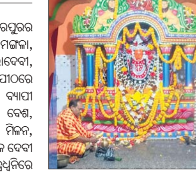
ମା' ଚାରା ଦେବୀ।

ଯାଜପୁର କୁଳ ଅନ୍ତର୍ଗତ ମହେଶ୍ୱରପୁର ମା' ବାସୁଲେଇ, ବରୁଆଁର ମା' ମଙ୍ଗଳା, କୁମ୍ଭରପୁର ମା' ଚାରାଦେବୀ, କଟେରୀର ମଙ୍ଗଳା ଆଦିଦେବୀମାନଙ୍କ ମକର ସଂକ୍ରାନ୍ତିଠାରୁ ୩ ଦିନ ବ୍ୟାପୀ ନାମୟଜ୍ଞ, ଦେବୀଙ୍କ ବିଭିନ୍ନ ବେଶ, ଚାରାଦେବୀ ପୀଠରେ ଭଜଣା ମିଳନ, କାର୍ତ୍ତବୀୟ ଓ ଭଜନ ସାଙ୍ଗକୁ ପ୍ରତ୍ୟେକ ଦେବୀ ପୀଠରେ ବ୍ରାହ୍ମଣଙ୍କ ବେଦ ମନ୍ତ୍ରଧ୍ୱନିରେ ସମଗ୍ର ଅଞ୍ଚଳ ଉତ୍ସବ ମୁଖରିତ ହେଉଥିବା ଦେଖିବାକୁ ମିଳିଛି। ପ୍ରତ୍ୟେକ ପୀଠରେ ଶ୍ରଦ୍ଧାଳୁଙ୍କ ଭିଡ଼ ପରିଲକ୍ଷିତ ହେଉଛି। ଚାରାଦେବୀ ପୀଠରେ ଯାତ୍ରା ପରିବେଷଣ କରାଯାଇଛି। ବରୁଆଁରେ ସର୍ବମଙ୍ଗଳାମୁବ