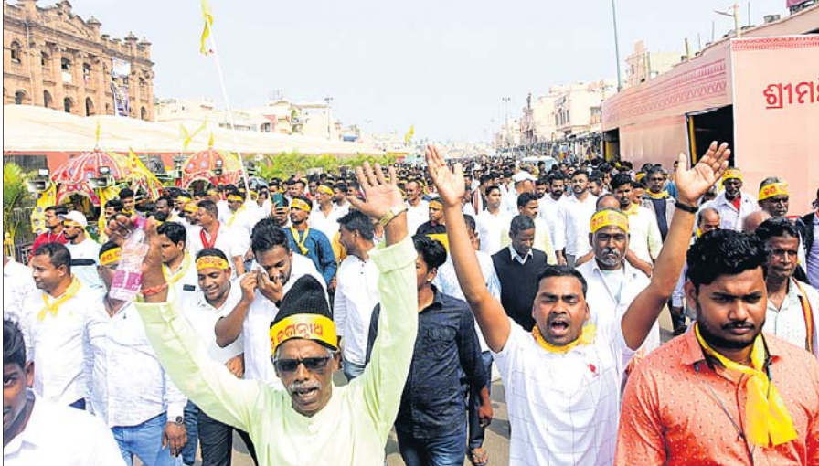
ପରିକ୍ରମା ପ୍ରକଳ୍ପ ଯାତ୍ରାରେ ଶ୍ରଦ୍ଧାଳୁ।

ଦିଲ୍ଲୀ ଛାତ୍ର ଓ ଯୁବ ଜନତା ଦଳ ପକ୍ଷରୁ ପରିକ୍ରମା ପ୍ରକଳ୍ପ ଯାତ୍ରା