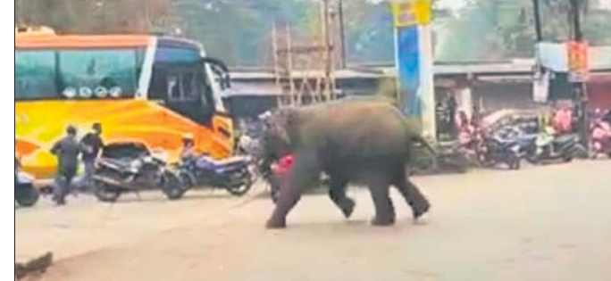
ବାରିପଦା ସହରର ଏମ୍‌କେସି ହାଇସ୍କୁଲ ନିକଟରେ ହାତୀ।