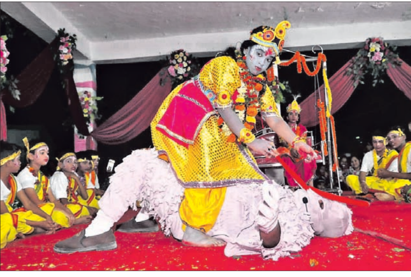
ବରଗଡ଼ ଧନୁଯାତ୍ରା ଗୁରୁବାର ଚତୁର୍ଥ ଦିବସରେ ଗୋପପୁରରେ ବକାପୁର ବଧ ଦୃଶ୍ୟାଭିନୟ ।