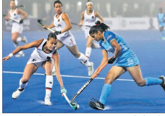
ଭାରତ ଓ ଜର୍ମାନୀ ମଧ୍ୟରେ ଅନୁଷ୍ଠିତ ମ୍ୟାଟ୍ରେ ଏକ ସଂଘର୍ଷପୂର୍ଣ୍ଣ ମୁହୂର୍ତ୍ତ।

ଦେଇଥିଲେ। ମ୍ୟାଟ୍ ଶେଷ ହେବାକୁ ୩ ମିନିଟ୍ ରହିଥିବା ବେଳେ ଗାର୍ଲୋଟ୍ ଷ୍ଟାପେନହର୍ଷ୍ଟ ଖେଳ ଯାଇଥିଲା। ପେନାଲ୍ଟି ଶୁଟ୍ ଆଉଟ୍‌ରେ ୧ ମିନିଟ୍ ମଧ୍ୟରେ ଭାରତ ପକ୍ଷରୁ ଜର୍ମାନୀ ଚୌଧୁରୀ ପେନାଲ୍ଟି କର୍ନରୁ ଗୋଲ୍ ଖେଳି