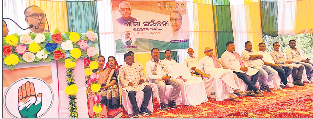
ଉପରଖଣ୍ଡରେ ଅନୁଷ୍ଠିତ କର୍ମୀ ସମ୍ମିଳନୀରେ ମଞ୍ଚାସୀନ ଦଳୀୟ ନେତୃବର୍ଗ।