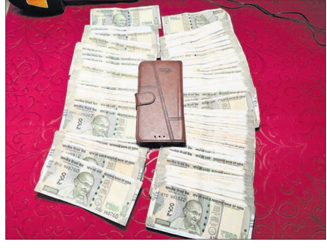
ଜବତ ନଗଦ ଦେଢ଼ ଲକ୍ଷ ଟଙ୍କା ଓ ମୋବାଇଲ୍।

ବଲାଙ୍ଗୀର ଜିଲ୍ଲା ଦେଓଗାଁ ବ୍ଲକ ରାମଚନ୍ଦ୍ରପୁରଠାରେ ଗୁରୁବାର ବିଜେଡି କର୍ମୀ ସମ୍ମିଳନୀ ଅନୁଷ୍ଠିତ ହୋଇଯାଇଛି।