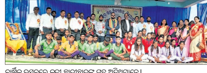
ବାର୍ଷିକ ଉତ୍ସବରେ କୃତୀ ଛାତ୍ରାଛାତ୍ରୀଙ୍କ ସହ ଅତିଥିମାନେ।

ବଲାଙ୍ଗୀର ଜିଲ୍ଲା ମୁରିବାହାଲ ବ୍ଲକ ଶିରୋଲ ଉଚ୍ଚ ବିଦ୍ୟାଳୟର ବାର୍ଷିକ ଉତ୍ସବ ଗୁରୁବାର ଅନୁଷ୍ଠିତ ହୋଇଯାଇଛି।