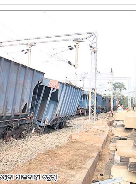
ଲାଲନଗୁଡ଼ର ହୋଇଥିବା ମାଲବାହୀ ଟ୍ରେନ।