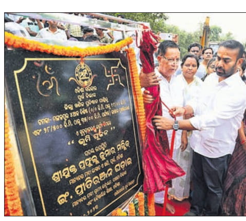
ଭିତ୍ତିପ୍ରସ୍ତର ସ୍ଥାପନର ୩ ମାସ ପରେ ବି ଚମ୍ପା-ମଙ୍ଗଳପୁର ୪ ଅଧିଆ ରାସ୍ତା କାମ ଆରମ୍ଭ ହୋଇପାରିନାହିଁ।

ଗଛରେ ପିଟିହେଲା ଆୟୁଲାବୁ: ଶିଶୁ ମୃତ, ୪ ଗୁରୁତର