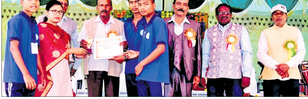
ଅତିଥିମାନେ ଜଣେ କୃତୀ ଛାତ୍ରକୁ ପୁରସ୍କୃତ କରୁଛନ୍ତି।