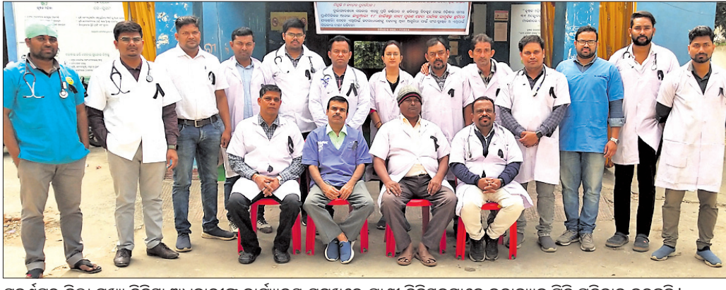
ସୁବର୍ଣ୍ଣପୁର ଜିଲ୍ଲା ମୁଖ୍ୟ ଚିକିତ୍ସା ଅଧିକାରୀଙ୍କ କାର୍ଯ୍ୟାଳୟ ସମ୍ମୁଖରେ ପ୍ରାଣୀ ଚିକିତ୍ସକମାନେ କଳାବ୍ୟାଜ୍ ପିନ୍ଧି ପ୍ରତିବାଦ କରୁଛନ୍ତି।

ପ୍ରାଣୀ ଚିକିତ୍ସକଙ୍କର ଦୀର୍ଘଦିନର ଦାବିଗୁଡ଼ିକ ପ୍ରତି ରାଜ୍ୟ ସରକାର ଅଗଣେଷା କରି ଆସୁଛନ୍ତି। ସରକାରୀ ଉଦ୍ୟୋଗରେ ପ୍ରତିବନ୍ଧରେ ସୁବର୍ଣ୍ଣପୁର ଜିଲ୍ଲାର ସମସ୍ତ ୨୩ ଜଣ ପ୍ରାଣୀ ଚିକିତ୍ସକ ଗୁରୁବାର ସାମୂହିକ ଛୁଟି ନେଇଛନ୍ତି। ଏ ସମ୍ପର୍କରେ ଜିଲ୍ଲାର ପ୍ରାଣୀ ଚିକିତ୍ସକମାନେ ଜିଲ୍ଲାପାଳ, ଏସପି ଓ ଜିଲ୍ଲା ମୁଖ୍ୟ ପ୍ରାଣୀ ଚିକିତ୍ସା ଅଧିକାରୀଙ୍କୁ ଲିଖିତ ଭାବେ ଜଣାଇଛନ୍ତି। ମୁଖ୍ୟମନ୍ତ୍ରୀ ଏହି ଘଟଣାରେ ହସ୍ତକ୍ଷେପ କରିବାକୁ ପ୍ରାଣୀ ଚିକିତ୍ସକମାନେ ନିବେଦନ କରିଛନ୍ତି।