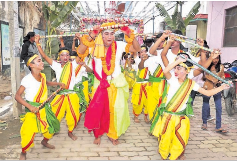
ଗୋପାଳ ବାଳକଙ୍କ ଗୋପପାଠ ପରିକ୍ରମା ।