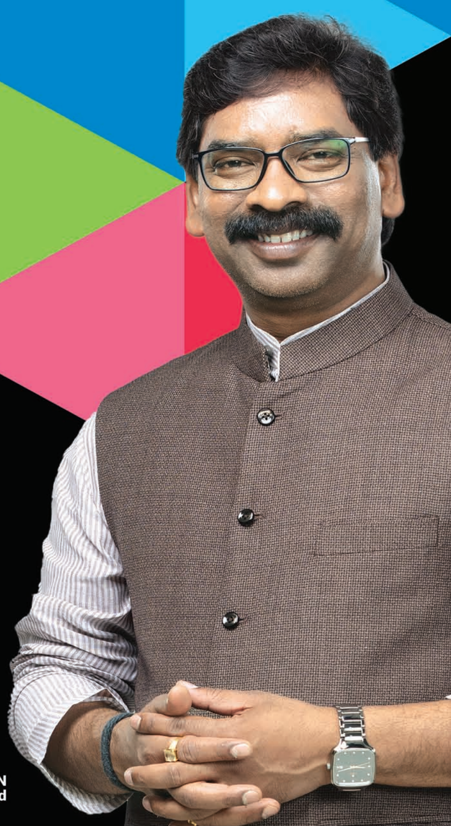
HEMANT SOREN Chief Minister, Jharkhand

STADIUM ENTRY (FOR SPECTATORS) 08:30 am Onwards