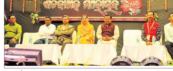
ଶତବାର୍ଷିକ ସମାରୋହର ଉଦ୍‌ଘାଟନୀ ସଭାରେ ମଞ୍ଚାସୀନ ଅତିଥି।

ବଲାଙ୍ଗୀର ଜିଲ୍ଲା ମୁରିବାହାଲ ବ୍ଲକ ସହକର୍ମୀ ପ୍ରାଥମିକ ବିଦ୍ୟାଳୟର ଶତବାର୍ଷିକ ଉତ୍ସବ ଗୁରୁବାର ବିଦ୍ୟାଳୟ ପରିସରରେ ଉଦ୍‌ଘାଟିତ ହୋଇଛି।