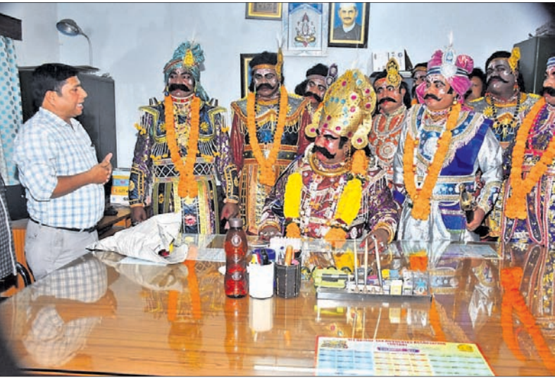
ମଥୁରାନଗରୀ ବାଣିଜ୍ୟକାରୀ ଅଧିକାରୀଙ୍କୁ କ୍ୟୁ ମହାରାଜଙ୍କ ଚାରିବା ।