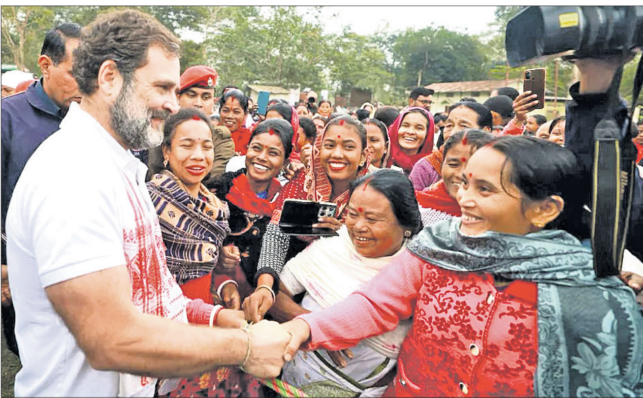
ଆସାମର ଜୋରହାଟରେ କଂଗ୍ରେସ ନେତା ରାହୁଲ ଗାନ୍ଧୀ ନ୍ୟାୟ ଯାତ୍ରାରେ ପହଞ୍ଚିବା ସହ ଶାନ୍ତ ମିଳାଉଛନ୍ତି।

କଂଗ୍ରେସର 'ଭାରତ ଯୋଡ଼ୋ ନ୍ୟାୟ ଯାତ୍ରା' ଗୁରୁବାର ପଞ୍ଚମ ଦିବସରେ ଆସାମରେ ପହଞ୍ଚିବାବେଳେ ସେଠାକାର ମୁଖ୍ୟମନ୍ତ୍ରୀ ହିମାନ୍ତ ବିଶ୍ୱଶର୍ମାଙ୍କ ସରକାର ଉପରେ କଂଗ୍ରେସ ନେତା ରାହୁଲ ଗାନ୍ଧୀ ବର୍ତ୍ତୁଛନ୍ତି। ହିମାନ୍ତ ଦେଶର ସରୁରୁ ଦୁର୍ନୀତିଗ୍ରସ୍ତ ମୁଖ୍ୟମନ୍ତ୍ରୀ ବୋଲି ରାହୁଲ ନ୍ୟାୟ ଯାତ୍ରାରେ ଉଦ୍‌ଘୋଷଣା ଦେଇ କହିଛନ୍ତି। କେବଳ ହିମାନ୍ତ ନୁହଁନ୍ତି, ତାଙ୍କ ସ୍ତ୍ରୀ ଓ ପରିବାରର ଅନ୍ୟ ସଦସ୍ୟ ମଧ୍ୟ ଦୁର୍ନୀତିରେ ଜଡ଼ିତ। ସେ ଆସାମର ଲୋକମାନଙ୍କୁ କ୍ଷିପାରିବେ ବୋଲି ଭାବୁଛନ୍ତି। ତାଙ୍କର ଏଭଳି ଚିନ୍ତାଧାରା ଭୁଲ୍ ବୋଲି ଖ୍ୟାତନାମା ସମ୍ପାଦକ ହିମାନ୍ତ ସହ ପୁଣିଥରେ ଭାଜପା ଏବଂ ରାଷ୍ଟ୍ରୀୟ ସ୍ୱୟଂସେବକ ସଂଘକୁ ଚାର୍ଜେଟ୍ କରିଛନ୍ତି। ସେମାନେ ଦେଶରେ ଦୁର୍ଗାଧାର ପ୍ରସାର କରାଇବା ସହ ଗୋଟିଏ ଧର୍ମର ଅନୁଗାମୀ ହୋଇ ଅନ୍ୟମାନଙ୍କ ବିରୋଧରେ ଲଢ଼େଇ କରିବାକୁ ପ୍ରବର୍ତ୍ତାଉଛନ୍ତି ବୋଲି ରାହୁଲ କହିଥିଲେ। ଗୁରୁବାର ନାଗାଲାଣ୍ଡର ଦୁଇ ଅଞ୍ଚଳରୁ ଯାତ୍ରା ଆରମ୍ଭ ହୋଇ ସକାଳ ୯ଟା ସମୟରେ ଶିବସାଗର ଜିଲ୍ଲାର ହଲୌଡିଙ୍ଗ ଦେଇ ଆସାମରେ ପ୍ରବେଶ କରିଥିଲେ। ପରେ ଏହି ଯାତ୍ରା ଜୋରହାଟ ଜିଲ୍ଲାରେ ପହଞ୍ଚିବା ପରେ ରାହୁଲ ଓ ଅନ୍ୟମାନେ ସେଠାରେ ରାତ୍ରିଯାପନ କରିଛନ୍ତି। ଶୁକ୍ରବାର ସକାଳେ ସେମାନେ ମଲୁଲି ଜିଲ୍ଲା ଅଭିଯୁକ୍ତ ବାହାରିବେ। ଗୁରୁବାର ମଧ୍ୟାହ୍ନରେ ଆସାମ ଜୋରହାଟରେ ନ୍ୟାୟ ଯାତ୍ରା ପହଞ୍ଚିବା ପରେ ସେଠାରେ ସରକାରଙ୍କ ନୂଆ ଯୋଜନାର ଫର୍ମ