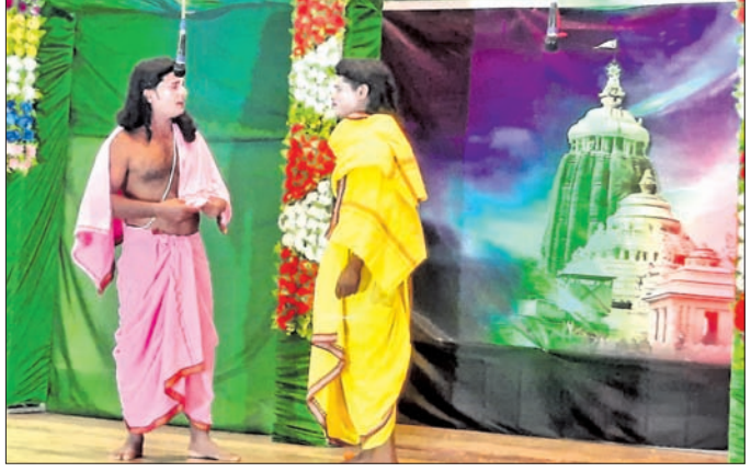
ଗୀତିନାଟ୍ୟ ଲକ୍ଷ୍ମୀପୁରାଣର ଏକ ଦୃଶ୍ୟ।