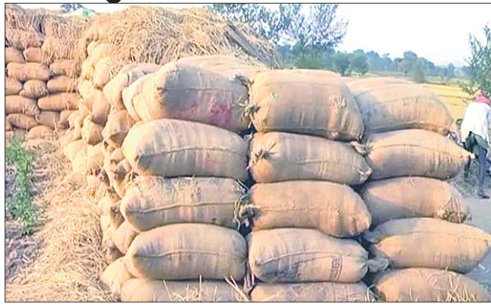
ମହାକାଳପଡ଼ା ଚାଷୀଙ୍କ ଧାନ ବିକ୍ରି ନ ହୋଇ ପଡି ରହିଛି ।

ଉଠାଇ ନ ଥିବା ଅଭିଯୋଗ ହେଉଛି । ସରକାରୀ ମଣ୍ଡିର ଏହି ଅବ୍ୟବସ୍ଥା ପାଇଁ ଅଭାବୀ ବିକ୍ରି ଆରମ୍ଭ ହୋଇଯାଇଛି । ବେପାରୀ ଓ ଅଧିକାରୀ ମାଲାମାଲ ହେବା ପାଇଁ ଅଭାବୀ ବିକ୍ରୀକୁ ପ୍ରୋତ୍ସାହିତ କରୁଥିବା ଦର୍ଶାଇ ଚାଷୀ ଆନ୍ଦୋଳନ କରିବାକୁ ଚେତାବନୀ ଦେଉଛନ୍ତି ।