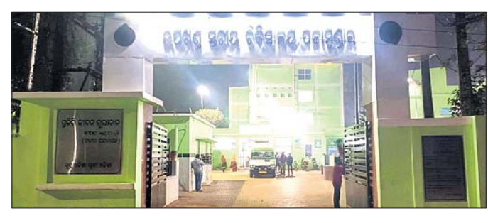
ବଡ଼ ମେଡିକାଲ ଯାଉଛନ୍ତି । ଉପଖଣ୍ଡ ଡିକିଏଲୟରେ ୩୮ ଡାକ୍ତର ରହିବାର ବ୍ୟବସ୍ଥା ଥିବା ବେଳେ ଡାକ୍ତରଖାନା ଅଧୀନରେ ୮ ଜଣ ଡାକ୍ତର କାର୍ଯ୍ୟରତ ଅଛନ୍ତି ।