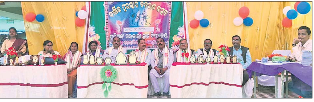
ବାର୍ଷିକ ଉତ୍ସବରେ ମହାଧାନ ଅତିଥିବୃନ୍ଦ ।