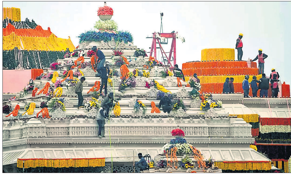
ପ୍ରାଣ ପ୍ରତିଷ୍ଠା ପୂର୍ବରୁ ଅଯୋଧ୍ୟା ରାମମନ୍ଦିର ପରିସରକୁ ସଜାଯାଇଛି।