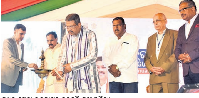
ପୁସ୍ତକ ମେଳା ଉଦ୍ଘାଟନ କରୁଛନ୍ତି ମୁଖ୍ୟଅତିଥି ।

ଭାଷା ଦ୍ରବ୍ୟ ନୁହେଁ ଆତ୍ମିୟତା ବୃଦ୍ଧି କରେ । ସମ୍ବଲପୁର ପିଏସ୍.ଟି ପଢ଼ିଆରେ ସ୍ୱେଚ୍ଛାସେବୀ ସଂଗଠନ 'ସେବୁ'ର ସହଯୋଗ ତଥା କେନ୍ଦ୍ର ଶିକ୍ଷା ମନ୍ତ୍ରାଳୟ ଅଧୀନ କାତାୟ ଟ୍ରଷ୍ଟ ଟ୍ରଷ୍ଟ ଲଣ୍ଡିଆ (ଏନ୍.ସି.ଟି) ଆନୁକୂଲ୍ୟରେ ଆୟୋଜିତ ୨୪ତମ ପୁସ୍ତକ ମେଳାକୁ ରବିବାର ଉଦ୍ଘାଟନ କରି କେନ୍ଦ୍ର ଶିକ୍ଷାମନ୍ତ୍ରୀ ଧର୍ମେନ୍ଦ୍ର ପ୍ରଧାନ ଏହା କହିଛନ୍ତି । ସେ କହିଛନ୍ତି, ଅଷ୍ଟମ ଶ୍ରେଣୀ ପର୍ଯ୍ୟନ୍ତ ସ୍ଥାନୀୟ ଭାଷାକୁ ସାମିଲ କରିବା ଦାୟିତ୍ୱ କେନ୍ଦ୍ର ଶିକ୍ଷା ବିଭାଗର । ଆଗାମୀ ଦିନରେ ଅଞ୍ଚଳର କଳା, ସଂସ୍କୃତି, ପରମ୍ପରା, ଇତିହାସକୁ ପାଠ୍ୟପୁସ୍ତକରେ ରୂପାନ୍ତରଣ କରାଯାଇ ବିଦ୍ୟାଳୟ ପାଠ୍ୟକ୍ରମରେ ସାମିଲ