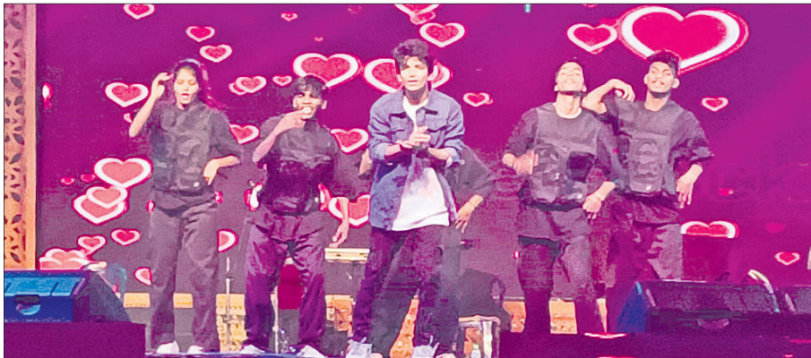
ଦେବଗଡ଼ ଉତ୍ସବ ପ୍ରଧାନପାଟ-୨୦୨୪ ଚତୁର୍ଥ ସଂଖ୍ୟାରେ ଚଳଚ୍ଚିତ୍ର ଅଭିନେତା ଶୈଳେନ୍ଦ୍ର ନୃତ୍ୟ ପରିବେଷଣ କରୁଛନ୍ତି।