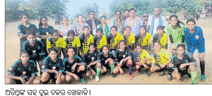
ଅତିଥିଙ୍କ ସହ ଦୁଇ ଦଳର ଖେଳାଳି ।