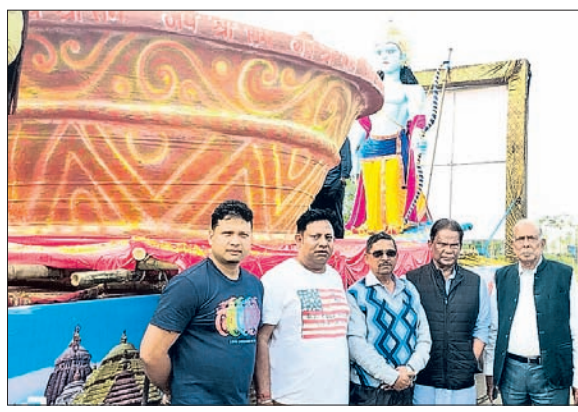
ରାଜନେତା ବସନ୍ତପୁତ୍ରୀଙ୍କୁ ବିଶାଳ ଦୀପ ସହ ଦିଲାପ ରାୟ।