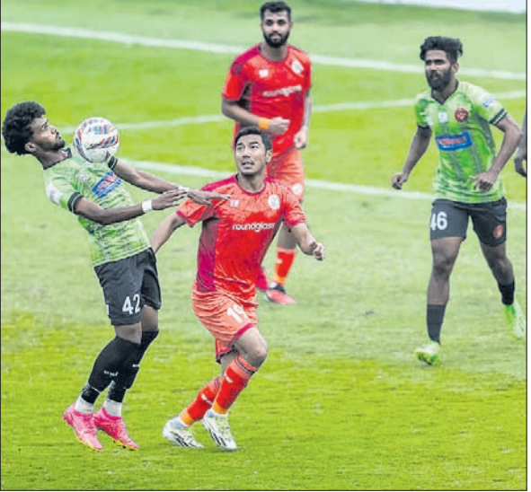
ପଞ୍ଜାବ ଏଫ୍ସି ଓ ଗୋକୁଳମ୍ କେରଳ ମଧ୍ୟରେ ଅନୁଷ୍ଠିତ ମ୍ୟାଚ୍।