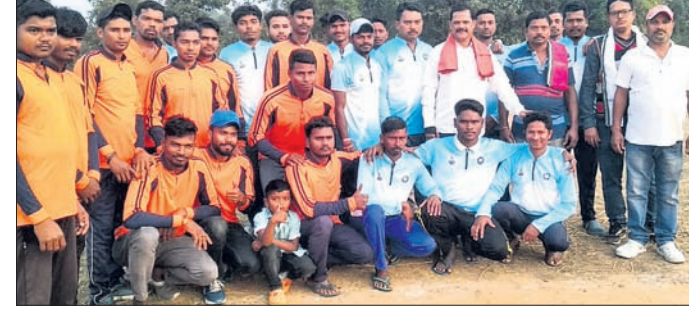
କ୍ରିକେଟ୍ ଦଳକୁ ପୁରସ୍କୃତ କରୁଛନ୍ତି ଅତିଥି ।