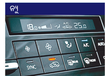
ଡିଜିଟାଲ୍ ଡ୍ରାଇଭର୍ ଅସୋମେଟିବ୍ ଟେମ୍ପରେଚର୍ କଣ୍ଟ୍ରୋଲ୍ (DATC)