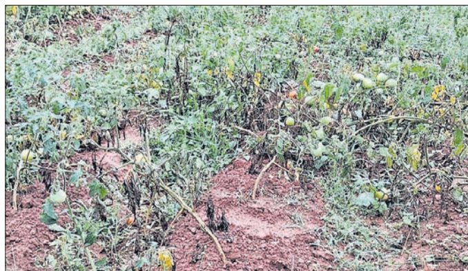
ଅଦିନିଆ ବର୍ଷାରେ ଚମାଟୋ ଫସଲ ନଷ୍ଟ ହୋଇଛି।

ସୁନ୍ଦରଗଡ଼ ଜିଲ୍ଲା ସମେତ ରାଉରକେଲାରେ ଅଦିନିଆ ବର୍ଷା ଯୋଗୁ ପରିସରିବା ଚାଷ କ୍ଷତିଗ୍ରସ୍ତ ହୋଇଛି। ରାଉରକେଲା ନିକଟ ନୂଆଗାଁ, ବିଶ୍ୱା, କୁଆଁରମୁଣ୍ଡା ଓ ଲାଠିକଟା ଆଦି କ୍ଷେତ୍ରରେ ଏଭଳି ବ୍ୟାପକ ଫସଲ ନଷ୍ଟ ହୋଇଛି। ବର୍ଷା ପାଣି ଜମିରହି ହେତୁ ହେତୁ ଫସଲ ଫସଲ ସୂକ୍ଷ୍ମ। ଫଳରେ ପାଟିଲା ଚମାଟୋ ତୋଳା ମକ୍ଷୁରି ଉଠିବା ନେଇ ଚାଷୀମାନେ ଆଶଙ୍କା ପ୍ରକାଶ କରିଛନ୍ତି। ଉକ୍ତ କ୍ଷେତ୍ରରେ ଶୀତଳ ଭଣ୍ଡାର ସକ୍ରିୟ ନ ଥିବା ଯୋଗୁ ସ୍ଥିତି ସଙ୍ଗୀନ ହୋଇଛି। ଫଳରେ ସେମାନେ କମ୍ ଦରରେ ବେପାରୀଙ୍କୁ ଉପ୍‌ଦିତ ଫସଲ ବିକ୍ରମ ପାଇଁ ବ୍ୟସ୍ତ ହୋଇଛନ୍ତି।