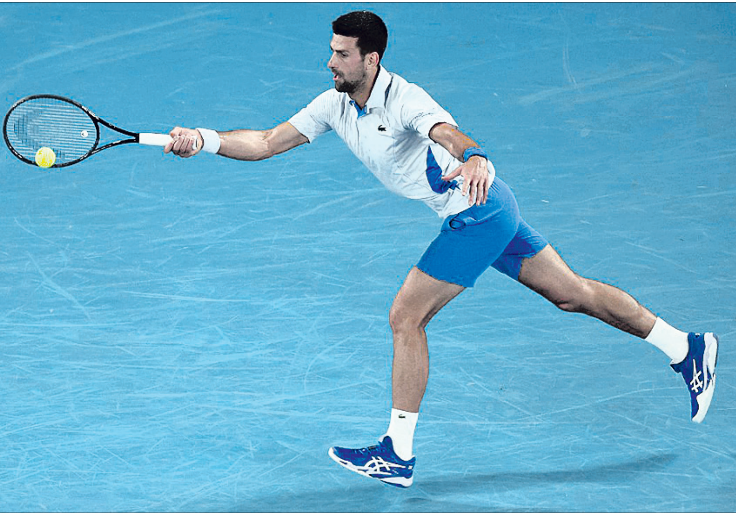
ଅଷ୍ଟ୍ରେଲିଆନ୍ ଓପନ୍ ପ୍ରାୟଦ୍ କ୍ୱାର୍ଟର ମ୍ୟାଚ୍ରେ ଏକ ଶର୍ ଷ୍ଟେଲୁଇଡି ନୋଭାକ ଜୋକୋଭିଚ୍।