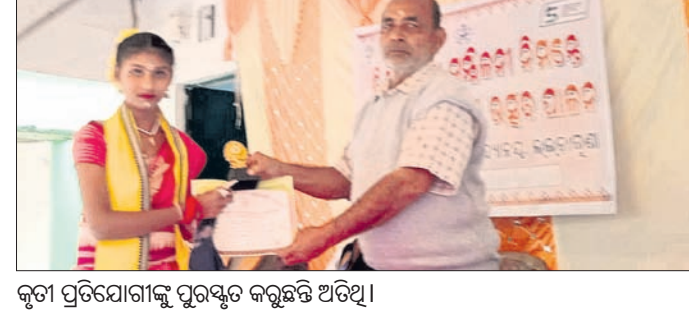
କୃତୀ ପ୍ରତିଯୋଗୀକୁ ପୁରସ୍କୃତ କରୁଛନ୍ତି ଅତିଥି ।