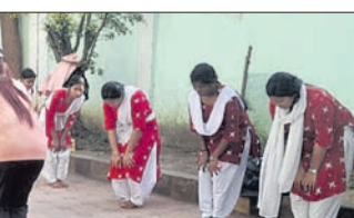
ମାଷ୍ଟର ପ୍ରଶିକ୍ଷିକା ଛାତ୍ରୀମାନଙ୍କୁ ପ୍ରଶିକ୍ଷଣ ପ୍ରଦାନ କରୁଛନ୍ତି।

ରାଉରକେଲା, ୨୧।୧ (ବିଭୁବ ରଞ୍ଜନ ଦାଶ) ରାଉରକେଲା ସେକ୍ଟର-୨ ସ୍ଥିତ ଖାଦ୍ୟ ନିରାପତ୍ତା ଆଇନ୍ ଅନୁଯାୟୀ ଲାଇସେନ୍ସ କିମ୍ବା ପଞ୍ଜିକରଣ କରି ଖାଦ୍ୟ ବ୍ୟବସାୟ କରିବା ପାଇଁ ସେମାନଙ୍କୁ ତାରିବ କରାଯାଇଥିବା ଜଣାପଡ଼ିଛି। ଏହି ନିର୍ମିତ ଚଢ଼ାଉ ଆଗାମୀ ଦିନରେ ଜାରି ରହିବା ସହ, ଲକ୍ଷ୍ମଣାପଡ଼ା ବିଭାଗରେ ଦୂର କାର୍ଯ୍ୟାନୁଷ୍ଠାନ ଗ୍ରହଣ କରାଯିବ ବୋଲି ତତ୍ତ୍ୱାବଧାନ ସୂଚନା ଦେଇଛନ୍ତି।