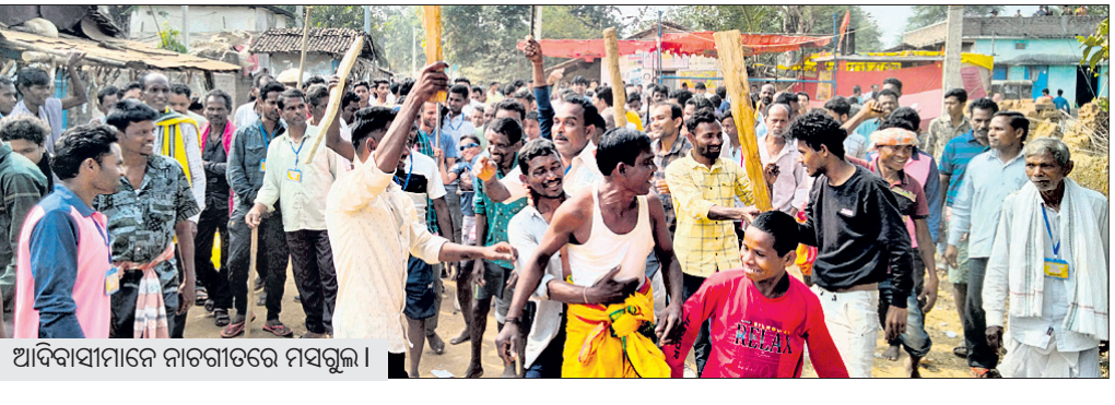
ଆଦିବାସୀମାନେ ନାଚଗାତରେ ମସରୁଲ।