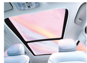
ଭଏସ୍ ସମନିତ ସ୍ମାର୍ଟ ପାନୋରାମିକ୍ ସନ୍‌ରୁଫ୍