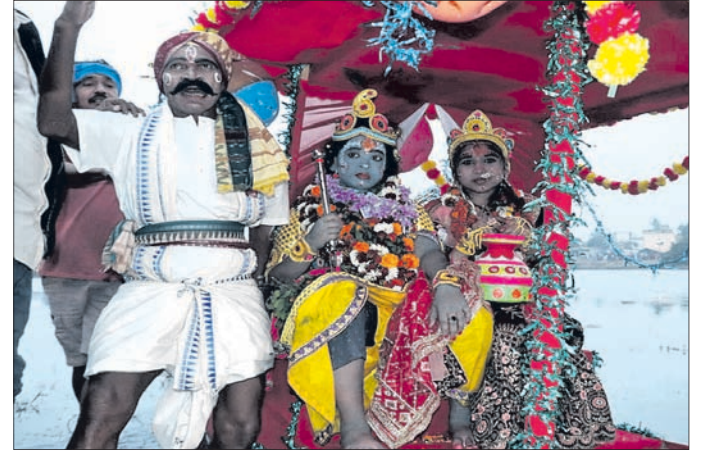
ମନାବନ୍ଧରେ ରାଧାକୃଷ୍ଣଙ୍କ ନାବକେଳି ଦୃଶ୍ୟାଭିନୟ ।

ମଥୁରାନଗରୀ/ଗୋପପୁର, ୨୧।୧ (ପ୍ରେମାନନ୍ଦ ଖମାରି)