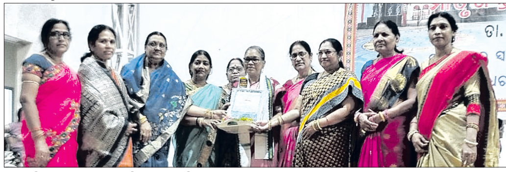
କଳାହାଣ୍ଡି ଲେଖିକା ସଂଘକୁ ସମ୍ମାନିତ କରାଯାଇଛି।