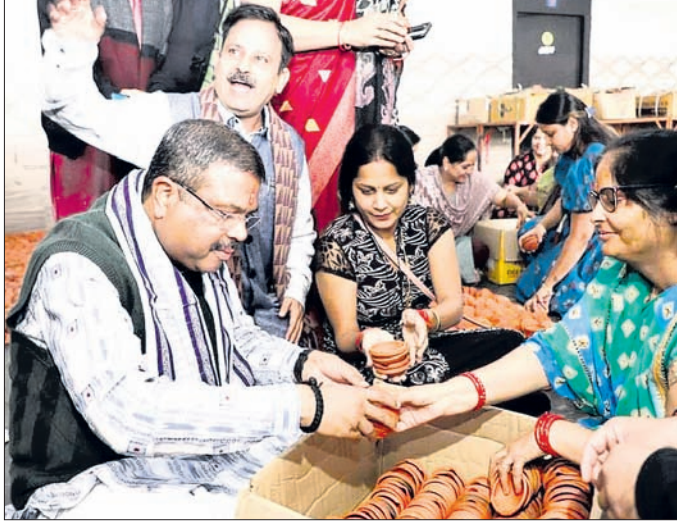
ଦୀପୋତ୍ସବ ପ୍ରସ୍ତୁତି କାର୍ଯ୍ୟରେ ସାମିଲ ହୋଇଥିବା କେନ୍ଦ୍ରମନ୍ତ୍ରୀ ।

ଆୟତ୍ତାରେ ଭବ୍ୟ ଶ୍ରୀରାମ ମନ୍ଦିର ପ୍ରତିଷ୍ଠା ଉତ୍ସବ ଯୋଗବାର ଅନୁଷ୍ଠିତ ହେବ । ଏଥିପାଇଁ ସାରା ଦେଶ ଉତ୍ସବମୁଖରେ ହୋଇଉଠିଛି । ଦେଶ କୋଣ ଅନୁକୋଣରେ ଏଥିପାଇଁ ବିଭିନ୍ନ କାର୍ଯ୍ୟକ୍ରମ ଆୟୋଜନ କରାଯାଇଛି । ସମ୍ବଲପୁର ମହାନଦୀର ଆୟତ୍ତା ସମେତ ଘାଟରେ ମାରଣାତି ମୁଦାମାଞ୍ଚ ପକ୍ଷରୁ ୧,୧୧,୧୧୧ ଦୀପ କଳାଭବ୍ୟ ଭଙ୍ଗରେ ସାଗତ କରିବାକୁ ନିଷ୍ପତ୍ତି ନିଆଯାଇଛି । ଏ ନେଇ ମାରଣାତି ମୁଦାମାଞ୍ଚ ଓ ନବଚେତନା ମଞ୍ଚର ସଦସ୍ୟା ପ୍ରସ୍ତୁତିରେ ଲାଗିଛନ୍ତି । ଚାଉଁରପୁର ଗାଁରୁ ପହଞ୍ଚିଥିବା ଦୀପଗୁଡ଼ିକୁ ପାଣିରେ ଧୋଇ ଶୁଣାଇବା ସହ ବଡ଼ ଡିଆରି କରୁଛନ୍ତି । କେନ୍ଦ୍ରମନ୍ତ୍ରୀ ଧର୍ମେନ୍ଦ୍ର ପ୍ରଧାନ ସମ୍ବଲପୁର ଗସ୍ତରେ ଥିବାବେଳେ ରବିବାର ମହାତ୍ମା ଗାନ୍ଧୀ ମାର୍ଗସ୍ଥିତ ପୂର୍ଣ୍ଣାମ ଭବନରେ ପହଞ୍ଚି ଦୀପୋତ୍ସବ ପାଇଁ ଚାଲିଥିବା ପ୍ରସ୍ତୁତିରେ ସାମିଲ ହୋଇ ମୁଦାମାଞ୍ଚର ଏହି କାର୍ଯ୍ୟକୁ ପ୍ରଶଂସା କରିଥିଲେ । ସେ ମହିଳାମାନଙ୍କ ସହ କିଛିସମୟ ବଡ଼ ଡିଆରି କରିବା