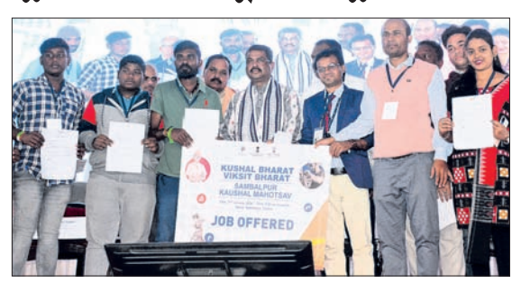
ଯୁବତୀ ଯୁବକଙ୍କୁ କେନ୍ଦ୍ରମନ୍ତ୍ରୀ ନିଯୁକ୍ତିପତ୍ର ପ୍ରଦାନ କରୁଛନ୍ତି।

ଭାବେ ଗ୍ରହଣ କରାଯିବା ସହ ଏକାଡେମିକ୍ ବ୍ୟାଚ୍ ଅଫ୍ କ୍ରେଡିଟ୍ ଭଳି ପଦକ୍ଷେପ ନିଆଯାଇଛି ବୋଲି ଧର୍ମେନ୍ଦ୍ର କହିଥିଲେ।