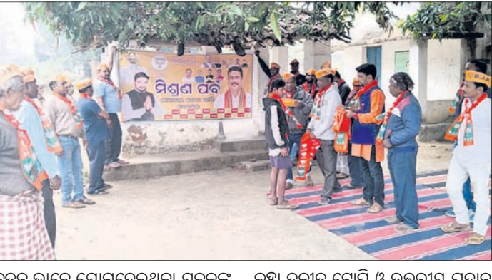
ନୂତନ ଭାବେ ଯୋଗଦେଇଥିବା ଯୁବକଙ୍କୁ ଭାଜପା ରାଜ୍ୟ କାର୍ଯ୍ୟକାରୀ ସଦସ୍ୟ ପୂର୍ବକ ଦଳକୁ ସ୍ୱାଗତ କରିଥିଲେ ।