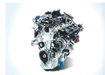
ପାୱାର୍ଟ୍ରେନ୍‌ର ଚଏସ୍ 1.5i PL, 1.5i DSL, 1.5i PL ଟର୍ବୋ MT, AT, DCT ଏବଂ IVT