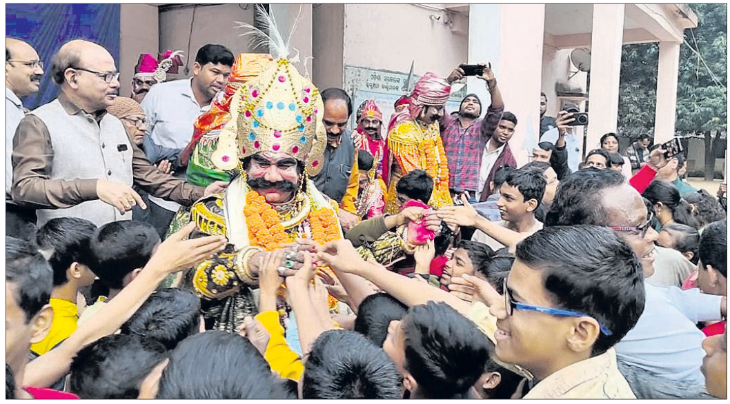
ମଥୁରା ଭ୍ରମଣ ବାଟରେ ପିଲାମାନେ କଂସକ ସହିତ ହାତ ମିଳାଇଛନ୍ତି ।