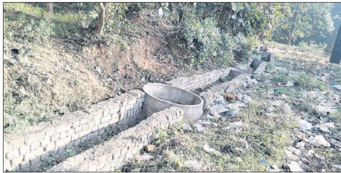
ସେକ୍ଟର-୨୦ ମିଶ୍ର ଖଟାଳ ବସ୍ତିରେ ନିର୍ମିତ ଜଳ ସଂରକ୍ଷଣ ପ୍ରକଳ୍ପ।

ରାଉରକେଲା ସହରରେ ଜଳ ସଂରକ୍ଷଣ ପାଇଁ ମୁକ୍ତା ଯୋଜନାରେ ଲକ୍ଷ୍ୟକ୍ମକ ଟଙ୍କା ଖର୍ଚ୍ଚ ହୋଇଛି। କିନ୍ତୁ ସହରରେ ଅଧାରୁ ଅଧିକ ପ୍ରକଳ୍ପ ଅଟଳ ଓ ଭଗ୍ନ ଅବସ୍ଥାରେ ପଡ଼ିରହିଥିବା ଦେଖିବାକୁ ମିଳିଛି। ଏଭଳି ଉଦ୍ଦିଷ୍ଟନଗର ସ୍ଥିତ ପରେତ ପଡ଼ିଆ, ନରି ପ୍ରଥମେ ଆରଜିଏସ୍‌ରେ ଟିକିଆ ଲାଗି ଭରି କରିଥିଲେ। ସେଠାରେ ସ୍ୱାସ୍ଥ୍ୟାବସ୍ଥା ଗୁରୁତର ହେବାରୁ ତାଙ୍କୁ ବୁଲାଇ ଗଲାବେଳେ କରାଯାଇଥିବା ବେଳେ ବାଟରେ ମୃତ୍ୟୁ ହୋଇଥିଲା।