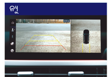
ସାରାଠକ୍ଷ୍ଣ ଭ୍ୟୁ ମନିଟର (SVM) ଏବଂ ବ୍ଲାଇଣ୍ଡ୍-ସ୍ପଟ୍ ଭ୍ୟୁ ମନିଟର (BVM)