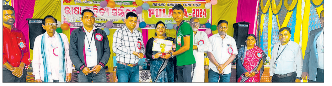
ଜଣେ ଛାତ୍ରଙ୍କୁ ପୁରସ୍କୃତ କରାଯାଇଛି ।