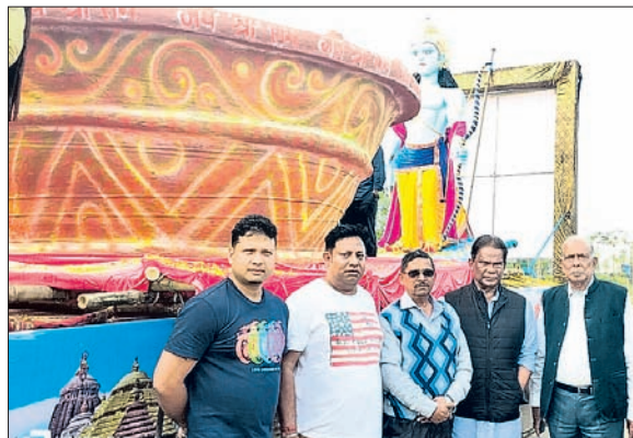
ଭୁବନେଶ୍ୱର ବିଜେଡିର ଦୀପ ସମ୍ମାନ ସମୟରେ

ଭୁବନେଶ୍ୱର, ୨୧।୧ (ସଂପାଦକଙ୍କ ରିପୋର୍ଟ) ଆଜକୁ ସାଧାରଣ ନିର୍ବାଚନ ଖୋଳାଯାଇଛି। ବିଜେଡିର କାର୍ଯ୍ୟକ୍ରମକୁ ନେଇ ଆଜି ପ୍ରତ୍ୟକ୍ଷ ଭାବରେ ପ୍ରଚାର ଆରମ୍ଭ କରି ଲୋକମାନଙ୍କ ନିକଟରେ ପହଞ୍ଚାଇବାକୁ ଲାଗିପଡିଛି।