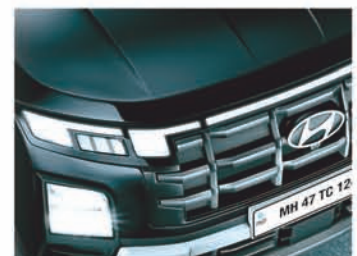
କ୍ୱାର୍ ବିମ୍ବୁ LED ଦେହଲ୍ୟାଂପ୍, ହୋରିଜୋଣ୍ଟାଲ LED ଯୋଡ଼ିପର୍ଯ୍ୟାୟ ଏବଂ DRLs