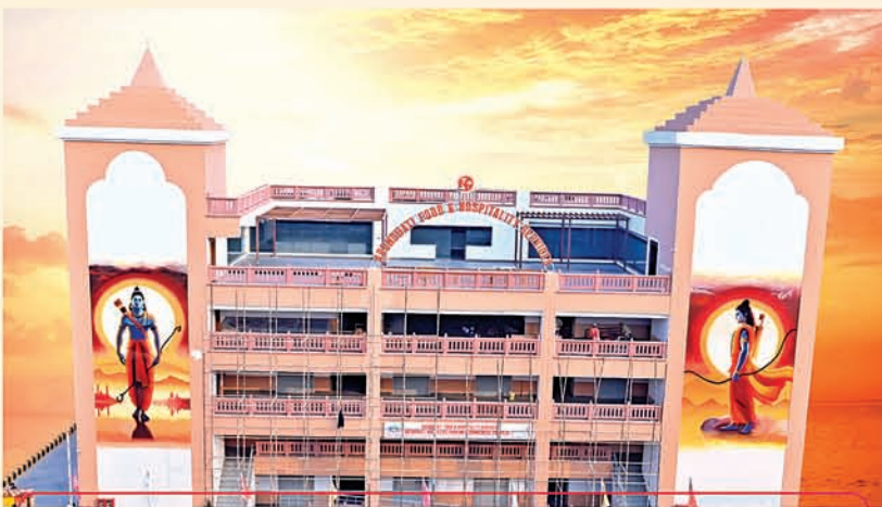
ମହର୍ଷି ଅରୁଣଜୀ ପାର୍କ ଏବଂ ବ୍ୟବସାୟିକ କମ୍ପ୍ଲେକ୍ସ