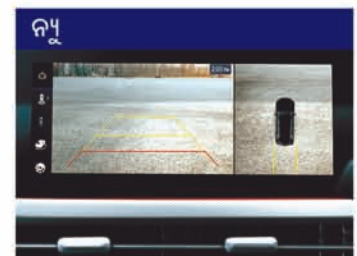
ସାରାଭିତ୍ତିକ ଭ୍ୟୁ ମନିଟର (SVM) ଏବଂ ବ୍ଲାଇଣ୍ଡ-ସ୍ପଟ୍ ଭ୍ୟୁ ମନିଟର (BVM)