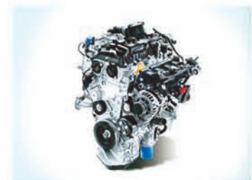
ପାଖାନ୍ତର ଚଷମ୍ବ 1.5i PL, 1.5i DSL, 1.5i PL ଟର୍ବୋ MT, AT, DCT ଏବଂ IVT