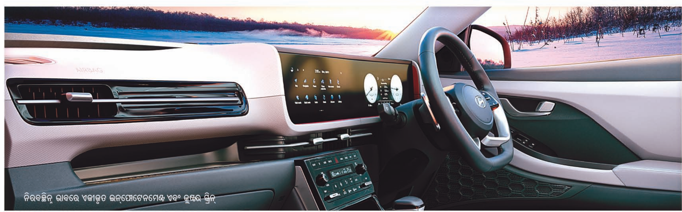
ନିରବଚ୍ଛିନ୍ନ ଭାବରେ ଏକୀକୃତ ଇନ୍ଫୋଟେନ୍ଟମେଣ୍ଟ ଏବଂ କୁଇଲ୍ ସ୍ଟିଲି