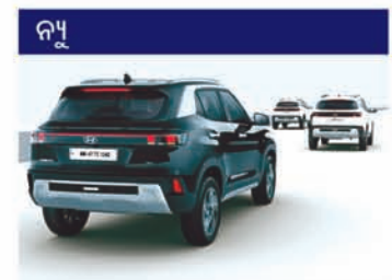
Hyundai ସ୍ମାର୍ଟସେନ୍ସ-ଇଭେଲ୍ 2 ADAS (19 ବିଶେଷତା)