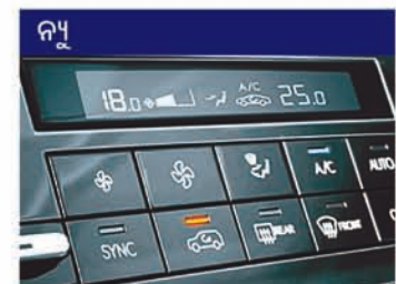
ଡୁଆଲ୍ ଗୋଲ୍ ଅଗୋମେଟିଭ୍ ଟେମ୍ପରେଚର୍ କଣ୍ଟ୍ରୋଲ୍ (DATC)