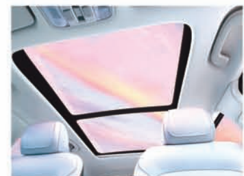
ରବ୍ ସପନିତ ସ୍ମାର୍ଟ ପାନୋରାମିକ୍ ସନ୍‌ରୁଫ୍