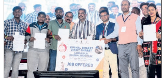
ସୁବର୍ଣ୍ଣକ ଶ୍ରେଣୀରେ ପୁରଣ କରାଯାଇଛି