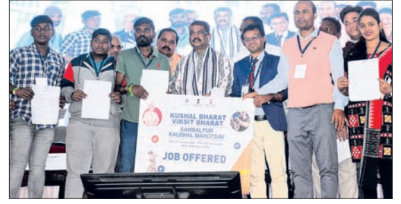
ଯୁବତୀୟବକଙ୍କୁ କେନ୍ଦ୍ରମନ୍ତ୍ରୀ ନିଯୁକ୍ତିପତ୍ର ପ୍ରଦାନ କରୁଛନ୍ତି

କୌଶଳ ମହୋତ୍ସବ ଯୋଗଦେଇ ଧର୍ମେନ୍ଦ୍ର କୌଶଳ ମହୋତ୍ସବରେ ଯୋଗଦେଇ