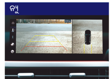
ସାରାଠକ ଉପ୍ପ ମନିଟର (SVM) ଏବଂ ବ୍ଲାଇଣ୍ଡ-ସ୍ପଟ୍ ଉପ୍ପ ମନିଟର (BVM)