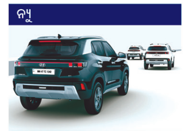
Hyundai ସ୍ମାର୍ଟସେନ୍ସ-ଲେଭେଲ୍ 2 ADAS (19 ବିଶେଷତା)