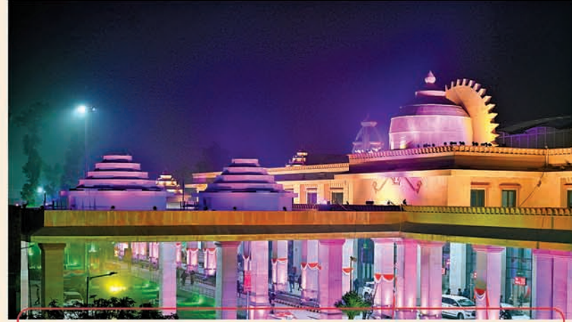
ଅଯୋଧ୍ୟା ଧାମ ଜଙ୍କସନ୍