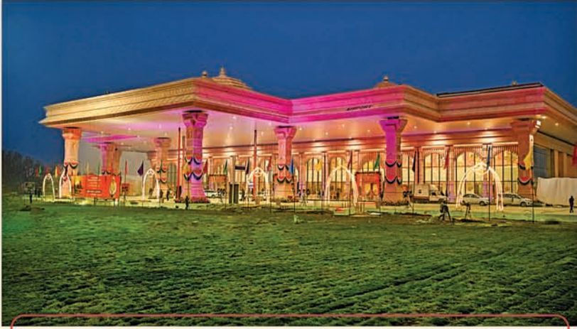
ମହର୍ଷି ବାଲ୍ମୀକି ଅନୁର୍ଜାତୀୟ ବିମାନ ବନ୍ଦର ଅଯୋଧ୍ୟା ଧାମ