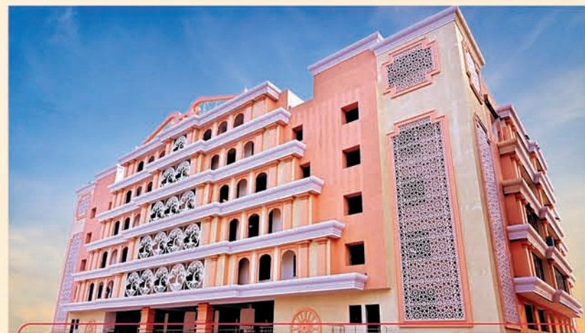
ଲକ୍ଷ୍ମଣ କୁଞ୍ଜ ସ୍ମାର୍ତ ବାହନ ପାର୍କ