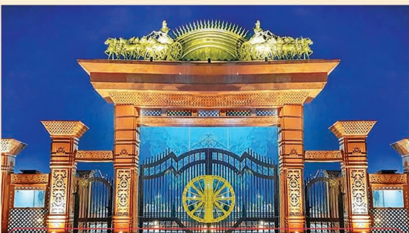
ସୂର୍ଯ୍ୟ କୁଣ୍ଡ ଦ୍ୱାର