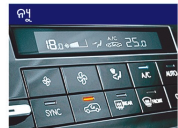
ଡୁଆଲ୍ ଭୋନ୍ ଅଟୋମେଟିକ୍ ଟେମ୍ପରେଚର୍ କଣ୍ଟ୍ରୋଲ୍ (DATC)