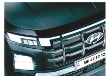
କ୍ୱାଡ୍ ବିମ୍ LED ହେଡ୍ଲ୍ୟାମ୍ପ୍, ହୋରିଜୋଣ୍ଟାଲ LED ଡେଇଁପନିଂ ଲ୍ୟାମ୍ପ୍ ଏବଂ DRLs