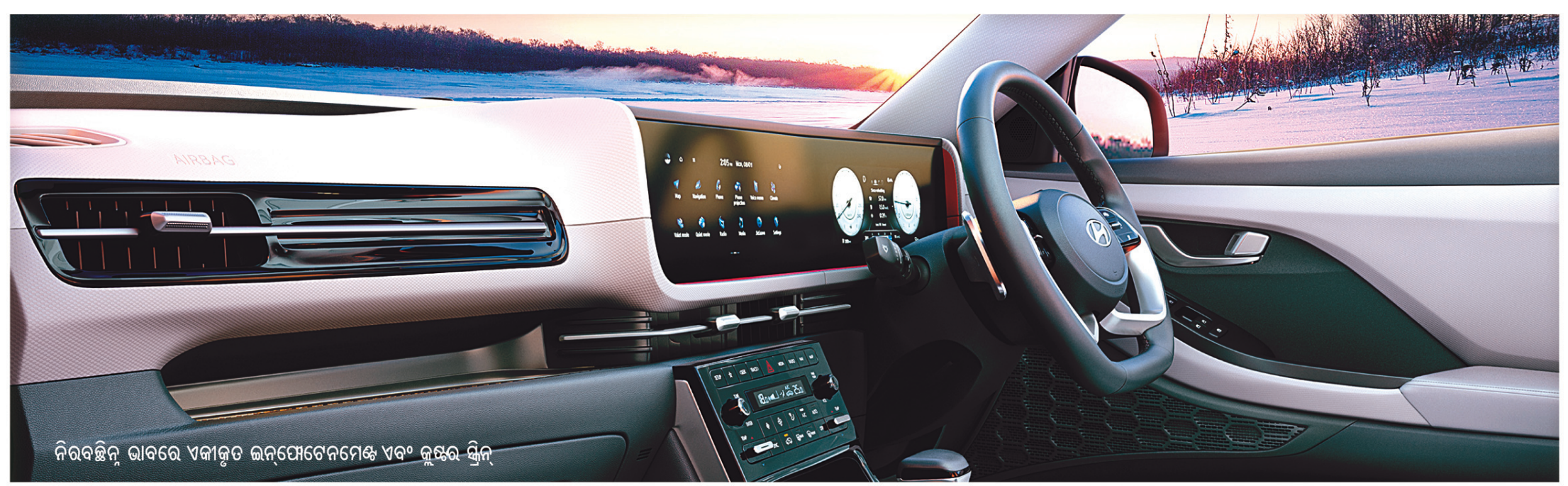
ନିରବଚ୍ଛିନ୍ନ ଭାବରେ ଏକୀକୃତ ଇନ୍ଫୋଟେନ୍ଟମେଣ୍ଟ ଏବଂ କୁଣ୍ଠର ସ୍ତ୍ରୀ