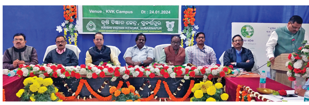
ବୈଠକରେ ଉପସ୍ଥିତ ବୈଜ୍ଞାନିକ ଓ ଅନ୍ୟ ଅଧିକାରୀ ବୃନ୍ଦ ।