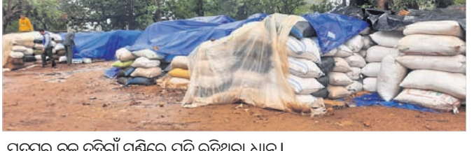
ପଦ୍ମପୁର ବୁକ୍ ଦହିଆଁ ମଣ୍ଡିରେ ପଡ଼ି ରହିଥିବା ଧାନ ।

ହେଲେ କ୍ରମରେ ବିଲୟ ଯୋଗୁ ଅନେକ ଗାଷ୍ଟା ଅଣ୍ଡରରେଚରେ ଧାନ ବେପାରୀମାନଙ୍କୁ ବିକ୍ରି କରିଦେଇଥିଲେ। ଯେଉଁ ଗାଷ୍ଟାମାନେ ମଣ୍ଡିରେ ରଖି ଏ ପର୍ଯ୍ୟନ୍ତ ବିକ୍ରି କରି ନାହାନ୍ତି ଏହି ଅଦିନିଆଁ ବର୍ଷାରେ ଭିଜି ଯାଇଛି। ସେହିପରି ବହୁ ଗାଷ୍ଟା ପ୍ରକାଶ ପାଇଛି। ଗାଷ୍ଟାମାନେ ପୂର୍ବରୁ ଏହା ଆଶଙ୍କା କରି କ୍ରୟ ପାଇଁ ଦାବି କରିଥିଲେ ମଧ୍ୟ ଗୋକନ ଓ ଗର୍ଗେଟ୍ ସମସ୍ୟା ଯୋଗୁ ଧାନ ଉଠି ପାରି ନ ଥିଲା। ଚଳିତ ଖରିଫ୍ ଋତୁରେ ଅଣ୍ଡରରେଚରେ ପଦ୍ମପୁର ଉପଖଣ୍ଡରେ ରେକର୍ଡ୍ ପରିମାଣର ଧାନ ଉତ୍ପାଦନ ହୋଇଥିଲା।