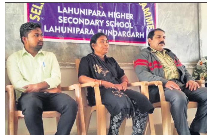
ତାଲିମ୍ ଶିବିରରେ ମଞ୍ଚାସୀନ ଅତିଥି ବୃନ୍ଦ।