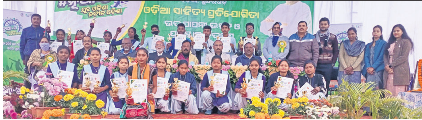
ଭୁବନେଶ୍ୱର ଜିଲ୍ଲା ବଡ଼ଗାଁ ଉଚ୍ଚ ମାଧ୍ୟମିକ ବିଦ୍ୟାଳୟରେ ଆୟୋଜିତ ଓଡ଼ିଆ ସାହିତ୍ୟ ପ୍ରତିଯୋଗିତାରେ କୃତି ଛାତ୍ରଛାତ୍ରୀ ଓ ଅନ୍ୟମାନେ।

ଭୁବନେଶ୍ୱର, ୨୫୧(ଅଶୋକ ଷଡ଼ଙ୍ଗୀ): ଭୁବନେଶ୍ୱର ଜିଲ୍ଲା ବଡ଼ଗାଁ ବ୍ଲକ କଲେଜରେ ଉଚ୍ଚ ମାଧ୍ୟମିକ ବିଦ୍ୟାଳୟରେ ଗତ ୧୬ରୁ ଆରମ୍ଭ ହୋଇଥିବା ନୂଆ ଓ ଓଡ଼ିଆ ସାହିତ୍ୟ ପ୍ରତିଯୋଗିତା ରୁପରେ ଉଦ୍ଘାଟିତ ହୋଇଯାଇଛି। ଏହି କାର୍ଯ୍ୟକ୍ରମରେ ମୁଖ୍ୟ ଅତିଥିଭାବେ ଜଗନ୍ନାଥ ସଂସ୍କୃତି ପ୍ରବନ୍ଧ ଉଦ୍ଘାଟନା କରିବା ପାଇଁ ଉପସ୍ଥିତ ଥିଲେ। ସମ୍ମାନିତ ଅତିଥିମାନେ ପ୍ରତିଯୋଗିତା ପ୍ରସ୍ତୁତ ହେବା ପାଇଁ ଉତ୍ସାହ ପ୍ରକାଶ କରିଥିଲେ।