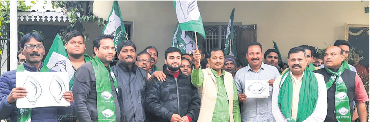
ଘରକୁ ଘର ଶଙ୍ଖ କାର୍ଯ୍ୟକ୍ରମର ଶୁଭାରମ୍ଭ ଅବସରରେ ମନ୍ତ୍ରୀ ଓ ଅନ୍ୟମାନେ ।