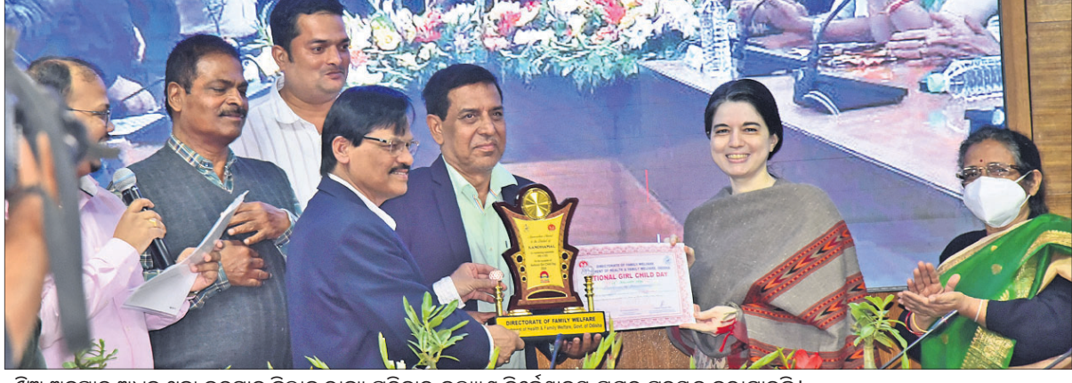
ଝିଅ ଅନୁପାତ ଅଧିକ ଥିବା କମ୍ପାନୀ ଜିଲ୍ଲାକୁ ରାଜ୍ୟ ପରିବାର କଲ୍ୟାଣ ନିର୍ଦ୍ଦେଶାଳୟ ପକ୍ଷରୁ ପୁରସ୍କୃତ କରାଯାଇଛି ।