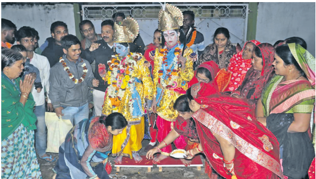
ମଥୁରାନଗରୀରେ କୃଷ୍ଣ, ବଳରାମଙ୍କୁ ପୂଜା କରାଯାଉଛି।