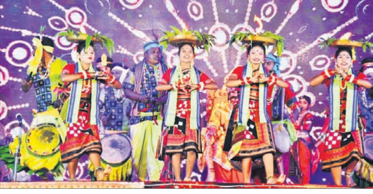
କଂସ ଦରବାରରେ ସାଂସ୍କୃତିକ କାର୍ଯ୍ୟକ୍ରମ ।