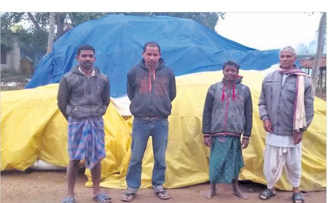
ସୁଲୁସୁଲିଆ ଧାନ କ୍ରୟକେନ୍ଦ୍ରରେ ପଡ଼ିଥିବା ଧାନ ଏବଂ ଗାଷ୍ଟାମାନେ ।