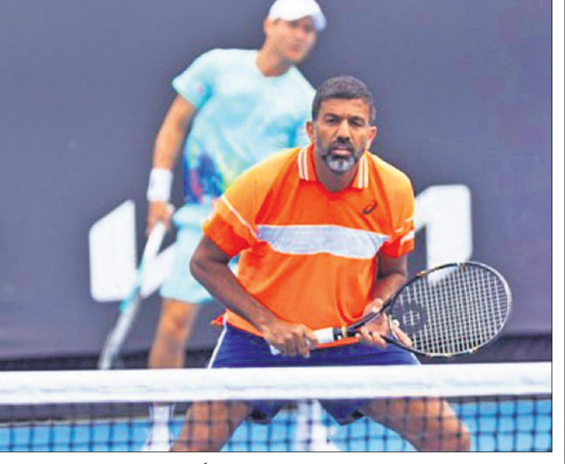
ପୁରୁଷ ଡବଲ୍ କ୍ୱାର୍ଟର ଫାଇନାଲ୍ ମ୍ୟାଚ୍‌ରେ ରୋହନ ବୋପାଳା।

ବୋପାଳା-ଏବ୍‌ଡେନ। ଚଳିତ ଟୁର୍ନାମେଣ୍ଟରେ ଦ୍ୱିତୀୟ ସିଡ୍‌ର ମାନ୍ୟତା ପାଇଥିବା ବୋପାଳା-ଏବ୍‌ଡେନ ଯୋଡ଼ି ରୁଧିରାର ମ୍ୟାଚ୍‌କୁ ୧ ଘଣ୍ଟା ୪୬ ମିନିଟ୍ ସମୟ ନେଇ ବିଜୟୀ ହୋଇଥିଲେ। ଭାରତ-ଅଷ୍ଟ୍ରେଲିଆ ଯୋଡ଼ି ସେମିଫାଇନାଲରେ ଅର୍ଦ୍ଧଶତକ ଟୋପାସ ମାକହାକ ଓ ଝିଝେନ୍ ଝାଙ୍ଗକୁ ଭେଟିବେ। ପୂର୍ବରୁ ଆମେରିକାର ରାକାବ ରାମା ୩୮ ବର୍ଷ ବୟସରେ ବିଶ୍ୱର ବୟସ୍କ ଖେଳାଳି ଭାବରେ ଏକ ନମ୍ବର ସ୍ଥାନ ଅଧିକାର କରିଥିଲେ। ତତ୍ପୂର୍ଣ୍ଣ ଭାରତୀୟ ଭାବରେ ବୋପାଳା ଏହି ମାଲକ୍ଷ୍ମ ହାସଲ କରିଛନ୍ତି। ଲିଆଣ୍ଡର ପେସ୍, ମହେଶ୍ ଭୁପତି ଓ ସାନିଆ ମିର୍ଜାଙ୍କ ପରେ ସେ ଏକାଧିକ କୃତିତ୍ୱ ହାସଲ କରିଛନ୍ତି।