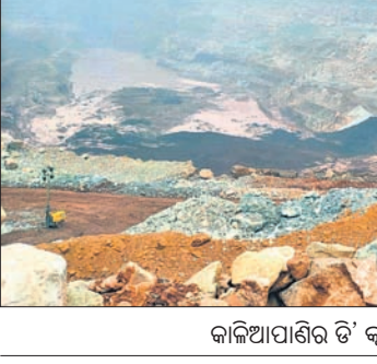
କାଳିଆପାଣିର ଡି' କ୍ୱାରି ମାଟି ଧସି ପଡ଼ିଛି।