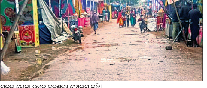
ମକର ମେଳା ଉତ୍ସବ ଜନଶୂନ୍ୟ ହୋଇଯାଇଛି।

ପାଟଣା, ୨୪।୧ (ବୀର କିଶୋର ଦାଶ) କେନ୍ଦୁଝର ଜିଲ୍ଲା ପାଟଣା ଓ ସାହାରପଡ଼ା ବ୍ଲକ୍ ଅଞ୍ଚଳରେ ମଙ୍ଗଳବାର ରାତିରୁ ଝିପି ଝିପି ବର୍ଷା, ସାଙ୍ଗକୁ କୋହଲା ପାଗ ଲାଗି ରହିଛି। କେବଳ ପାଟଣା ବ୍ଲକ୍ରେ ଗତ ୨୪ଘଣ୍ଟାରେ ୨୭.୬ମିଲି ମିଟର ବୃଷ୍ଟିପାତ ହୋଇଥିବା ପାଣିପାଗ ବିଭାଗ ପକ୍ଷରୁ ରେକର୍ଡ କରାଯାଇଛି। ବୁଧବାର ପାଟଣା ସାମୁଦ୍ରିକ ହାତ, ବଜାର, ସାହାରପଡ଼ା ଓ ଚୁରୁକୁଳା ବଜାର, ବସଷ୍ଟା, ସର୍ବ ସାଧାରଣ ସ୍ଥଳ ଖାଁ ଖାଁ ଲାଗୁଥିଲା। ବର୍ଷା ଯୋଗୁ ଧାନମଣ୍ଡିଗୁଡ଼ିକରେ ଥିବା ଧାନକୁ ଚାଷୀ ପାଇଁ ଯୋଡ଼ାଇ ରଖିଛନ୍ତି।