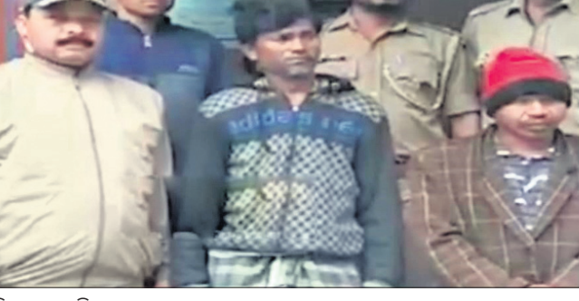
ଗିରଫ ୨ ଅଭିଯୁକ୍ତ।

କେନ୍ଦୁଝର, ୨୪।୧ (ନୀଳମଣି ମଣ୍ଡଳ) କେନ୍ଦୁଝର ଜିଲ୍ଲା ଘଟଗାଁ ବ୍ଲକ୍ ବାରହାଟିପୁରାଠାରେ ଥିବା ପୌରାଣିକ ଶୈବପୀଠ ବାବା ନାଳ କଣ୍ଠେଶ୍ୱରଠାରେ ପ୍ରତ୍ୟକ୍ ବର୍ଷ ମକର ସଂକ୍ରାନ୍ତିଠାକୁ ଦୀର୍ଘ ୧୫ ଦିନ ଧରି ରାଜ୍ୟର ସର୍ବ ବୃହତ୍ତମ ମକର ମେଳା ଅନୁଷ୍ଠିତ ହୋଇଥାଏ। ମେଳାକୁ ରାଜ୍ୟ ତଥା ରାଜ୍ୟ ବାହାରର ଭକ୍ତ ଆସି ବାବା ନାଳ କଣ୍ଠେଶ୍ୱରଙ୍କୁ ଦର୍ଶନ କରିଥାନ୍ତି। ଦେବତୋର ବିଭାଗ ଦ୍ୱାରା ଉକ୍ତ ମନ୍ଦିର ପରିଚାଳିତ ହେଉଥିବା ବେଳେ ପ୍ରତ୍ୟେକ ବର୍ଷ ମକର ମେଳାରେ ଏଠି ଭିଡ଼ ଜମିଥାଏ। ମାତ୍ର ଚଳିତ ବର୍ଷ ପାଗ କୋହଲା ସାଙ୍ଗକୁ ବର୍ଷା ଲାଗି ରହିଥିବାରୁ ଲୋକମାନେ ପଦାକୁ ବାହାରି ପାରୁନାହାନ୍ତି। ଫଳରେ ବ୍ୟବସାୟୀଙ୍କ ଘୋର କ୍ଷତି ଘଟିଛି। ଶୀତର ପ୍ରକୋପ ବଢ଼ିବା ସାଙ୍ଗକୁ ବର୍ଷା ଲାଗି ରହିଛି। ଯାହା ଫଳରେ ରାଜ୍ୟର ସର୍ବ ବୃହତ୍ତମ ମକର ମେଳା ପୂରାପୂର୍ଣ୍ଣ ଫିକା ପଡ଼ିଯାଇଛି।