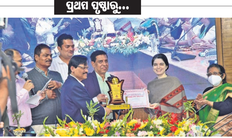
ଝିଅ ଅନୁପାତ ଅଧିକ ଥିବା କନ୍ୟାମାନଙ୍କୁ ପୁରସ୍କୃତ କରାଯାଇଛି ।