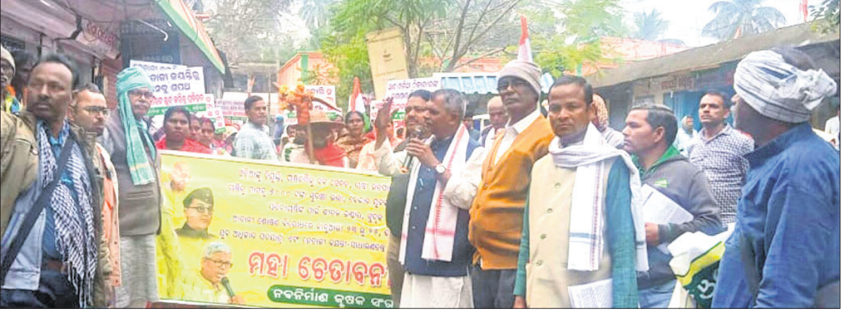
କୃଷକ ସଂଗଠନର ସଦସ୍ୟମାନେ।