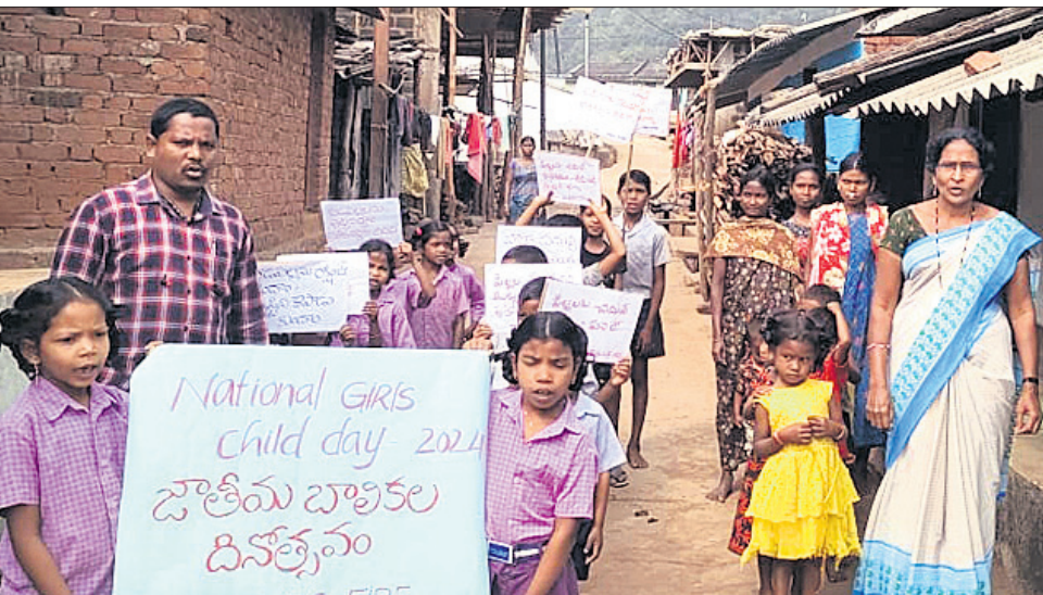
ସାଲୁର ପ୍ରଶାସନ ପକ୍ଷରୁ ବିଦ୍ୟାଳୟ ଛାତ୍ରଛାତ୍ରୀଙ୍କୁ ନେଇ ବାହାରିଥିବା ସଚେତନତା ଶୋଭାଯାତ୍ରା।

ପଟାଳି, ୨୪୧୧ (ଶରତ ଧଳ) କୋଟାପୁଟ ଜିଲ୍ଲା ପଟାଳି ବ୍ଲକ୍ କୋଟିଆ ପଞ୍ଚାୟତର ଧୂଳିପତର ଗ୍ରାମରେ ଆନ୍ଧ୍ର ସାଲୁର ପ୍ରଶାସନ ଦ୍ୱାରା ପରିଚାଳିତ ବିଦ୍ୟାଳୟରେ ଶିଶୁକନ୍ୟା ଦିବସ ପାଳନ କରାଯାଇଛି। ଏଥିରେ ଆନ୍ଧ୍ର ଶିକ୍ଷା ବିଭାଗ କର୍ମଚାରୀ ଉପସ୍ଥିତ ଥିଲେ। ଉଚ୍ଚ ଗ୍ରାମରେ ଥିବା ଓଡ଼ିଶା ସରକାରଙ୍କ ସ୍କୁଲରେ ଏହି ଦିବସ ପାଳନ କରାଯାଇନାହିଁ। ଗ୍ରାମର କୋଟାପୁଟ ଉଚ୍ଚ ଶିକ୍ଷାଳୟରେ ପଢ଼ୁଡ଼ା ଓଡ଼ିଶା ସ୍କୁଲରେ ଆୟୋଜିତ କାର୍ଯ୍ୟକ୍ରମରେ ଆନ୍ଧ୍ର ସ୍କୁଲରେ ଆୟୋଜିତ କାର୍ଯ୍ୟକ୍ରମରେ ଯୋଗଦେବାବେଳେ ସେମାନଙ୍କୁ ଶିକ୍ଷକମାନେ ଅଟକାଇ ନ ଥିଲେ। ଆନ୍ଧ୍ର ବିଦ୍ୟାଳୟର ଶିକ୍ଷକମାନେ ଛାତ୍ରଛାତ୍ରୀ ଓ ଗ୍ରାମବାସୀଙ୍କୁ ନେଇ ପ୍ରଥମେ ଏକ ବୈଠକ କରିଥିଲେ। ଏଥିରେ ଜାତୀୟ ଶିଶୁକନ୍ୟା ଦିବସ ପାଳନର ଉପଯୋଗରେ ଦିଲ୍ଲୀ ପୋଲିସ୍ ଅଭିଯୁକ୍ତଙ୍କ ସମ୍ପୂର୍ଣ୍ଣ ବାବଦରେ ଅବଗତ ହୋଇଛି। ତେବେ ଏଭଳି ଏକ ଗୁରୁତ୍ୱପୂର୍ଣ୍ଣ ମାମଲାରେ କଟକ ଆରପିଏଫ୍‌ର କାର୍ଯ୍ୟକୁ ଦିଲ୍ଲୀ ପୋଲିସ୍‌ର ବରିଷ୍ଠ ଅଧିକାରୀମାନେ ବେଶ୍ ପ୍ରଶଂସା କରିଛନ୍ତି।