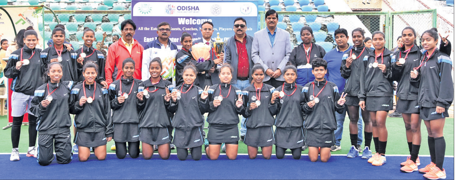
ଇଷ୍ଟଜୋର୍ ଆକ୍ରମଣ ବିଶ୍ୱବିଦ୍ୟାଳୟ ପହିଲା ହକି ଟୁର୍ନାମେଣ୍ଟ ଚାମ୍ପିୟନ ସମ୍ବଲପୁର ଦଳ।