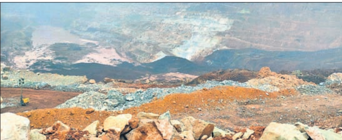
କାଳିଆପାଣିର ତି' ଭାରି ମାଟି ଧସି ପଡ଼ିଛି ।

କାଳିଆପାଣି, ୨୪।୧ (ଅଧିତ ମହାନ୍ତ) ଯାଜପୁର ଜିଲାର କାଳିଆପାଣି ଖଣି ଅଞ୍ଚଳରେ ଥିବା ଓଡ଼ିଶା ଖଣି ନିଗମ ଦକ୍ଷିଣ କାଳିଆପାଣିର ଡି' ବ୍ଲକ୍ ରୁଧିବାର ଧସି ଯାଇଛି । ଫଳରେ ସେଠାରେ ଥିବା କେତେକ ମହନ୍ତଶ ପୋତି ହୋଇଯାଇଛି । ଚଳଚାରାକ ପ୍ରତିରାକ୍ଷକଙ୍କ ଦ୍ଵାରା ସେଠାରେ ଖଣି ଭିତରେ ଏକକି ଏକ ଦୁର୍ଘଟଣା ଘଟିଥିବା ଜଣାପଡ଼ିଛି । ସକାଳୁ ଖଣିରେ କାର୍ଯ୍ୟ ଚାଲିଥିବାବେଳେ କାଳିଆପାଣି ଖଣି ସାଇଡ଼ରୁ ପ୍ରାୟ ୧୦୦ ମିଟର ଲମ୍ବା ଏରିଆର ମାଟି ଧସି ଖଣି ଭିତରକୁ ପଡ଼ି ଆସିଥିଲା । ଫଳରେ ଖଣିରେ ଥିବା ଏକାଡେର, ପ୍ରେସିଙ୍ଗି, ହୋଜର ଓ ୩ ମେନିନ ମାଟିରେ ପୋତି ହୋଇ ଯାଇଥିଲା । ପାଣିପାସ ଚଳାଇଥିବା ଜଣେ କର୍ମଚାରୀ ଅଳ୍ପକେ ବର୍ତ୍ତିଯାଇଥିଲେ । ପୂର୍ବରୁ