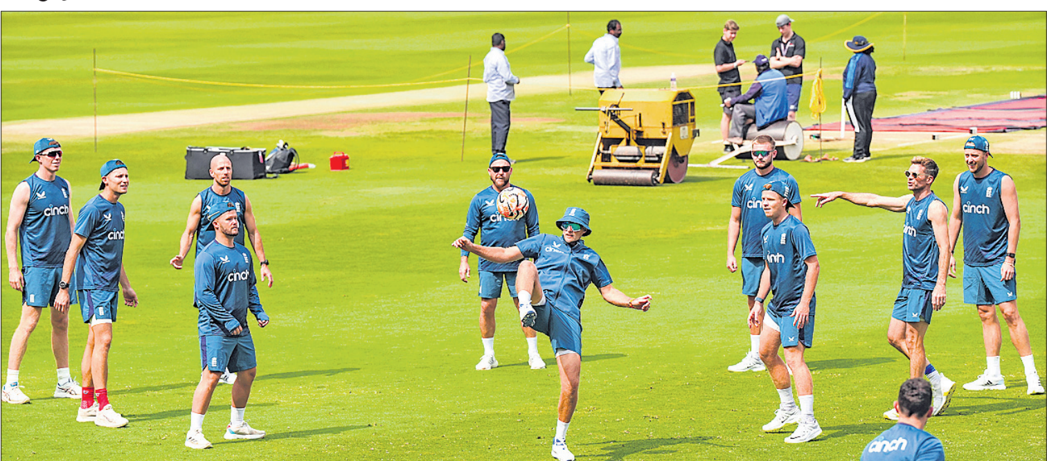
ଭାରତ ବିପକ୍ଷ ପ୍ରଥମ ଟେଷ୍ଟ ପୂର୍ବରୁ ରୁଧିର ଅବସରରେ ଇଂଲଣ୍ଡ ଦଳର ଖେଳାଳି।

ଆଜି ପ୍ରଥମ ଟେଷ୍ଟ ମ୍ୟାଚ୍ ସ୍ଥାନ: ହାଇଦ୍ରାବାଦ ସମୟ: ସକାଳ ୯.୩୦ ପ୍ରସାରଣ: ସୋର୍ଟ୍ ୧୮