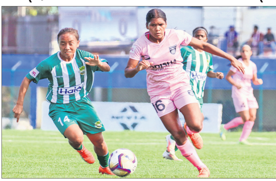
ଓଡ଼ିଶା ଓ କିକ୍‌ଷ୍ଟାର୍ଟ ମଧ୍ୟରେ ଅନୁଷ୍ଠିତ ମ୍ୟାଚ୍‌।

ଭୁବନେଶ୍ୱର, ୨୪।୧ (ସରୋଜ କେନା) ଇଣ୍ଡିଆନ୍ ଓମେନ୍ସ ଲିଗ୍‌ରେ ନିଜର ଅପରାଜେୟ ଧାରା ବଜାୟ ରଖୁଛି ଓଡ଼ିଶା ଏଫସି(ଓଏଫସି)। ରୁଧିର ଦେଙ୍ଗାଲୁକୁ ଫୁଟବଲ ସ୍ୱାତିୟମରେ କର୍ନାଟକର କିକ୍‌ଷ୍ଟାର୍ଟ ଏଫସି ବିପକ୍ଷରେ ଦଳ ୦-୦ରେ ଏହାର ମ୍ୟାଚ୍‌ଆମାଂସିତ ରଖୁଛି। ଏହା ସହିତ ଦଳ ପଏଣ୍ଟ୍‌ରେକ୍‌ରେ