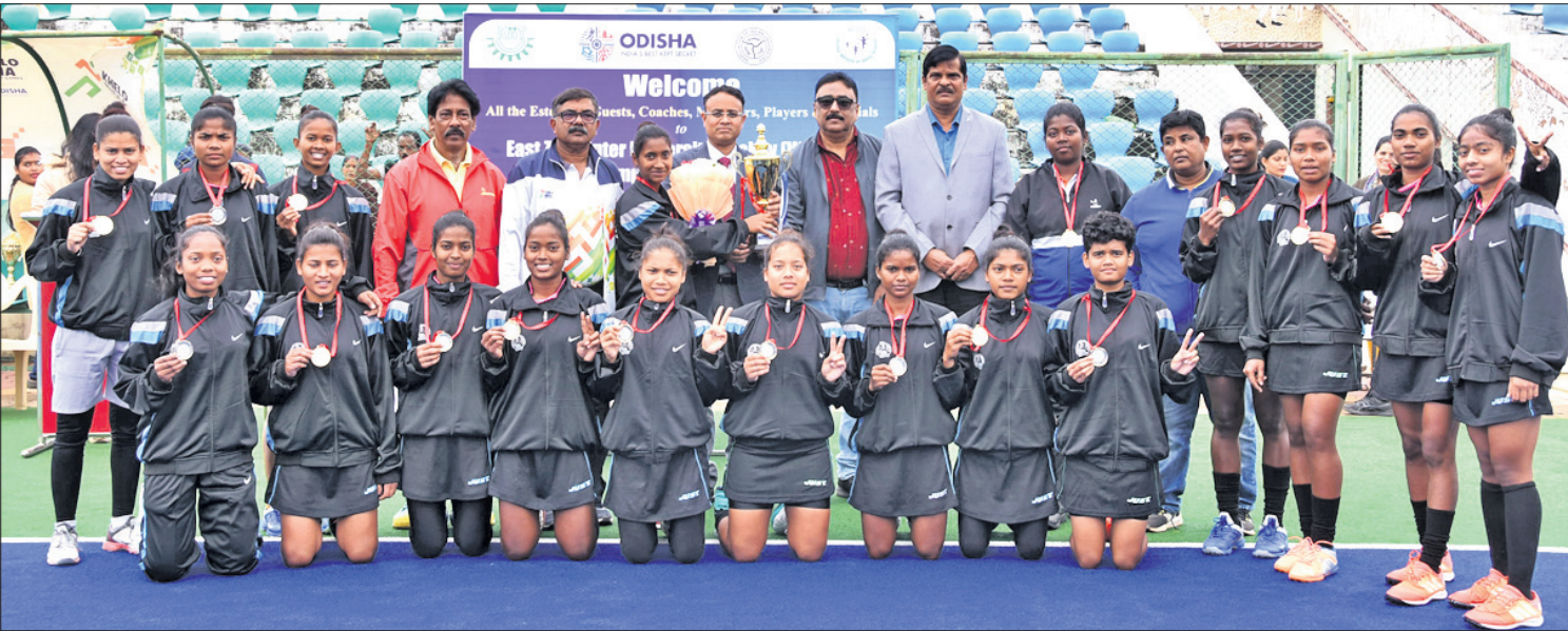
ଇଷ୍ଟଜୋର୍ ଆନ୍ତର୍ଜାତୀୟ ବିଶ୍ୱବିଦ୍ୟାଳୟ ମହିଳା ହକି ଚୁର୍ନାମେଶ୍‌ ଚାମ୍ପିୟନ ସମ୍ବଲପୁର ଦଳ।