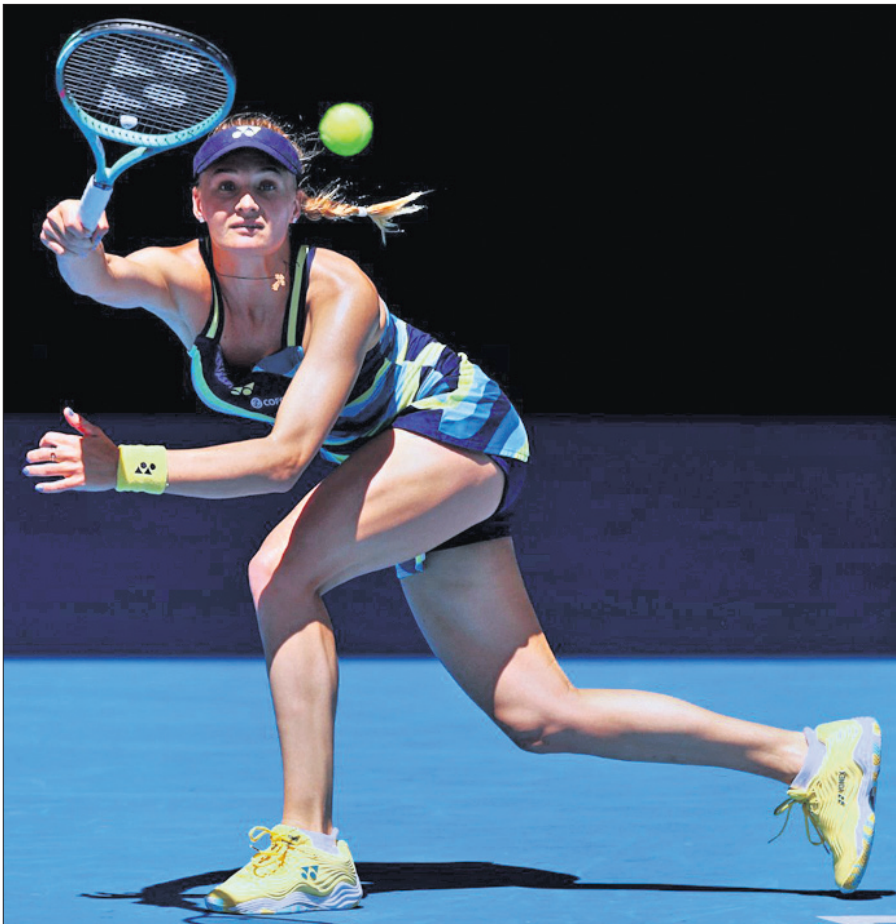
ଲିଆ ନୋଷ୍ଟୋଭାଙ୍କ ବିପକ୍ଷରେ ରିଟର୍ଣ୍ଣ ଶର୍ଟ ଖେଳୁଛନ୍ତି ଦାୟନା ଯାସ୍ତେମସ୍କା।

ଅଷ୍ଟ୍ରେଲିଆନ୍ ଓପନ୍ ୨୦୨୪ର ସେମି ଫାଇନାଲ ଲାଇଟ୍‌ଅପ୍ ବୃତ୍ତାନ୍ତ ହୋଇଛି। ବୁଧବାର ସମସ୍ତ କ୍ୱାର୍ଟର ଫାଇନାଲ ଶେଷ ହେବା ସହ ସେମିରେ ପ୍ରବେଶ କରିଛନ୍ତି ତାନିଲ ମେଡ୍‌ଭେଡେଭ୍, ଆଲେକଜାଣ୍ଡାର ଜେଭେରୋଭ୍, କ୍ଲିନ୍‌ଫ୍ରେନ୍ ଝେଙ୍ଗ ଓ ଦାୟନା ଯାସ୍ତେମସ୍କା। ପୁରୁଷ ସିଙ୍ଗଲ୍‌ରେ ୩ ନମ୍ବର ସ୍ଥାନରେ ଥିବା ଗୁଷ୍ଟିଆର ତାନିଲ ମେଡ୍‌ଭେଡେଭ୍ ୪ ଘଣ୍ଟା ୩୦ ମିନିଟ୍‌ର କଠା ସଂଘର୍ଷପୂର୍ଣ୍ଣ ପ୍ରକାଶିଲା ପରେ ୯ ନମ୍ବର ଖେଳାଳି ଝୁଏର୍‌ବର୍‌ହରକାଜକୁ ପରାସ୍ତ କରିଥିଲେ। ୬-୬(୪), ୨-୬, ୬-୩, ୫-୬ ଓ ୬-୪ ସେଟ୍‌ରେ ମେଡ୍‌ଭେଡେଭ୍ ଏହି ମ୍ୟାଟ୍‌କୁ ଜିତି ନେଇଥିଲେ। ଏହି ମ୍ୟାଟ୍‌ର ଏକାଧିକ ର୍ୟାଲି ୨୦ ଶ୍ରେଣୀ ଅଧିକ ଖେଳାଯାଇଥିଲା। ୨୦୨୧ ଚାମ୍ପିୟନ ମେଡ୍‌ଭେଡେଭ୍ ୨ ଥର ଅଷ୍ଟ୍ରେଲିଆନ୍ ଓପନ୍ ଫାଇନାଲ ଖେଳି ସାରିଥିବା ବେଳେ ପ୍ରଥମ ସେଟ୍‌ରୁ ହିଁ ଆକ୍ରମଣାତ୍ମକ ପ୍ରଦର୍ଶନ କରିଥିଲେ। ପ୍ରଥମରୁ ସେ ୪-୨ରେ ଆଗୁଆ ରହିଥିଲେ ମଧ୍ୟ ହରକାଜ ପ୍ରତ୍ୟାବର୍ତ୍ତନ କରି ସେଟ୍‌କୁ ଚାଲିଦେବାକୁ ନେଇଥିଲେ। ଦ୍ୱିତୀୟ ସେଟ୍‌କୁ ହରକାଜ ଜିତିବା ପରେ ଦ୍ୱିତୀୟ ସେଟ୍‌କୁ ଜିତି ନେଇଥିଲେ ମେଡ୍‌ଭେଡେଭ୍। ହରକାଜ ପରବର୍ତ୍ତୀ ସେଟ୍‌ରେ ପ୍ରତ୍ୟାବର୍ତ୍ତନ କରିଥିଲେ ମଧ୍ୟ ନିର୍ଣ୍ଣାୟକ ସେଟ୍‌କୁ ନିଜ ଅଭିଜ୍ଞତା ବଳରେ ଜିତି ନେଇଥିଲେ। ସେହିପରି ଦ୍ୱିତୀୟ ସେମି ଫାଇନାଲରେ ଫ୍ରେଙ୍କଲିନ୍‌ସ୍‌ ବିଜେତା କାର୍ଲୋସ୍‌ ଅଲକାରାଜ ଗାର୍‌ଆଙ୍କୁ ୬-୧, ୬-୩, ୬-୬(୭) ଓ ୬-୪ ସେଟ୍‌ରେ ପରାସ୍ତ କରିଥିଲେ କର୍ମୀମାର ଆଲେକଜାଣ୍ଡାର ଜେଭେରୋଭ୍। ଅଲିମ୍ପିକ୍‌ ସ୍ୱର୍ଣ୍ଣ ପଦକ ବିଜେତା ଜେଭେରୋଭ୍ ପ୍ରାଧାନ୍ୟ ବିସ୍ତାର କରି ଖେଳିବା ସହ ଅଲକାରାଜଙ୍କୁ ଚାପରେ ରଖିଥିଲେ। ପ୍ରଥମ ଟୁଇ ସେଟ୍‌କୁ ଜିତିବା ପରେ ଜେଭେରୋଭ୍ ବିଜୟ ସମ୍ଭାବନା ବୃଦ୍ଧି ପାଇଥିଲା। ତେବେ ତୃତୀୟ