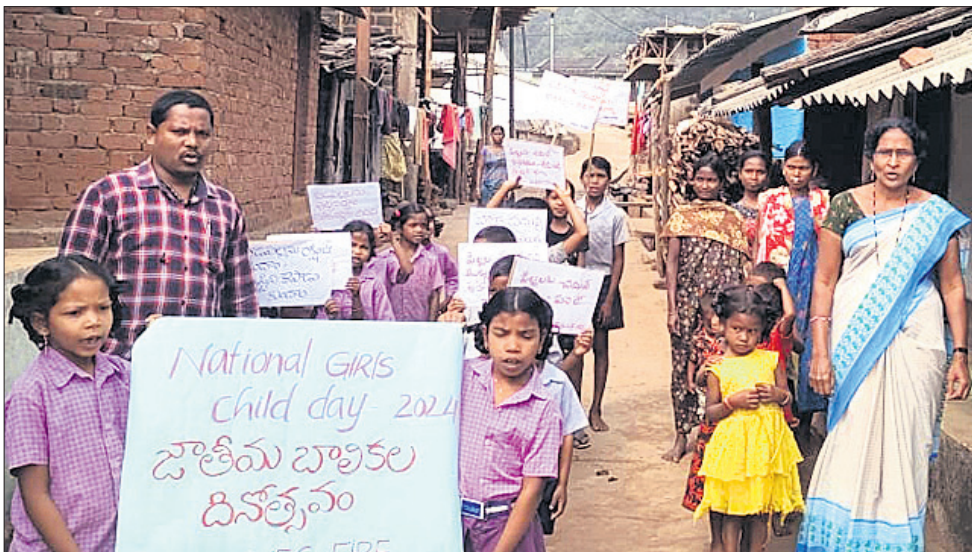
ସାଲୁର ପ୍ରଶାସନ ପକ୍ଷରୁ ବିଦ୍ୟାଳୟ ଛାଡ଼ିଛାଡ଼ିଲେ ନେଇ ବାହାରିଥିବା ସଚେତନତା ଶୋଭାଯାତ୍ରା ।

କୋରାପୁଟ ବିଲ୍ଲା ପଟ୍ଟାଙ୍ଗି ବ୍ଲକ କୋଟିଆ ପଞ୍ଚାୟତର ଥିଳିପଦର ଗ୍ରାମରେ ଆନ୍ଧ୍ରର ସାଲୁର ପ୍ରଜାସନ ବାବା ପରିଚାଳିତ ବିଦ୍ୟାଳୟରେ ଶିଶୁଜନ୍ୟା ଦିବସ ପାଳନ କରାଯାଇଛି । ଏଥିରେ ଆନ୍ଧ୍ରର ଶିକ୍ଷା ବିଭାଗ କର୍ମଚାରୀ ଉପସ୍ଥିତ ଥିଲେ । ଉଲ୍ଲ ଗ୍ରାମରେ ଥିବା ଓଡ଼ିଶା ସରକାରଙ୍କ ସ୍କୁଲରେ ଏହି ଦିବସ ପାଳନ କରାଯାଇନାହିଁ । ଗ୍ରାମର ଅନେକ ଛାତ୍ରାଛାତ୍ର ଉଭୟ ସ୍କୁଲରେ ପଢ଼ନ୍ତି । ଓଡ଼ିଶା ସ୍କୁଲର ଛାତ୍ରାଛାତ୍ରମାନେ ଆନ୍ଧ୍ର ସ୍କୁଲରେ ଆୟୋଜିତ କାର୍ଯ୍ୟକ୍ରମରେ ଯୋଗଦେବାବେଳେ ସେମାନଙ୍କୁ ଶିକ୍ଷକମାନେ ଅଟକାଇ ନ ଥିଲେ । ଆନ୍ଧ୍ର ବିଦ୍ୟାଳୟର ଶିକ୍ଷୟିତ୍ରୀ ଶିକ୍ଷକମାନେ ଛାତ୍ରାଛାତ୍ର ଓ ଗ୍ରାମବାସୀଙ୍କୁ ନେଇ ପ୍ରାଥମେ ଏକ ବୈଦିକ କରିଥିଲେ । ଏଥିରେ ଜାତୀୟ ଶିଶୁଜନ୍ୟା ଦିବସ ପାଳନର ଉଦ୍ଦେଶ୍ୟ ସମ୍ପର୍କରେ ଆଲୋକପାତକରି ଅଧିକ ସଂଖ୍ୟାରେ ବାଳିକା କିପରି ପାଠପଢ଼ା ପ୍ରତି ଆକୃଷ୍ଟ ହୋଇପାରିବେ ସେମାନଙ୍କ ବୁଝାଇଥିଲେ । ଆନ୍ଧ୍ର ସରକାର ସାମାଜିକବାସୀଙ୍କୁ ସର୍ବଦା ପ୍ରତ୍ୟକ୍ଷ ଦେଇଆସୁଛନ୍ତି । ଶିକ୍ଷାର ଉନ୍ନତି ପ୍ରତି ମଧ୍ୟ