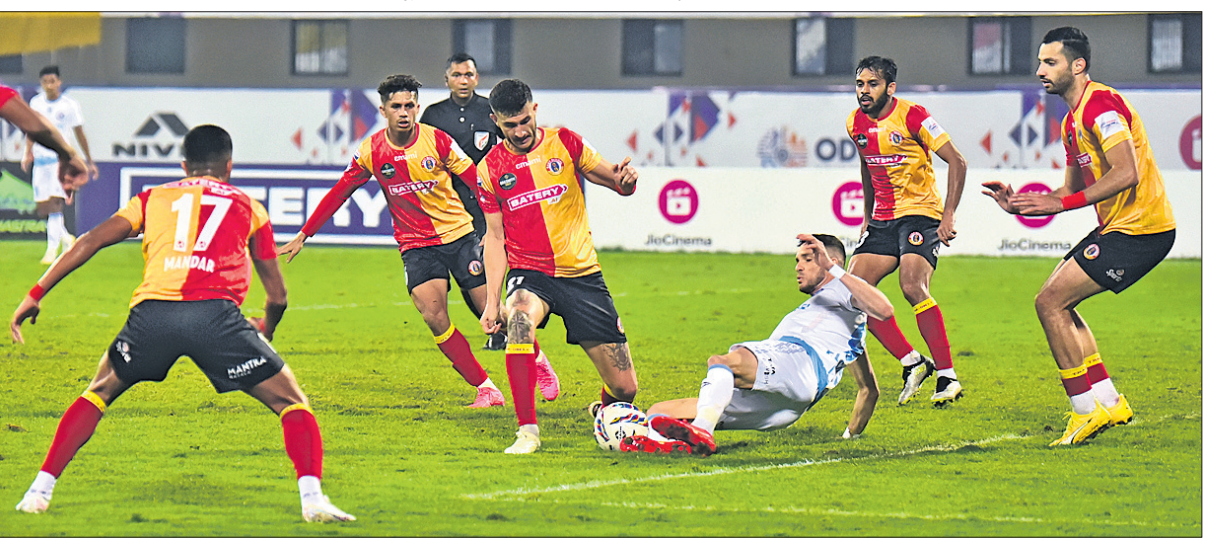
ଇଷ୍ଟ ଦେଙ୍ଗଲ ଓ ଜାମସେଦପୁର ଏଫସି ମଧ୍ୟରେ ଅନୁଷ୍ଠିତ ମ୍ୟାଚ୍‌ର ଏକ ସଂଘର୍ଷପୂର୍ଣ୍ଣ ମୁହୂର୍ତ୍ତ।