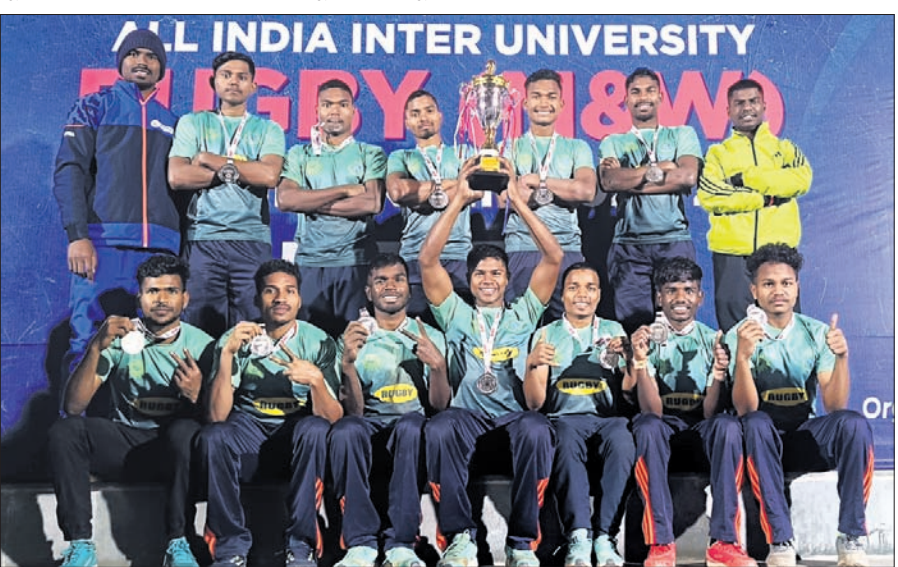
ଚୁଫି ସହ କିଚ୍ ରଗର୍ବୀ ପୁରୁଷ ୭ଏସ୍ ଦଳ।