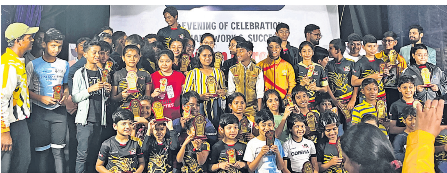
ଦି ଉତ୍କଳ ଯୁନିକର୍ନସ ରୋଲର ଷୋର୍ଟ୍ ଏକାଡେମୀ ତରଫରୁ ସମ୍ବର୍ଦ୍ଧିତ ଖେଳାଳି।