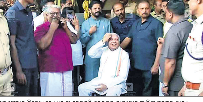
ଏସ୍ଏସ୍ଆଇ ବିରୋଧରେ ଧାରଣା ଦେଇଛନ୍ତି କେନ୍ଦ୍ରର ରାଜ୍ୟପାଳ ଆରିଫ୍ ମହମ୍ମଦ ଖାନ।

କେନ୍ଦ୍ରର କୋଲ୍ଲମ ଜିଲ୍ଲାରେ ଶନିବାର ଭାରତୀୟ ଛାତ୍ର ମହାସଂଘ (ଏସ୍ଏସ୍ଆଇ) ପକ୍ଷରୁ କଳାପତାକା ବିକ୍ଷୋଭ ଚାଲିଥିବାବେଳେ ହାଜିରାମା ଦେଖିବାକୁ ମିଳିଛି। ରାଜ୍ୟପାଳ ଆରିଫ୍ ମହମ୍ମଦ ଖାନ ଏକ କାର୍ଯ୍ୟକ୍ରମରେ ଯୋଗଦେବା ପାଇଁ କୋଲ୍ଲମରୁ ଯାଉଥିଲେ।