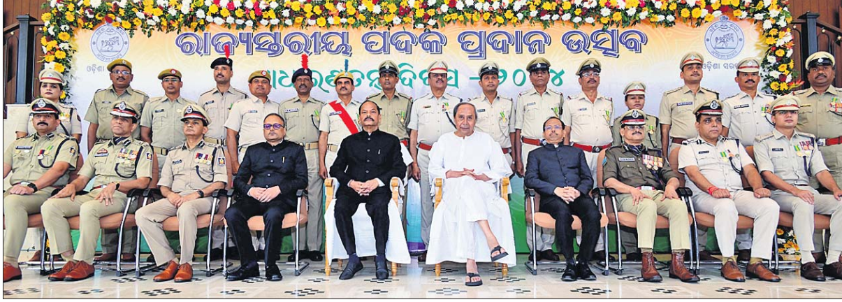
ପଦକ ପାଇଥିବା ରାଜ୍ୟ ଆରକ୍ଷା ବାହିନୀ ସହ ରାଜ୍ୟପାଳ ରଘୁବର ଦାସ, ମୁଖ୍ୟମନ୍ତ୍ରୀ ନବୀନ ପଟ୍ଟନାୟକ ଓ ୩ ବିଭାଗର ବରିଷ୍ଠ ଅଧିକାରୀମାନେ।