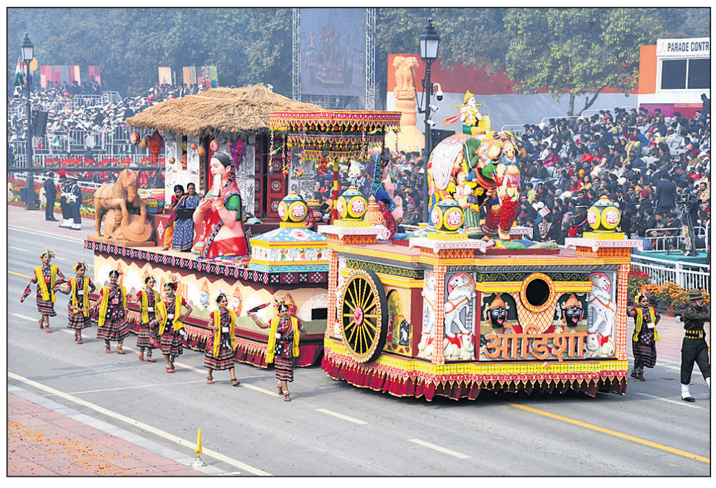
ସାଧାରଣତନ୍ତ୍ର ଦିବସ ପରେଦ୍ୱରେ ଭାଗନେଇଥିବା ଓଡ଼ିଶାର ପ୍ରଜ୍ଞାପନ ମେଡ଼।

ନୂଆଦିଲ୍ଲୀ, ୨୭।୧ (ପିଟି): ଆଗାମୀ ସାଧାରଣ ନିର୍ବାଚନକୁ ଦୃଷ୍ଟି ରଖି ୨୩ଟି ରାଜ୍ୟ ଓ କେନ୍ଦ୍ର ଶାସିତ ଅଞ୍ଚଳ ପାଇଁ ଦଳୀୟ ପ୍ରଭାବୀ ଓ ସହ ପ୍ରଭାବୀ ନିୟୁତ୍ତ କରିଛନ୍ତି ଭାଜପା ରାଷ୍ଟ୍ରୀୟ ଅଧ୍ୟକ୍ଷ କେ.ପି. ନନ୍ଦା।