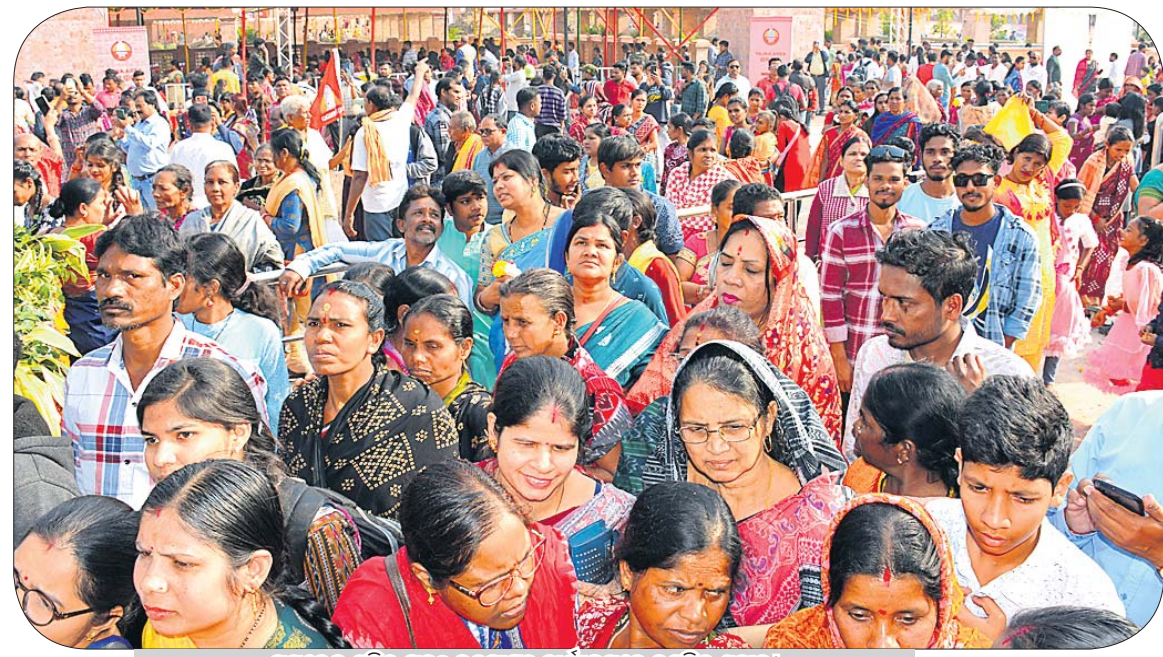
ସମଲେଇ ମନ୍ଦିର ପ୍ରକଳ୍ପ ଉଦ୍ଘାଟନ କାର୍ଯ୍ୟକ୍ରମରେ ଉପସ୍ଥିତ ଶ୍ରଦ୍ଧାଳୁ।