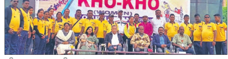
ଅତିଥିକ ଗହଣରେ ଖେଳାଳିମାନେ।