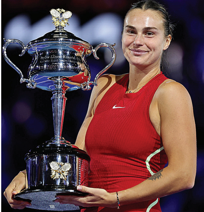
ଟ୍ରଫି ସହ ଆରିନା ସାବାଲେଙ୍କା

ଅଷ୍ଟ୍ରେଲିଆନ ଓପନ ଚେନିସ୍ ଗ୍ରାଣ୍ଡସ୍ଲାମ ମହିଳା ସିଙ୍ଗଲ୍‌ସ୍‌ରେ ବଜାୟ ରଖିଛନ୍ତି ବୋଲିଭିୟାର ଆରିନା ସାବାଲେଙ୍କା। ଡିଫେଣ୍ଡିଂ ଚାମ୍ପିୟନ ସାବାଲେଙ୍କା କ୍ରମାଗତ ତୃତୀୟ ଥର ଫାଇନାଲ ଖେଳିଥିବା ବେଳେ ଚାଇଟଲ କ୍ରିକେଟ୍ ଷ୍ଟେଡ଼ିୟମ୍ ୬-୩, ୬-୨ ସେଟ୍‌ରେ ପରାସ୍ତ କରିଛନ୍ତି। ଶନିବାର କ୍ୟାରିୟରର ତୃତୀୟ ଗ୍ରାଣ୍ଡସ୍ଲାମ ଚାଇଟଲ ହାସଲ କରିଥିବା ସାବାଲେଙ୍କା ପ୍ରଥମ ସେଟ୍‌କୁ ମାତ୍ର ୩୩ ମିନିଟ୍‌ରେ ସେ ଜିତି ନେଇଥିଲେ। ଷ୍ଟେଜ ପ୍ରଥମ ଥର ଏକ ଗ୍ରାଣ୍ଡସ୍ଲାମ ଫାଇନାଲ ଖେଳିଥିବା ବେଳେ ଏହାର ଫାଇଦା ନେଇଥିଲେ ସାବାଲେଙ୍କା। ତେବେ ଦୁଇଟି କାରଣରୁ ସାବାଲେଙ୍କାଙ୍କ ଟ୍ରଫି ଉଠାଇବା ସାମାନ୍ୟ ବିଳମ୍ବ ହୋଇଥିଲା। ତୃତୀୟ ସେଟ୍‌ରେ ତୃତୀୟ ଷ୍ଟେଜରେ ଜଣେ ବ୍ୟକ୍ତି ନିଜ ସିର୍କୁଲ୍ ଉଠି ବିରୋଧ କରିଥିଲେ। ଏପରିକି କିଛି ନାରୀ ମଧ୍ୟ ଲାଗାଇଥିଲେ। ସୁରକ୍ଷାକର୍ତ୍ତା ଏହି ବ୍ୟକ୍ତିଙ୍କୁ ବାହାରକୁ ନେବା ପରେ ମ୍ୟାଚ୍ ପୁନର୍ବାର ଆରମ୍ଭ ହୋଇଥିଲା। ସେହିପରି ଗୋଟିଏ ଷ୍ଟେଜରେ ୪୦-୦ରେ ଆଗୁଆ ରହିଥିବା ବେଳେ ଦୁଇଟି ଲଙ୍କ ଫୋରହାଡ଼ ଶବ୍ଦ ଖେଳିଥିଲେ। ଷ୍ଟେଜ ଚତୁର୍ଦ୍ଦଶର ସହ ଏକ ଟ୍ରୁପ୍ ଶବ୍ଦ ଖେଳିବା ଫଳରେ ଏହି ଷ୍ଟେଜ ଜିତି ନେଇଥିଲେ।