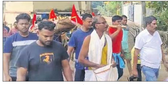
ଅଭିନ ସଂସ୍କାର ପାଇଁ ଶୁଶ୍ରୁଷା ନିଆଯାଇଛି।

ଭଦ୍ରକ, ୨୭୧୧ (ସନାତନ ରାଜତ) ପରେ ଏବେ ଶୁଦ୍ଧିକ୍ରିୟା ପାଇଁ ପରିବାର ପକ୍ଷରୁ ପ୍ରସ୍ତୁତି ଚାଲିଛି। ଭଦ୍ରକ ପୌରପାଳିକା ଅଧୀନ ଅସ୍ଥଳ ନରିପୁର ଗ୍ରାମରେ ଏଭଳି ଆଶ୍ଚର୍ଯ୍ୟ ଓ ସମ୍ବେଦନଶୀଳ ଘଟଣା ଦେଖିବାକୁ ମିଳିଛି।