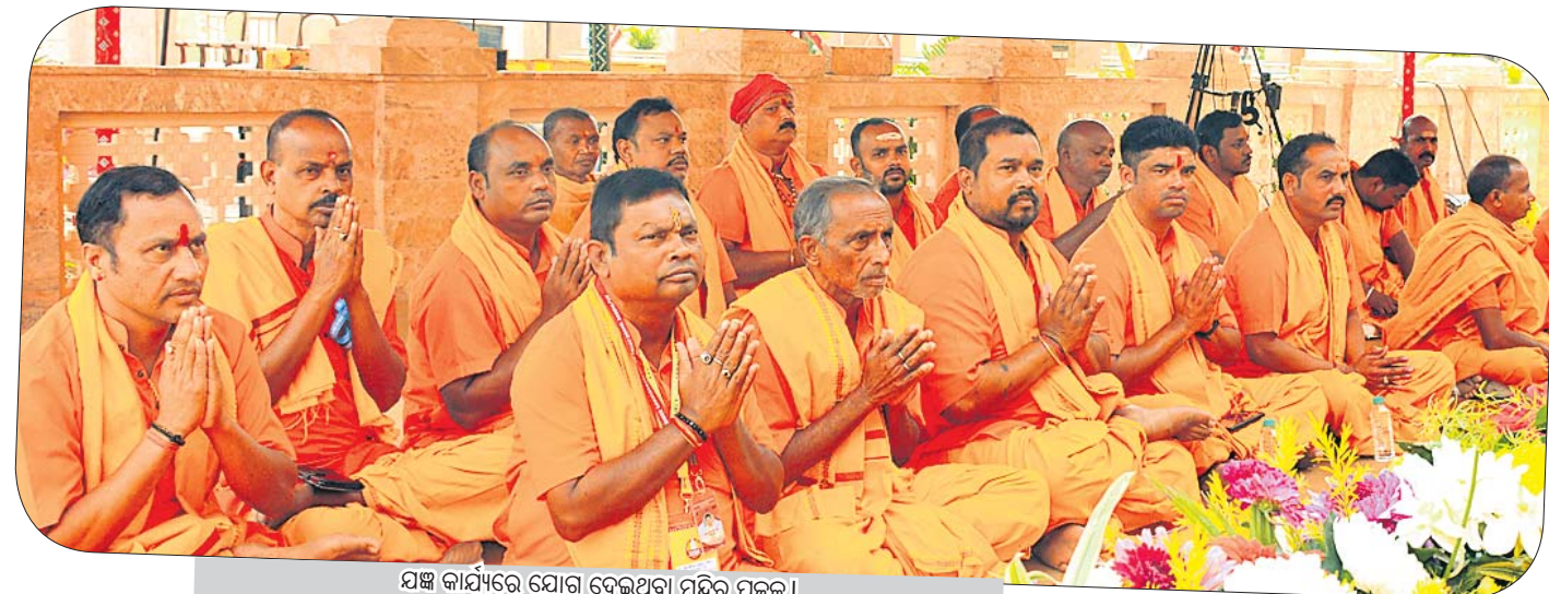
ଯଜ୍ଞ କାର୍ଯ୍ୟରେ ଯୋଗ ଦେଇଥିବା ମନ୍ଦିର ପୂଜକ।