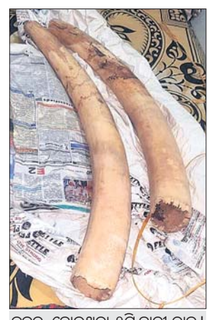
ଜବତ ହୋଇଥିବା ୨ଟି ହାତୀ ଦାନ୍ତ।