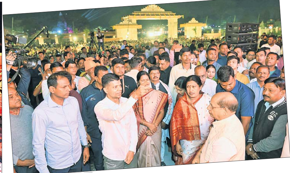
ସନ୍ଧ୍ୟା ଆକାଶି ସମୟରେ ଉପସ୍ଥିତ ୫-ଟି ଅଧକ୍ଷ କାର୍ତ୍ତିକ ପାଣ୍ଡିଆନ, ମନ୍ତ୍ରୀ, ବିଧାୟକ ଏବଂ ଏମ୍ପି।