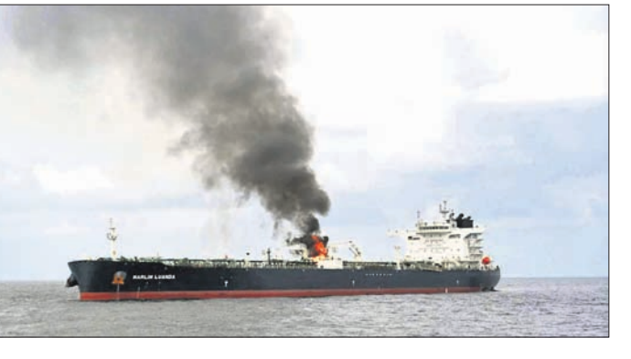
ମର୍ଜାଣ୍ଡ ଶିପ୍ରେ ଥିବା ଭାରତୀୟ ଦେଲିକା ଟେକ ଟ୍ୟାଙ୍କର ଏମ୍ଭି ମାଲିନ୍ ନୁଆଣ୍ଡା ଚାର୍ଟର୍ଡ କରିଥିଲେ।