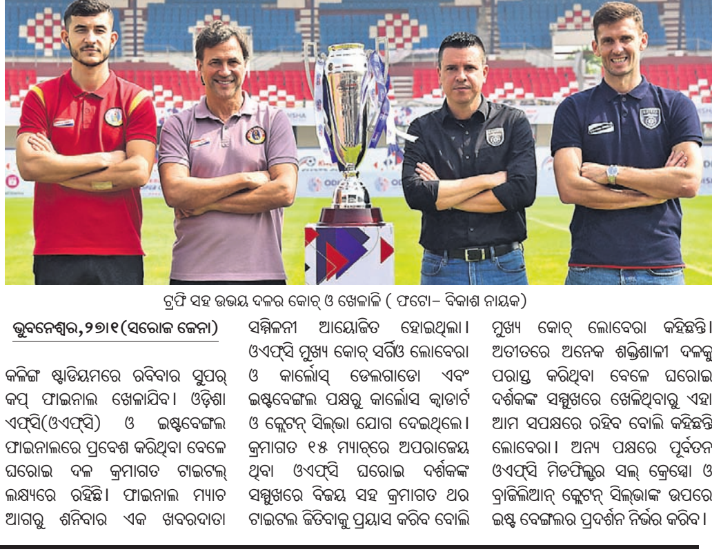
ଟ୍ରଫି ସହ ଉଭୟ ଦଳର କୋର୍ଡ୍ ଓ ଖେଳାଳି

ଭୁବନେଶ୍ୱର, ୨୭।୧ (ସରୋଜ କେନା) ସମ୍ପିକନୀ ଆୟୋଜିତ ହୋଇଥିଲା। ଓଏଫସି ମୁଖ୍ୟ କୋର୍ଡ୍ ସର୍ବିଓ ଲୋକେବର ଓ କାର୍ଲୋସ୍ ତେଲଗାଡୋ ଏବଂ ଇଣ୍ଡୋନେସିଆ ପକ୍ଷରୁ କାର୍ଲୋସ୍ କ୍ୱାଡାର୍ଟ ଏଫସି (ଓଏଫସି) ଓ ଇଣ୍ଡୋନେସିଆ ଫାଇନାଲରେ ପ୍ରବେଶ କରିଥିବା ବେଳେ ଘରୋଇ ଦଳ କ୍ରମାଗତ ଚାଇଟଲ ଲକ୍ଷ୍ୟରେ ରହିଛି। ଫାଇନାଲ ମ୍ୟାଚ ଆଗରୁ ଶନିବାର ଏକ ଖବରଦାବା ସମ୍ପିକନୀ ଆୟୋଜିତ ହୋଇଥିଲା। ଓଏଫସି ମୁଖ୍ୟ କୋର୍ଡ୍ ସର୍ବିଓ ଲୋକେବର ଓ କାର୍ଲୋସ୍ ତେଲଗାଡୋ ଏବଂ ଇଣ୍ଡୋନେସିଆ ପକ୍ଷରୁ କାର୍ଲୋସ୍ କ୍ୱାଡାର୍ଟ ଏଫସି (ଓଏଫସି) ଓ ଇଣ୍ଡୋନେସିଆ ଫାଇନାଲରେ ପ୍ରବେଶ କରିଥିବା ବେଳେ ଘରୋଇ ଦଳ କ୍ରମାଗତ ଚାଇଟଲ ଲକ୍ଷ୍ୟରେ ରହିଛି। ଫାଇନାଲ ମ୍ୟାଚ ଆଗରୁ ଶନିବାର ଏକ ଖବରଦାବା ସମ୍ପିକନୀ ଆୟୋଜିତ ହୋଇଥିଲା। ଓଏଫସି ମୁଖ୍ୟ କୋର୍ଡ୍ ସର୍ବିଓ ଲୋକେବର ଓ କାର୍ଲୋସ୍ ତେଲଗାଡୋ ଏବଂ ଇଣ୍ଡୋନେସିଆ ପକ୍ଷରୁ କାର୍ଲୋସ୍ କ୍ୱାଡାର୍ଟ ଏଫସି (ଓଏଫସି) ଓ ଇଣ୍ଡୋନେସିଆ ଫାଇନାଲରେ ପ୍ରବେଶ କରିଥିବା ବେଳେ ଘରୋଇ ଦଳ କ୍ରମାଗତ ଚାଇଟଲ ଲକ୍ଷ୍ୟରେ ରହିଛି। ଫାଇନାଲ ମ୍ୟାଚ ଆଗରୁ ଶନିବାର ଏକ ଖବରଦାବା