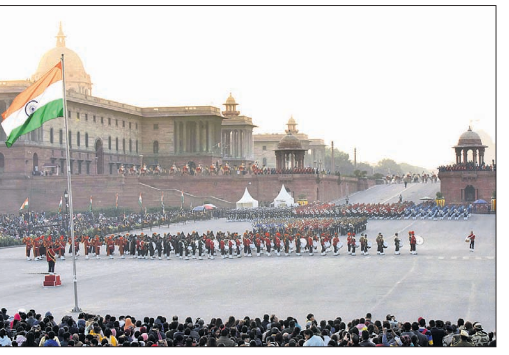
ନୂଆଦିଲ୍ଲୀର ଦିବ୍ୟ ଚୌକରେ ଆସନ୍ତା ୨୯ରେ ହେବାକୁ ଥିବା ଧୂଳିବତରଣ ପୂର୍ବରୁ ଶନିବାର ତିନି ସେନା ପକ୍ଷରୁ ଫୁଲ ଡ୍ରେସ୍ ରହସ୍ୟାଳା।