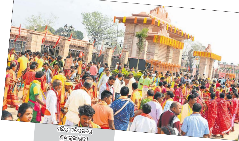
ମନ୍ଦିର ପରିସରରେ ଶ୍ରଦ୍ଧାଳୁଙ୍କ ଭିଡ଼।