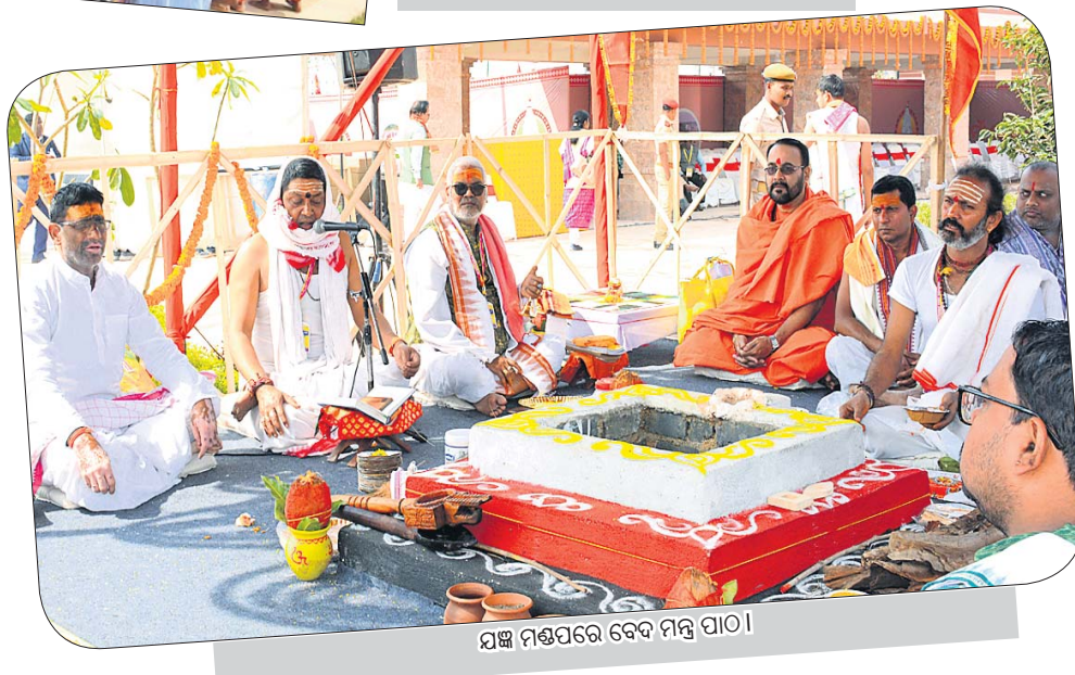
ଯଜ୍ଞ ମଣ୍ଡପରେ ବେଦ ମନ୍ତ୍ର ପାଠ।