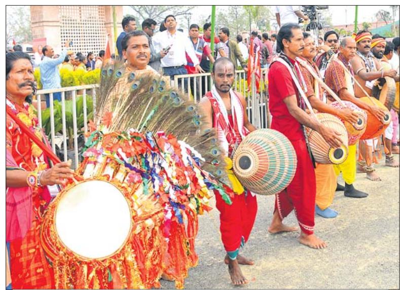
ପାରମ୍ପରିକ ବାଦ୍ୟ ପରିବେଷଣ।