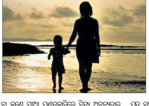
ବା ଜଣେ ମାଆ ପଣତକାନ୍ତିରେ ଦିବ୍ୟ ଅନନ୍ୟତାର ଚୋରବ ଚେଳିଦେଇ ଅନ୍ୟ ମାଆଙ୍କ ପ୍ରତି ଅବତାର କରିବେ! ଶେଷରେ ଯାହା କହିଲେ, ତାହା ବୋଧହୁଏ ସଂସାରର ସବୁ ମାତାଙ୍କ ସମ୍ପର୍କରେ ଏକ ସର୍ବକାଳୀନ ସ୍ୱୀକୃତିର ସର୍ବଶ୍ରେଷ୍ଠ ସିଦ୍ଧାନ୍ତ। କହିଲେ- "ମାଆ! ମୁଁ ଭଗବାନ କି ନୁହେଁ, ଏକଥା ଜାଣେ ନାହିଁ। କିନ୍ତୁ ଏତିକି ଜାଣିଛି ଯେ ମାଆଙ୍କ ସଂଖ୍ୟା ଓ ଆଶୀର୍ବାଦ ମିଳିତ ପ୍ରତ୍ୟେକ ମଣିଷ ଭଗବାନ ହୋଇପାରିବେ।" ଆ, କି ଦିବ୍ୟ ସନ୍ଦେଶ ସାରା ସଂସାରରେ ସବୁ ମାଆମାନଙ୍କ ପାଇଁ। ଏଥିପାଇଁ ତ