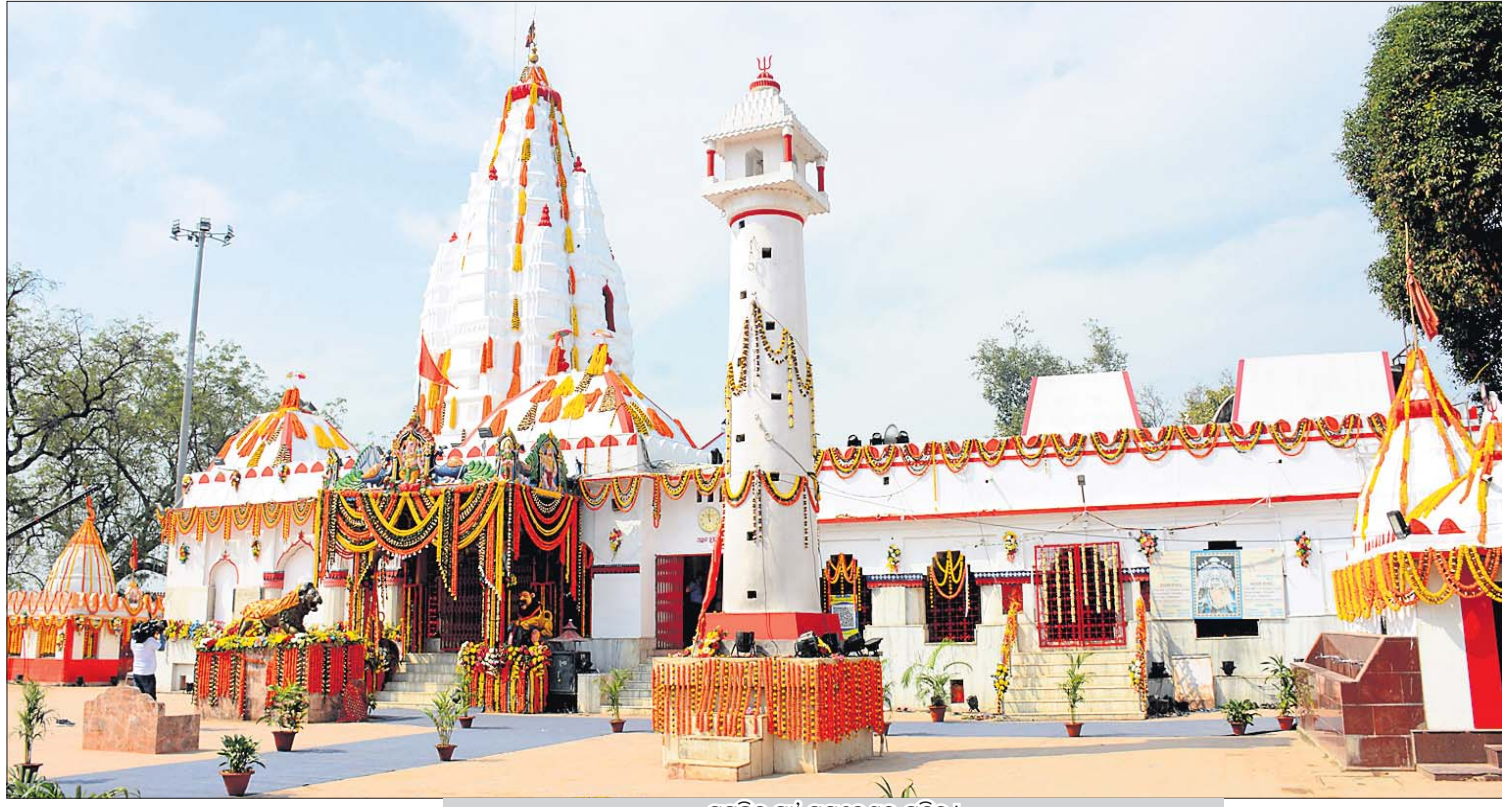
ସୁସଜ୍ଜିତ ମାଁ ସମଲେଶ୍ୱରୀ ମନ୍ଦିର।