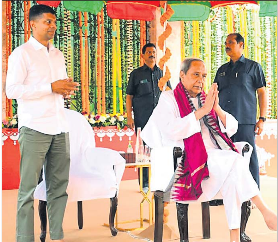
ଯଜ୍ଞ ମଣ୍ଡପ ନିକଟରେ ମୁଖ୍ୟମନ୍ତ୍ରୀ ନବୀନ ପଟ୍ଟନାୟକ, ନିକଟରେ ଅଛନ୍ତି ୫-ଟି ଅଧକ୍ଷ କାର୍ତ୍ତିକ ପାଣ୍ଡିଆନ୍।