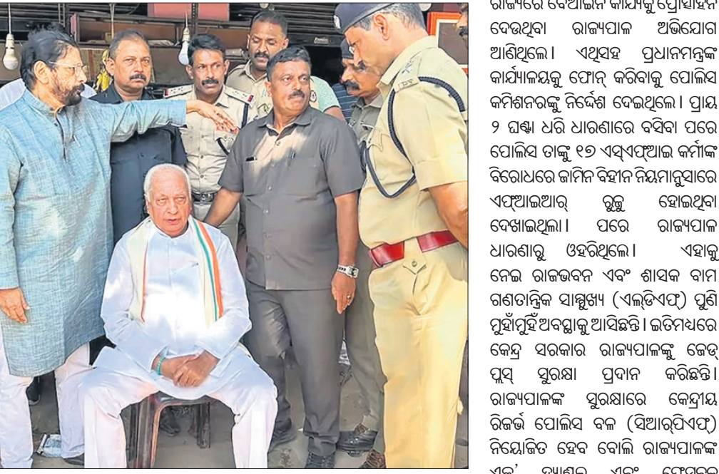
ଏସ୍‌ଏଫ୍‌ଆଇ ବିରୋଧରେ ଧାରଣା ଦେଇଛନ୍ତି କେରଳର ରାଜ୍ୟପାଳ ଆରିଫ୍ ମହମ୍ମଦ ଖାନ୍।

ଧୂଆନଗର/କୋଲମ, ୨୭୧୧ କେରଳର କୋଲମ ଜିଲ୍ଲାରେ ଶନିବାର ଭାରତୀୟ ଛାତ୍ର ମହାସଂଘ (ଏସ୍‌ଏଫ୍‌ଆଇ) ପକ୍ଷରୁ କଳାପତାକା ବିରୋଧ ଚାଲିଥିବାବେଳେ ହାଇଡ୍ରାମା ଦେଖିବାକୁ ମିଳିଛି। ରାଜ୍ୟପାଳ ଆରିଫ୍ ମହମ୍ମଦ ଖାନ୍ ଏକ କାର୍ଯ୍ୟକ୍ରମରେ ଯୋଗଦେବା ପାଇଁ କୋଚିରାସ୍ତରା