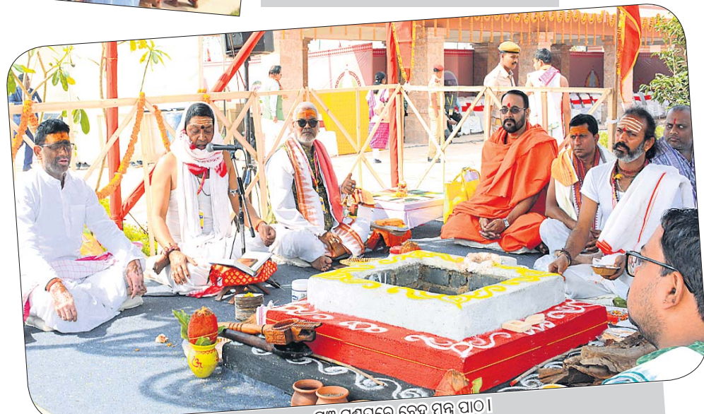
ଯଜ୍ଞ ମଣ୍ଡପରେ ବେଦ ମନ୍ତ୍ର ପାଠ।