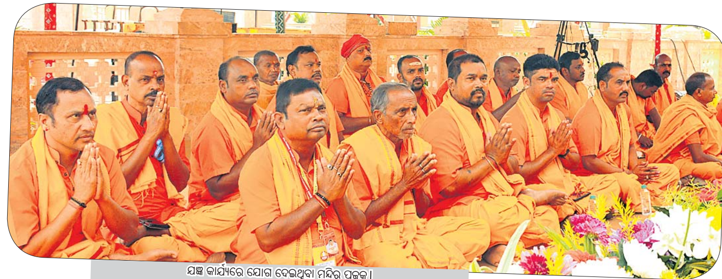
ଯଜ୍ଞ କାର୍ଯ୍ୟରେ ଯୋଗ ଦେଇଥିବା ମନ୍ଦିର ପୂଜକ।