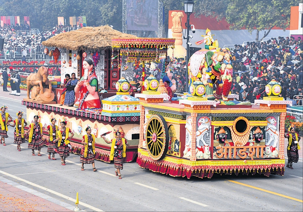
ନୂଆଦିଲ୍ଲୀରେ ସାଧାରଣତନ୍ତ୍ର ଦିବସ ପରବେଶରେ ଭାଗନେଇଥିବା ଓଡ଼ିଶାର ପ୍ରଜ୍ଞାପନ ମେଡ଼।