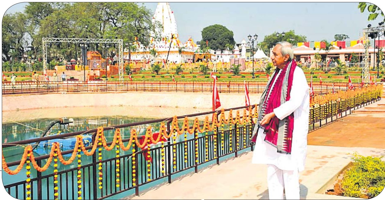
ମନ୍ଦିର ପରିସରରେ ଥିବା ପୁଷ୍କରିଣୀର ସୌନ୍ଦର୍ଯ୍ୟକୁ ଦେଖୁଛନ୍ତି ମୁଖ୍ୟମନ୍ତ୍ରୀ ନବୀନ ପଟ୍ଟନାୟକ।