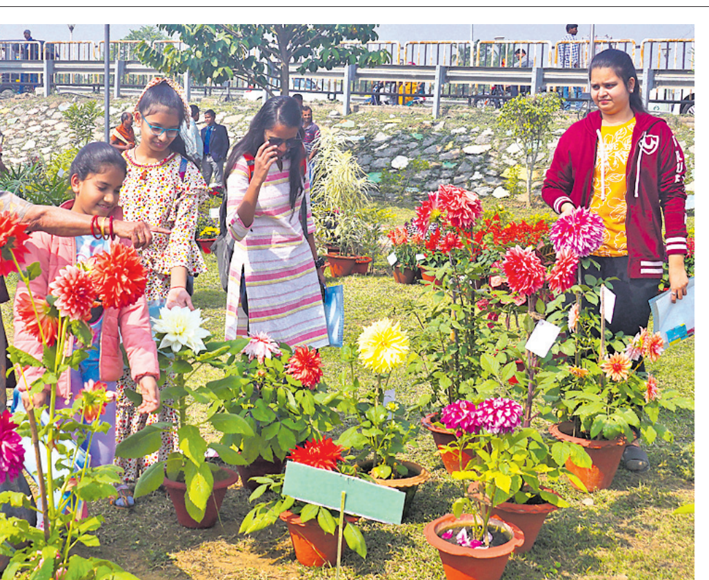
ସିଏମ୍‌ସି ନେତର ଲଭର୍ କ୍ଲବ ପକ୍ଷରୁ କଟକ ବେଲକ୍ସ ପାର୍କ ପରିସରରେ ଅନୁଷ୍ଠିତ ପୁଷ୍ପ ପ୍ରଦର୍ଶନୀକୁ ଯୁବତୀମାନେ ଦେଖୁଛନ୍ତି।

ବିଦ୍ୟାଳୟ ଓ ଗଣଶିକ୍ଷା ମନ୍ତ୍ରାଳୟ ଦ୍ୱାରା ଆୟୋଜିତ ଏକ ପ୍ରତିଷ୍ଠା ଦିବସ ପ୍ରସ୍ତୁତି ଉତ୍ସବରେ ବିଭିନ୍ନ ଶ୍ରେଣୀର ଉତ୍ତମଚାରୀ ଶିଳ୍ପୀମାନଙ୍କୁ ପୁରସ୍କାର କରାଯାଇଥିଲା। ଏହି ଉତ୍ସବରେ ବିଭିନ୍ନ ପ୍ରାଥମିକ ଶିକ୍ଷାଳୟର ଶିଳ୍ପୀମାନେ ନିଜର ସୃଜନଶକ୍ତି ଦେଖାଇଥିଲେ। ପ୍ରତିଷ୍ଠା ଦିବସ ପ୍ରସ୍ତୁତି ଉତ୍ସବର ଅଧ୍ୟକ୍ଷତା ଗ୍ରହଣ କରିଥିଲେ ବିଭିନ୍ନ ଶ୍ରେଣୀର ଉତ୍ତମଚାରୀ ଶିଳ୍ପୀମାନେ। ଏହି ଉତ୍ସବରେ ବିଭିନ୍ନ ପ୍ରାଥମିକ ଶିକ୍ଷାଳୟର ଶିଳ୍ପୀମାନେ ନିଜର ସୃଜନଶକ୍ତି ଦେଖାଇଥିଲେ।