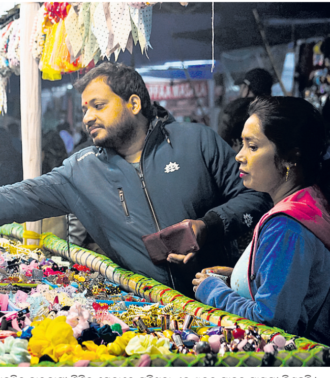
କଟକ ବାଲିଯାତ୍ରା ଉପରେ ପଡିଆରେ ଅନୁଷ୍ଠିତ ବାରବାଟୀ ଶିଶିର ମେଳାରେ ପଡିଆ ଏକ ସ୍ୱଳ୍ପଗୁଣା ଗ୍ରାହକ ସାମଗ୍ରୀ କିଣୁଛନ୍ତି।