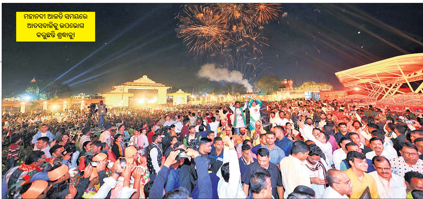
ମହାନଦୀ ଆକାଶି ସମୟରେ ଆଡ଼ସବାଜିକୁ ଉପଭୋଗ କରୁଛନ୍ତି ଶ୍ରଦ୍ଧାଳୁ।