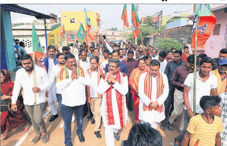
ପିପିଲି ବୁଥ ଜନ ସମ୍ପର୍କ ଅଭିଯାନ କାର୍ଯ୍ୟକ୍ରମରେ କେନ୍ଦ୍ରମନ୍ତ୍ରୀ ଧର୍ମେନ୍ଦ୍ର ପ୍ରଧାନ, ଅନ୍ୟ ନେତୃତ୍ୱ ଓ କର୍ମକର୍ତ୍ତା।