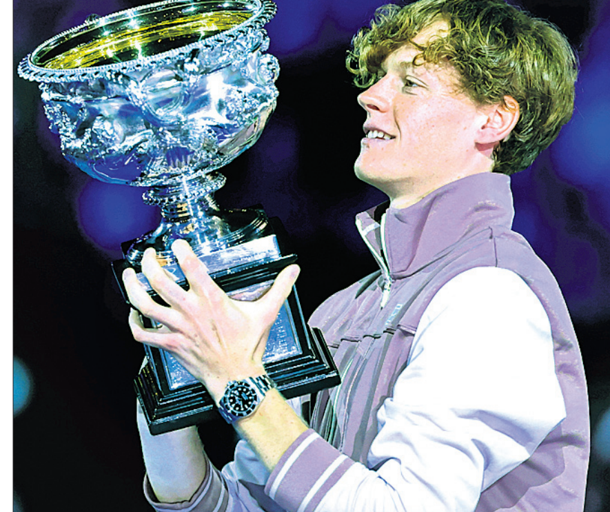
ଅଷ୍ଟ୍ରେଲିଆନ ଓପନ ଗ୍ରାଣ୍ଡସ୍ଲାମ ଟ୍ରଫି ସହ ଜାତିକ ସିନର ।

ମେଲବୋର୍ନ, ୨୮।୧ (ସି) ଜାତିକ ସିନର ଅଷ୍ଟ୍ରେଲିଆନ ଓପନ ଚେନିସ ପୁରୁଷ ସିଙ୍ଗଲ୍ ଚାମ୍ପିୟନ ହୋଇଛନ୍ତି । ଏହା ହେଉଛି ଟାକ୍ ପ୍ରଥମ ଗ୍ରାଣ୍ଡସ୍ଲାମ ଟାଇଟଲ । ଇଟାଲୀର ପ୍ରଥମ ଖେଳାଳି ହିସାବରେ ଅଷ୍ଟ୍ରେଲିଆନ ଓପନ ଜିତିବାର ସେ ଗୌରବ ଅର୍ଜନ କରିଛନ୍ତି । ୨୨ବର୍ଷୀୟ ସିନର ରବିବାର ଫାଇନାଲରେ ତାନିଲ୍ ମେଡଭେଡେଙ୍କୁ ୩-୬, ୩-୬, ୬-୪, ୬-୪, ୬-୩ ସେଟ୍ରେ ହରାଇ ଦେଇଛନ୍ତି । ଇଟାଲୀର ଏହି ମୁବ ଚେନିସ ଖେଳାଳି ଅଷ୍ଟ୍ରେଲିଆନ ଓପନରେ ପ୍ରାଧାନ୍ୟବିସ୍ତାର କରି ଆସୁଥିବା ନୋଭାକ ଡଜୋଭିଚ୍ଙ୍କୁ ଅଷ୍ଟ୍ରେଲିଆନ ଓପନ ଚେନିସ ଅଧିକ ସମୟ ଧରି ଖେଳିବାରେ ସେ ଆଲ୍‌କାରାଜଙ୍କ ୨୩:୪୦ (୨୦୨୨ ମୁସ୍‌ସ୍ ଓପନ)ଙ୍କ ରେକର୍ଡକୁ ଭଙ୍ଗ କରିଦେଇଛନ୍ତି । ମେଡଭେଡେଜ ୨୦୨୧ରେ କୋକୋଭିଚ୍ଙ୍କଠାରୁ ପଛକୁ ପଛ ଫାଇନାଲରେ ପରାଜିତ ହୋଇଥିଲେ । ଏହାର ପର ବର୍ଷ ସେ ବୁଲ ସେଟ୍ ଅଗ୍ରଣୀ ଆଇ ମଧ୍ୟ ରାଫାଲ ନାଡାଲ୍‌ଙ୍କଠାରୁ ପରାଜିତ ହୋଇଥିଲେ । ଏଥର ଚାମ୍ପିୟନଶିପ୍ ମ୍ୟାଚରେ ପହଞ୍ଚିବା ପୂର୍ବରୁ ସେ ତିନୋଟି ୫ ସେଟ୍ ବିଶିଷ୍ଟ ମ୍ୟାଚ ଜିତିଥିଲେ । ବୁଲଥର ସେ ବୁଲ ସେଟ୍ରେ ପଛୁଆ ଆଇ ମଧ୍ୟ ପ୍ରତ୍ୟାବର୍ତ୍ତନ କରିବାରେ ସଫଳ ହୋଇଥିଲେ ।