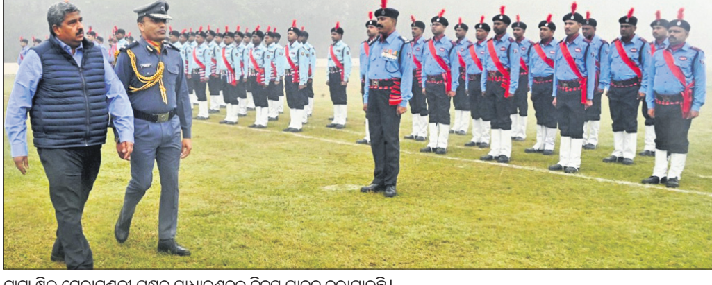
ଟାଟା ଷ୍ଟିଲ ମେରାମଣ୍ଡଳୀ ପକ୍ଷରୁ ସାଧାରଣତନ୍ତ୍ର ଦିବସ ପାଳନ କରାଯାଇଛି।

ଦେଢ଼ାମାଲ, ୨୮୧ (ରତନ ନାୟକ) ଦେଢ଼ାମାଲ ଜିଲ୍ଲା ଓଡ଼ାପଡ଼ା ବ୍ଲକ ଟାଟା ଷ୍ଟିଲ ମେରାମଣ୍ଡଳୀ ପକ୍ଷରୁ ଶୁକ୍ରବାର ସ୍ଥାନୀୟ ହାଉସିଂ କଲୋନୀଠାରେ ସାଧାରଣତନ୍ତ୍ର ଦିବସ ପାଳିତ ହୋଇଯାଇଛି। ଏହି ଅବସରରେ ଟାଟା ଷ୍ଟିଲ ମେରାମଣ୍ଡଳୀର