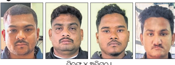
ଗିରଫ ୪ ଗିରଫ