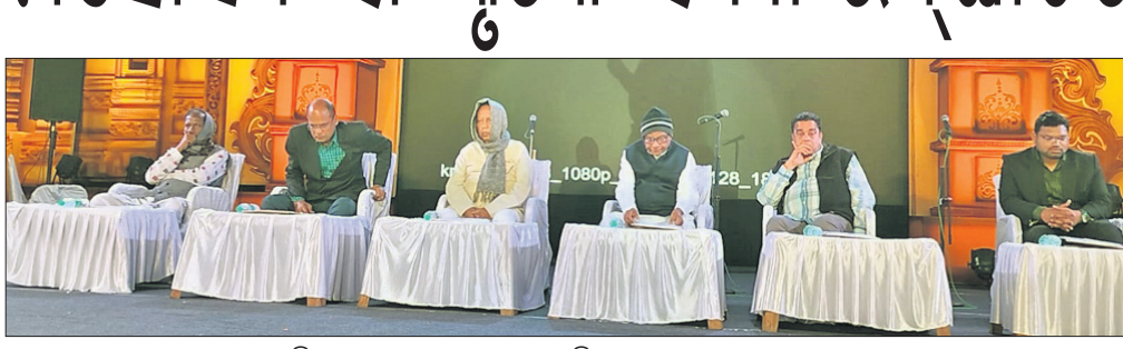
କାମାକ୍ଷାନଗର ମହୋତ୍ସବର ସାଂସ୍କୃତିକ ସନ୍ଧ୍ୟା ଉଦ୍‌ଘାଟନ ମଞ୍ଚରେ ଅତିଥିମାନେ।