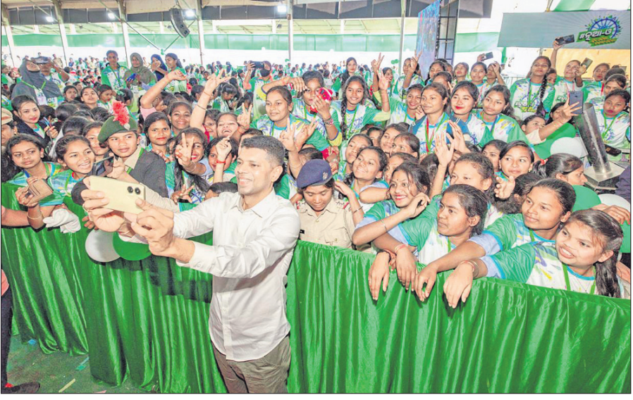
୫-ଟି ଅଧକାରୀଙ୍କ ସହ ସେଲ୍‌ଫି ଦିନିକିଆ

ସହିତ ଲୁଚାଯିତ ପ୍ରତିଭା ବିକାଶ ପାଇଁ ଏଭଳି କାର୍ଯ୍ୟକ୍ରମ ପ୍ରତ୍ୟେକ ବର୍ଷ କରିବାକୁ ଲକ୍ଷ୍ୟ ବ୍ୟକ୍ତି କରିଥିବା କହିଥିଲେ। ନୂଆ-ଓ କାର୍ଯ୍ୟକ୍ରମ ପିଲାମାନଙ୍କ ପାଇଁ ନିଜ ନିଜ ପ୍ରତିଭା ପରିପ୍ରକାଶର ଏକ ଉତ୍କୃଷ୍ଟ ପ୍ଲାନେଟ୍। କଲେଜ, କ୍ଲବ୍, ଉପଖଣ୍ଡ, ଜିଲ୍ଲାସ୍ତରୀୟ ପ୍ରତିଯୋଗିତାରେ