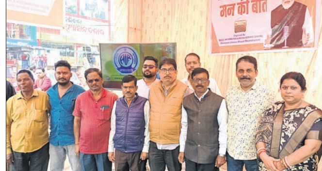
ମନ କା ବାଡ଼ କାର୍ଯ୍ୟକ୍ରମରେ ଉପସ୍ଥିତ ନେତୃବର୍ଗ ଓ ଅନ୍ୟମାନେ।