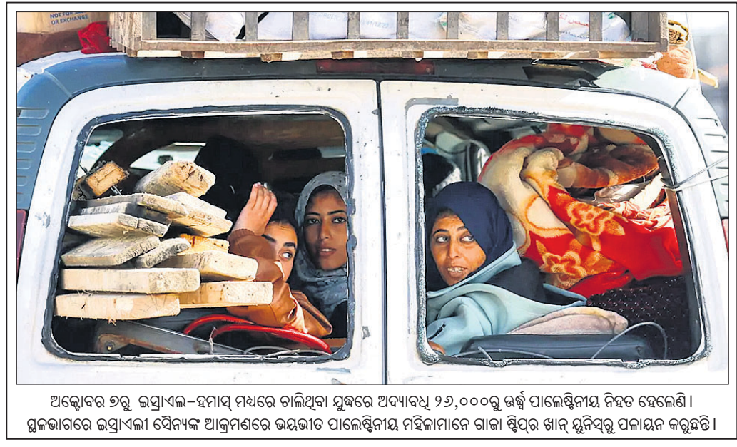
ଅକ୍ଟୋବର ୨ରୁ ଉପ୍ରାଏଲ-ହମାସ ମଧ୍ୟରେ ଚାଲିଥିବା ମୁକ୍ତରେ ଅପାଦ୍ୟ ୨୬,୦୦୦ରୁ ଊର୍ଦ୍ଧ୍ୱ ପାଲେଷ୍ଟିନୀୟ ନିହତ ହେଲେଣି। ସ୍ଥଳଭାଗରେ ଉପ୍ରାଏଲୀ ସୈନ୍ୟକ ଆକ୍ରମଣରେ ଭୟଭୀତ ପାଲେଷ୍ଟିନୀୟ ମହିଳାମାନେ ଗାଡ଼ା ଶ୍ୱପ୍ତର ଖାନ୍ ସୁନିସବୁ ପକାଇନ କରୁଛନ୍ତି।