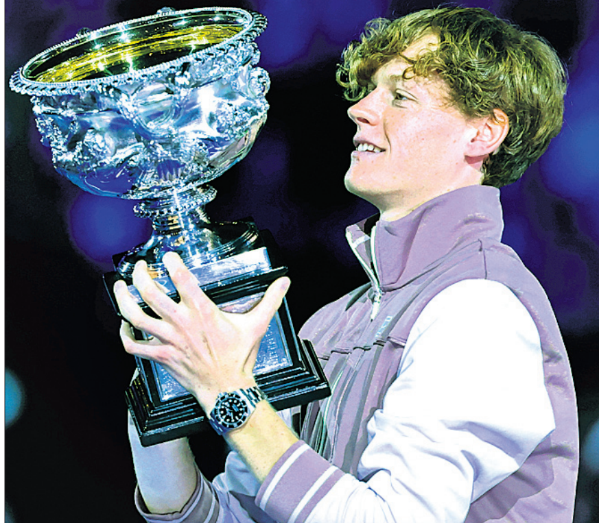
ଅଷ୍ଟ୍ରେଲିଆନ ଓପନ ଗ୍ରାଣ୍ଡସ୍ଲାମ ଟ୍ରଫି ସହ ଜାନିକ ସିନର ।

ମେଲବୋର୍ନ, ୨୮୮୧ (ଏସି) ଜାନିକ ସିନର ଅଷ୍ଟ୍ରେଲିଆନ ଓପନ ଚେନିସ ପୁରୁଷ ସିଙ୍ଗଲ୍ ଚାମ୍ପିୟନ ହୋଇଛନ୍ତି । ଏହା ହେଉଛି ତାଙ୍କ ପ୍ରଥମ ଗ୍ରାଣ୍ଡସ୍ଲାମ ଟାଇଟଲ । ଇଟାଲୀର ପ୍ରଥମ ଖେଳାଳି ହିସାବରେ ଅଷ୍ଟ୍ରେଲିଆନ ଓପନ ଜିତିବାର ସେ ଗୌରବ ଅର୍ଜନ କରିଛନ୍ତି । ୨୨ବର୍ଷୀୟ ସିନର ରବିବାର ଫାଇନାଲରେ ତାନିଲ୍ ମେଡଭେଡେଙ୍କୁ ୩-୬, ୩-୬, ୬-୪, ୬-୪, ୬-୩ ସେଟ୍ରେ ହରାଇ ଦେଇଛନ୍ତି । ଇଟାଲୀର ଏହି ମୁବ ଚେନିସ ଖେଳାଳି ଅଷ୍ଟ୍ରେଲିଆନ ଓପନରେ ପ୍ରାଧାନ୍ୟବିସ୍ତାର କରି ଆସୁଥିବା ନୋଭାକ ଡଜୋଭିଚ୍ଙ୍କୁ ଅଷ୍ଟ୍ରେଲିଆନ ଓପନ ଚେନିସ ଅଧିକ ସମୟ ଧରି ଖେଳିବାରେ ସେ ଆଲକାରାଜଙ୍କ ୨୩:୪୦ (୨୦୨୨ ମୁସ୍‌ସ୍ ଓପନ)ଙ୍କ ରେକର୍ଡକୁ ଭଙ୍ଗ କରିଦେଇଛନ୍ତି । ମେଡଭେଡେଜ ୨୦୨୧ରେ କୋକୋଭିଚ୍ଙ୍କଠାରୁ ପଛକୁ ପଛ ଫାଇନାଲରେ ପରାଜିତ ହୋଇଥିଲେ । ଏହାର ପର ବର୍ଷ ସେ ବୁଲ ସେଟ୍ ଅଗ୍ରଣୀ ଆଇ ମଧ୍ୟ ରାଫାଲ ନାଡାଲଙ୍କଠାରୁ ପରାଜିତ ହୋଇଥିଲେ । ଏଥର ଚାମ୍ପିୟନଶିପ୍ ମ୍ୟାଚରେ ପହଞ୍ଚିବା ପୂର୍ବରୁ ସେ ତିନୋଟି ୫ ସେଟ୍ ବିଶିଷ୍ଟ ମ୍ୟାଚ ଜିତିଥିଲେ । ବୁଲଥର ସେ ବୁଲ ସେଟ୍ରେ ପଛୁଆ ଆଇ ମଧ୍ୟ ପ୍ରତ୍ୟାବର୍ତ୍ତନ କରିବାରେ ସଫଳ ହୋଇଥିଲେ ।