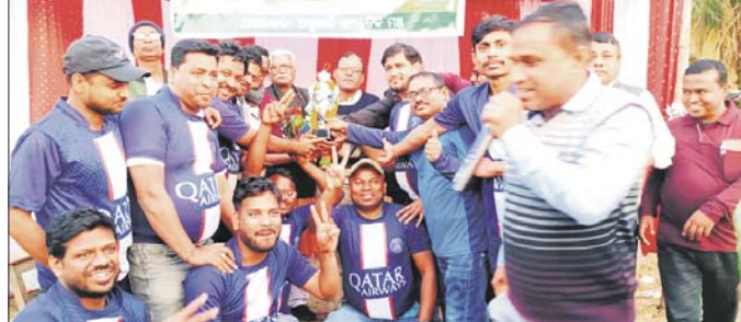
ଚାମ୍ପିୟନ ଟିମ୍ ଅତି ପୁରସ୍କୃତ କରୁଛନ୍ତି।

ଧାମନଗର, ୨୮।୧ (ବେବେନ୍ଦ୍ର ଆରିଆ) ଭଦ୍ରକ ଜିଲ୍ଲା ଧାମନଗର ଏନ୍-ସିସିଟିର ଅଧିକାରୀ ଖେଳପଡ଼ିଆରେ ଅସୁରାକି ସଂସ୍କୃତିକ ମଞ୍ଚ ଆନୁକୂଲ୍ୟରେ ଆୟୋଜିତ ଦଶମ ବାର୍ଷିକ କ୍ରିକେଟ ଚୂର୍ଣ୍ଣାମେଣ୍ଟର ଫାଇନାଲ ମ୍ୟାଚ୍ ଅନୁଷ୍ଠିତ ଥିଲେ। ଚୂର୍ଣ୍ଣାମେଣ୍ଟରେ ୬ ଦଳ ଭାଗ ନେଇଥିବା ବେଳେ ଫାଇନାଲ ଅନ୍ତିମ ସଂଘର କରାଯାଇଥିଲା।