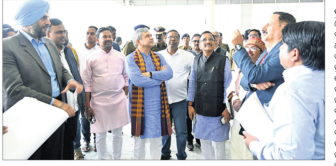
କଟକ ରେଳଷ୍ଟେଶନରେ ମନ୍ତ୍ରୀ ଅଶ୍ୱିନୀ ବୈଷ୍ଣବ ନବାକରଣ କାର୍ଯ୍ୟ ତଦାରଖ କରୁଛନ୍ତି।