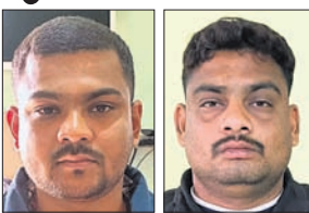
ଗିରଫ ୪ ଗିରଫ୍ତାରୀ।