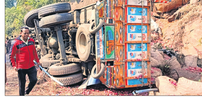
ଡ୍ୱାରଶୁଣୀ ଘାଟି ରାସ୍ତାରେ ପିଆକ ବୋହେଇ ତ୍ରକ୍ ଓଲଟି ପଡ଼ିଛି।