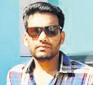
କୋରାପୁଟ/ନାରାୟଣପାଟଣା, ୨୮୧ (ଅନିତାର ବେହେରା/ରାଜକିଶୋର ଜେନା)