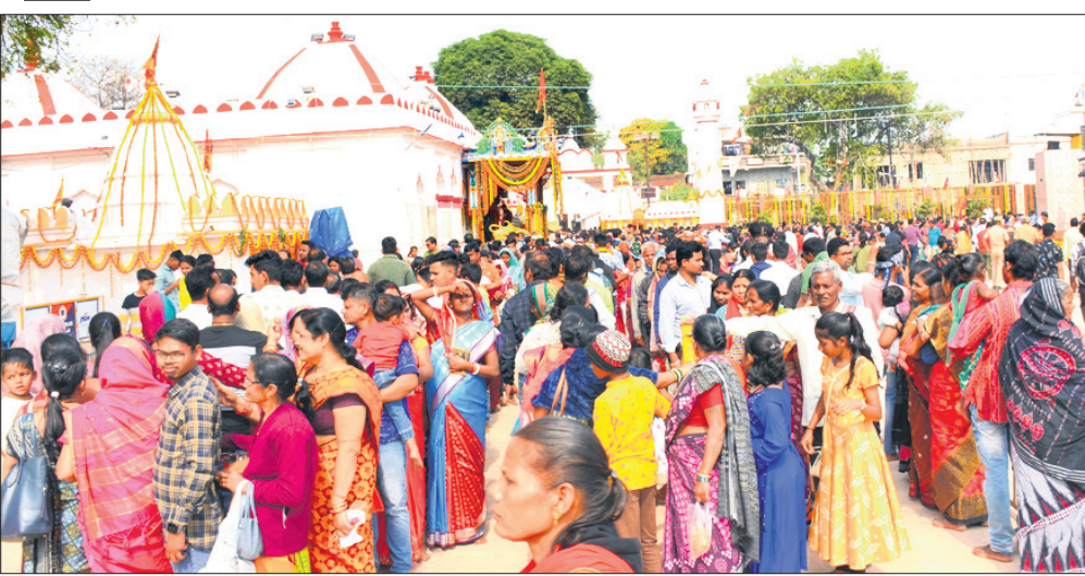
ସମଲେଶ୍ୱରୀକ ମନ୍ଦିର ପରିସରରେ ଭକ୍ତଙ୍କ ପ୍ରବଳ ଭିଡ଼।

ସମଲେଶ୍ୱରୀକ ମନ୍ଦିର ପରିସରରେ ହୋମ, ଯଜ୍ଞ ଓ ଚଣ୍ଡୀପାଠ। ସମଲେଶ୍ୱରୀକ, ୨୮୧ (ପ୍ରମୋଦ ବହିଦାର) ସମଲେଶ୍ୱରୀକ ଆରାଧ୍ୟ ଦେବୀ ମା' ସମଲେଶ୍ୱରୀଙ୍କ ରୂପାନ୍ତର ପ୍ରକଳ୍ପ ଶନିବାର ଲୋକାର୍ପିତ ହେବା ପରେ ରବିବାର ମନ୍ଦିର ପରିସରରେ ଭକ୍ତଙ୍କ ପ୍ରବଳ ଭିଡ଼ ପରିଲକ୍ଷିତ ହୋଇଥିଲା। ଚଣ୍ଡୀପାଠ ଓ ବେଦ ଧ୍ୱନୀରେ ସାରା ଅଞ୍ଚଳ ପ୍ରକଳ୍ପିତ ହୋଇଉଠିଲା। ମନ୍ଦିର ପରିସରରେ ରହିଥିବା ୫ଟି ଯଜ୍ଞ ମଣ୍ଡପରେ କାରି ରହିଛି ଚଣ୍ଡୀପାଠ ଓ ହୋମଯଜ୍ଞ। ଏହାକୁ ସମ୍ପାଦନ କରୁଛନ୍ତି ପଣ୍ଡିତ ଓଡ଼ିଶାର ବିଭିନ୍ନ ଜିଲାରୁ ଆସିଥିବା ୩୦ ପଣ୍ଡିତ। ତେବେ ମା'ଙ୍କ ପୀଠର ପ୍ରଥମ ଚୋରଣ ସଂଲଗ୍ନ ଯଜ୍ଞ ମଣ୍ଡପରେ ସମଲେଶ୍ୱରୀ ଶ୍ରୀଶ୍ରୀ ବ୍ରହ୍ମ ମଣ୍ଡପ ପଞ୍ଚିତ ମହାସଭାରେ ପଞ୍ଚିତେ ଦ୍ୱାରା ଚଣ୍ଡୀପାଠ ଓ ହୋମ ସମ୍ପାଦିତ ହୋଇଥିଲା। ଶଙ୍ଖ, ଘଣ୍ଟ, ହୁଳହୁଳି ମଧ୍ୟରେ ପଞ୍ଚିତେ ଚଣ୍ଡୀପାଠର ଆଧ୍ୟାତ୍ମିକ ଗୁଣଗଣରେ ପରିସରରେ ରହିଥିବା ୫ଟି ଯଜ୍ଞ ମଣ୍ଡପରେ କାରି ରହିଛି ଚଣ୍ଡୀପାଠ ଓ ହୋମଯଜ୍ଞ। ଏହାକୁ ସମ୍ପାଦନ କରୁଛନ୍ତି ପଣ୍ଡିତ ଓଡ଼ିଶାର ବିଭିନ୍ନ ଜିଲାରୁ ଆସିଥିବା ୩୦ ପଣ୍ଡିତ। ତେବେ ମା'ଙ୍କ ପୀଠର ପ୍ରଥମ ଚୋରଣ ସଂଲଗ୍ନ ଯଜ୍ଞ ମଣ୍ଡପରେ ସମଲେଶ୍ୱରୀ ଶ୍ରୀଶ୍ରୀ ବ୍ରହ୍ମ ମଣ୍ଡପ ପଞ୍ଚିତ ମହାସଭାରେ ପଞ୍ଚିତେ ଦ୍ୱାରା ଚଣ୍ଡୀପାଠ ଓ ହୋମ ସମ୍ପାଦିତ ହୋଇଥିଲା। ଶଙ୍ଖ, ଘଣ୍ଟ, ହୁଳହୁଳି ମଧ୍ୟରେ ପଞ୍ଚିତେ ଚଣ୍ଡୀପାଠର ଆଧ୍ୟାତ୍ମିକ ଗୁଣଗଣରେ ପରିସରରେ ରହିଥିବା ୫ଟି ଯଜ୍ଞ ମଣ୍ଡପରେ କାରି ରହିଛି ଚଣ୍ଡୀପାଠ ଓ ହୋମଯଜ୍ଞ।