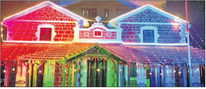
ନୂଆରୂପରେ ଝାରସୁଗୁଡ଼ା ତାଳଘର।

ସମଲେଶ୍ୱର, ୨୮୧ (ପ୍ରମୋଦ ବହିଦାର) ଭାରତୀୟ ତାଳ ସହଯୋଗରେ ରେଳବାଇ ଝାରସୁଗୁଡ଼ା ତାଳ କାର୍ଯ୍ୟାଳୟରେ ଐତିହ୍ୟ ଭବନକୁ ନବାକରଣ କରିଛି। ଝାରସୁଗୁଡ଼ା ୧୩୨ ବର୍ଷ ପୁରାତନ ତାଳସର ବର୍ତ୍ତମାନ ଏକ ଚମତ୍କାର ରୂପ ଧାରଣ କରି ସ୍ଥାପତ୍ୟ ଐତିହ୍ୟରେ ପରିଣତ ହୋଇପାରିଛି। ରକ୍ତବେରକ ଆଲୋକରେ ଝଟକୁଛି ଏହି ଐତିହ୍ୟ। କେନ୍ଦ୍ର ରେଳ, ଯୋଗାଯୋଗ, ଲକ୍ଷ୍ମୀକେନ୍ଦ୍ର, ସୂଚନା ଓ ପ୍ରଯୁକ୍ତିବିଦ୍ୟା