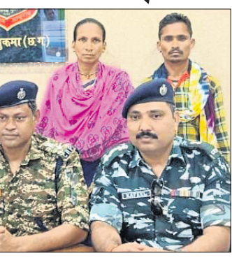
ଆନ୍ତର୍ଯ୍ୟାପଣ କରିଥିବା ତିନି ମାଓବାଦୀ।