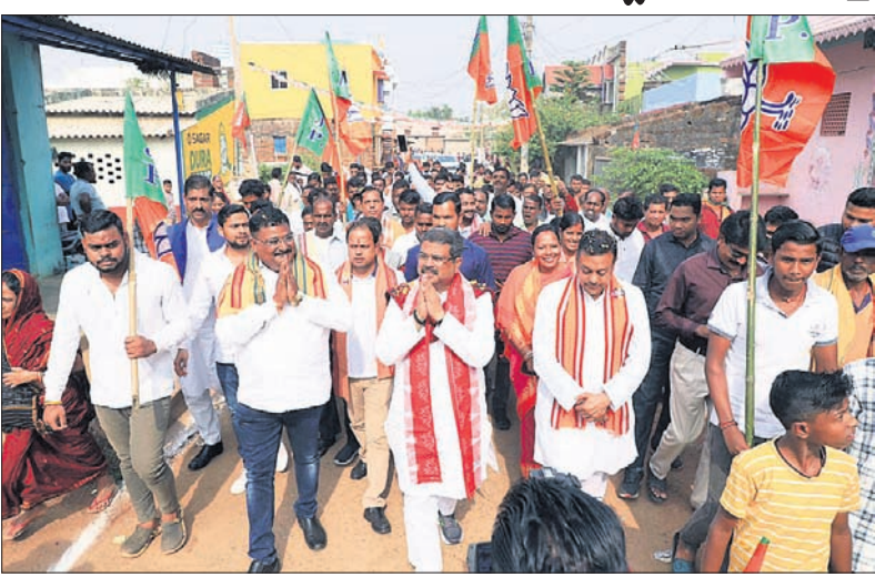
ପିପିଲି ବୁଧ୍ ଜନ ସମ୍ମିଳିତ ଆଧିକାରୀଙ୍କୁ ମୋଦି ଗ୍ୟାରେଣ୍ଡି ପ୍ରଧାନ, ଅନ୍ୟ ନେତୃତ୍ୱ ଓ କର୍ମକର୍ମୀ।