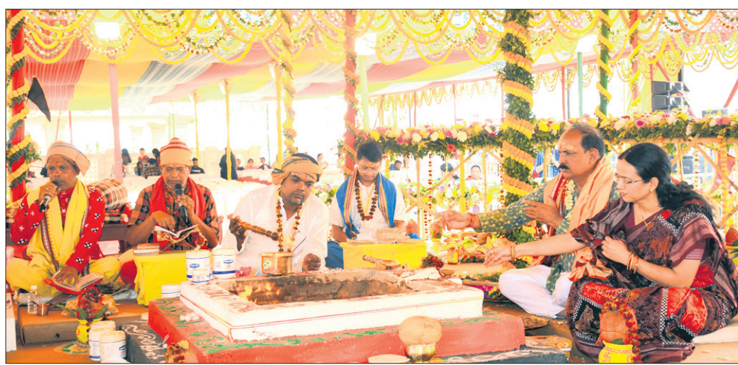
ସମଲେଶ୍ୱରୀକ ମନ୍ଦିର ପରିସରରେ ହୋମ, ଯଜ୍ଞ ଓ ଚଣ୍ଡୀପାଠ।