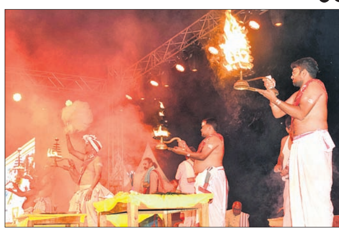
ରଜିନ ଆଲୋକମାଳାରେ ଝଲସୁଛି ମା' ସମଲେଇଙ୍କ ମନ୍ଦିର।