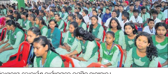
ଜିଲ୍ଲାସ୍ତରୀୟ ଲୋକାର୍ପଣ କାର୍ଯ୍ୟକ୍ରମରେ ଉପସ୍ଥିତ ଛାତ୍ରାଛାତ୍ରୀ।