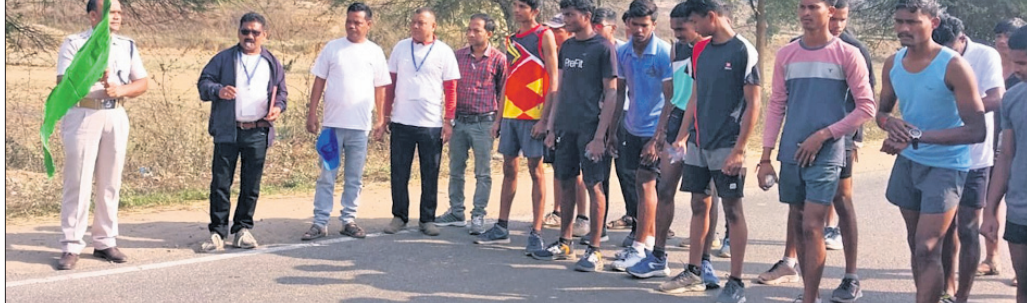
ଧୂବ ଗୋଷ୍ଠି ସମାଜର ବାର୍ଷିକ ସମ୍ମିଳନୀ ସିନାପାଲିରେ ଅନୁଷ୍ଠିତ ହୋଇଯାଇଛି।