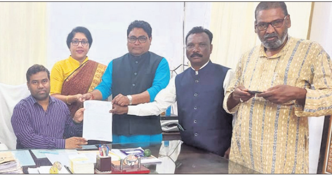
ଭବାନୀପାଟଣା ଉପଜିଲ୍ଲାପାଳଙ୍କୁ ଦାବିପତ୍ର ପ୍ରଦାନ କରାଯାଇଛି।

ଭବାନୀପାଟଣା/ବେହେରା, ୩୦.୧ (ଉତ୍ତମ କୁମାର ଦାଶ/ଭୃଗୁପତି ତିଆରି)