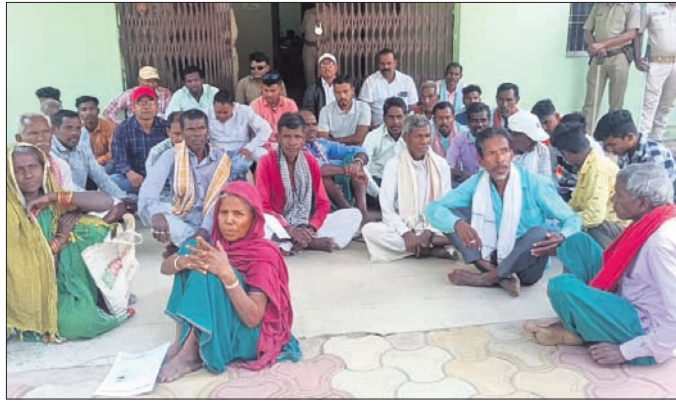
ରୁକ୍ମ କାର୍ଯ୍ୟାଳୟ ସମ୍ମୁଖରେ ଧାରଣା ଦିଆଯାଇଛି। ମାଟି ଓ ହିତାଧିକାରୀ ସାମିଲ ଥିଲେ।