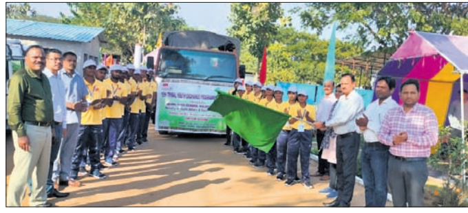
ସବୁଜ ପତାକା ଦେଖାଇ ଶୁଭକାମନା ଜଣାଇଛନ୍ତି ଅଧିକାରୀ।