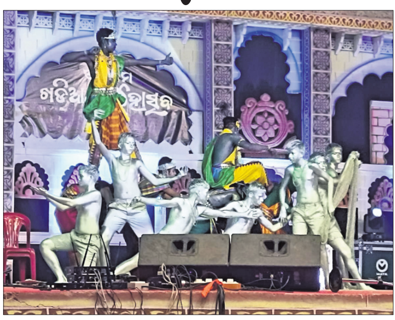
ପରିବେଷିତ ସାଂସ୍କୃତିକ କାର୍ଯ୍ୟକ୍ରମ ।