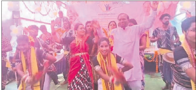
ନବୀନ ଓଡ଼ିଶା ସଚେତନତା କାର୍ଯ୍ୟକ୍ରମରେ ବିଧାୟକ ନାଟୁଛନ୍ତି।