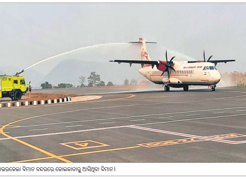
ରାଉରକେଲା ବିମାନ ବନ୍ଦରରେ କୋଲକାତାକୁ ଆସିଥିବା ବିମାନ।

ଡାକ୍ତର ଓ ମହିଳା ମଧ୍ୟରେ ମୁଣ୍ଡିତକ ହେଉଛି ଭାଷାରେ ଗାଳିଗୁଳକ କରିବା ସହ ମାଡ଼ ମାରିଥିଲେ।