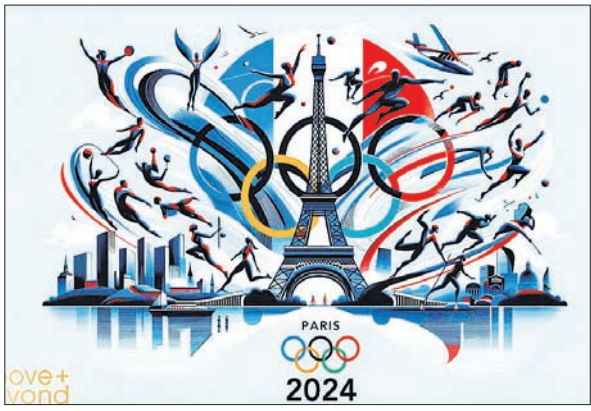
ହେବ। ବିଷୁରେ ପ୍ରଥମ ଧର ପାଇଁ ଏଭଳି ହେବାକୁ ଥିବା ବେଳେ ଏହାର ସୁରକ୍ଷା ବ୍ୟବସ୍ଥା ନେଇ ସମସ୍ୟା ସୃଷ୍ଟି କରିପାରେ। ଏହାକୁ ଦୃଷ୍ଟିରେ ରଖି ପ୍ରାୟ ସରକାରଙ୍କ ପକ୍ଷରୁ ଏହି ନିଷ୍ପତ୍ତି ନିଆଯାଇଛି।

ନୂଆଦିଲ୍ଲୀ, ୩୧।୧ (ପି.ଟି.) ପ୍ୟାରିସ୍ ଅଲିମ୍ପିକ୍ସ ୨୦୨୪ର ଉଦ୍‌ଘାଟନା ସମାରୋହ ପାଇଁ ଦର୍ଶକ ସଂଖ୍ୟା ହ୍ରାସ କରିଛି ପ୍ରାୟ ୨୦୧୬ ୬ ଲକ୍ଷ ଦର୍ଶକ ଏଥିରେ ଯୋଗ ଦେବା ନେଇ ଯୋଜନା ରହିଥିବା ବେଳେ ବର୍ତ୍ତମାନ ଏହି ସଂଖ୍ୟାକୁ ଅଧା କରି ଦିଆଯାଇଛି। ପ୍ରାୟ ୧୦ ଲକ୍ଷ ଦର୍ଶକ କେବଳ ଭାରତୀୟ ଚାମ୍ପିୟନ ଷ୍ଟାଡିୟମରେ ଏହି ସୁତନା ଦେଇଛନ୍ତି। ପ୍ରଥମ ଧର ପାଇଁ କୌଣସି ଷ୍ଟାଡିୟମ ବଦଳରେ ସିନ୍ ନଦୀ କୂଳରେ ଏହି ଉଦ୍‌ଘାଟନା ଉତ୍ସବ ଅନୁଷ୍ଠିତ ହେବ। ଭୁଲାଇ ୨୬ ତାରିଖରେ ଏହା ଆୟୋଜିତ