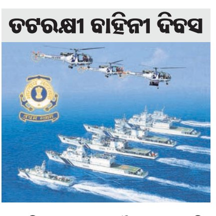
ତଟରକ୍ଷା ବାହିନୀ ଦିବସ

ଇଞ୍ଜିଆନ କୋଷ୍ଟଗାର୍ଡ (ଆଇସିଜି) ହେଉଛି ଭାରତର ଏକ ସାମୁଦ୍ରିକ ଆଇନ ପ୍ରାଣକର୍ତ୍ତା ଓ ସର୍ବ ଏବଂ ଉଦ୍ଧାରକାରୀ ସଂସ୍ଥା, ଯାହା ଏହାର ସଂଲଗ୍ନ କୋର୍ସ୍ ଏବଂ ସ୍ୱତନ୍ତ୍ର ଅର୍ଥନୈତିକ କୋର୍ସ୍ ସହିତ ଏହାର ଆଞ୍ଚଳିକ ଜଳ ଉପରେ ଅଧିକାର ସାମ୍ୟକୁ କରିଥାଏ। ଭାରତ ସଂସଦ କୋଷ୍ଟଗାର୍ଡ ଆକ୍ଟ, ୧୯୬୮ ବ୍ୱାରା ୧ ଫେବୃଆରୀ ୧୯୬୯ରେ ଏହା ଆନୁଷ୍ଠାନିକ ଭାବରେ ପ୍ରତିଷ୍ଠିତ ହୋଇଥିଲା। ଏହା ପ୍ରତିରକ୍ଷା ମନ୍ତ୍ରାଳୟର ଅଧୀନରେ କାର୍ଯ୍ୟ କରିଥାଏ। କୋଷ୍ଟଗାର୍ଡ ଭାରତୀୟ ନୌସେନା, ମଧ୍ୟ ବିଭାଗ, ରାଜସ୍ୱ ବିଭାଗ ଏବଂ କେନ୍ଦ୍ରୀୟ ସଶସ୍ତ୍ର ପୋଲିସ୍ ବାହିନୀ ତଥା ରାଜ୍ୟ ପୋଲିସ୍ ସେବା ସହ ଘନିଷ୍ଠ ସହଯୋଗରେ କାର୍ଯ୍ୟ କରିଥାଏ। ସେମାନଙ୍କ କାର୍ଯ୍ୟ ସମ୍ପର୍କରେ ସଚେତନତା ସୃଷ୍ଟି ଲାଗି ପ୍ରତିବର୍ଷ ଫେବୃଆରୀ ୧ ରେ ଭାରତୀୟ ତଟରକ୍ଷା ବାହିନୀ ଦିବସ ପାଳନ କରାଯାଇଥାଏ। ଇଞ୍ଜିଆନ କୋଷ୍ଟଗାର୍ଡ ୧ ଫେବୃଆରୀ ୨୦୨୪ରେ ଏହାର ୪୮ତମ ଦିବସ ପାଳନ କରୁଛି। ୧୯୬୮ରେ ମାତ୍ର ୭ ଭୁପୃଷ୍ଠ ପ୍ଲାଟଫର୍ମରୁ ଏକ ସାମାନ୍ୟ ଆରମ୍ଭ ହୋଇଥିବା ତଟରକ୍ଷା ବାହିନୀ ପାଖରେ ସମ୍ପୃକ୍ତ ୧୫୮ ଜାହାଜ ଏବଂ ୭୦ଟି ବିମାନ ସହିତ ଏକ ଶକ୍ତିଶାଳୀ ସୁରକ୍ଷାଗଣ୍ଡିର ପରିଣତ ହୋଇଛି। ୨୦୨୪ ବୁକ୍ଷ ଏହା ୨୦୦ ଭୁପୃଷ୍ଠ ପ୍ଲାଟଫର୍ମ ଏବଂ ୮୦ ବିମାନ ସାମ୍ୟ କରିବା ଲକ୍ଷ୍ୟ ଧାର୍ଯ୍ୟ କରିଛି। ଭାରତୀୟ ତଟରକ୍ଷା ବାହିନୀ ଗଠନ ସମୟରେ ତୁରନ୍ତ ଛୋଟ ଜର୍ଜେଟ ଏବଂ ପାଞ୍ଚଟି