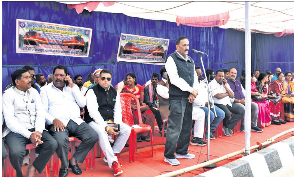
ଯାକପୁର-ଧାମରା ରେଳପଥ ସଂଗ୍ରାମ ସମିତି ପକ୍ଷରୁ ବିଭିନ୍ନ ଦାଦି ନେଇ ଭୁବନେଶ୍ୱର ରେଳସେବା ସମ୍ମୁଖରେ ବୁଧବାର ଧାରଣା ଦିଆଯାଇଛି।