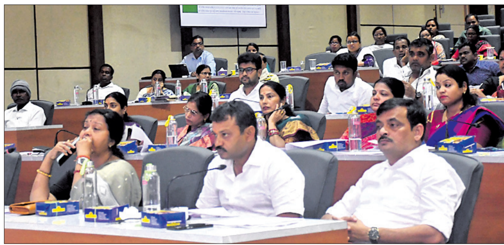
ବୈଠକରେ ଉପସ୍ଥିତ ସମସ୍ତ ସ୍ଵାଖ୍ୟ କର୍ମଚାରୀଙ୍କୁ, କର୍ମଚାରୀଙ୍କ ଓ ଅନ୍ୟମାନେ।

କରାଯାଇଥିଲା। ବୈଠକରେ ମୋଟ ୨୨ଟି ପ୍ରସ୍ତାବ ଆଗତ କରାଯାଇଥିଲା। ସେଥିମଧ୍ୟରୁ ଗୋଟିଏ ପ୍ରସ୍ତାବ ଅଗ୍ରାହ୍ୟ ହୋଇଥିବାବେଳେ ଅନ୍ୟଗୁଡ଼ିକ ବିଚାର ପାଇଁ ଗ୍ରହଣ କରାଯାଇଛି।