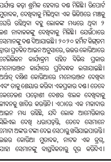
ସିଲିଏଲ: ଉତ୍ତର କୋରିଆର ଶକ୍ତ ଆଇନକାର୍ଯ୍ୟକ୍ରମ ବାବଦରେ ସମସ୍ତେ ଜାଣନ୍ତି। ସବୁଥର ଖବରରେ ଆଶ୍ଚର୍ଯ୍ୟ କରିବା ଭଳି କିଛି ନୂଆ ତଥ୍ୟ ରହିଥାଏ। ନିକଟରେ ୨ ଜଣ ନାବାଳକଙ୍କୁ ଟିଭି ସିରିଏଲ ଦେଖିବାକୁ ନେଇ ଭୟଙ୍କର ଦଣ୍ଡ ମିଳୁଥିବା ଜଣାପଡ଼ିଛି। ଦକ୍ଷିଣ କୋରିଆର କେ-ଡ୍ରାମା ଦେଖିବା ଏବଂ ଶେୟାର କରିବାର ୨ ଜଣ ୧୬ ବର୍ଷାୟକୁ ୧୨ ବର୍ଷ

ପର୍ଯ୍ୟନ୍ତ କଡ଼ା ଶ୍ରମିକ ହେବାର ଦଣ୍ଡ ମିଳିଛି। ରିପୋର୍ଟ ମୁତାବକ, ଦେଖିବାକୁ ମିଳୁଥିବା ଏକ ଭିଡିଓରେ ମଞ୍ଚକୁ ଘେରି ରହିଥିବା ବହୁ ଲୋକଙ୍କ ମଧ୍ୟରେ ଥିବା ୨ ଜଣ ନାବାଳକଙ୍କୁ ଦେଖିବାକୁ ମିଳିଛି। ଯେଉଁଠାରେ ସେମାନଙ୍କୁ ଦଣ୍ଡ ଦିଆଯାଇଛି। ୨୦୨୦ ହର୍ମିଟ୍ କିଙ୍ଗଡମ୍ ବ୍ୱାରା ପ୍ରଚଳିତ ଆଇନ ଅନୁସାରେ, ଉତ୍ତର କୋରିଆରେ ଚେଲିଜିଜନ କାର୍ଯ୍ୟକ୍ରମ ସହିତ ବିଚଳ ପ୍ରକାର ମନୋରଞ୍ଜନ କାର୍ଯ୍ୟରେ ପ୍ରତିବନ୍ଧକ ଲାଗାଯାଇଛି। ଅର୍ଥାତ୍ ଦକ୍ଷିଣ କୋରିଆରେ ମନୋରଞ୍ଜନ ଦେଖିବା ଏବଂ ତାକୁ ଶେୟାର କରିବା ଏକପ୍ରକାର ଦଣ୍ଡ। ତେବେ କେତେଜଣ ପଡ଼ୋଶୀ ଦେଶର ଝଲକ ଦେଖିବାକୁ ଜୀବନକୁ ଖାତିର କରନ୍ତି। ଏଠାରେ ଏକ ମଜାଦାର ଆଇନ ମଧ୍ୟ ରହିଛି, ଯଦି ଲୋକ ଆମେରିକାର ସିଲିଏଲ ଦେଖି ଧରାପଡ଼ି, ତେବେ ସେମାନେ ମୋଟା ଅକର ଟଙ୍କା ଦେଇ ସେଠାରୁ ଖସିଯାଇପାରନ୍ତି। ଉତ୍ତର କୋରିଆ ମୁତାବକ, ନାଟକ ଏକ ଡ୍ରଗ୍, ଯାହା ସେମାନଙ୍କୁ ବାସ୍ତବିକତାରୁ ଦୂର କରିଦିଏ।