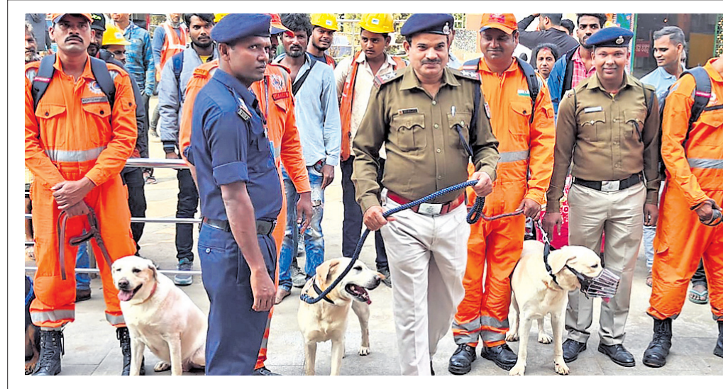
କଟକ ରେକର୍ଡ୍‌ଶେରରେ ଆରବିଏସ୍ ପକ୍ଷରୁ ସମାଜୀ କୁଳ୍ପର ସହାୟତାରେ ପୁରସ୍କା ବ୍ୟବସ୍ଥା ଯାଞ୍ଚ କରାଯାଇଛି ।