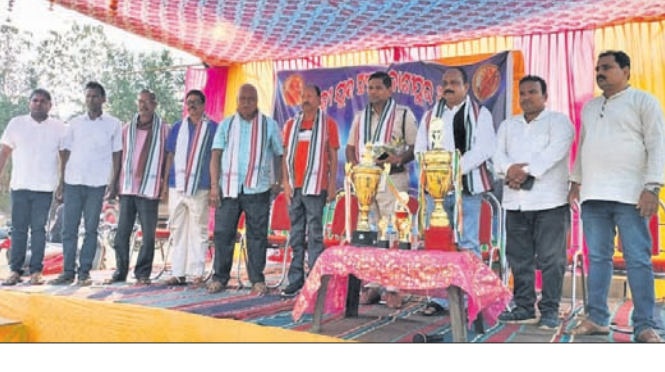
ମହତ୍ତରାୟ ରହିଥିଲେ । ନିରାକରପୁର ଆନୁକୂଲ୍ୟରେ ଚାଲିଥିବା ୪୧ତମ ରାଜ୍ୟସ୍ତରୀୟ କାଶୀପୁର ପୁରୁବଲ ଟୁର୍ନାମେଣ୍ଟର ଦ୍ୱିତୀୟ ସେମି ଫାଇନାଲ ମ୍ୟାଚ ରୁକ୍ମକୁଳା ଆନ୍ତର୍ଜାତୀୟ ବିଜିଏମ୍ ଦିଲ୍ଲୀ ଯୋଗଦେଇ ପାଖାପାଖି ୧୦୦ ରନ କରିବା ସହ ୧୩୯ ରନ କରିବା ସହ ଏହି ମ୍ୟାଚ ଥିଉଟ୍ ଉଲଟେକ୍ରେ ବିଜୟୀ ହୋଇଥିଲା ।

ଡିଆ ପଞ୍ଚାୟତର କାଶୀପୁର ଖେଳଘାଟିଆରେ ମାଂ ତେଜର ଦୁର୍ବଳତାକୁ ଆନୁକୂଲ୍ୟରେ ଚାଲିଥିବା ୪୧ତମ ରାଜ୍ୟସ୍ତରୀୟ କାଶୀପୁର ପୁରୁବଲ ଟୁର୍ନାମେଣ୍ଟର ଦ୍ୱିତୀୟ ସେମି ଫାଇନାଲ ମ୍ୟାଚ ରୁକ୍ମକୁଳା ଆନ୍ତର୍ଜାତୀୟ ବିଜିଏମ୍ ଦିଲ୍ଲୀ ଯୋଗଦେଇ ପାଖାପାଖି ୧୦୦ ରନ କରିବା ସହ ୧୩୯ ରନ କରିବା ସହ ଏହି ମ୍ୟାଚ ଥିଉଟ୍ ଉଲଟେକ୍ରେ ବିଜୟୀ ହୋଇଥିଲା ।