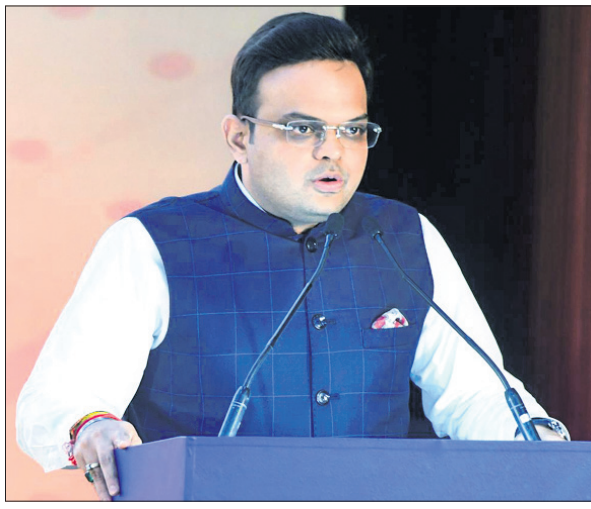
୨୦୨୧ରେ ଜୟ ଶାହା ଏସିସିର ବାର୍ଷିକ ବୈଠକରେ ସଭାପତି ନିଯୁକ୍ତ ହୋଇଥିଲେ।

ନୂଆଦିଲ୍ଲୀ, ୩୧।୧ (ପି.ଟି.) ଭାରତୀୟ କ୍ରିକେଟ କଣ୍ଠେଇ ବୋର୍ଡ (ବିସିଆଇ) ସମ୍ପାଦକ ଜୟ ଶାହା କ୍ରମାଗତ ତୃତୀୟ ଧର ପାଇଁ ଏସିଆନ୍ କ୍ରିକେଟ କାଉନ୍ସିଲ(ଏସିସି)ର ସଭାପତି ନିଯୁକ୍ତ ହୋଇଛନ୍ତି। ଶ୍ରୀଲଙ୍କା କ୍ରିକେଟର ସଭାପତି ଶାମି ସିଲଭା ତୃତୀୟ ଧର ପାଇଁ ଶାହାଙ୍କ ନାମ ପ୍ରସ୍ତାବ କରିଥିଲେ। ଏପରି କି ସମସ୍ତ ଏସିସି ସହଯୋଗୀ ରାଷ୍ଟ୍ର ସହାୟତା ସର୍ବସମ୍ମତକ୍ରମେ ସମର୍ଥନ କରିଥିଲେ। ଇଣ୍ଡୋନେସିଆର ବାଲିରେ ଅନୁଷ୍ଠିତ ଏସିସିର ବାର୍ଷିକ ସାଧାରଣ ବୈଠକରେ ଏହି ପ୍ରସ୍ତାବରେ ମୋହର ଲାଗିଥିଲା। ପ୍ରଥମ ଧର ପାଇଁ କାହୁଆରୀ