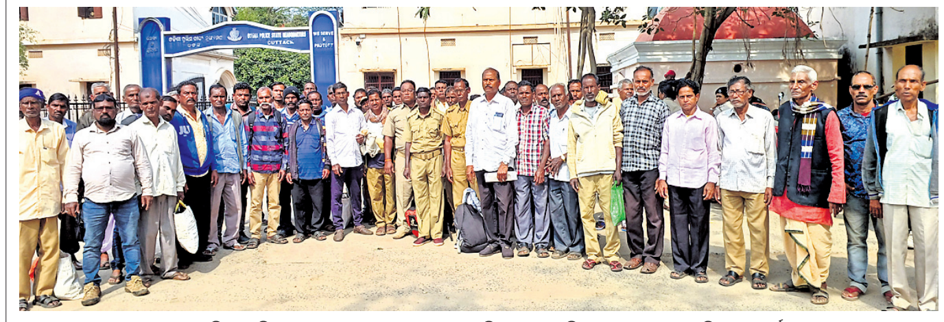
୭ ଦମ୍ପୀ ଦାବି ନେଇ ନିଖୁନ ଭଙ୍ଗ କ୍ରମରେ ସଂଘ ପକ୍ଷରୁ କଟକସ୍ଥିତ ରାଜ୍ୟ ପୋଲିସ୍ ମୁଖ୍ୟାଳୟ ସମ୍ମୁଖରେ ବିରୋଧ ପ୍ରଦର୍ଶନ ।