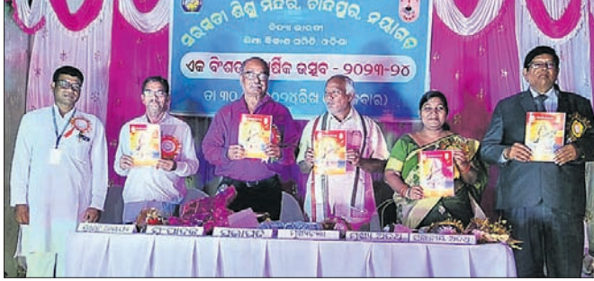
ଅତିଥିମାନେ ପତ୍ରିକା ଉନ୍ନୋତ୍ତମ କରୁଛନ୍ତି ।