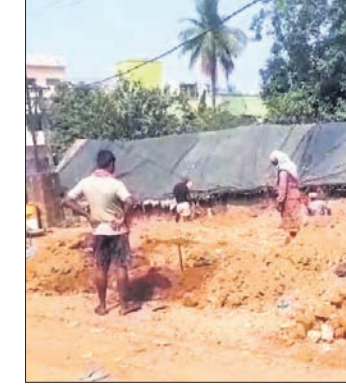
ଜବରଦଖଲ ହୋଇଥିବା ସ୍ଥାନ।

ସାମନ୍ତରାଜ୍ୟରୁ ପୁରୁଣା ଚେକ ଗେଟ୍ ଜମି ଗୋଟର ବିହାରକୁ ଥିବା ପ୍ରଦେଶ ପଥର ବାହାଣ ପାଖରେ ନୂଆ ଗାଁ ମୌଜାରେ ପାଖାପାଖି ୩ ଏକର ଜମି ରହିଛି। ସେଥିରୁ ୯୦ ଭାଗ ବିଜିଲ ବର୍ଗର ବ୍ୟକ୍ତି ବିଶେଷଙ୍କ ଦ୍ୱାରା ଜବରଦଖଲରେ ଥିଲା। ଜବରଦଖଲ ପୂର୍ଣ୍ଣ ଅବଶିଷ୍ଟ୍ୟାତ ଜମିକୁ ଏବେ କୌଣସି ବ୍ୟକ୍ତି ନିଜ ଦଖଲକୁ ନେଇ ନିର୍ମାଣ କାର୍ଯ୍ୟ ଆରମ୍ଭ କରିଥିବା ଦେଖିବାକୁ ମିଳିଛି। ଅନ୍ୟପକ୍ଷେ ଏହି ଅଞ୍ଚଳରେ ସ୍ଥାନ ଅଭାବ କାରଣରୁ ସ୍ଥଳ୍ୟ ବ୍ୟବସାୟୀ ରାସ୍ତାରେ ବସି ବେପାର କରନ୍ତି, ଫଳରେ ଗ୍ରାହକ ସମସ୍ୟା ଉପସ୍ଥୁତି। ତତ୍ସଂହତ ପୋଲିସ୍ ଫାଣ୍ଡି ଓ ସାଧାରଣ ଶୈତାଳୟ ପାଇଁ ମଧ୍ୟ ଖାଲି ସ୍ଥାନ ମିଳୁନାହିଁ। ଏନେଇ ଅଞ୍ଚଳବାସୀ ପ୍ରଶାସନ ପାଖରେ ଅଭିଯୋଗ କରିଛନ୍ତି। ସମସ୍ତ ସମସ୍ୟାର ସମାଧାନ ପାଇଁ ଚାଲିଥିବା ବେଳାରେ ଜବରଦଖଲ ଓ ନିର୍ମାଣ କାର୍ଯ୍ୟକୁ ବନ୍ଦ କରାଗଲେ ଉପକୃତ ହେବେ ବୋଲି ଅଞ୍ଚଳବାସୀ କହିଛନ୍ତି।