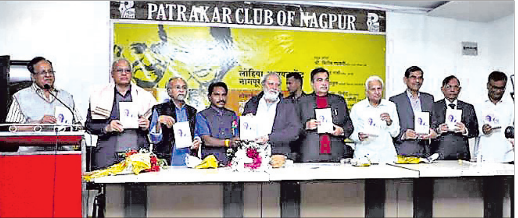
ନାଗପୁର ପ୍ରେସ୍‌କ୍ଲବ୍‌ରେ ଆୟୋଜିତ କାର୍ଯ୍ୟକ୍ରମରେ କେନ୍ଦ୍ର ସଭ୍ୟ ପରିବହନ ମନ୍ତ୍ରୀ ନାଚିକେତା ଖମାରୀ ଓ ଅନ୍ୟମାନେ।