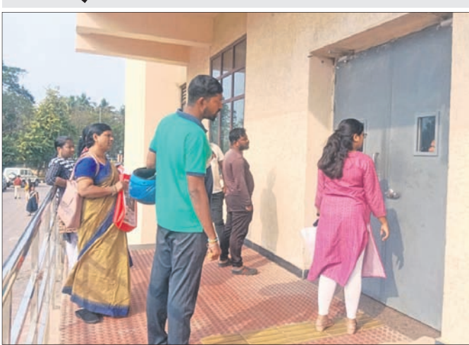
ବିଏମ୍‌ସି କାର୍ଯ୍ୟାଳୟର ଫାଟକ ବନ୍ଦ ହେବାକୁ ଲୋକେ ଅପେକ୍ଷା କରିଛନ୍ତି।

ଦୃଷ୍ଟିହୀନଙ୍କ ପାଇଁ କାମ କରୁଥିବା ଅନ୍ତର୍ଜାତୀୟ ମାନବାଧିକାର ପ୍ରୋତ୍ସାହନ କାର୍ଯ୍ୟକ୍ରମର ଆରମ୍ଭ ମହଲା କହିଛନ୍ତି, ଦୃଷ୍ଟିହୀନଙ୍କୁ ବିଏମ୍‌ସି ଉଠାଇନେଇ କେଉଁଠି ରଖିଛନ୍ତି ତାର ପଢ଼ା ମିଳୁନାହିଁ।