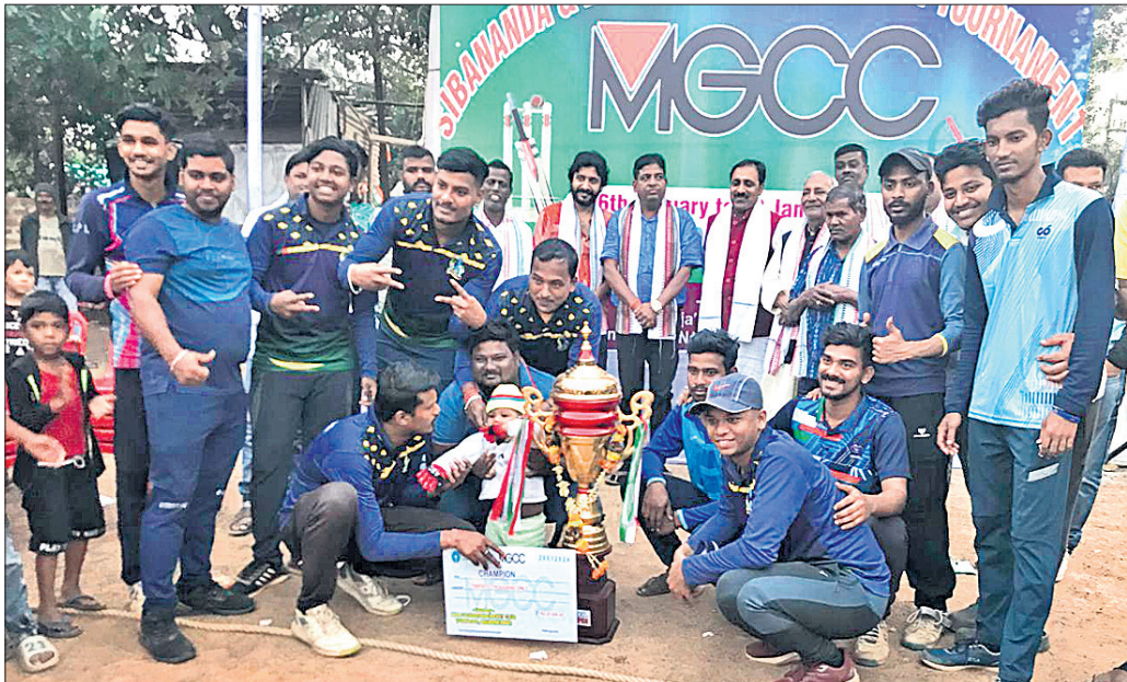
ଭିଏସ୍‌ଏ ନଗର ମା' ଗୋବିନ୍ଦାୟାଣୀ କ୍ରିକେଟ କ୍ଲବ୍ ତରଫରୁ ଆୟୋଜିତ ଶିଶୁମାନଙ୍କ ମଙ୍ଗଳ ମେମୋରିଆଲ କ୍ରିକେଟ ଟୁର୍ଣ୍ଣାମେଣ୍ଟର ଉଦ୍‌ଘାଟନା ଦିବସରେ ଅତିଥିଙ୍କ ଗହଣରେ ଚାମ୍ପିୟନ ବାଣୀବିହାର ଲାଭ୍ ଲାଭ୍ ବିମ୍ବର ଖେଳାଳି।