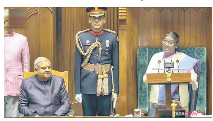
ସଂସଦର ଉଭୟ ସଦନକୁ ସମ୍ବୋଧିତ କରୁଛନ୍ତି ରାଷ୍ଟ୍ରପତି ଡ୍ରୌପଦୀ ମୁର୍ମୁ। ନିକଟରେ ଉପସ୍ଥିତ ଉପରାଷ୍ଟ୍ରପତି ଜଗଦୀପ ଧନକର।

ରାଷ୍ଟ୍ରପତି ଡ୍ରୌପଦୀ ମୁର୍ମୁ ରୁଧିରୀ ପାଲିମେଣ୍ଟର ଉଭୟ ସଦନକୁ ସମ୍ବୋଧିତ କରିବା ସହ ବଜେଟ୍ ଅଧିବେଶନ ଆରମ୍ଭ ହୋଇଛି। ନୂଆ ସଂସଦ ଭବନରେ ପ୍ରଥମ ଥର ପାଇଁ ସମ୍ବୋଧନ କରି ରାଷ୍ଟ୍ରପତି କହିଛନ୍ତି, ଅଯୋଧ୍ୟାରେ ଶତାବ୍ଦୀ ପୁରୁଣା ରାମମନ୍ଦିର ବର୍ତ୍ତମାନ ଏକ ବାସ୍ତୁବତା ହୋଇଥିବାବେଳେ ସମ୍ବିଧାନର ଅନୁଚ୍ଛେଦ ୩୭୦ ଉଚ୍ଛେଦକୁ ନେଇ ଉପସ୍ଥିତ ଆଶଙ୍କା ଏକ ଇତିହାସ। ରାଷ୍ଟ୍ରପତି ଭାରତୀୟ ଅର୍ଥନୀତିର ବିଚଳ ଦିଗ ଉପରେ ଆଲୋଚନା କରିବା ସଙ୍ଗେ ସଙ୍ଗେ ମୋଦି ସରକାରଙ୍କ ୧୦ ବର୍ଷର ଶାସନ କାଳରେ ମିଳିଥିବା ସଫଳତା ସମ୍ପର୍କରେ ନିଜ ବକ୍ତବ୍ୟରେ ଅବତାରଣା କରିଛନ୍ତି। ତାଙ୍କ ବକ୍ତବ୍ୟର ଏକ କଠିକୁ ଲୋକ ସଭାରେ ଉପସ୍ଥାପିତ କରାଯାଇଛି। ଅର୍ଥନୀତି ନିର୍ମୂଳା ସାତାଗାମୀନ୍ ଗୁରୁବାର ଲୋକ ସଭାରେ ୨୦୨୪ ଆର୍ଥିକ ବର୍ଷର ଅନ୍ତରାଶ ବଜେଟ୍ ଉପସ୍ଥାପନ କରିବେ। ଏହା ହେବ ସାତାଗାମୀନ୍ ଶସ୍ତ୍ର ଏବଂ ମୋଦି ସରକାରଙ୍କ ଦ୍ୱିତୀୟ ପାଲିର ଦ୍ୱିତୀୟ ବାର୍ଷିକ ବଜେଟ୍। ଆସନ୍ତା ଏପ୍ରିଲ-ମେ'ରେ ସାଧାରଣ ନିର୍ବାଚନ ଅନୁଷ୍ଠିତ ହେବ। ନୂଆ ସରକାର ଗଠନ ପରେ