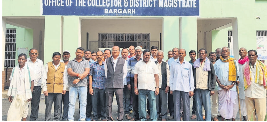
ଜିଲ୍ଲାପାଳଙ୍କୁ ଫେରାଦ ହୋଇଥିବା ଆଦିବାସୀ ସଂଘର ସଦସ୍ୟବୃନ୍ଦ ।

ସ୍ୱତନ୍ତ୍ର ଭନୟନ ପରିଷଦରେ ବିଭିନ୍ନ ପ୍ରକଳ୍ପ ଅନୁମୋଦନକୁ ନେଇ ପଦ୍ମପୁର ଉପଖଣ୍ଡ ଆଦିବାସୀ ସଂଘ ଅସତ୍ରୋଷ ପ୍ରକାଶ କରିଛି । ସେମାନଙ୍କ ଅକାଶରେ ମନପୁଣ୍ୟାଭାବେ ପ୍ରକଳ୍ପ ରୁଟିକୁ ଅନୁମୋଦନ କରାଯାଇଥିବା ସଂଘ ଅଭିଯୋଗ କରିଛି । ଅନ୍ୟପକ୍ଷେ ସ୍ୱତନ୍ତ୍ର ଭନୟନ ପରିଷଦରେ ପଦ୍ମପୁର ଉପଖଣ୍ଡର ପଦ୍ମପୁର, ଝାରବନ୍ଧ ଏବଂ ପାଇକମାଳ ବ୍ଲକ୍ ଅନ୍ତର୍ଭୁକ୍ତ କରିଥିବା ଯୋଗୁଁ ସଂଘ ପକ୍ଷରୁ ମୁଖ୍ୟମନ୍ତ୍ରୀଙ୍କୁ କୃତଜ୍ଞତା ଜ୍ଞାପନ କରାଯାଇଛି । ତେବେ ପ୍ରକଳ୍ପ ଅନୁମୋଦନବେଳେ ଅଣଦେଖା କରାଯାଇଥିବା ସଂଘ ଅଭିଯୋଗ କରିଛି । ଫଳରେ ଅନୁମୋଦିତ ପ୍ରକଳ୍ପ ରୁଟିକୁ ଖାରଜ କରି ଆଦିବାସୀଙ୍କ ମତାମତ ନେଇ ପୁଣିଥରେ ନୂତନ ପ୍ରକଳ୍ପ ରୁଟିକୁ