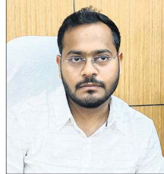
ନୂଆ ନିଲାସାଳ ଚୋର ଶିଖାରୀ ଉପାଧିକାରୀ।

ଉପରାଜ୍ୟ ଡିଏମ୍ପି ଓ ଡିଏସ୍ପିଙ୍କୁ ଉପସ୍ଥାପନ କରିବାକୁ ନିର୍ଦ୍ଦେଶ ଦିଆଯାଇଛି। ଉପରାଜ୍ୟ ଡିଏମ୍ପି ଓ ଡିଏସ୍ପିଙ୍କୁ ଉପସ୍ଥାପନ କରିବାକୁ ନିର୍ଦ୍ଦେଶ ଦିଆଯାଇଛି।