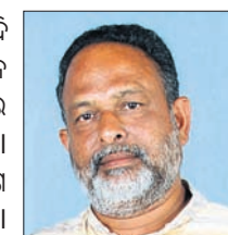
—ଲିଙ୍ଗାବଳୀ, ଆବାହକ, ପୂର୍ଣ୍ଣ ଓଡ଼ିଶା କୃଷକ ସଙ୍ଗଠନ ସମ୍ପାଦକ ସମିତି

୨୦୨୪ ସାଧାରଣ ନିର୍ବାଚନ ପୂର୍ବରୁ ମୋଟି ସରକାରଙ୍କ ଏହା ହେଉଛି ଏକ ମଧ୍ୟବର୍ତ୍ତୀକାଳୀନ ବଜେଟ୍। ଆଖି ଆଗରେ ରଖି ଦିଆଯାଉଥିଲା, ଏହି ବଜେଟ୍‌ରେ କୃଷକମାନଙ୍କ ପାଇଁ କିଛି ଯୋଷଣା କରାଯିବ। ହେଲେ ଏହି ବଜେଟ୍ ଅଗଣିତ କୃଷକଙ୍କୁ ନିରାଶ କରିଛି। କୃଷକମାନଙ୍କ ଆୟ ୨୦୨୩ ହେଲାଣି। ସାମାଜିକ କମ୍ପ୍ୟୁଟିଂରୁ ମୁକ୍ତିଲାଭ କରିବାକୁ ସାମଗ୍ରୀର ସର୍ବନିମ୍ନ ସହାୟକ ମୂଲ୍ୟ ଉତ୍ପାଦନ ଖର୍ଚ୍ଚ ବ୍ୟବସ୍ଥା ମଧ୍ୟ ହୋଇନାହିଁ। ଧାନ, ଗହମର ସର୍ବନିମ୍ନ ସହାୟକ ଦରବୃଦ୍ଧି କରାଗଲା ନାହିଁ। ରାଜ୍ୟାଧିକାରୀମାନେ ମଧ୍ୟ ବଜେଟ୍‌ରେ କୌଣସି ବ୍ୟବସ୍ଥା ନାହିଁ। ଦରଦାମ ବୃଦ୍ଧି ରୋକିବାକୁ କିଛି ଉପାୟ ନାହିଁ। ସରକାର ଭାବୁଛନ୍ତି ଯେ, ରାମ ନାରେ ନିର୍ବାଚନ ବିଜେତା ପାରି ହୋଇଯିବେ। ସାଧାରଣ ଗରିବ ଖିରାଣିଆ କୃଷକମାନଙ୍କ ପାଇଁ କିଛି ନେଇଲେ ଲୋକେ ଭୋକିଯିବେ। କିନ୍ତୁ ଏହା ସରକାରଙ୍କ ଭ୍ରମ। ୨୦୨୪ ସାଧାରଣ ନିର୍ବାଚନରେ ସାଧାରଣ ଜନତା, ଚାଷୀ ଶ୍ରେଣୀ ଉଚ୍ଚିତ୍ତ୍ୱ ବ୍ୟବସ୍ଥା କରେ।