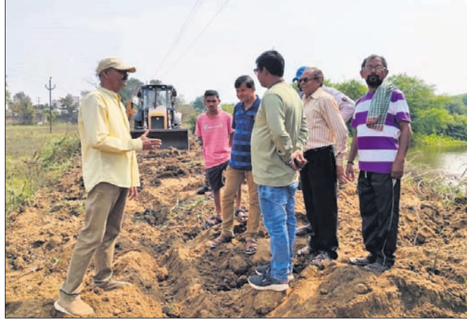
ରାମେଶ୍ୱର ନଗର ପଡ଼ାବାସୀ ନିକଟ୍ଠରେ ରୋଡ୍ ତିଆରି କରୁଛନ୍ତି।

ଉପରାଜ୍ୟ ଡିଏମ୍ପି ଓ ଡିଏସ୍ପିଙ୍କୁ ଉପସ୍ଥାପନ କରିବାକୁ ନିର୍ଦ୍ଦେଶ ଦିଆଯାଇଛି। ଉପରାଜ୍ୟ ଡିଏମ୍ପି ଓ ଡିଏସ୍ପିଙ୍କୁ ଉପସ୍ଥାପନ କରିବାକୁ ନିର୍ଦ୍ଦେଶ ଦିଆଯାଇଛି।