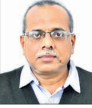
—ପୁରୋଗ ପାଣିଗ୍ରାହୀ, ସାଧାରଣ ସମ୍ପାଦକ, ଓଡ଼ିଶା କୃଷକ ସଭା

ଅନ୍ତରୀଣ ବଜେଟ୍‌ରେ କୃଷି, ଗ୍ରାମୀଣ ବିକାଶ, ଖାଦ୍ୟ ସୁରକ୍ଷା, ଏମ୍‌ଏମ୍‌ଆର୍‌ଇଏସ୍ ଏବଂ ଗ୍ରାମୀଣ ଋଣ ପ୍ରଦାନ କ୍ଷେତ୍ର ପାଇଁ ମିଳିଥିବା ଅନୁଦାନ ଅତି ନିରାଶଙ୍କର। ପ୍ରଧାନମନ୍ତ୍ରୀ କୃଷକ ସମ୍ପଦ ଯୋଜନା, ମୃତ୍ୟୁ ଲାଭ ଟିକିଟାଲ ବଜାର ସହିତ ସଂଯୋଗ, ପୁସ୍ତକାଳୀ ପ୍ରୋସ୍ତାହନ ପାଇଁ ଯୋଷଣା, ଫିକ୍ସାଲ କିଷାନ ଯୋଜନା, ପ୍ରଧାନମନ୍ତ୍ରୀ ଫାସଲ ବାମା ଯୋଜନା ଇତ୍ୟାଦି ପାଇଁ ହୋଇଥିବା ଅର୍ଥ ଅନୁଦାନ ଯୋଷଣା କେବଳ ଫଣୀ ଶବ୍ଦ। ଏପରିକି ଏହି ବଜେଟ୍ ବେଳେ ଯୁବକ-ୟୁବାପୀମାନଙ୍କୁ ସମ୍ପୂର୍ଣ୍ଣରୂପେ ହତାଶ କରିଛି। ଏହା ଏକ କର୍ପୋରେଟ୍ ସମ୍ପାଦନା, ଚାଷୀ ଏବଂ ଗରିବ ଜନସାଧାରଣଙ୍କ ବିରୋଧୀ ବଜେଟ୍।