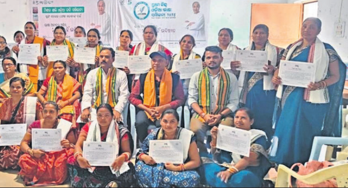
ଅତିଥିଙ୍କ ଗହଣରେ କବିତା ପାଠ କରିଥିବା ଏସଏଚଏ ମହିଳାମାନେ ।

ବରଗଡ଼, ୧୨ (ପ୍ରେମାନନ୍ଦ ଖମ୍ବାରୀ) ବରଗଡ଼ ଜିଲ୍ଲା ମିଶନ ଶକ୍ତି ଆନୁକୂଲ୍ୟରେ ସ୍ଥାନୀୟ ମିଶନ ଶକ୍ତି ଭବନ ପରିସରରେ ମହିଳା ସ୍ୱୟଂ ସହାୟକ ଗୋଷ୍ଠି (ଏସଏଚଏ) ସଦସ୍ୟାଙ୍କୁ ଅନ୍ତର୍ଦ୍ଧିତ ରୁଣ୍ଡାବଳୀକୁ ବିକଶିତ କରିବା ପାଇଁ ରୁରୁବାର ଓଡ଼ିଆ କବି ସମ୍ମିଳନୀ ଅନୁଷ୍ଠିତ ହୋଇଯାଇଛି ।