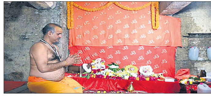
ଜ୍ଞାନବାପି ମସଜିଦ୍ ପରିସରରେ ଜଣେ ହିନ୍ଦୁ ପୂଜକ ପୂଜାର୍ଚ୍ଚନା କରୁଛନ୍ତି।

ଦୀର୍ଘ ୩୦ ବର୍ଷ ପରେ ଜ୍ଞାନବାପି ମସଜିଦ୍ ଦେଇଥିବା ପୂଜାର୍ଚ୍ଚନା ଓ ଆରତି କରିଛନ୍ତି ହିନ୍ଦୁ ପକ୍ଷ। ଗତ ୩୦ ବର୍ଷ ହେଲା ଏଠାରେ ପୂଜାର୍ଚ୍ଚନା ଉପରେ ରୋକ ଲାଗିଥିବା ବେଳେ ରୁଧିର ବାରାଣାସୀ ଜିଲ୍ଲା କୋର୍ଟ ଏହି ଐତିହାସିକ ରାୟ ଦେଇଥିଲେ। ଜ୍ଞାନବାପି ମସଜିଦ୍ ଦେହମେଣ୍ଡରେ ଥିବା "ବ୍ୟାସ କା ଚେହେଳା" ଠାରେ ହିନ୍ଦୁ ପକ୍ଷଙ୍କ ପୂଜାର୍ଚ୍ଚନା ପାଇଁ କୋର୍ଟ ଅନୁମତି ଦେଇଥିଲେ। କୋର୍ଟଙ୍କ ଆଦେଶ ପ୍ରତ୍ୟାବଳୀରୁ ରାଷ୍ଟ୍ରପତି ଜିଲ୍ଲାପାଳ ଓ ଡିଆଇଜିଙ୍କ ଉପସ୍ଥିତିରେ ଏଠାରେ ରହିଥିବା ବ୍ୟାସଚୈତ୍ୟ ଚୂଡ଼ିକୁ ହଟାଇଥିଲେ। ରାତି ପ୍ରାୟ ୩ ଘଣ୍ଟାରେ ଏହି ମାମଲାରେ ଆଦେଶକାରୀ ଥିବା ବ୍ୟାସ ପରିବାରର ମୁଖ୍ୟ ପୂଜକଙ୍କ ଦ୍ୱାରା ଅଖଣ୍ଡ କୋଡି ପ୍ରକଳନ କରାଯାଇଥିଲା। ସେହିପରି ସୁଯୋଗ୍ୟ ପୂର୍ବରୁ ମଙ୍ଗଳ ଆଳତୀ ସମ୍ପନ୍ନ ହୋଇଥିଲା। କୋର୍ଟଙ୍କ ଆଦେଶ ଅନୁଯାୟୀ ପ୍ରତିଦିନ ଏଠାରେ ପୂଜକଙ୍କ ଦ୍ୱାରା ମଙ୍ଗଳ ଆଳତି, ସନ୍ଧ୍ୟା ଆଳତି ଏବଂ ଶୟନ ଆଳତି କରାଯିବ ବୋଲି ହିନ୍ଦୁ ପକ୍ଷ ପକ୍ଷରୁ