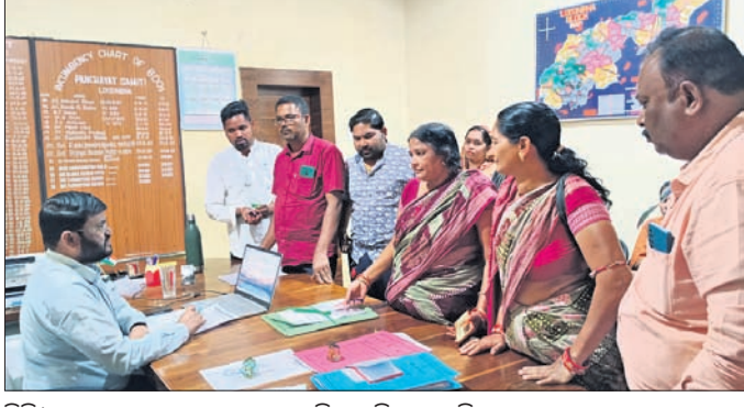
ବିତଠୁଙ୍କୁ ସରପଞ୍ଚ ସଂଘ ତରଫରୁ ଦାବିପତ୍ର ଦିଆଯାଇଛି।

ବଲାଙ୍ଗୀର ଜିଲ୍ଲା ଲୋଇସିଂହା ବ୍ଲକ୍ରେ ଅଣଦେଖା ଅଭିଯୋଗ ଉଠାଇଛି। ଉପରାଜ୍ୟ ଡିଏମ୍ପି ଓ ଡିଏସ୍ପିଙ୍କୁ ଉପସ୍ଥାପନ କରିବାକୁ ନିର୍ଦ୍ଦେଶ ଦିଆଯାଇଛି।