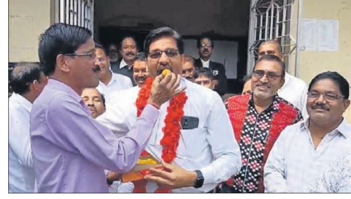
ଉଚ୍ଚେଦ ସମୟରେ ରାୟ ଆସିବା ପରେ ସମାବେଶରୀ ସଂଘ ସଭାପତି ଜିଲ୍ଲା ଓକିଲ ସଂଘ ସଭାପତିଙ୍କୁ ମିଠା ଖୁଆଇଛନ୍ତି ।

ବରଗଡ଼ ସହରରେ ଲୋକ୍ଷୁ ମିଶ୍ର ଛକରୁ ନୂଆ ଜିରା ବ୍ରିଜ୍ ପର୍ଯ୍ୟନ୍ତ ରାସ୍ତାପାର୍ଶ୍ୱ ଜବରଦଖଲ ଉଚ୍ଚେଦକୁ ନେଇ ଦୀର୍ଘ ୬ମାସ ହେଲା ସହର ଛକାପଞ୍ଚାଳୀର ରହିଥିଲା ।