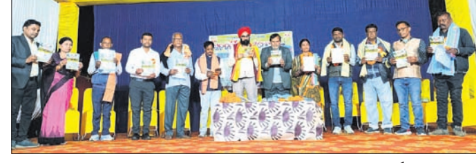
ଉଦ୍ଘାଟନୀ ସଭାରେ ମହାଧ୍ୟାୟ ଅତିଥିମାନେ ସ୍ମରଣୀକାକୁ ଲୋକାର୍ପିତ କରୁଛନ୍ତି।