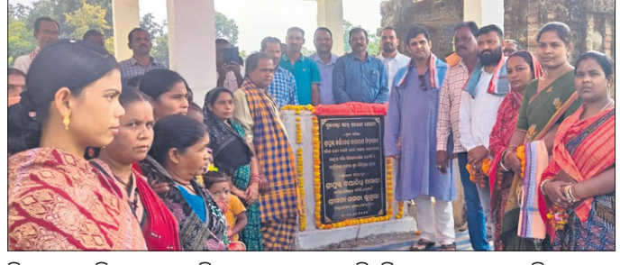
ସିଆଲବାହାଲି ଜଗନ୍ନାଥ ମନ୍ଦିର ଉନ୍ନତୀକରଣ ଲାଗି ଶିଳାମ୍ୟାସ କରାଯାଇଛି।