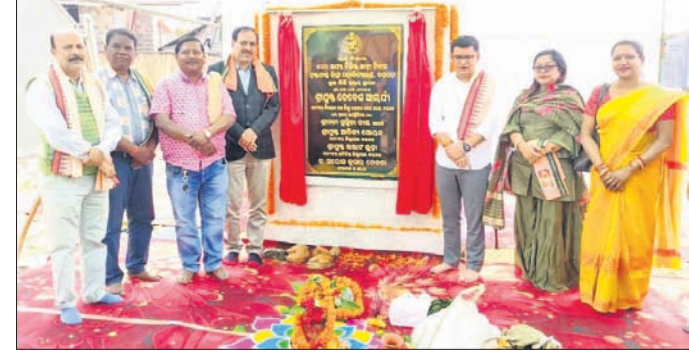
ଛାତ୍ରାନ୍ୱିବାସ ଶିଳାନ୍ୟାସ ସମାରୋହରେ ଅତିଥିବୃନ୍ଦ ।

ଉଚ୍ଚେଦ ସମୟରେ ରାୟ ଆସିବା ପରେ ସମାବେଶରୀ ସଂଘ ସଭାପତି ଜିଲ୍ଲା ଓକିଲ ସଂଘ ସଭାପତିଙ୍କୁ ମିଠା ଖୁଆଇଛନ୍ତି ।