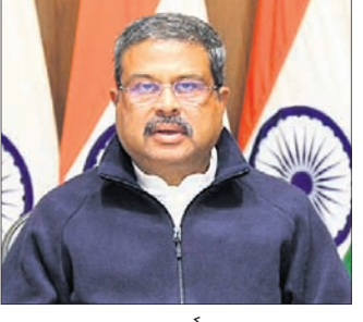
କେନ୍ଦ୍ରମନ୍ତ୍ରୀ ଧର୍ମେନ୍ଦ୍ର ପ୍ରଧାନ ।

ଚଳିତ ଆର୍ଥିକ ବର୍ଷ ୨୦୨୪-୨୫ କେନ୍ଦ୍ରର ଅନ୍ତରାଳ ବଜେଟରେ ହୋଇଥିବା ବ୍ୟବସ୍ଥା ଓ ଯୋଗ୍ୟତା ଦ୍ୱାରା ଓଡ଼ିଶା ଭଳି ରାଜ୍ୟ ସିଂହଭାଗ ଲାଭ ପାଇବ ବୋଲି କେନ୍ଦ୍ରମନ୍ତ୍ରୀ ଧର୍ମେନ୍ଦ୍ର ପ୍ରଧାନ କହିଛନ୍ତି । ଏକ ଲୋକାଭିଯୁକ୍ତୀ, ଅଭିବୃଦ୍ଧି ପ୍ରୋତ୍ସାହନକାରୀ ଓ ସୁରାକ୍ଷକାରୀ ବଜେଟ ଉପସ୍ଥାପନ କରିଥିବା କହି ଅର୍ଥମନ୍ତ୍ରୀ ନିର୍ମଳା ସାତାହାରୀୟ ଧର୍ମେନ୍ଦ୍ର ଧନ୍ୟବାଦ ଜଣାଇଛନ୍ତି । ଏଥିସହ ସେ କହିଛନ୍ତି, ୨୦୧୪ ସୁଦ୍ଧା ବିକଶିତ ଭାରତ ଲକ୍ଷ୍ୟ ପୂରଣ କରିବା ପାଇଁ ଯୁବ, ମହିଳା, ଗାଈ ଓ ଗରିବଙ୍କୁ ପ୍ରାଥମିକତା ଭିତ୍ତିରେ ବଜେଟ ଉପସ୍ଥାପିତ ହୋଇଛି । ବଜେଟରେ ଆଗାମୀ ଦିନ ରୋଜ୍ଞ୍ୟାପତ୍ତ ପ୍ରତିପଳିତ କରିଛି । ପୂର୍ବ ଭାରତ ସର୍ବଦା ମୋଦି ସରକାରଙ୍କ ପ୍ରାଥମିକତାରେ ଅଛି । ଚଳିତଥର ରେଳ ବଜେଟରେ ଗତି ଶ୍ରେଣୀଲ କରିବର ଯଥା ଏନର୍ଜି, ମିନେରାଲ ଓ ସିମେଣ୍ଟ କରିବର ପରିଲକ୍ଷଣ କରାଯାଇଛି । ୨ କୋଟି ଲକ୍ଷପତି ଦିନ