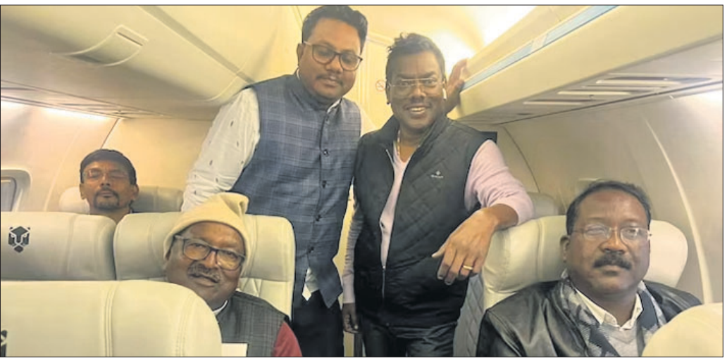
ବେଳେ ଝାଡ଼ଖଣ୍ଡରେ କାର୍ଯ୍ୟକ୍ରମ ହେଉଛି ଭାଜପା ପକ୍ଷରୁ ଯୋଡ଼ାବେପାର ସେନେଇ ଜେଏମ୍‌ଏମ୍ ପ୍ରଶ୍ନ ଉଠାଇଛି । କରାଯିବାର ଭୟରେ ଗୁରୁତାର ଶାସକ ମେଣ୍ଟର ଧ୍ୟା ଜଣ ବିଧାୟକ ଏକ ବସ୍ ଯୋଗେ ରାଷ୍ଟ୍ର ବିନାଦବରରେ

ପହଞ୍ଚିଛି । ସେଠାରୁ ଏକ ସ୍ୱତନ୍ତ୍ର ବିନା ଯୋଗେ ସମସ୍ତ ବିଧାୟକ ହାଇଦ୍ରାବାଦ୍ ଗସ୍ତ କରିବାର ସୂଚନା ମିଳିଛି । ଏହା ପୂର୍ବରୁ ଚମ୍ପାକ ଯୋଗେନଙ୍କ ନେତୃତ୍ୱରେ କଂଗ୍ରେସ ଜେଏମ୍‌ଏମ୍ ଓ ଆରଜେଡିର ବିଧାୟକ ମାନେ ଝାଡ଼ଖଣ୍ଡ ରାଜ୍ୟପାଳ ସି. ପି. ରାଧାକ୍ରିଷ୍ଣନଙ୍କୁ ଭେଟିଥିଲେ । ନିଜ ପାଖେ ଧ୍ୟା ବିଧାୟକଙ୍କ ସମର୍ଥନ ରହିଥିବା ରାଜ୍ୟପାଳଙ୍କୁ ଜଣାଇଥିଲେ ଚମ୍ପାକ ରାଜ୍ୟପାଳ ଖୁବଶୀଘ୍ର ସରକାର ଗଠନ ପାଇଁ ନିମନ୍ତ୍ରଣ କରିବେ ବୋଲି ପ୍ରତିଶ୍ରୁତି ଦେଇଥିବା କହିଛନ୍ତି ଜେଏମ୍‌ଏମ୍‌ର ବିଧାୟକ ଦଳ ନେତା ଚମ୍ପାକ ଯୋଗେନ । ରାଜ୍ୟପାଳଙ୍କୁ ଭେଟିବା ପୂର୍ବରୁ ଚମ୍ପାକଙ୍କ ନିକଟରେ ଧ୍ୟା ବିଧାୟକଙ୍କ ସମର୍ଥନ ରହିଥିବା ନେଇ ଏକ ଭିଡିଓ ବାର୍ତ୍ତା ଜେଏମ୍‌ଏମ୍ ପକ୍ଷରୁ ଜାରି କରାଯାଇଥିଲା ।