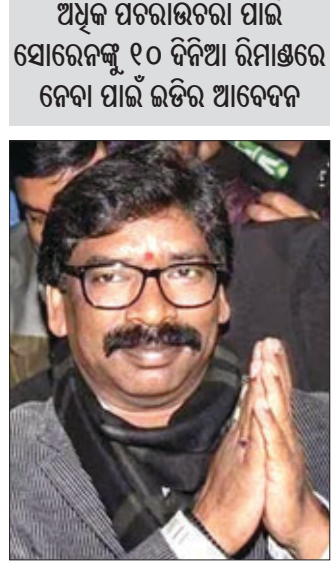
ଅଧିକ ପରୋକ୍ଷରେ ପାଇଁ ସୋରେନଙ୍କୁ ୧୦ ଦିନିଆ ଗିମାଣ୍ଡରେ ନେବା ପାଇଁ ଲଢ଼ିର ଆଦେଶ

ପ୍ରବର୍ତ୍ତନ ନିର୍ଦ୍ଦେଶାଳୟ (ଇଡି) ଦ୍ୱାରା ଜମି ସୁରକ୍ଷିତ ମାମଲାରେ ଗିରଫ ହୋଇଥିବା ଝାଡ଼ଖଣ୍ଡର ପୂର୍ବତନ ମୁଖ୍ୟମନ୍ତ୍ରୀ ହେମନ୍ତ ଯୋଗେନଙ୍କୁ ଦିନିକିଆ ନ୍ୟାୟିକ ହେପାଜତରେ ରଖିବା ପାଇଁ ଆଦେଶ ଦେଇଛନ୍ତି ରାଷ୍ଟ୍ରର ସ୍ୱତନ୍ତ୍ର କୋର୍ଟ । ଗୁଧାଚାର ଗାରିମାରେ ଲଢ଼ି ସୋରେନଙ୍କୁ ଗିରଫ କରି ଗୁରୁତାର ରାଷ୍ଟ୍ରର ସ୍ୱତନ୍ତ୍ର କୋର୍ଟରେ ହାଜର କରିଥିଲା । ଲଢ଼ି ଚରମରୁ ଅଧିକ ପରୋକ୍ଷରେ ପାଇଁ ସୋରେନଙ୍କୁ ୧୦ ଦିନିଆ ଗିମାଣ୍ଡରେ ନେବା ପାଇଁ ଆଦେଶ ଦେଇଥିଲା । ଉଭୟ ଲଢ଼ି ଓ ସୋରେନଙ୍କ ପକ୍ଷକୁ ଶୁଣିବା ପରେ ପରବର୍ତ୍ତୀ ଶୁଣାଣି ପାଇଁ ଫେବୃଆରୀ ୨ ତାରିଖକୁ ଧାର୍ଯ୍ୟ କରିଛନ୍ତି ସ୍ୱତନ୍ତ୍ର କୋର୍ଟ । ସେପର୍ଯ୍ୟନ୍ତ ନ୍ୟାୟିକ ହେପାଜତରେ ରହିବେ ସୋରେନ । ତେବେ ନିଜ ଗିରଫଦାରି ବିରୋଧରେ ସୁପ୍ରିମକୋର୍ଟରେ ମଧ୍ୟ ସୋରେନ ଆବେଦନ କରିଛନ୍ତି । କ୍ଷମତାକୁ ଅପବ୍ୟବହାର କରି ରାଜ୍ୟରେ ଚାଲିଥିବା ଏକ ଛୁର ସରକାରଙ୍କୁ ଗାଳିବା ଉଦ୍ଦେଶ୍ୟରେ କେନ୍ଦ୍ର ପ୍ରଚାରନାରେ