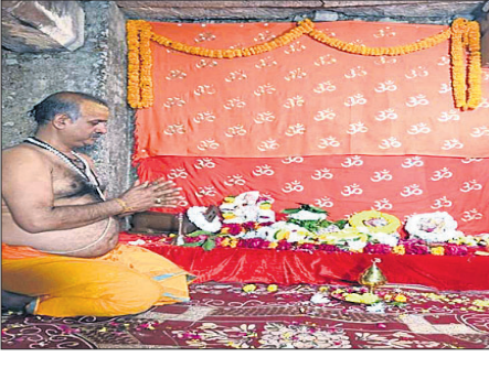
ଏହି ମାମଲାରେ ଆବେଦନକାରୀ ଥିବା ବ୍ୟାସ ପରିବାରର ମୁଖ୍ୟ ପୂଜକଙ୍କ ଦ୍ୱାରା ଅଖଣ୍ଡ ଜ୍ୟୋତି ପ୍ରସ୍ତୁତ କରାଯାଇଥିଲା । ସେହିପରି ସୂର୍ଯ୍ୟୋଦୟ ପୂର୍ବରୁ ମଙ୍ଗଳ ଆଳତୀ ଆବେଦନ କରିବାକୁ ପରାମର୍ଶ ଦିଆଯାଇଛି ।

ବାର୍ଦ୍ଧ ୩୦ ବର୍ଷ ପରେ ଜ୍ଞାନବାପି ମସଜିଦ୍‌ର ବନ୍ଦ ଥିବା ଦେସମେଣ୍ଟରେ ପୂଜାର୍ଚ୍ଚନା ଓ ଆରତି କରିଛି ହିନ୍ଦୁ ପକ୍ଷ । ଗତ ୩୦ ବର୍ଷ ହେଲା ଏଠାରେ ପୂଜାର୍ଚ୍ଚନା ଉପରେ ରୋକ ଲାଗିଥିବା ବେଳେ ଗୁଧାଚାର ବାରାଣାସୀ ଜିଲ୍ଲା କୋର୍ଟ ଏହି ଐତିହାସିକ ରାୟ ଦେଇଥିଲେ । ଜ୍ଞାନବାପି ମସଜିଦ୍‌ର ଦେସମେଣ୍ଟରେ ଥିବା "ବ୍ୟାସ କା ଚେନ୍ଦ୍ରଖାନା" ଠାରେ ହିନ୍ଦୁ ପକ୍ଷଙ୍କୁ ପୂଜାର୍ଚ୍ଚନା ପାଇଁ କୋର୍ଟ ଅନୁମତି ଦେଇଥିଲେ । କୋର୍ଟ ଆଦେଶ ପୂରାବଳ ଗୁଧାଚାର ରାଜ୍ୟ ଗାଳିପାଳ ଓ ଡିଆଇଜିଙ୍କ ଉପସ୍ଥିତିରେ ଏଠାରେ ରହିଥିବା ବ୍ୟାରିକେଡ୍ ରୁଟିକୁ ହଟାଇଥିଲା । ରାତି ପ୍ରାୟ ୩ଟାରେ