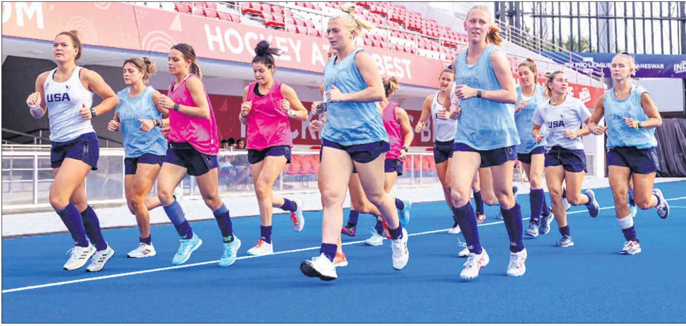
ଏଫଆଇଏଚ୍ ପ୍ରୋ ଲିଗ୍ ଆରମ୍ଭ ପୂର୍ବରୁ କଳିଙ୍ଗ ଷ୍ଟାଡ଼ିୟମରେ ଆମେରିକା ଓ ବାଲନା ମହିଳା ହକି ଖେଳାଳିଙ୍କ ଅଭ୍ୟାସ।