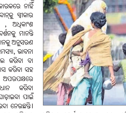
ପରିବାର ସମ୍ପୂର୍ଣ୍ଣ ଭାବେ ଆତ୍ମହତ୍ୟା କରିଥିଲେ । ୨୦୧୩ ରୁ ୨୦୨୨ ମଧ୍ୟରେ ଅତ୍ୟଧିକ ଅଣା ଯୋଗୁ କେବଳ ୮୦୦ ଲୋକ ପ୍ରାଣ ହରାଇଛନ୍ତି ।