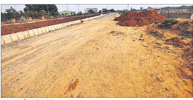
ରାସ୍ତା କାର୍ଯ୍ୟ କାରି ରହିଛି ।

ଯାଜପୁର ଜିଲା ଗଠନ ହେବା ପରେ ଲୋକଙ୍କ ଜୀବନଧାରଣ ମାନରେ ଯେତେ ଉନ୍ନତ ହେବା କଥା ତାହା ନୈରାଶ୍ୟଜନକ ହୋଇଛି । ଯେଉଁ ଅଞ୍ଚଳର ଗମନାଗମନ ଯେତେ ସୁବୁଦ୍ଧ ସେହି ଅଞ୍ଚଳ ସେତେ ଉନ୍ନତ ବୋଲି ବିଶ୍ୱାସ ରହିଛି । କିନ୍ତୁ ସୁବର୍ଦ୍ଧନ ନେତୃତ୍ୱ ତଥା ଠିକାଦାରି ରାଜନୀତି ଯାଜପୁର ଜିଲାର ବିକାଶର ଧାରାକୁ ପଛକୁ ପକାଇ ଦେଇଥିବା ସାଧାରଣରେ ଆଲୋଚନା ହେଉଛି । ଏଠାରେ ପାଣିକୋଇଲି ରାସ୍ତା ଓ ଗୁହ(ଆର୍ ଏଚ ବି) ବା ପୂର୍ବ ବିଭାଗର କେତୋଟି ରାସ୍ତା ଓ ବ୍ରିକଗୁଡ଼ିକୁ ଉଦ୍‌ଘାଟନା ହୋଇ ପଡ଼ି ରହିଛି । ସେଥିମଧ୍ୟରୁ ୭ ପ୍ରକଳ୍ପ ୪ ରୁ ୫ ବର୍ଷ ହେଲା ସମ୍ପୂର୍ଣ୍ଣ ହୋଇ ପାରୁନାହିଁ । ବିତମନା ଯେ, ଜିଲା ସଦର ମହକୁମାକୁ ସଂଯୋଗ କରୁଥିବା ରାଜ୍ୟ ରାଜପଥ(ଏଏଏଚ)-୫୬ର ଷଠିପୁର ଠାରୁ ମଙ୍ଗଳପୁର ରାସ୍ତା କାର୍ଯ୍ୟର ଅବଧି ସମୟ ଶେଷ ହେବାର ୮ ମାସ ଅତିକ୍ରାନ୍ତ ହୋଇ ସାରିଥିଲେ ହେଁ ସରିବାର ନାଁ ଧରୁନାହିଁ । ଏହି ରାସ୍ତାରେ ବ୍ୟାପକ ପିସି କାରବାର ଓ ଠିକାଦାରି-ଯନ୍ତ୍ରୀଙ୍କ ମାଧ୍ୟମରେ ସଲାସୁରୁତା ଚାଲିଥିବା ଯୋଗୁ କାର୍ଯ୍ୟ