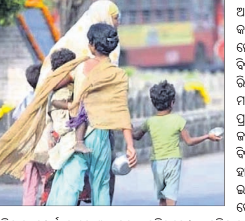
ପରିବାର ସମ୍ପୂର୍ଣ୍ଣ ଭାବେ ଆତ୍ମହତ୍ୟା କରିଥିଲେ । ୨୦୧୩ ରୁ ୨୦୨୨ ମଧ୍ୟରେ ଅତ୍ୟଧିକ ଅଣା ଯୋଗୁ କେବଳ ୮୦୦ ଲୋକ ପ୍ରାଣ ହରାଇଛନ୍ତି ।

ମଧ୍ୟରେ୧୩୫)ରେ ଭାରତ ରହିଛି । ଭାରତ ନିମ୍ନ ଶାନ୍ତି ଦେଶ ଭାବେ ଗୁଣିତ ହୋଇଛି । ଭାରତରେ ଅଶାନ୍ତି, ଆତ୍ମହତ୍ୟା, ଅପରାଧ ବୃଦ୍ଧି ପାଇଛି । ନ୍ୟାଶନାଲ ଟ୍ରାଜିମ ରେକର୍ଡ ଦ୍ୱାରା ତଥ୍ୟ ୨୦୨୨ ଅନୁଯାୟୀ, ପ୍ରତିଦିନ ଭାରତରେ ୪୬୮ ଜଣ ଆତ୍ମହତ୍ୟା କରୁଛନ୍ତି । ଆତ୍ମହତ୍ୟା ହାର ଯାହା ୨୦୧୮ରେ ୧ ଲକ୍ଷରେ ୧୦.୨ ଥିଲା, ତାହା ୨୦୨୨ରେ ୧୨.୪କୁ ବୃଦ୍ଧି ପାଇଛି । ୨୦୧୭ରେ ଆତ୍ମହତ୍ୟା କରିଥିବା ଲୋକଙ୍କ ସଂଖ୍ୟା ୧,୩୪,୫୧୬ ଥିଲାବେଳେ ୨୦୨୧ରେ ୧,୬୫, ୦୩୩,୨୦୨୨ରେ ୧,୭୧,୦୦୦କୁ ବୃଦ୍ଧି ପାଇଛି । ଅର୍ଥାତ୍ ୨୦୨୨ରେ ଆତ୍ମହତ୍ୟା ହାର ୨୦୨୧ ତୁଳନାରେ ୪.୩% ଏବଂ ୨୦୧୮ ତୁଳନାରେ ୨୭% ଅଧିକ । କେବଳ ଆତ୍ମହତ୍ୟା କରିଥିବା ଲୋକଙ୍କ ମଧ୍ୟରୁ ଦିନ ମୃତ୍ୟୁ ୨୬% । ୨୦୨୨ରେ ୧୫୦