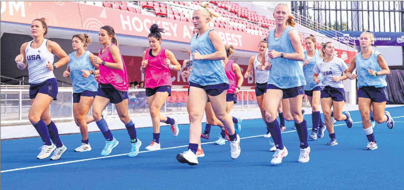
ଏଫଆଇଏଚ୍ ପ୍ରୋ ଲିଗ୍ ଆରମ୍ଭ ପୂର୍ବରୁ କଳିଙ୍ଗ ଷ୍ଟାଡ଼ିୟମରେ ଆମେରିକା ଓ ବାଲନା ମହିଳା ହକି ଖେଳାଳିଙ୍କ ଅଭ୍ୟାସ।

ଓଡ଼ିଶା ଓ ପୁଡୁଚେରୀ ମଧ୍ୟରେ ରଣନୀ ଟ୍ରଫି କ୍ରିକେଟ ମ୍ୟାଚ ଶୁକ୍ରବାରଠାରୁ କଟକର ବାରବାଟୀ ଷ୍ଟାଡ଼ିୟମରେ ଅନୁଷ୍ଠିତ ହେବ। ବାହାର ପରିବେଶରେ ସିଜନର ପ୍ରଥମ ୨ଟି ମ୍ୟାଚ ଖେଳିଥିବା ଓଡ଼ିଶା ଘରୋଇ ପରିବେଶରେ ତୃତୀୟ ମ୍ୟାଚ ଖେଳିବ। ତେବେ ଚଳିତ ସିଜନରେ ବାରବାଟୀରେ ଏହା ହେବ ଓଡ଼ିଶାର ପ୍ରଥମ ମ୍ୟାଚ। ପୂର୍ବ ୨ଟି ମ୍ୟାଚ ଡ୍ରିପ୍ ଗ୍ରାଉଣ୍ଡରେ ଖେଳିଥିଲା। ଓଡ଼ିଶା ଏପର୍ଯ୍ୟନ୍ତ ୪ଟି ମ୍ୟାଚ ଖେଳିଥିବାବେଳେ ଗୋଟିଏ ଜିତିଛି, ୨ଟି ହାରିଛି ଏବଂ ଗୋଟିଏ ଡ୍ର ରଖିଛି। ଭଦୋଦରୀରେ ବରୋଦାଠାରୁ ୧୪୭ ରନରେ ପରାଜୟ ସହ ଅଭିଯାନ ଆରମ୍ଭ କରିଥିବା ଓଡ଼ିଶା ଇନ୍ଦୋରରେ ଅନୁଷ୍ଠିତ ପରବର୍ତ୍ତୀ ମ୍ୟାଚକୁ ମଧ୍ୟ ପ୍ରବେଶ ସହ ଡ୍ର ରଖିଥିଲା। ତେବେ ପ୍ରଥମ ଇନିଂସ ଅଗ୍ରଣୀ ଭିତ୍ତିରେ ୩ ପଏଣ୍ଟ ପାଇଥିଲା। ଡ୍ରିପ୍ରେ ଅନୁଷ୍ଠିତ ତୃତୀୟ ମ୍ୟାଚରେ ଜମ୍ମୁ-କଶ୍ମୀରଠାରୁ ଦଳ ୨ ଉଇକେଟରେ ପରାଜିତ ହୋଇ ଶତ ଝଟ୍କା ଖାଇଥିଲା। ମାତ୍ର ସେହି ଗ୍ରାଉଣ୍ଡରେ ଖେଳିଥିବା ୪ର୍ଥ ମ୍ୟାଚରେ ଓଡ଼ିଶା ପ୍ରତିପକ୍ଷ ହିମାଚଳ ପ୍ରଦେଶକୁ ୨୩୮ ରନରେ ହରାଇ ସଫଳ ପ୍ରତ୍ୟାବର୍ତ୍ତନ କରିଛି। ୪ ମ୍ୟାଚକୁ ୯ ପଏଣ୍ଟ ସହ ଓଡ଼ିଶା ଗ୍ରୁପ୍ 'ଡି' ଟେବୁଲର ୫ମ ସ୍ଥାନରେ ରହିଛି। ଅନ୍ୟପକ୍ଷରେ ପୁଡୁଚେରୀ ଏପର୍ଯ୍ୟନ୍ତ ଖେଳିଥିବା ୪ ମ୍ୟାଚକୁ ୨ଟି ଜିତିଛି ଏବଂ ୨ଟିରେ ପରାଜିତ ହୋଇଛି। ୧୨ ପଏଣ୍ଟ ସହିତ ଦଳ ଗ୍ରୁପ୍ 'ଡି' ପଏଣ୍ଟ ଟେବୁଲର ତୃତୀୟ ସ୍ଥାନରେ ରହିଛି। ଏହି ଦଳ ଦିଲ୍ଲୀକୁ ୯ ଉଇକେଟରେ ହରାଇବାପରେ ବରୋଦାଠାରୁ ୯୮ ରନରେ ପରାଜିତ ହୋଇଛି। ପରବର୍ତ୍ତୀ ମ୍ୟାଚରେ ଭରୋଦାଠାକୁ ୫୫ ରନରେ ହରାଇଥିଲେ ହେଁ ମଧ୍ୟ ପ୍ରବେଶଠାରୁ ୩୧୯ ରନରେ ବୃହତ୍ ପରାଜୟ ବରଣ କରିଛି।