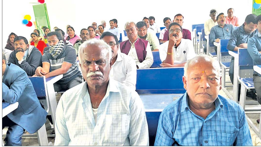
ସିନ୍ଦୂରିଆ ଉଚ୍ଚ ବିଦ୍ୟାଳୟରେ ପୁରାତନ ଛାତ୍ରାଛାତ୍ର ।

ନୟାଗଡ଼, ୧୨ (ଲୋକନାଥ ମିଶ୍ର) ନୟାଗଡ଼ ସଦର ଉପକଣ୍ଠ ସିନ୍ଦୂରିଆ ଉଚ୍ଚ ବିଦ୍ୟାଳୟ ପ୍ରାଥମିକ ବିଦ୍ୟାଳୟରୁ ଉଚ୍ଚ ବିଦ୍ୟାଳୟର ମାନ୍ୟତା ପାଇବା ପରେ ରାଜ୍ୟ ସରକାର ତଥା ଜିଲ୍ଲା ପ୍ରଶାସନ ୫-ଟି ଅଧୀନରେ ରୂପାନ୍ତରଣ କାର୍ଯ୍ୟ କରାଇ ଭିତ୍ତିଭୂମିରେ ଆମ୍ବୁକରୁ ପରିବର୍ତ୍ତନ କରାଉଛନ୍ତି । ଅଦ୍ୟାବଧି ବିଦ୍ୟାଳୟର ଦୁଇଟି ସ୍ନାଟ୍ ଶ୍ରେଣୀ ଗୃହ କାର୍ଯ୍ୟ ସମାପ୍ତ ହୋଇଥିବା ବେଳେ ବିଜ୍ଞାନାଗାର ଓ ଲ-ଲାଇବ୍ରେରୀ ଗୃହ କାର୍ଯ୍ୟ ଚାଲୁରହିଛି । ଏଥି ସହିତ ବିଦ୍ୟାଳୟ ହଡ଼ାଟ ନକ୍ସା ବଦଳି ଯାଇ ନୂଆ ରୂପରେ ପୁଣି ଦୁଇଟି ଗାଈ ମଧ୍ୟ ଚାଲୁ ରହିଛି । ନୂତନ ରାସ୍ତା ଓ ବିଦ୍ୟାଳୟ ଫାଟକ କାର୍ଯ୍ୟ ପାଇଁ କାମ ଆରମ୍ଭ ହୋଇଛି । ବିଦ୍ୟାଳୟର ରୂପାନ୍ତରଣ ନୂଆ ରୂପରେଖକୁ ଦେଖିବା ପାଇଁ ଶତାଧିକ ପୁରାତନ ଛାତ୍ରାଛାତ୍ର ଆନୁସଙ୍ଗେ ଆସିଥିଲେ । ପରବର୍ତ୍ତୀ