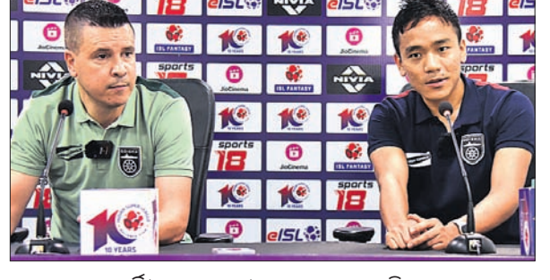
ସର୍ବିଓ ଲୋକେରା ଓ ଲାଲଥଥଙ୍ଗା ଖଲରିଙ୍ଗା।

ଆଗାମୀ ମ୍ୟାଚ ବହୁ ଗୁରୁତ୍ୱପୂର୍ଣ୍ଣ। ଅନ୍ୟପକ୍ଷରେ କେରଳ ରାଷ୍ଟ୍ରୀୟ ୧୨ ମ୍ୟାଚକୁ ୮ ବିଜୟ ସହ ୨୬ ପଏଣ୍ଟ ପାଇ ଟେବୁଲର ଶୀର୍ଷରେ ରହିଛି। ଓଡ଼ିଶା ଏଫସିଠାରୁ ୨ ପଏଣ୍ଟ ଆଗରେ ଥିବାରୁ ଏହି ଦଳ ମଧ୍ୟ ଆସନ୍ତା ମ୍ୟାଚ ଜିତି ଶୀର୍ଷରେ ନିଜର ସ୍ଥାନ ସୁଦୃଢ଼ କରିବା ଲକ୍ଷ୍ୟରେ ରହିଛି। କେରଳ ବିପକ୍ଷରେ ଦଳର ଭଲ ପ୍ରଦର୍ଶନକୁ ନେଇ ଇଣ୍ଡିଆନ ସୁପର ଲିଗ୍ ଆଜି ଓଏଫସି ବନାମ କେରଳ ରାଷ୍ଟ୍ରୀୟ