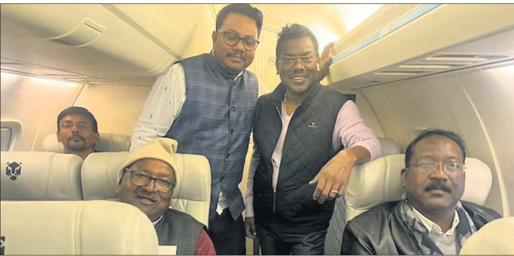
ବେଳେ ଝାଡ଼ଖଣ୍ଡରେ କାର୍ଯ୍ୟକ୍ରମ ହେଉଛି ଯେତେବେଳେ ଜେଏମ୍‌ଏମ୍ ପ୍ରଶ୍ନ ଉଠାଇଛି । ଭାଜପା ପକ୍ଷରୁ ଯୋଡ଼ାବେପାର କରାଯିବାର ଭୟରେ ଲକ୍ଷ୍ମଣା ଶାସକ ମେଣ୍ଟର ଧ୍ୟାନ ଲାଗି ବିଧାୟକ ଏକ ବସ୍ ଯୋଗେ ରାଷ୍ଟ୍ର ବିନାଦବରରେ

ପହଞ୍ଚିଛି । ସେଠାରୁ ଏକ ସ୍ୱତନ୍ତ୍ର ବିନା ଯୋଗେ ସମସ୍ତ ବିଧାୟକ ହାଇଦ୍ରାବାଦ୍ ଗସ୍ତ କରିବାର ସୂଚନା ମିଳିଛି । ଏହା ପୂର୍ବରୁ ଚମ୍ପାକ ଯୋଗେନଙ୍କ ନେତୃତ୍ୱରେ ଜେଏମ୍‌ଏମ୍ ଓ ଆରଜେଡିର ବିଧାୟକ ମାନେ ଝାଡ଼ଖଣ୍ଡ ରାଜ୍ୟପାଳ ସି. ପି. ରାଧାକୃଷ୍ଣନଙ୍କୁ ଭେଟିଥିଲେ । ନିଜ ପାଖେ ଧ୍ୟାନ ବିଧାୟକଙ୍କ ସମର୍ଥନ ରହିଥିବା ରାଜ୍ୟପାଳଙ୍କୁ ଜଣାଇଥିଲେ ଚମ୍ପାକ ରାଜ୍ୟପାଳ ଖୁବଶୀଘ୍ର ସରକାର ଗଠନ ପାଇଁ ନିମନ୍ତ୍ରଣ କରିବେ ବୋଲି ପ୍ରତିଶ୍ରୁତି ଦେଇଥିବା କହିଛନ୍ତି ଜେଏମ୍‌ଏମ୍‌ର ବିଧାୟକ ଦଳ ନେତା ଚମ୍ପାକ ଯୋଗେନ । ରାଜ୍ୟପାଳଙ୍କୁ ଭେଟିବା ପୂର୍ବରୁ ଚମ୍ପାକଙ୍କ ନିକଟରେ ଧ୍ୟାନ ବିଧାୟକଙ୍କ ସମର୍ଥନ ରହିଥିବା ନେଇ ଏକ ଭିଡିଓ ବାର୍ତ୍ତା ଜେଏମ୍‌ଏମ୍ ପକ୍ଷରୁ ଜାରିକରାଯାଇଥିଲା ।