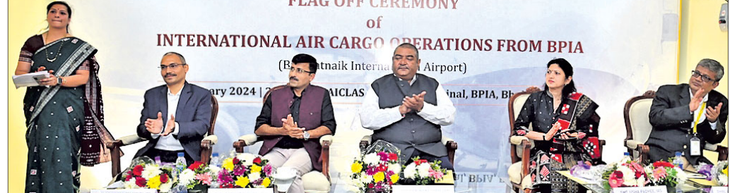
କାର୍ଗୋ ଅପରେଶନ ଶୁଭାରମ୍ଭରେ ମନ୍ତ୍ରୀ, ସଚିବ ଓ ଅନ୍ୟ ଅଧିକାରୀ ଉପସ୍ଥିତ ।