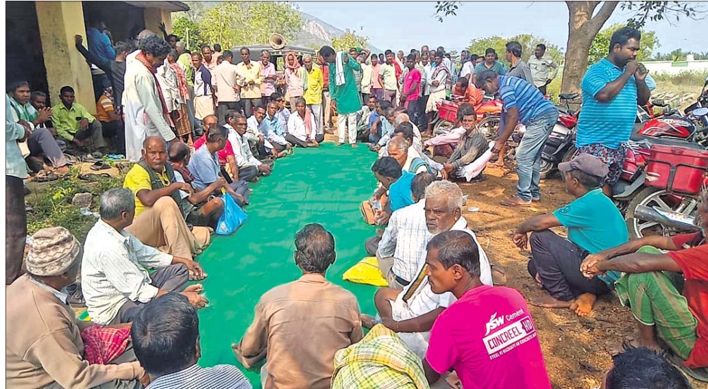
ଭେଟବର ବନ୍ଧରେ ଚାଷୀମାନଙ୍କ ସମାବେଶ।

ଚାଷୀ ଓ ଚାଷ ପାଇଁ କରାଯାଇଥିବା ନୟାଗଡ଼ ଜିଲ୍ଲା ରଣପୁର ବ୍ଲକ୍ ଭେଟବର ବନ୍ଧରେ ପାନୀୟ ଜଳ ପ୍ରକଳ୍ପ କାର୍ଯ୍ୟ ଆରମ୍ଭ ପରେ ଚାଷୀଙ୍କ ଆୟୋଜନ ରୁଚୁବାର ବିଶେଷତା ରୂପ ନେଇଛି। ଭେଟବର ବନ୍ଧରେ ଗୁରୁତ୍ୱପୂର୍ଣ୍ଣ ଚାଷୀ ସମାବେଶ ପରେ ପାନୀୟ ଜଳ ପ୍ରକଳ୍ପ ଠିକାଦାରଙ୍କ ଅଗ୍ରାଧିକାରୀ ଗୁହ ଓ ଯନ୍ତ୍ରାଂଶକୁ ଚାଷୀ ମିଳିତ ହୋଇ ଭଙ୍ଗାଢ଼ୁଳା କରିଛନ୍ତି। ବନ୍ଧରେ ପାନୀୟ ଜଳ ପ୍ରକଳ୍ପ କରାଇ ନ ଦେବାକୁ ନିଷ୍ପତ୍ତି ନେଇଛନ୍ତି। ପାନୀୟ ଜଳ ପ୍ରକଳ୍ପ କାର୍ଯ୍ୟ ଆରମ୍ଭ ପୂର୍ବରୁ ଚାଷୀଙ୍କ ବିରୋଧ ସତ୍ତ୍ୱେ ପ୍ରଶାସନ ଗୁରୁତ୍ୱ ଦେଇ ନ ଥିଲା। ବନ୍ଧକୁ ପୁନରୁଦ୍ଧାର ପାଇଁ ବାଦି ହୋଇ ଆସୁଥିଲେ ମଧ୍ୟ ଚାଷୀ ଓ ଚାଷକୁ ଅଣଦେଖା କରି ପାନୀୟ ଜଳ ପ୍ରକଳ୍ପ କାର୍ଯ୍ୟ ଜରୁରୀପୂର୍ଣ୍ଣ କରାଯିବା ପରେ ଚାଷୀଙ୍କ ଆୟୋଜନ ଦେଖା ଦେଇଛି। ଅଭିଯୋଗ ଅନୁଯାୟୀ, ଭେଟବର ବନ୍ଧ ୧୯୭୨ରେ ଉଦ୍ଘାଟନ ହୋଇଥିଲା। ବନ୍ଧର ପାଣିକୁ ବନ୍ଧପୁଣ୍ଡା, କାଣ୍ଡପତା, ବଳଭଦ୍ରପୁର, ମଝିଆଖଣ୍ଡ, ମହରପଲ୍ଲୀ, ଗୋପାଳପୁର ଆଦି ୬ ପଞ୍ଚାୟତ ଓ ରଣପୁର ଏନଏସିର କିଛି ଖାତ ସମତେ ୨୦ ହକ୍ତାରରୁ ଉର୍ଦ୍ଧ୍ୱ ଚାଷୀ ଜମିରେ ପାଣି ମତାଇ ଆସୁଥିଲେ। ଉଦ୍ଘାଟନ