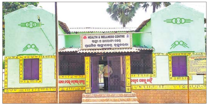
ବରୁଆ-ବାଲିଚନ୍ଦ୍ରପୁର ପୁଖ୍ୟରାସ୍ତା ଯାଇଛି ।

ବ୍ରହ୍ମବରଦା ପ୍ରାଥମିକ ସ୍ୱାସ୍ଥ୍ୟକେନ୍ଦ୍ର ଅବହେଳିତ ଅବସ୍ଥାରେ ରହିଛି । ଏଠାରେ ପ୍ରାୟ ୧୦୫ ଜଣରୁ ଊର୍ଦ୍ଧ୍ୱ ଜନସଂଖ୍ୟା ରହିଛି । ଅଞ୍ଚଳର ୫୦୦ ପଞ୍ଚାୟତର ଲୋକେ ଏହି ସ୍ୱାସ୍ଥ୍ୟକେନ୍ଦ୍ର ଉପରେ ନିର୍ଭର କରୁଛନ୍ତି । ହେଲେ ଏଠାରେ ଆୟୁଲ୍ୟାନ୍ସ ସେବା ଉପଲବ୍ଧ ହେଉନାହିଁ । ଫଳରେ ବ୍ରହ୍ମବରଦା ଓ ଏହାର ଆଖପାଖ ଅଞ୍ଚଳର ରୋଗୀ ଜରୁରୀକାଳୀନ ସମୟରେ ନାନା ଅସୁବିଧାର ସମ୍ମୁଖୀନ ହେଉଛନ୍ତି । ଅନେକ ସମୟରେ ଲୋକେ ଘରୋଇ ଗାଡ଼ି ଭଡ଼ାକରି ଚିକିତ୍ସା କେନ୍ଦ୍ରକୁ ଶତାଧିକ କିନ୍ନର ଯୋଗଦେଇଥିଲେ ।