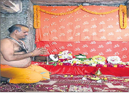
ଏହି ମାମଲାରେ ଆବେଦନକାରୀ ଥିବା ବ୍ୟାସ ପରିବାରର ମୁଖ୍ୟ ପୂଜକଙ୍କ ଦ୍ୱାରା ଅଖଣ୍ଡ ଜ୍ୟୋତି ପ୍ରସ୍ତୁତ କରାଯାଇଥିଲା । ସେହିପରି ହିନ୍ଦୁମାନଙ୍କ ପୂର୍ବରୁ ମସଜିଦ୍‌ର ଆରତି ଆଦେଶ କରାଯାଇଛି ।