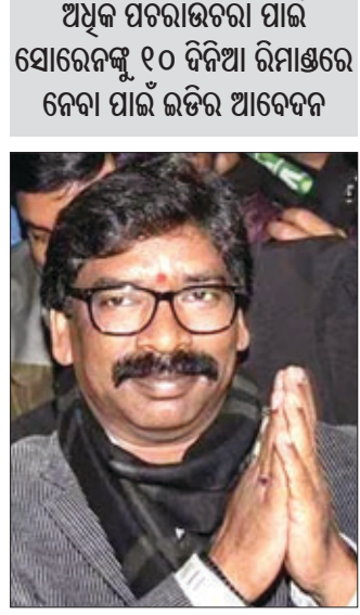
ଅଧିକ ପତରାଉତରା ପାଇଁ ସୋରେନଙ୍କୁ ୧୦ ଦିନିଆ ଗିମାଣ୍ଡରେ ନେବା ପାଇଁ ଇଡିର ଆଦେଶ