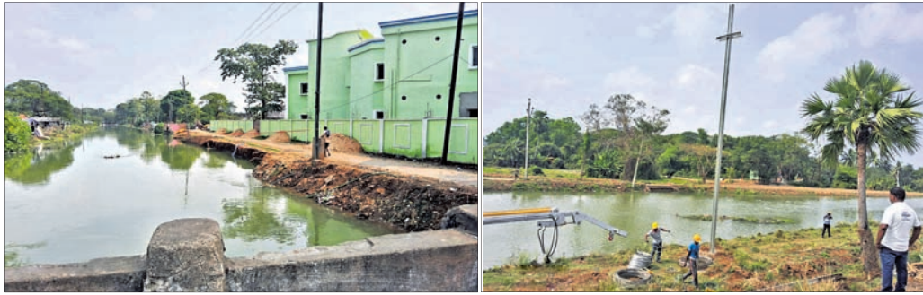
କେନାଲରୁ ଅତଡ଼ା ଧରି ପୌର ପରିଷଦ ନୂଆ ଗୃହ ଓ ରାସ୍ତା ପ୍ରତି ବିପଦ ଦେଖାଦେଇଛି । କେନାଲ ଶଯ୍ୟାରେ ବିଦ୍ୟୁତ୍ ଖୁଣ୍ଟରେ ଚାର ଲଗାଯାଇଛି ।