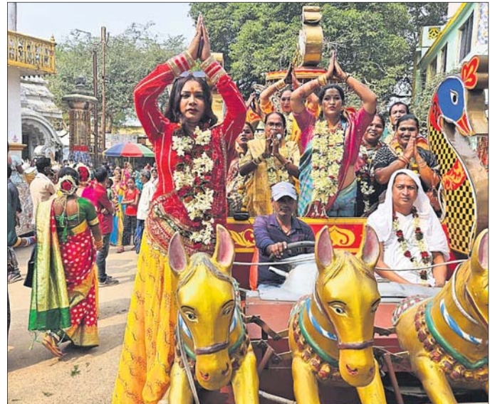
କିନ୍ନରମାନେ କଳସ ଶୋଭାଯାତ୍ରାରେ ଯାଉଛନ୍ତି ।