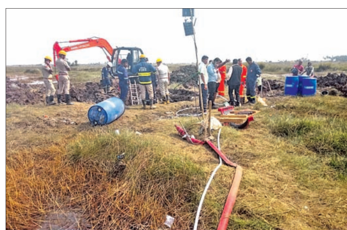
ପାଇପ୍‌ଲାଇନ ମରାମତି କାର୍ଯ୍ୟ ଚାଲିଛି ।

ଭାରତୀୟ ଟେଲ ନିଗମ ପକ୍ଷରୁ ପାରାଦୀପରୁ ହାଇଡ୍ରୋପାୱାର ଯାଇଥିବା ପାଇପ୍‌ଲାଇନରେ ବୁଧବାର ଫାଟ ଖୁଣ୍ଟି ହୋଇଥିଲା । କୁଳଙ୍ଗ ଥାନା ଅନ୍ତର୍ଗତ ବାଲେଶ୍ୱର ପଞ୍ଚାୟତର ବଳେଶ୍ୱର-ବନିପାଟ ରାସ୍ତାର କଳକର୍ତ୍ତ ନିକଟରେ ଏହି ପାଇପ୍‌ଲାଇନ ଲିଫ୍ଟ ହୋଇ ସେଥିରୁ ତେଲ ବାହାରୁ ଥିଲା । ଖବରପାଇ ପାଇପ୍‌ଲାଇନ ଡିଭିଜନର ବରିଷ୍ଠ ଅଧିକାରୀ ଓ ଯତ୍ନାମାନେ ପହଞ୍ଚି ଲିଫ୍ଟ ମରାମତି କରିଛନ୍ତି । ଗୁରୁବାର ଅପରାହ୍ନ ପ୍ରାୟ ୩ଟାରେ ଏହି କାର୍ଯ୍ୟ ଶେଷ ହୋଇଥିଲା । ଉକ୍ତ ପାଇପ୍‌ଲାଇନରେ ଲିଫ୍ଟ ହେବା ଯୋଗୁ ପ୍ରାୟ ୧ ହଜାର ଲିଟରରୁ ଊର୍ଦ୍ଧ୍ୱ ତେଲ ବହିଯାଇଛି । ସେଥିରୁ କିଛି ତେଲ ବିଭାଗ ପକ୍ଷରୁ ସଂଗ୍ରହ କରାଯାଇଥିବା ଜଣାପଡ଼ିଛି । ନିର୍ମିତ ତେଲ ଯୋଗୁ ବିଶେଷ କ୍ଷତି ହୋଇ ନ ଥିଲେ ମଧ୍ୟ ୨/୩ ଜଣ