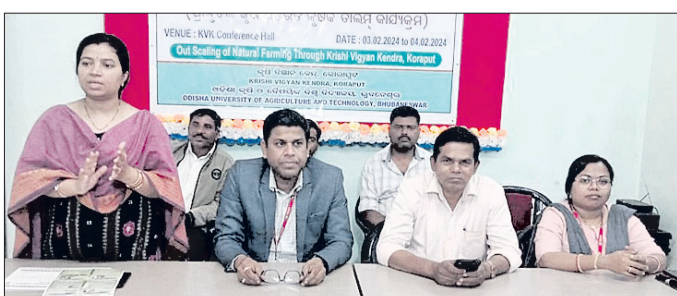
ଅଧିକାରୀମାନେ ଦେଶୀ ଖାତର ବ୍ୟବହାର ସମ୍ପର୍କରେ ଚର୍ଚ୍ଚା କରୁଛନ୍ତି।

ପାରମ୍ପରିକ, ସ୍ୱଦେଶୀ କୃଷି ଅଭ୍ୟାସକୁ ପୋଷାହିତ କରିବା ଲକ୍ଷ୍ୟରେ ଭାରତ ସରକାର ପ୍ରାକୃତିକ କୃଷି ଉପରେ ଅଧିକ ଗୁରୁତ୍ୱ ଦେଇଛନ୍ତି। ପ୍ରାକୃତିକ କୃଷିରେ ଅଧିକ ପରିମାଣରେ ରାସାୟନିକ ସାର ଓ ଔଷଧ ବ୍ୟବହାର ନ କରି ଦେଶୀ ଗାଈ ଗୋବର, ଗୋମୂତ୍ର, ନିମ୍ବପତ୍ର, ଲଙ୍କା ଓ ଦେଶୀ ଜିନିଷକୁ ବ୍ୟବହାର କରି ପ୍ରସ୍ତୁତ ହେଉଥିବା ଖାତ ଓ ଔଷଧକୁ ବ୍ୟବହାର କରିବାକୁ ପୋଷାହନ ପ୍ରଦାନ କରାଯାଉଛି। ଏହି ପରିପେକ୍ଷାରେ କୋରାପୁଟ ଜିଲାର ଅଧିକ ପରିମାଣରେ ରାସାୟନିକ ସାର ଓ ଔଷଧ ବ୍ୟବହାର ନ କରି ଦେଶୀ ଗାଈ ଗୋବର, ଗୋମୂତ୍ର, ନିମ୍ବପତ୍ର, ଲଙ୍କା ଓ ଦେଶୀ ଜିନିଷକୁ ବ୍ୟବହାର କରି ପ୍ରସ୍ତୁତ ହେଉଥିବା ଖାତ ଓ ଔଷଧକୁ ବ୍ୟବହାର କରିବାକୁ ପୋଷାହନ ପ୍ରଦାନ କରାଯାଉଛି। ଏହି ପରିପେକ୍ଷାରେ କୋରାପୁଟ ଜିଲାର ଅଧିକ ପରିମାଣରେ ରାସାୟନିକ ସାର ଓ ଔଷଧ ବ୍ୟବହାର ନ କରି ଦେଶୀ ଗାଈ ଗୋବର, ଗୋମୂତ୍ର, ନିମ୍ବପତ୍ର, ଲଙ୍କା ଓ ଦେଶୀ ଜିନିଷକୁ ବ୍ୟବହାର କରି ପ୍ରସ୍ତୁତ ହେଉଥିବା ଖାତ ଓ ଔଷଧକୁ ବ୍ୟବହାର କରିବାକୁ ପୋଷାହନ ପ୍ରଦାନ କରାଯାଉଛି।