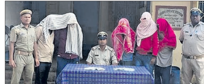
ଯୋଲିସ ଗହଣରେ ଗିରଫ ୫ ଅଭିଯୁକ୍ତ।