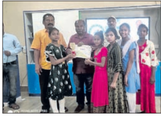
ପଦ୍ମପୁର, ୪।୨ (ପ୍ରଶାନ୍ତ କୁମାର କର)

ଓଡ଼ିଆ ଭାଷା ସମ୍ମିଳନୀ ପ୍ରତିଯୋଗିତା ଉଦ୍‌ଯାପିତ