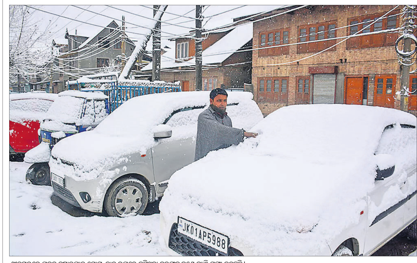
ଶ୍ରୀନଗରରେ ପ୍ରବଳ ଝୁଷାରପାତ ଯୋଗୁ କାର୍ ଉପରେ ଜମିଥିବା ବରଫକୁ ଜଣେ ବ୍ୟକ୍ତି ସଫା କରୁଛନ୍ତି।

ହାରାରେ, ୪୧: କ୍ୟାନ୍ସରରେ ପୀଡ଼ିତ ଥିବା ନାମିଆର ରାଷ୍ଟ୍ରପତି ହେଉଁ ଗିରଫୋଦ୍ଧାର ୮୨ ବର୍ଷ ବୟସରେ ପରଲୋକ ଘଟିଛି। ରାଷ୍ଟ୍ରପତିଙ୍କ କାର୍ଯ୍ୟାଳୟ ପକ୍ଷରୁ ଏନେଇ ଆଧିକାରିକ ବୟାନ କାରି କରାଯାଇଛି। ଏହି ଅବସରରେ ଆମେରିକାର କାର୍ଯ୍ୟନିର୍ବାହୀ ରାଷ୍ଟ୍ରପତି ଆଗୋଲୋ ମୁୟା ଦୁଷ୍ଟର ସହ ରାଷ୍ଟ୍ରୀୟ ଶୋକର ଘୋଷଣା କରିଥିଲେ। ଦେଶର ଦ୍ୱିତୀୟ ଥର ପାଇଁ ରାଷ୍ଟ୍ରପତି ଭାବେ ନିର୍ବାଚିତ ହୋଇଥିବା ଗିରଫୋଦ୍ଧାର କ୍ୟାନ୍ସରରେ ପୀଡ଼ିତ ଥିବା ନେଇ ଗତମାସରୁ ହିଁ ଦେଶବାସୀଙ୍କୁ ଜଣାଇ ଦେଇଥିଲେ। ନାମିଆର ସର୍ବାଧିକ ସମୟ ଧରି ପ୍ରଧାନମନ୍ତ୍ରୀ ରହିବାର ରେକର୍ଡ ମଧ୍ୟ ଗିରଫୋଦ୍ଧାର ନାଁରେ ରହିଛି।