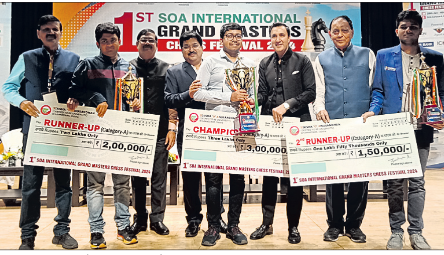
ଅନ୍ତର୍ଜାତୀୟ ଗ୍ରାଣ୍ଡମାଷ୍ଟର ଚେସ୍ ଫେସ୍ଟିଭାଲରେ ପ୍ରତିଯୋଗୀମାନେ ଅତିଥିକ ଗଣସଭାରେ।