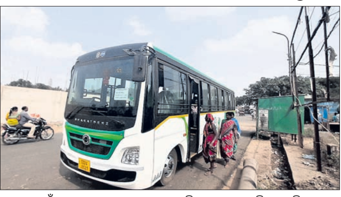
ପ୍ରତ୍ୟେକ ଗାଁ କୁଳ ସହ ଏବଂ ପ୍ରତ୍ୟେକ କୁଳ ସହର ସହିତ ଯୋଡ଼ିହୋଇଛି।

୨୦୨୩ ମାର୍ଚ୍ଚରେ ମାସ ଗୁରୁବାର ପ୍ରଥମ କରି ନବରଙ୍ଗପୁର ଜିଲ୍ଲାରେ ଗଢ଼ିଥିଲା ଲକ୍ଷ୍ମୀ ବସ୍। ପୁଣ୍ୟମନ୍ତ୍ରୀ ନବୀନ ପଟ୍ଟନାୟକ ଏହି ଯୋଜନା ନବରଙ୍ଗପୁର ଜିଲ୍ଲାବାସୀଙ୍କ ପାଇଁ ଆଶୀର୍ବାଦ ପାଳିଛନ୍ତି। ଜିଲ୍ଲାର ୧୮୯ ପଞ୍ଚାୟତରେ ଗୋଟ ୩୯ ବସ୍ ଗଢ଼ିବାବେଳେ ଜିଲ୍ଲାର ସମସ୍ତ ମାଆଙ୍କର ପୁଣ୍ୟ ସାଧନ ପାଲଟିଛି ଲକ୍ଷ୍ମୀ ବସ୍। ପୂର୍ବରୁ ଜିଲ୍ଲାର ସହର ଏବଂ କୁଳ ସଦର ମହକୁମାଠାରୁ ଗ୍ରାମାଞ୍ଚଳକୁ ଗମନାଗମନରେ ବହୁ ଅସୁବିଧା ରହିଥିଲା। ଲକ୍ଷ୍ମୀ ବସ ମାଧ୍ୟମରେ ଜଣେ ଚାଷୀ ବଜାର ସହିତ ଯୋଡ଼ି ହେଉଛି, ଛୋଟ ବଡ଼ ବ୍ୟବସାୟୀ ଗାଁକୁ ସହରକୁ ଆସିବାର ସୁବନ୍ଧ ବ୍ୟବସ୍ଥା ପାଲଟିଛି। ଜଣେ ଗୋଟା କର୍ମ ପଛରେ ଆରାମରେ ଜିଲ୍ଲା ପୁଣ୍ୟ ବିକାଶକୁ ଆସିପାରେ। ସେହିପରି ଛାତ୍ରଛାତ୍ରୀ ଗ୍ରାମାଞ୍ଚଳକୁ ବିଦ୍ୟାଳୟ ଓ ମହାବିଦ୍ୟାଳୟକୁ ମାତ୍ର ୫୦ଟା ବେଳ ସାଥାଯାତ କରିପାରୁଛନ୍ତି। ବର୍ତ୍ତମାନ