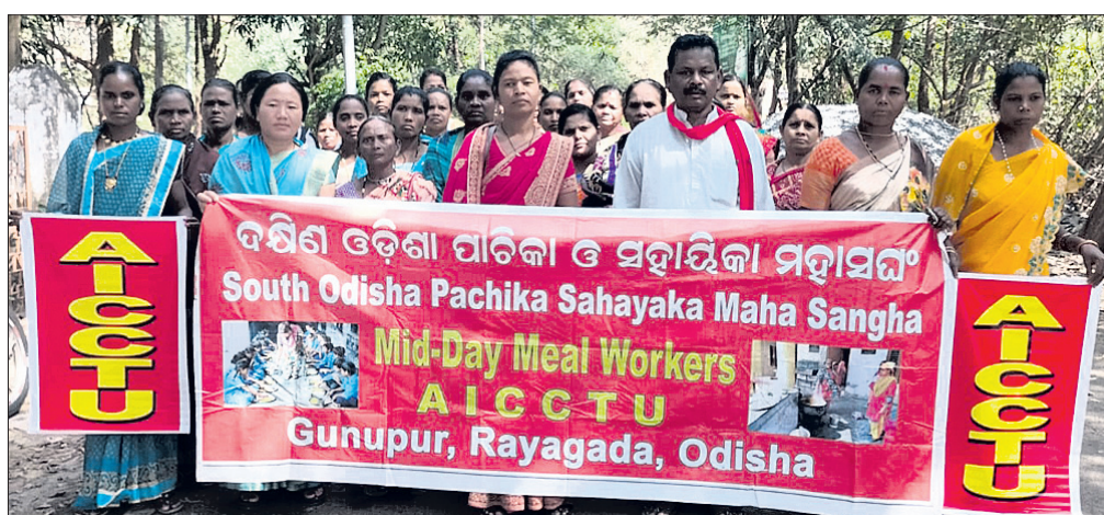
ମଧ୍ୟାହ୍ନଭୋଜନ ପାଟିକା ଓ ସହାୟିକା ମହାସଂଘର ଶୋଭାଯାତ୍ରା।

ପକ୍ଷରୁ ଭୋଜନ ପାଟିକା ଓ ସହାୟିକା ମହାସଂଘ ପକ୍ଷରୁ ବିଭିନ୍ନ ଦାବି ନେଇ ରାୟଗଡ଼ା ଜିଲ୍ଲା ଗୁଣପୁର ତହସିଲ ଅଫିସ ସଙ୍ଗୀତ କଳା ନିକଟରେ ବ୍ଲକସ୍ତରୀୟ ବୈଠକ ରବିବାର ଅନୁଷ୍ଠିତ ହୋଇଯାଇଛି। ପାଟିକାମାନଙ୍କୁ ସରକାରୀ କର୍ମଚାରୀ ମାନ୍ୟତା, ମାସିକ ସର୍ବନିମ୍ନ ମାତ୍ରର ୨୬ ହଜାର ଟଙ୍କା ପ୍ରଦାନ, ପାଟିକାଙ୍କୁ ୧୦ ମାସ ପରିବର୍ତ୍ତେ ୧୨ମାସ ପାରିଶ୍ରମିକ ପ୍ରଦାନ କରିବା, ୨୦୨୨ ମେ, ଜୁନରେ କାମ କରିଥିବା ସମସ୍ତ ପାଟିକାଙ୍କୁ ପାରିଶ୍ରମିକ ପ୍ରଦାନ କରିବା, ୨୦୦୯ ଡିସେମ୍ବରରୁ ୨୦୧୨ ମାର୍ଚ୍ଚ ପର୍ଯ୍ୟନ୍ତ କାମ କରିଥିବା ସମସ୍ତ ପାଟିକା ସହାୟିକା ନିକ୍ଷେପ ଚାଲିକା ପ୍ରସ୍ତୁତ କରି ମୃତକଙ୍କ ଉତ୍ତରାଧିକାରୀଙ୍କୁ ଓ ଅବସରପ୍ରାପ୍ତ ପାଟିକାଙ୍କୁ ପାରିଶ୍ରମିକ ଅବକାଶ ପ୍ରଦାନ କରିବାକୁ ଦାବି ହୋଇଛି। ସେହିପରି ସ୍କୁଲ ବନ୍ଦ, ସ୍କୁଲ ମିଶ୍ରଣ ଫକ୍ଟରେ ବାଦ ପଡ଼ିଥିବା ସମସ୍ତ ପାଟିକାଙ୍କୁ ଅନ୍ୟତ୍ର ନିଯୁକ୍ତ ନିଯୁକ୍ତ କରିବା, ପିଲାସଂଖ୍ୟା କମି ପାଇଁ ବନ୍ଦ ହୋଇଥିବା ୧୬୬ ଓ ୧୪୭୭୯ ପ୍ରାଥମିକ ବିଦ୍ୟାଳୟକୁ ତୁରନ୍ତ ଖୋଲାଯାଇ ପାଟିକାଙ୍କୁ ନିଯୁକ୍ତ କରିବା, ଅବସରକାରୀମାନ