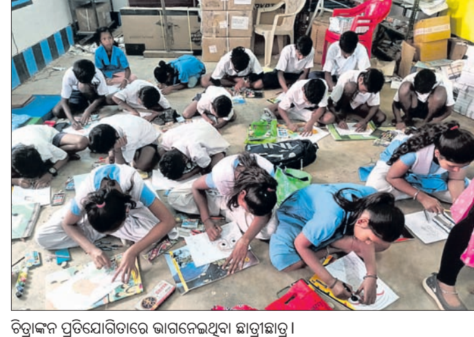
ବିଭାଗୀୟ ପ୍ରତିଯୋଗିତାରେ ଭାଗନେଇଥିବା ଛାତ୍ରଛାତ୍ରୀ।