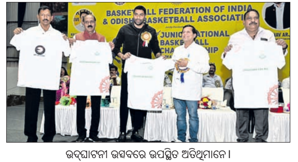
ଉଦ୍‌ଯାପନ ଉତ୍ସବରେ ଉପସ୍ଥିତ ଅତିଥିମାନେ।

ଭୁବନେଶ୍ୱର, ୪୧୨ (ତପନ ସାହି) ବାସ୍କେଟବଲ ଫେଡରେସନ୍ ଅଫ୍ ଇଣ୍ଡିଆ ଓ ଓଡ଼ିଶା ବାସ୍କେଟବଲ ଆସୋସିଏସନ୍ ଆୟୁକ୍ତଙ୍କୁ ୬-୨, ୬-୬(୫) ସେଟରେ ପରାସ୍ତ କରି ଭାରତକୁ ୪-୦ରେ ଆଗୁଆ କରିଥିଲେ। ଭାରତୀୟ ଯୋଡି ପ୍ରଥମ ସେଟରେ ସହଜ ବିଜୟ ହାସଲ କରିଥିବା ବେଳେ ଦ୍ୱିତୀୟ ସେଟ୍ ଗାଜ୍‌ବେକରରେ ପଲସଲ ହୋଇଥିଲା।