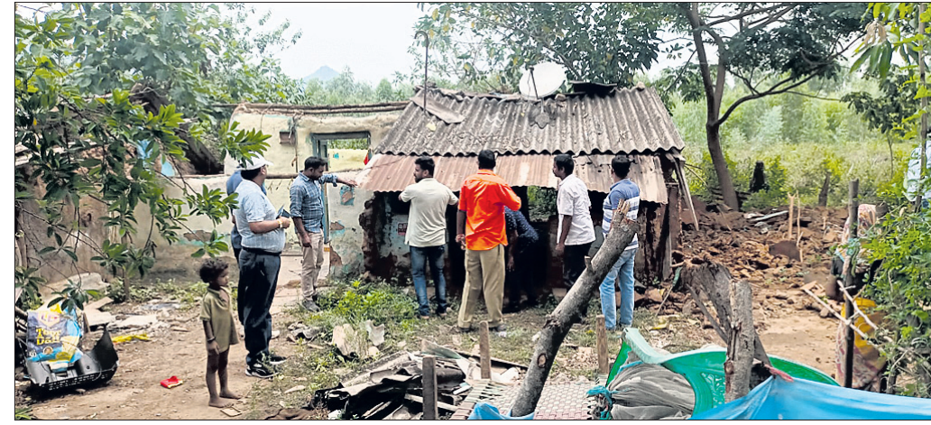
ରେଳଫେ ପକ୍ଷରୁ କୋଇଲାପତାଠାରେ ଚାଲିଥିବା ବସ୍ତି ଉଚ୍ଚେଦ।

ରାୟଗଡ଼ା ରେଳ ଡିଭିଜନ ଅଫିସ ଓ ତୃତୀୟ ରେଳଧାରଣା ନିର୍ମାଣ ନିମନ୍ତେ ବସ୍ତିବାସିନ୍ଦା ଉଚ୍ଚେଦ ପ୍ରତିରୋଧ ଆରମ୍ଭ ହୋଇଛି। ବସ୍ତି ଉଚ୍ଚେଦ ପରେ ସେହି ଜମିରେ ନୂତନ ଡିଭିଜନ କାର୍ଯ୍ୟାଳୟ ସ୍ଥାପନା କରାଯିବ। ସେହିଭଳି ବିଭିନ୍ନ ସ୍ଥାନରେ ରେଳଫେ କମିରେ ଥିବା ବସ୍ତି ଉଚ୍ଚେଦ କରାଯାଇ ବିଜୟନଗର-ଚିଟଲାଗଡ଼ ନୂତନ ରେଳଲାଇନ ନିର୍ମାଣ କାମ ଚାଲିଛି। ତେବେ ବସ୍ତି ଉଚ୍ଚେଦ ହେଲେ ସେମାନେ କୁଆଡ଼େ ଯିବେ ଓ କେଉଁଠି ରହିବେ ନେଇ ଏବେ ବିଚାର ପ୍ରଶ୍ନ ଭାବେ ଉଠା ହୋଇଛି। ହଜାର ହଜାର ଲୋକ ବିଭିନ୍ନ ବସ୍ତିରେ ରହୁଥିବା ବେଳେ ସେମାନଙ୍କ ଅଲଥାନ ନେଇ କେହି ଚିନ୍ତା ପ୍ରକଟ କରୁନାହାନ୍ତି। ଅନ୍ୟପକ୍ଷେ ଏକ ସମାପ୍ତ ହୁଏ ବସ୍ତି ଖାଲି କରିବା ପାଇଁ ରେଳ ବିଭାଗ ପକ୍ଷରୁ ଶେଷ ନୋଟିସ ଜାରି କରାଯାଇଛି। ତେଣୁ ପ୍ରଶ୍ନାସନ ପକ୍ଷରୁ ସେମାନଙ୍କୁ ଅଲଥାନ କରିବା ପାଇଁ