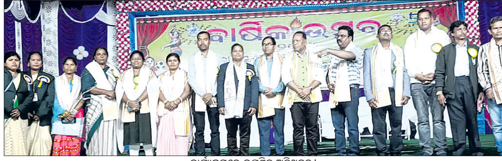
କାର୍ଯ୍ୟକ୍ରମରେ ଉପସ୍ଥିତ ଅତିଥିବୃନ୍ଦ।