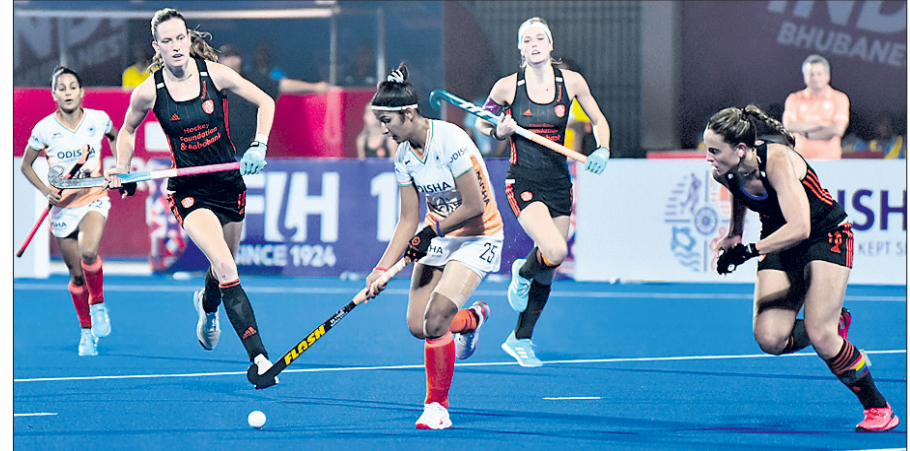
ଭାରତ ଓ ନେଦରଲାଣ୍ଡ ମଧ୍ୟରେ ଅନୁଷ୍ଠିତ ମ୍ୟାଚ ।

ଭୁବନେଶ୍ୱର, ୪୧୨ (ତପନ ସାହି) କଳିଙ୍ଗ ଷ୍ଟାଡ଼ିୟମରେ ଚାଲିଥିବା ଏସିଆଇଏସ୍ ମହିଳା ହକି ପ୍ରତିଯୋଗିତାରେ ଭାରତ ଆଣ୍ଡରସିୟା ପ୍ରଦର୍ଶନ କରି ପାରିନାହିଁ। ଫଳରେ ଘରୋଇ ଦଳ କ୍ରମାଗତ ଦ୍ୱିତୀୟ ପରାଜୟ ବରଣ କରିଛି। ଶନିବାର ପରାଜୟ ବରଣ କରିଛି। ୯ ଟାରିକ୍ସରେ ଓଏସିଏ ସହାର ପରବର୍ତ୍ତୀ ମ୍ୟାଚରେ ଗୋଳକ୍ରମ କେରଳ ଏସିଏକୁ ଭେଟିବ।