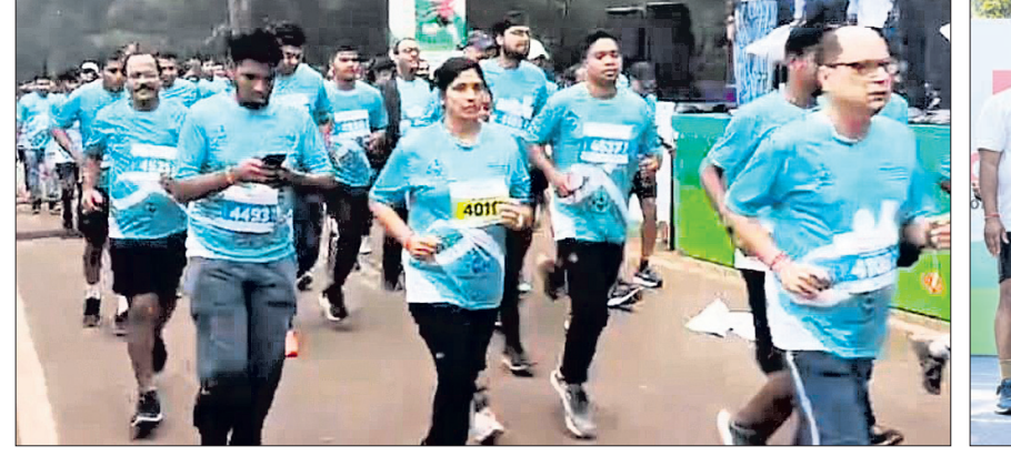
ଗାଟା ଷ୍ଟିଲ ମେରାମଣ୍ଟଳା ପକ୍ଷରୁ ହାଟ୍ ମାରାଥନ।

କରିଛି। ଏହା ହେଉଛି ବିଶ୍ୱବ୍ୟାପୀ ହେଉଥିବା ମାରାଥନ ଓ ଦୂର ଦୌଡ଼ର ଦେଖାଶୁଣା କରୁଥିବା ଯୋଗଦାନକ୍ରିତ ଏକ ସଙ୍ଗଠନ। ଗାଟା ଷ୍ଟିଲ ମେରାମଣ୍ଟଳା ହାଟ୍ ମାରାଥନ ଆସୋସିଏସନ୍ ଅଫ୍ ଇଣ୍ଡିଆର ମାନ୍ୟତା ହାସଲ କରିଛି। ଏହା ହେଉଛି ବିଶ୍ୱବ୍ୟାପୀ ହେଉଥିବା ମାରାଥନ ଓ ଦୂର ଦୌଡ଼ର ଦେଖାଶୁଣା କରୁଥିବା ଯୋଗଦାନକ୍ରିତ ଏକ ସଙ୍ଗଠନ। ଗାଟା ଷ୍ଟିଲ ମେରାମଣ୍ଟଳା ହାଟ୍ ମାରାଥନ ଆସୋସିଏସନ୍ ଅଫ୍ ଇଣ୍ଡିଆର ମାନ୍ୟତା ହାସଲ କରିଛି। ଏହା ହେଉଛି ବିଶ୍ୱବ୍ୟାପୀ ହେଉଥିବା ମାରାଥନ ଓ ଦୂର ଦୌଡ଼ର ଦେଖାଶୁଣା କରୁଥିବା ଯୋଗଦାନକ୍ରିତ ଏକ ସଙ୍ଗଠନ।