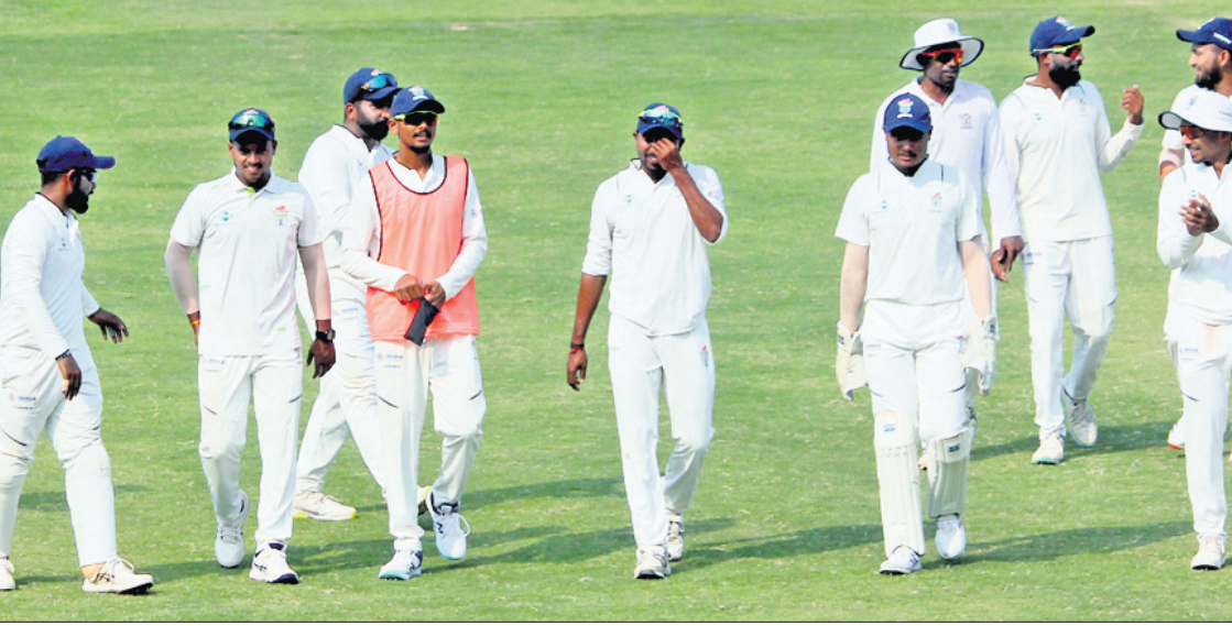
ମ୍ୟାଚ ଶେଷରେ ଓଡ଼ିଶା ଖେଳାଳିମାନେ ପଡ଼ିଆକୁ ଫେରୁଛନ୍ତି।