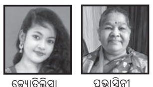
ବ୍ୟକ୍ତିଗତ ପତ୍ନୀ ଉପସ୍ଥାପନା ପ୍ରଦାନକାରୀ