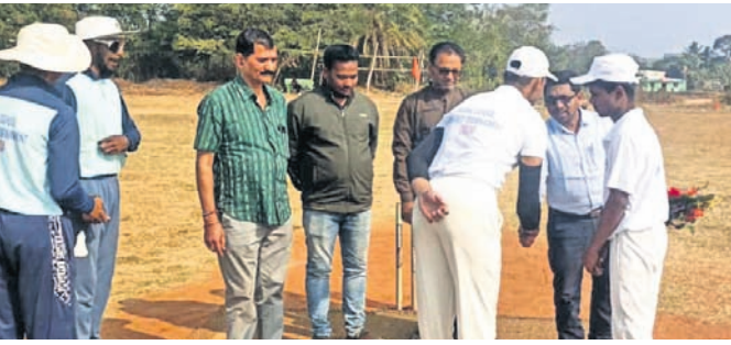
ବୁକ୍ସ ଚିମ୍ପ କ୍ୟାମ୍ପରେ ନ୍ୟସର ବସ୍ ପହଞ୍ଚିଛି ।