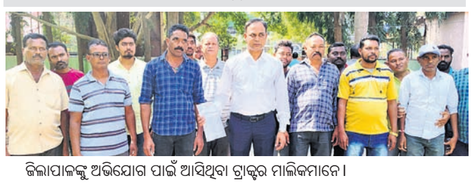
ଜିଲ୍ଲାପାଳଙ୍କୁ ଅଭିଯୋଗ ପାଇଁ ଆସିଥିବା ଟ୍ରାକ୍ଟର ମାଲିକମାନେ ।

ମହାନ୍ତଙ୍କ ସେମାନଙ୍କ ଅଭିଯୋଗ ଗ୍ରହଣ କରି ରାଜସ୍ୱ ଓ ଖଣି ବିଭାଗ ସହିତ ଆଲୋଚନା କରି ପଦକ୍ଷେପ ନିଆଯିବ ବୋଲି ପ୍ରତିଶ୍ରୁତି ଦେଇଥିବା ଜଣାପଡ଼ିଛି । ନାଗାବଳୀ ଓ ଝଞ୍ଜାବତୀ ନଦୀର ବାଲି ଚାଲାଇବା ବନ୍ଦ ହେବାରୁ ଖଳ ଫର୍ମ ମିଳୁନାହିଁ । ଖଳ ଫର୍ମ ନ ଥିବାରୁ ବାଲି ଆଣିଲେ ଏନଡୋର୍ସମେଣ୍ଟ ଚିମ୍ପ