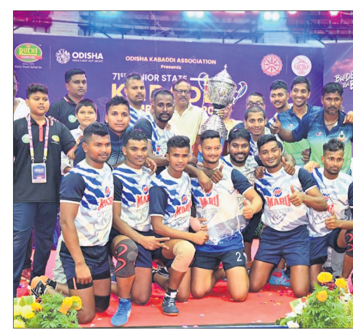
ପୁରୁଷ ବିଭାଗରେ ଚାମ୍ପିୟନ ଓଡ଼ିଶା ଯୋଲିସ ଓ ମହିଳା ବର୍ଗ ଚାମ୍ପିୟନ ଇଣ୍ଡିଆନ୍ ଇଣ୍ଡିଆନ୍ କବାଡ଼ି ଖେଳାଳୀମାନେ ପ୍ରତି ସହ ଅତିଥି ଓ କର୍ମକର୍ତ୍ତାଙ୍କ ସହ ଗ୍ରହଣରେ।