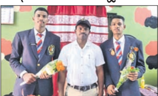
ରାୟଗଡ଼ା, ୫.୧୨ (ଆଶିଷ ରଞ୍ଜନ ପଣ୍ଡା)

ଲାଇଲିକା ପରେତରେ ଅଂଶଗ୍ରହଣ କରିଥିବା ୨ ଏନସିସି କ୍ୟାଡେଟଙ୍କୁ ସ୍ମାରକ