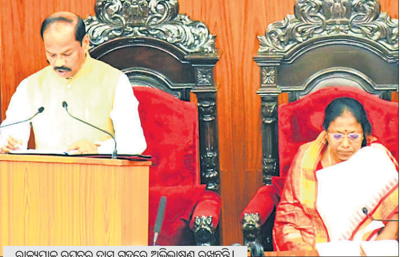
ରାଜ୍ୟପାଳ ରତ୍ନବର ଦାସ ଗୃହରେ ଅଭିଭାଷଣ ରଖିଛନ୍ତି।

ଝୋଡ଼ଶ ବିଧାନସଭାରେ ପଞ୍ଚଦଶ ଅଧିବେଶନ ଯୋଗ୍ୟରେ ଆଜି ଆରମ୍ଭ ହୋଇଛି। ଅଧିବେଶନର ପ୍ରଥମ ଦିନରେ ରାଜ୍ୟପାଳ ରତ୍ନବର ଦାସ ଗୃହରେ ଅଭିଭାଷଣ ରଖିଛନ୍ତି। ପୂର୍ବରୁ ୧୧ଟି ରାଜ୍ୟପାଳଙ୍କ ଭାଷଣ ଆରମ୍ଭ ହୋଇଥିଲା। ରାଜ୍ୟପାଳ ୫୬ ପୃଷ୍ଠାର ଲକ୍ଷ୍ୟ ଭାଷଣ ପଢ଼ିଥିଲେ। ଏଥିରେ ରାଜ୍ୟ ସରକାରଙ୍କ ବିକାଶର ଚିତ୍ର ଆଙ୍କିଛନ୍ତି। ପୁରୀ ଶ୍ରୀମନ୍ଦିର ପରିକ୍ରମା ପ୍ରକଳ୍ପକୁ ରାଜ୍ୟପାଳ ନିଜର ଅଭିଭାଷଣ ଆରମ୍ଭ କରି କହିଛନ୍ତି, ଏହି ପ୍ରକଳ୍ପ ୮୦୦ କୋଟି ଟଙ୍କା ବ୍ୟୟରେ ହୋଇଛି। କାମୁଆରୀ ୧୨ରେ ଭକ୍ତମାନଙ୍କ ଉଦ୍ଦେଶ୍ୟରେ ଏହାକୁ ଲୋକାର୍ପଣ କରାଯାଇଛି। ଏହା ଆଗକୁ ଅତ୍ୟଧିକ ବୃଦ୍ଧି ଆଣିବ। ଯୋଗାଇବା ସହ ଶ୍ରୀମନ୍ଦିର ପୁରୀରେ ଗୁରୁତ୍ୱପୂର୍ଣ୍ଣ ଭୂମିକା ନେବ। ଲୋକଙ୍କୁ ସୁବିଧାରେ ମହାପ୍ରଭୁଙ୍କ ଦର୍ଶନ ପାଇଁ 'ଲକ୍ଷ୍ମୀ' ଯୋଜନା ମାଧ୍ୟମରେ 'ଶ୍ରୀକରନାଥ ସ୍କୁପ୍ରୋସେ' ଆରମ୍ଭ ହୋଇଛି। ରାଜ୍ୟର ବିଭିନ୍ନ ସ୍ଥାନରେ ଅବସ୍ଥିତ ଆରାଧନାସ୍ଥଳୀଗୁଡ଼ିକର ମଧ୍ୟ ଦ୍ରୁତ ରୂପାନ୍ତରାକରଣ କାର୍ଯ୍ୟ ଚାଲିଛି। ଶ୍ରୀମନ୍ଦିର ପରିକ୍ରମା ପ୍ରକଳ୍ପର ୧୦ ଦିନ ପରେ ସମାପ୍ତ ହେବା ପାଇଁ କୋଟି ଟଙ୍କା ବ୍ୟୟରେ ମହାନଦୀ ତଟରେ ଅବସ୍ଥିତ ଝୋଡ଼ଶ ଶତାବ୍ଦୀର ଏହି ଉପାସନା ପୀଠର ରୂପାନ୍ତରାକରଣ କରାଯାଇଛି।