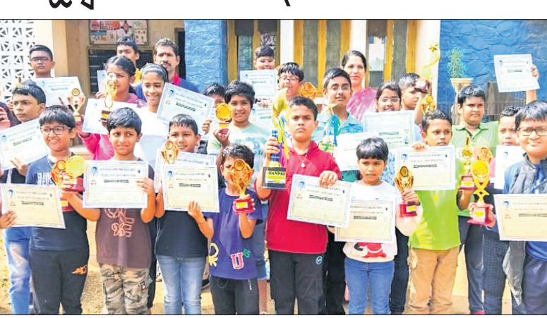
ପୁରସ୍କାର ସହ କୃତୀ ପ୍ରତିଯୋଗୀମାନେ।

ଭୁବନେଶ୍ୱର, ୫୧ (ତପନ ସାଲ୍) ଓଡ଼ିଶା ରାଜ୍ୟ ଚେମ୍ପିୟନଶିପ୍ ଆୟୋଜିତ ହେବା ପରେ ପ୍ରତିଯୋଗୀମାନେ ଶ୍ରେଷ୍ଠ ପ୍ରଦର୍ଶନ କରିଥିଲେ। ଓଡ଼ିଶା ରାଜ୍ୟ ଚେମ୍ପିୟନଶିପ୍ ଆୟୋଜିତ ହେବା ପରେ ପ୍ରତିଯୋଗୀମାନେ ଶ୍ରେଷ୍ଠ ପ୍ରଦର୍ଶନ କରିଥିଲେ। ଓଡ଼ିଶା ରାଜ୍ୟ ଚେମ୍ପିୟନଶିପ୍ ଆୟୋଜିତ ହେବା ପରେ ପ୍ରତିଯୋଗୀମାନେ ଶ୍ରେଷ୍ଠ ପ୍ରଦର୍ଶନ କରିଥିଲେ। ଓଡ଼ିଶା ରାଜ୍ୟ ଚେମ୍ପିୟନଶିପ୍ ଆୟୋଜିତ ହେବା ପରେ ପ୍ରତିଯୋଗୀମାନେ ଶ୍ରେଷ୍ଠ ପ୍ରଦର୍ଶନ କରିଥିଲେ। ଓଡ଼ିଶା ରାଜ୍ୟ ଚେମ୍ପିୟନଶିପ୍ ଆୟୋଜିତ ହେବା ପରେ ପ୍ରତିଯୋଗୀମାନେ ଶ୍ରେଷ୍ଠ ପ୍ରଦର୍ଶନ କରିଥିଲେ।