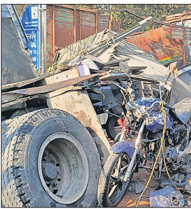
ଦୁର୍ଘଟଣାଗ୍ରସ୍ତ ଟ୍ରକ୍ ନିକଟରେ ପିଠି ଆଇରନ ପଡ଼ିଛି।