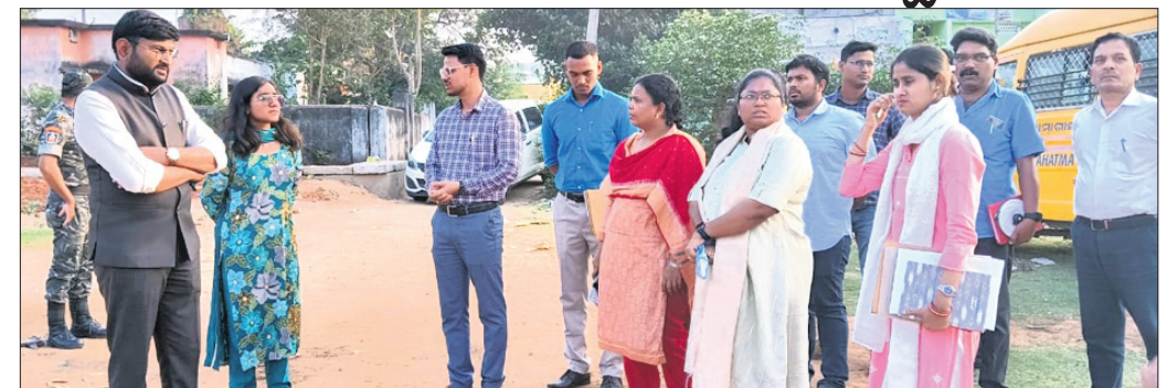
ଜିଲ୍ଲାପାଳ ବିଜୟ କାର୍ଯ୍ୟର ସମୀକ୍ଷା କରୁଛନ୍ତି ।