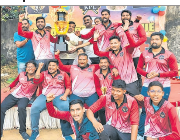
ଚାମ୍ପିୟନ ବାଘେଶ୍ୱର ଖାରିୟର୍ ଦଳର ଖେଳାଳିମାନେ ପ୍ରତି ସହ।

ପୁରୁଣା ଭୁବନେଶ୍ୱର, ୫୧ (ସୁଧାକର ଚନ୍ଦ୍ର ପ୍ରଧାନ) ଶ୍ରୀମତୀ ବିଏମ୍ ହାଇସ୍କୁଲ୍ ପଡ଼ିଆରେ କପାଳି ପ୍ରତିଯୋଗିତା ଲିଗ୍ କ୍ରିକେଟ୍ ଟୁର୍ନାମେଣ୍ଟର ୪ର୍ଥ ସଂସ୍କରଣ ଅନୁଷ୍ଠିତ ହୋଇଯାଇଛି। ଦୁଇ ଦିନିଆ ପ୍ରତିଯୋଗିତାର ଫାଇନାଲ ସୋମବାର ବାଘେଶ୍ୱର ଖାରିୟର୍ ଓ ଡିଏସିଏ ଚାମ୍ପିୟନ ପଦବୀ ପ୍ରାପ୍ତ କରିଥିଲେ। ବାଘେଶ୍ୱର ଖାରିୟର୍ ଚପ୍ ଜିତି ପ୍ରଥମେ ବ୍ୟାଟ୍ କରି ୧୦ ଓଭରରେ ୧୬୮ ରନ୍ କରିଥିଲା। ଜବାବରେ ଗତ ୩ ଥର ଚାମ୍ପିୟନ ଡିଏସିଏ ଚାମ୍ପିୟନ ୧୦ ଓଭରରେ ମାତ୍ର ୧୧୯ ରନ୍ କରିପାରିଥିଲା। ଫାଇନାଲରେ ବିଜି ବନ୍ଦୁ ୧୬ ବଲ୍ରେ ୫୪ ରନ୍ କରି ମ୍ୟାଚ୍ ଅଫ୍ ଦି ଫାଇନାଲ ବିବେଚିତ ହୋଇଥିଲେ। ନିଜକୁ ମହାପାତ୍ର ଟୁର୍ନାମେଣ୍ଟରେ ସର୍ବାଧିକ ୧୬୫ ରନ୍ କରି ଶ୍ରେଷ୍ଠ