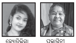
ବ୍ୟକ୍ତିଗତ ପତ୍ନୀ ଉପାସନା ପରିବାରର