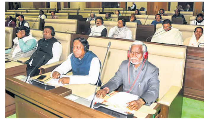
ଖଡ଼ଖଣ୍ଡ ବିଧାନସଭାରେ ମୁଖ୍ୟମନ୍ତ୍ରୀ ଚମ୍ପାଇ ସୋରେନ୍ ଓ ଅନ୍ୟ ବିଧାୟକମାନେ।

ଭାବରେ ମାରିଦେବାକୁ ଦେବୁ ନାହିଁ। ଦେଶରେ ଏକମାତ୍ର ଦୃଢ଼ ଶକ୍ତି ହେଲା ଗଣତନ୍ତ୍ରର ସ୍ୱଭାବ ବୋଲି ସିଜେଆଇ କହିଛନ୍ତି। ଖଣ୍ଡପୀଠରେ ସିଜେଆଇଙ୍କ ସମେତ ଜଷ୍ଟିସ୍ ଜେ.ପି. ପଟ୍ଟିଓଲା ଏବଂ ମନୋଜ ମିଶ୍ରା ରହିଛନ୍ତି। ମେୟର ନିର୍ବାଚନରେ ଜାଲିଆଡ଼ି ହୋଇଥିବା ଏଏପି ଏବଂ କଂଗ୍ରେସ ପକ୍ଷରୁ ଅଭିଯୋଗ ହୋଇଥିଲା। ନିର୍ବାଚନକୁ ଦିଲ୍ଲୀ ମୁଖ୍ୟମନ୍ତ୍ରୀ ତଥା ଏଏପି ଆବାହକ ଅରବିନ୍ଦ କେଜ୍ରିଓଲା ଅସାଧାରଣ ଓ ବେଆଇନ କହିବା ସହ ଏଭଳି କାର୍ଯ୍ୟକୁ ଦେଖିପ୍ରୋହ କହିଥିଲେ। ନିର୍ବାଚନକୁ ଭାଙ୍ଗି ଲୁଚ୍ କରୁଥିବା ସେ ଅଭିଯୋଗ କରିଥିଲେ। ମେୟର ନିର୍ବାଚନରେ ବିବାଦକୁ ନେଇ ସମାଲୋଚନା ଜୋର୍ ଧରିବା ସହ ଦିଲ୍ଲୀରେ ଉଭୟ ଗୋଷ୍ଠୀ ପକ୍ଷରୁ ବିରୋଧ ପ୍ରଦର୍ଶନ କରାଯାଇଥିଲା।