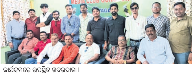
କାର୍ଯ୍ୟକ୍ରମରେ ଉପସ୍ଥିତ ଖବରଦାତା ।