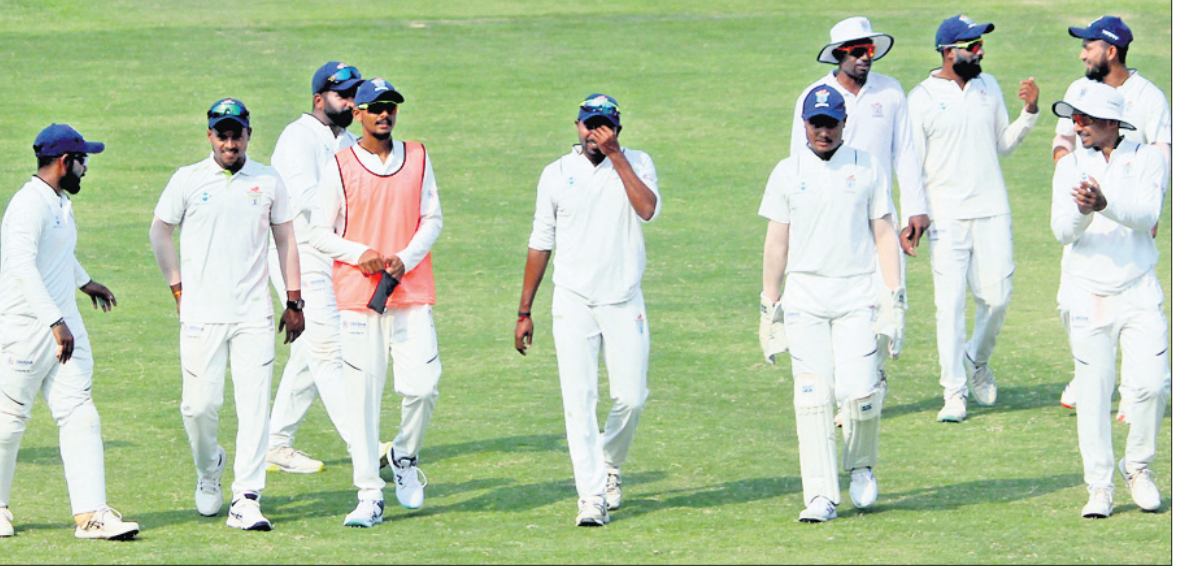
ମ୍ୟାଚ ଶେଷରେ ଓଡ଼ିଶା ଖେଳାଳିମାନେ ପଡ଼ିଆକୁ ଫେରୁଛନ୍ତି।

ଭୁବନେଶ୍ୱର, ୫୧୨ (ଚପନ ସାଇ) କଟକର ବାରବାଟୀ ସ୍ଥାପିତମାନେ ଅନୁଷ୍ଠିତ ଓଡ଼ିଶା-ପୁଡୁଚେରୀ ରଣଜୀ ତ୍ରୁଟି କ୍ରିକେଟ ମ୍ୟାଚ ଅମାମ୍ୟାସିତଭାବେ ଶେଷ ହୋଇଛି।