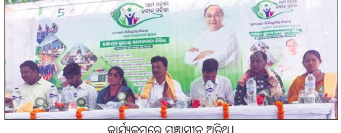
କାର୍ଯ୍ୟକ୍ରମରେ ମଞ୍ଚାସୀନ ଅଟନ୍ତି।

କଳାହାଣ୍ଡି ଜିଲା ମ. ରାମପୁର ବ୍ଲକ୍ ଅନ୍ତର୍ଗତ ମଦନପୁର ଖେଳପଡ଼ିଆଠାରେ ନବୀନ ଓଡ଼ିଶା ସଚେତନତା ଶିବିର ପ୍ରତିଷ୍ଠା କରାଯାଇଛି।