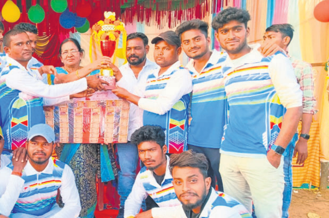
ଚାମ୍ପିୟନ ଦଳକୁ ଅତିଥି ପୁରସ୍କୃତ କରୁଛନ୍ତି।