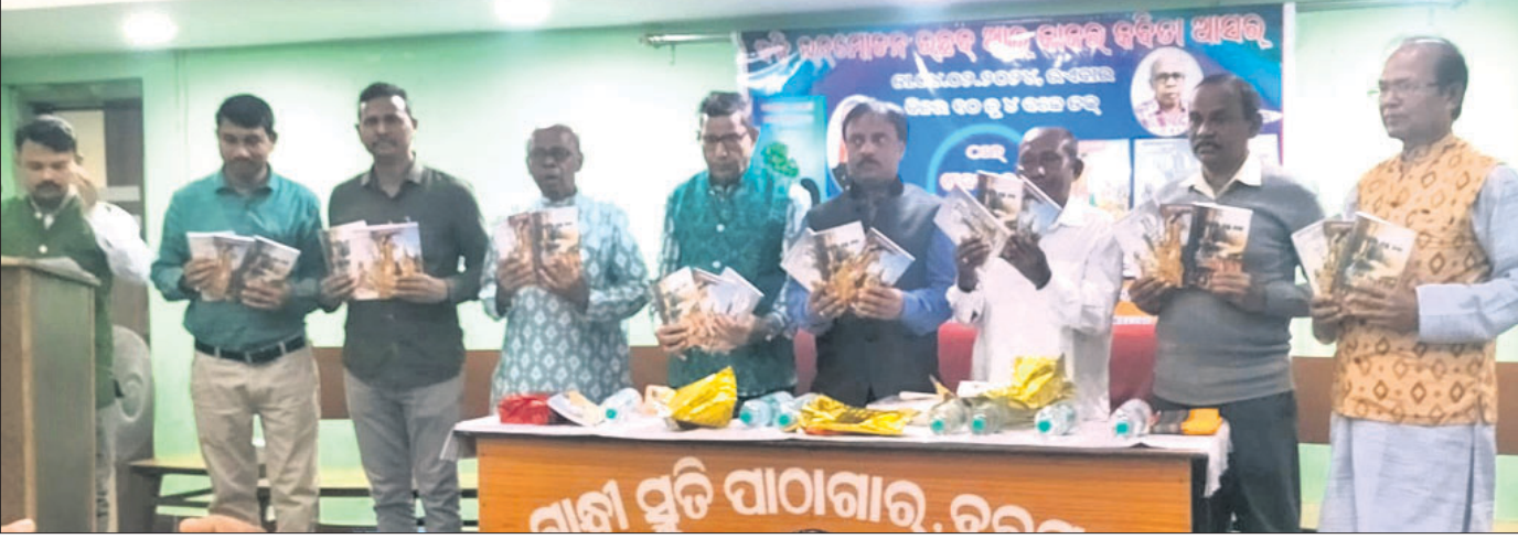
ସାରସ୍ୱତ ସମାରୋହରେ ପୁସ୍ତକ ଉନ୍ମୋଚନ କରାଯାଉଛି ।

ପାଇକମାଳ, ୫୨ (ବଡ଼ ଶତପଥୀ): ଓଡ଼ିଆ ଭାଷା ସଂସ୍କୃତିକ ପ୍ରତିଯୋଗିତା ଉଦ୍‌ଯାପନା ସମାରୋହ ଓ ପୁରସ୍କାର ବିତରଣ ଉତ୍ସବ ବରଗଡ଼ ଜିଲ୍ଲା ପାଇକମାଳ ବିନ୍ଧ୍ୟାବିନ୍ଧ୍ୟା ଉଚ୍ଚ ମାଧ୍ୟମିକ ବିଦ୍ୟାଳୟରେ ଅନୁଷ୍ଠିତ ହୋଇଯାଇଛି।