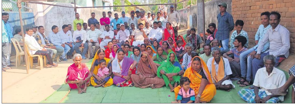
ଧାରଣାରେ ବସିଛନ୍ତି ଗ୍ରାମବାସୀ।

ତିତସ୍ୟୁଠକ ସହିତ ଫୋନରେ କଥା ହୋଇଛି। ଅର୍ଥପତ୍ର ଗଲେ ତୁରନ୍ତ ୨୬୯୫ ଶିକ୍ଷକ ଡେପୁଟେସନରେ ବସିଥିଲେ। ୨ ଘଣ୍ଟା ପରେ ଅତିରିକ୍ତ ଜିଲା ମଙ୍ଗଳ ଅଧିକାରୀ ସମ୍ମୁଖରେ ଉପସ୍ଥିତ ହୋଇଥିଲେ।