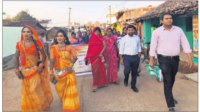
ଭୋଟର ସଚେତନତା ପାଇଁ କଳାହାଣ୍ଡି ଜିଲା ସ୍ୱାଧିକାର ଦେଇ ନିଶ୍ଚୟ କାର୍ଯ୍ୟକ୍ରମ ଅନୁଷ୍ଠିତ କରାଯାଇଛି।