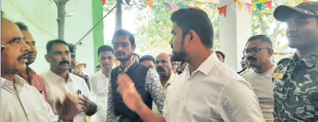
ଅତିରିକ୍ତ ଜିଲ୍ଲାପାଳ ଓ ଉପଜିଲ୍ଲାପାଳଙ୍କୁ ଅର୍ପିତ ସରକାରୀ କାର୍ଯ୍ୟାଳୟର ବାରଣ କରୁଛନ୍ତି ।