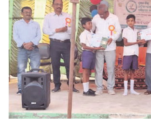
କୃତୀ ବିଦ୍ୟାର୍ଥୀଙ୍କୁ ଅତିଥିମାନେ ପୁରସ୍କୃତ କରୁଛନ୍ତି ।

ବରଗଡ଼ ଜିଲ୍ଲା ସୋହେଲା ବ୍ଲକ୍ ସାମାଜିକ ଶ୍ରମିକ ଉଚ୍ଚ ବିଦ୍ୟାଳୟରେ ପରିସରରେ ରୁକ୍ମପୁରୀୟ ପ୍ରଥମ ବିଶ୍ୱ ଓଡ଼ିଆ ଭାଷା, ସାହିତ୍ୟ ଓ ସୃଜନଶୀଳତା ସମ୍ମିଳନୀ ଅନୁଷ୍ଠିତ ହୋଇଯାଇଛି।