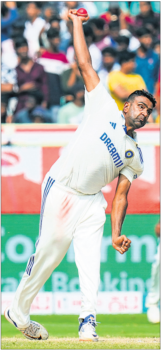
ବୋଲିଂ ଆକ୍ସନରେ ରବିଚନ୍ଦ୍ର ଅଶ୍ୱିନ।

ବିଶାଖାପାଟଣାରେ ଅନୁଷ୍ଠିତ ଡକ୍ଟରୀୟ ଚେଷ୍ଟାରେ ଇଂଲଣ୍ଡକୁ ୧୦୨ ରନରେ ହରାଇବା ସହ ୫ ମ୍ୟାଚ୍ ବିଶିଷ୍ଟ ସିରିଜକୁ ପ୍ରତ୍ୟାବର୍ତ୍ତନ କରିଛି ଭାରତ। ୩୯୯ ରନ ଲକ୍ଷ୍ୟର ପିଛା କରୁଥିବା ଇଂଲଣ୍ଡ ୨୯୨ ରନରେ ସମସ୍ତ ଉଲ୍ଲକେଟ ହରାଇଥିଲା।