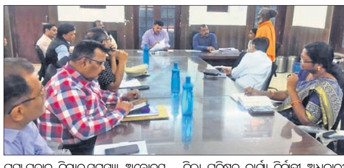
ପକ୍ଷା ପ୍ରଦାନ, ବିଦ୍ୟୁତ୍ ସମସ୍ୟା, ଅଭୋଦୟ ଯୋଜନା, ରାସନ କାର୍ଡ ଓ ପାନୀୟ ଜଳ ସମସ୍ୟା ନେଇ ଅଭିଯୋଗ ପ୍ରଦାନ କରାଯାଇଥିଲା।

ଦେବଗଡ଼ ଜିଲ୍ଲାପାଳଙ୍କ ସମ୍ମିଳନୀ କକ୍ଷରେ ଜିଲ୍ଲାପାଳଙ୍କ ସ୍ୱଚ୍ଛ ଅଭିଯୋଗ ଶୁଣାଣି ଶିବିର ଆନୁଷ୍ଠିତ ହୋଇଯାଇଛି। ଏହି ଶିବିରରେ ଜିଲ୍ଲାପାଳ ସାମାଜିକ ସୁବିଧାଗୁଡ଼ିକ ଉପରେ ଲୋକଙ୍କୁ ନିର୍ଦ୍ଦେଶ ଦେଇଥିଲେ।