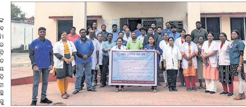
ଜିଲ୍ଲା ମୁଖ୍ୟ ପ୍ରାଣୀ ଚିକିତ୍ସାକାରୀଙ୍କ କାର୍ଯ୍ୟାଳୟ ସମ୍ମୁଖରେ ସାମୂହିକ ଛୁଟିରେ ଥିବା ପ୍ରାଣୀ ଚିକିତ୍ସକଙ୍କୁ ।

ରାଜ୍ୟରେ କାର୍ଯ୍ୟକ୍ରମ ପ୍ରତି ସରକାର ଅଣଦେଖା ମନୋଭାବ ପୋଷଣ କରୁଥିବା ଅଭିଯୋଗ ହୋଇଛି। ଏହାର ପ୍ରତିବାଦରେ ବରଗଡ଼ ଜିଲ୍ଲାର ପ୍ରାଣୀ ଚିକିତ୍ସକମାନେ ସାମୂହିକ ଛୁଟି ଆନ୍ଦୋଳନକୁ ଓଲ୍ଲାଇଛନ୍ତି।