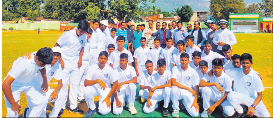
ପ୍ରତିଯୋଗିତାରେ ଭାଗ ନେଇଥିବା ଖେଳାଳି।

ଦେବଗଡ଼ ଜିଲ୍ଲା କ୍ରିକେଟ ସଂଘ ପକ୍ଷରୁ ସ୍ଥାନୀୟ ଭାବରେ ଗଞ୍ଜାମ ସ୍ପୋର୍ଟସ୍ ଗ୍ରାମରେ ଆନୁଷ୍ଠିତ ଆକ୍ଷୟ କୁମାର କ୍ରିକେଟ ଟୁର୍ଣ୍ଣାମେଣ୍ଟ ଉଦ୍ଘାଟିତ ହୋଇଯାଇଛି। ଉଦ୍ଘାଟନା ମ୍ୟାଚ ଦେବଗଡ଼ କେନ୍ଦ୍ରୀୟ ବିଦ୍ୟାଳୟ ଓ ବାରକୋଟ ଆଦର୍ଶ ବିଦ୍ୟାଳୟ ମଧ୍ୟରେ ଆନୁଷ୍ଠିତ ହୋଇଥିଲା।