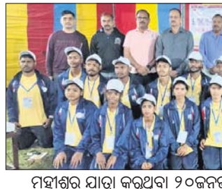
ମହାଶୂର ଯାତ୍ରା କରୁଥିବା ୨୦୭୫ଜନଜାତି ଯୁବତୀଯୁବକ ଓ ଉପସ୍ଥିତ ଅତିଥିଗଣ।

କନ୍ୟାପାଠଶାଳା, ୫୧୨ (ଉତ୍ତମ କୁମାର ଦାଶ) କଳାହାଣ୍ଡି ଜିଲା ଧର୍ମଗଡ଼ ବ୍ଲକ୍ ଗଣିଆପାଟଣା ପଞ୍ଚାୟତରାଜ କଲେଜରେ ଯୋଜନା କରାଯାଇଛି।