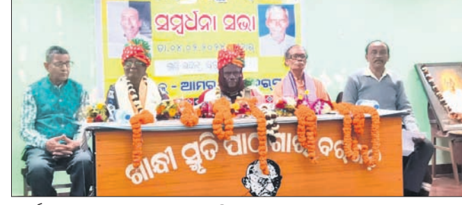
କାର୍ଯ୍ୟକ୍ରମରେ ପଦ୍ମଶ୍ରୀ ମନୋନାତ ପ୍ରତିଭା ଏବଂ ଅନ୍ୟମାନେ ।