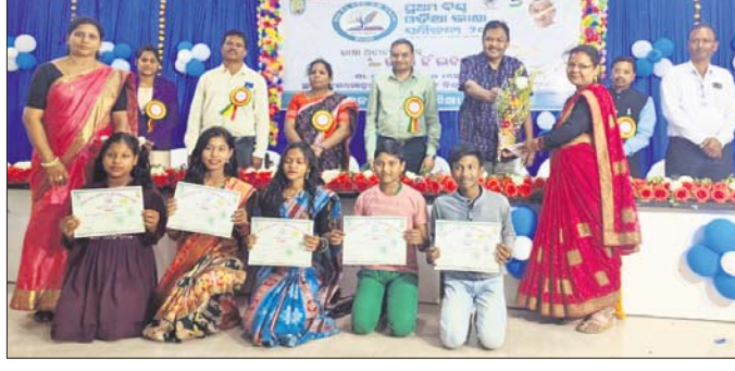
କୃତୀ ପ୍ରତିଯୋଗୀଙ୍କୁ ପୁରସ୍କୃତ କରାଯାଉଛି।

ପ୍ରଥମ ବିଷ୍ଣୁ ଓଡ଼ିଆ ଭାଷା ସମ୍ମିଳନୀ-୨୦୨୪ ଅବସରରେ ସମଗ୍ର ଶିକ୍ଷା, କଳାହାଣ୍ଡି ପକ୍ଷରୁ ଯୋଜନା କରାଯାଇଥିବା ଭାଷା, ସାହିତ୍ୟ ଓ ସୃଜନଶୀଳତା କାର୍ଯ୍ୟକ୍ରମ ଭବାନୀପାଟଣା ବ୍ରଜମୋହନ ସରକାରୀ ଉଚ୍ଚ ବିଦ୍ୟାଳୟରେ ଆୟୋଜିତ ହୋଇଯାଇଛି।