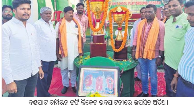
ବନ୍ଦୁପାଟ ଚାମ୍ପିୟନ ଟ୍ରଫି ଜିତିବେ ଉଦ୍‌ଘାଟନରେ ଉପସ୍ଥିତ ଅଟନ୍ତି।

କଳାହାଣ୍ଡି ଜିଲା ଧର୍ମଗଡ଼ ବ୍ଲକ୍ ବେହେରା ହାଇସ୍କୁଲ ପଢ଼ିଆରେ ୨୮ତମ ବନ୍ଦୁପାଟ ଚାମ୍ପିୟନ ଟ୍ରଫି ଜିତିବେ ଉଦ୍‌ଘାଟନ ହୋଇଛି। ଛତିଶଗଡ଼ ଏକାଦଶ ଜିତିବେ କୁଳ ସହିତ ବେହେରା ଜିତିବେ କୁଳ ମଧ୍ୟରେ ଉଦ୍‌ଘାଟନ ମାଧ୍ୟମରେ ବେହେରା ବିଜୟୀ ହୋଇଛି। ବେହେରା ପ୍ରଥମେ ବ୍ୟାଟି କରି ନିର୍ଦ୍ଧାରିତ ୧୫ ଓଭରରେ ୬ ଉଲ୍ଲେଖ ହରାଇ ୧୮୦ ରନ ସଂଗ୍ରହ କରିଥିଲା। ଏକ ପକ୍ଷରୁ ଟେମ୍ପୋ ୩୫ ବଲରେ ୧୦ ଛକା ଓ ୯ ଚୋକା ସହାୟତାରେ ୧୧୨ରନ ସଂଗ୍ରହ କରିଥିଲେ। ଛତିଶଗଡ଼ ନିର୍ଦ୍ଧାରିତ ସାଧନା କାରି ରଖିଛନ୍ତି।