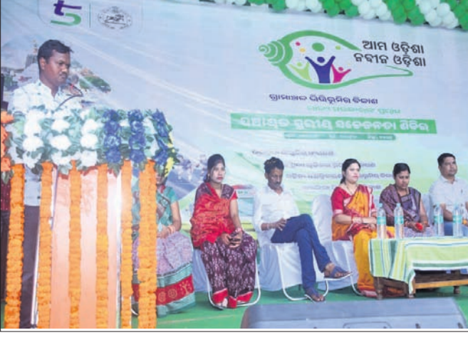
ଶିବିରରେ ମଞ୍ଚାସନ ଅତିଥି, ଜନ ପ୍ରତିନିଧି ଓ ଅଧିକାରୀ ।

ବରଗଡ଼ ଜିଲ୍ଲା ସୋହେଲା ବ୍ଲକ୍ ସଦର ପଞ୍ଚାୟତରେ ଆମ ଓଡ଼ିଶା ନବୀନ ଓଡ଼ିଶା କାର୍ଯ୍ୟକ୍ରମର ଏକ ସଚେତନତା ଶିବିର ଘୋଷଣା କରାଯାଇଛି।