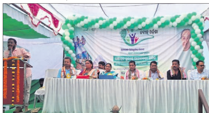
ସଚେତନତା ଶିବିରରେ ମଞ୍ଚାଧୀନ ଅତିଥି