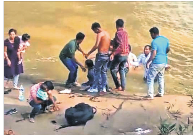
୨ ଯୁବତୀଙ୍କୁ ଉଦ୍ଧାର କରାଯାଇଛି।