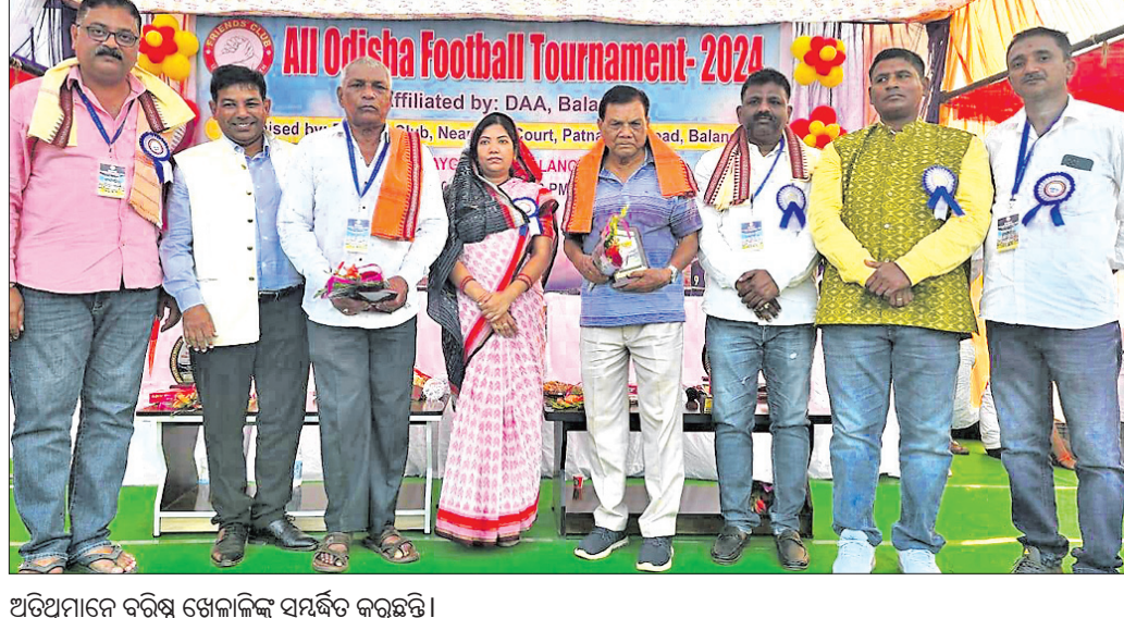
ଅତିଥିମାନେ ବରିଷ୍ଠ ଖେଳାଳିଙ୍କୁ ସମର୍ପିତ କରୁଛନ୍ତି ।