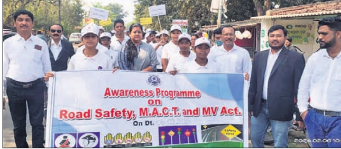
ସଡ଼କ ସୁରକ୍ଷା ସଚେତନତା ଅଭିଯାନ

ଆଇବେଣ୍ଡାୟୋଲ ବୟସ ଅନୁସାରେ ଘରକୁ ଘର ବୁଲି ଲୋକଙ୍କୁ ସେବନ କରାଯିବ। ୨୦୨୩-୨୪ରେ ସର୍ବୋଚ୍ଚ ନର୍ଲ୍ସ କୁଳନାଗତ ଏନସିସିରେ ମଧ୍ୟ କାର୍ଯ୍ୟକ୍ରମ ଅର୍ପିତ, ହାଟ, ସ୍କୁଲ ଅଞ୍ଚଳରେ ବୁଲି ଔଷଧ ସେବନ କରାଯିବ। ସମନ୍ୱୟ ସହଯୋଗରେ କଳାହାଣ୍ଡିକୁ ଫାଇଲେରିଆ ମୁକ୍ତ କରିବାକୁ ଜିଲାପାଳ ଆହ୍ୱାନ ଦେଇଥିଲେ।