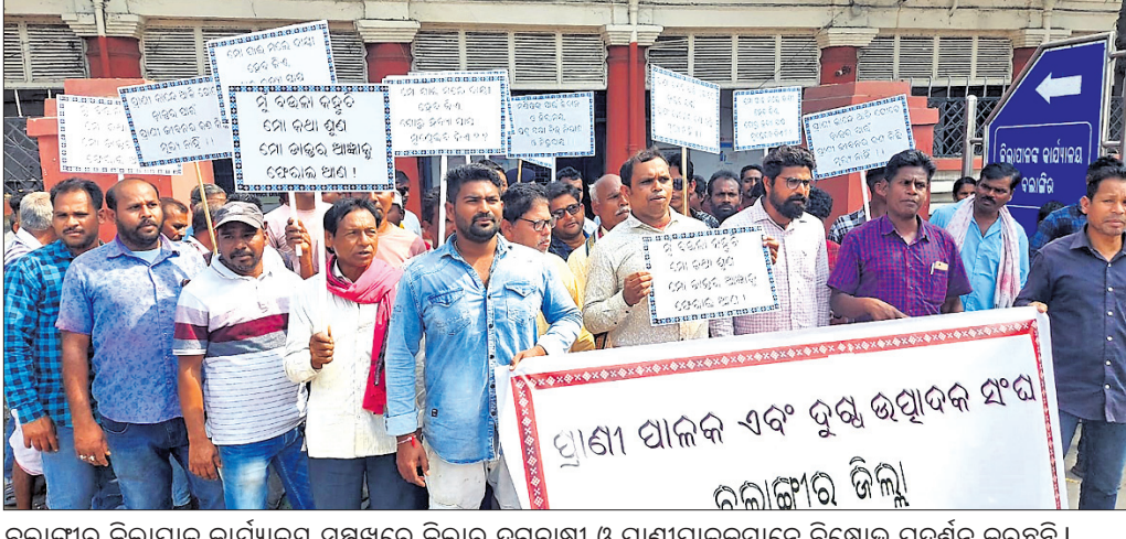
ବଲାଙ୍ଗୀର ଜିଲାପାଳ କାର୍ଯ୍ୟାଳୟ ସମ୍ମୁଖରେ ଜିଲାର ଗୁରୁତାପୀ ଓ ପ୍ରାଣୀପାଳକମାନେ ବିକ୍ଷୋଭ ପ୍ରଦର୍ଶନ କରୁଛନ୍ତି ।

ଓଡ଼ିଶା ପ୍ରାଣୀଧନ ଚିକିତ୍ସା ସେବା ସଂଘ ଆନ୍ଧ୍ରନକ୍ଷତ୍ର ବଲାଙ୍ଗୀର ଜିଲା ପ୍ରାଣୀଧନ ଚିକିତ୍ସକଙ୍କ କାର୍ଯ୍ୟାଳୟ ଆନ୍ଦୋଳନ ମଙ୍ଗଳବାର ୨୦ଦିନରେ ପହଞ୍ଚିଛି । ଚିକିତ୍ସକଙ୍କ ଆନ୍ଦୋଳନ ଯୋଗୁ ଜିଲାରେ ପ୍ରାଣୀ ଚିକିତ୍ସା ସେବା ବ୍ୟାହତ ହୋଇଛି । ବାରମ୍ବାର ଦାବି ସତ୍ତ୍ୱେ କୌଣସି ସୁଫଳ ନ ମିଳିବାରୁ ମଙ୍ଗଳବାର ଜିଲାର ବିଭିନ୍ନ ଅଞ୍ଚଳର ପ୍ରାଣୀପାଳକ ଏବଂ ଗୁରୁ ଉପାଦେୟ ସଂଘ ସଦସ୍ୟ ଜିଲାପାଳ କାର୍ଯ୍ୟାଳୟ ସମ୍ମୁଖରେ ବିକ୍ଷୋଭ ପ୍ରଦର୍ଶନ କରିଥିଲେ । ସମସ୍ୟାର ରୁଚିତ ସମାଧାନ ପାଇଁ ଜିଲାପାଳଙ୍କୁ ଏକ ଦାବିପତ୍ର ପ୍ରଦାନ କରିଥିଲେ ।