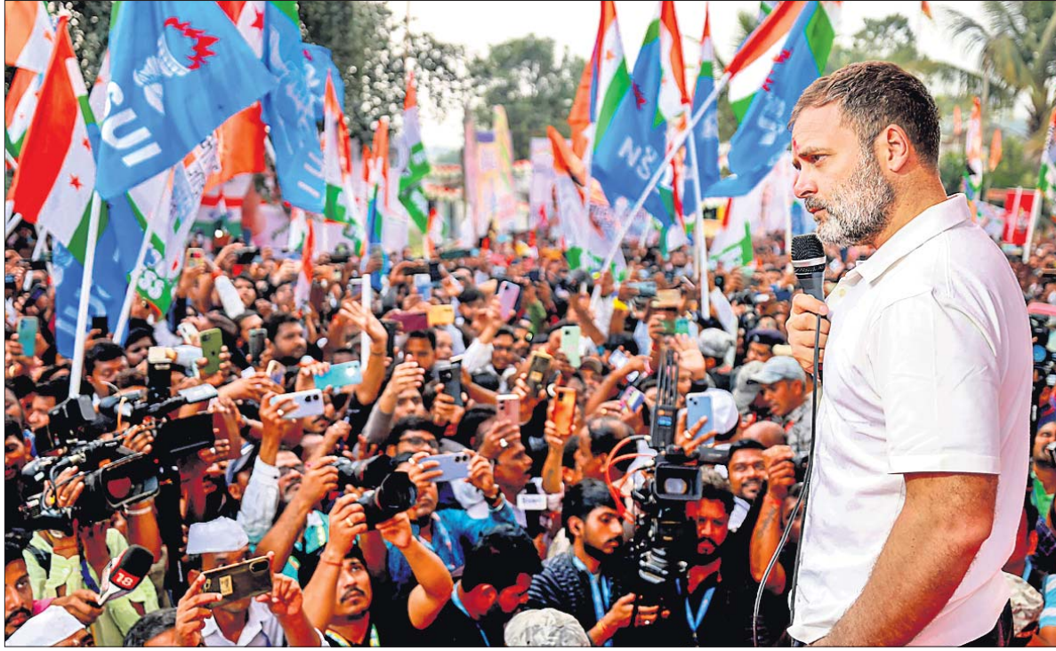
ଝାଡ଼ଖଣ୍ଡ-ଓଡ଼ିଶା ସୀମାନ୍ତ ବାଂଶଯୋର ଫାଟକ ନିକଟରେ ମଙ୍ଗଳବାର ଆୟୋଜିତ ଜନସମାବେଶରେ କଂଗ୍ରେସ ନେତା ରାହୁଲ ଗାନ୍ଧୀ ଉଦ୍‌ଘୋଷଣା ଦେଉଛନ୍ତି।

ଓଡ଼ିଶାରେ ପହଞ୍ଚିଲା କଂଗ୍ରେସର ଭାରତ ଯୋଡ଼ା ନ୍ୟାୟ ଯାତ୍ରା