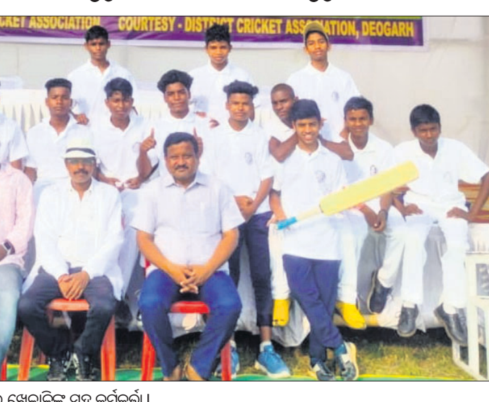
ଆନ୍ଧ୍ର ଜିଲା ସ୍କୁଲ କ୍ରିକେଟ ଚୁନାମେଣ୍ଟରେ ଖେଳାଳିଙ୍କ ସହ କର୍ମକର୍ମୀ।