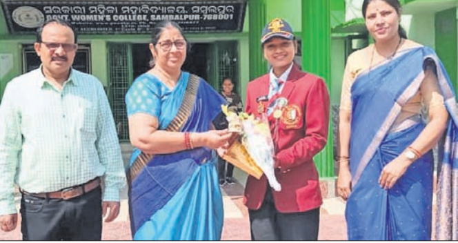
ନିହାରିକାଙ୍କୁ ସମ୍ବର୍ଦ୍ଧିତ କରାଯାଇଛି।