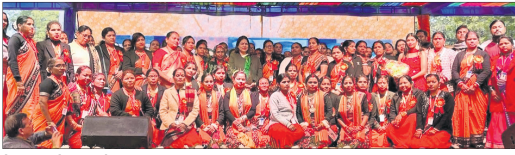
ଦିଲ୍ଲୀରେ ଅନୁଷ୍ଠିତ 'ପୁଷ୍ପପୁନି ଭେଟ୍‌ଘାଟ୍ ଉତ୍ସବ'