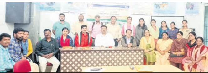
ସ୍ୱାସ୍ଥ୍ୟକର୍ମୀଙ୍କ ପ୍ରଶିକ୍ଷଣ ଶିବିର।