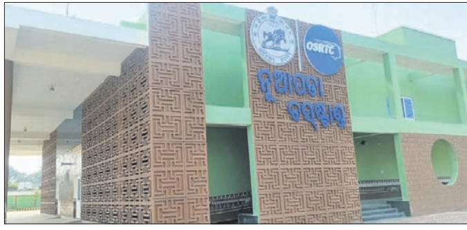
ନିର୍ମାଣ ହୋଇଥିବା ବସଷ୍ଟାଣ୍ଡ

ନୂଆପଡ଼ା ସରକାର ମହକୁମାସ୍ଥିତ ଅତି ପୁରାତନ ବସଷ୍ଟାଣ୍ଡ ଅତ୍ୟାଧୁନିକ ସରକାରୀ ବସଷ୍ଟାଣ୍ଡ ନିର୍ମାଣ କାର୍ଯ୍ୟ ସମ୍ପୂର୍ଣ୍ଣ ହୋଇ ଲୋକାର୍ପଣ ଅପେକ୍ଷାରେ ରହିଛି।