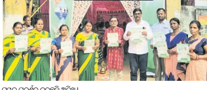
ପୁସ୍ତକ ପ୍ରଦର୍ଶନ କରୁଛନ୍ତି ଅତିଥି।