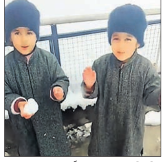
ଏବଂ ଆମର ପ୍ରାର୍ଥନା ଆଲୋଚନା ଶୁଣିଛନ୍ତି। ଭିତରେ ଭଣ୍ଡାରୀ ଯାଆଁଳା ଭଣ୍ଡାରୀ ବରପରେ ଖେଳୁଥିବା ଏବଂ କମ୍ପ୍ୟୁଟରରେ ତୁଷାରପାତ ବିଷୟରେ ମଧ୍ୟ କଥାବାର୍ତ୍ତା କରୁଥିବା ଦେଖିବାକୁ ମିଳିଛି। ସେହିପରି ଫିଟିଆ ମୁକ୍ତମାନେ ଏହି ଭିତରେ ବହୁତ ପୁରୀର ବୋଲି ବର୍ଣ୍ଣନା କରିଥିଲେ।

ଶ୍ରୀମତୀ: କମ୍ପ୍ୟୁଟର ଉପଦେୟ ଏବେ ଆଧୁନିକ ପୁରୀର ଦେଖାଯାଉଛି। ପର୍ଯ୍ୟଟକଙ୍କ ସହ ସ୍ଥାନୀୟ ଲୋକମାନେ ମଧ୍ୟ ତୁଷାରପାତକୁ ଉପଭୋଗ କରୁଛନ୍ତି। ଏହି ସମୟରେ ଜଣେ କମ୍ପ୍ୟୁଟର କୋଡିଙ୍ଗର ଅଞ୍ଚଳର ଯାଆଁଳା ଭଣ୍ଡାରୀ ଉପରେ ଲାଗିଛି। ଏଥିରେ ଜାଣିବା ଏବଂ ଜିନିଷ ନାମକ ହୁଏ ଭଣ୍ଡାରୀ ରିପୋର୍ଟ କରିବାକୁ ଚେଷ୍ଟା କରୁଥିବା ଦେଖାଯାଇଛି। ଜାଣିବା ଏବଂ ଜିନିଷ ନାମକ ଶ୍ରେଣୀରେ ଅଧ୍ୟୟନ କରୁଥିବାବେଳେ ଭଣ୍ଡାରୀଙ୍କର କଥା କହିବା ଶୈଳୀରେ ଲୋକ ଫିରା ହୋଇଯାଉଛି। ଭଣ୍ଡାରୀଙ୍କ ଭିତରେ ଭଣ୍ଡାରୀ ଭଣ୍ଡାରୀ କହୁଛନ୍ତି ଯେ, ତୁଷାରପାତ ଉପଭୋଗ ପାଇଁ ଆମେ ସର୍ବଶକ୍ତିମାନ ଆଲୋଚନା ନିକଟରେ ପ୍ରାର୍ଥନା କରିଥିଲୁ।