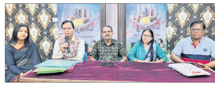
ମହୋତ୍ସବ ସମ୍ପର୍କରେ କର୍ମକର୍ମୀମାନେ ସୂଚନା ଦେଉଛନ୍ତି।

ସମ୍ବଲପୁର ମହୋତ୍ସବ- ୨୦୨୪ ଆସନ୍ତା ୮ରୁ ୧୮ ତାରିଖ ପର୍ଯ୍ୟନ୍ତ ବିର୍ବା ମଇଦାନ (ପିଏଚ୍ଡି ପଡିଆ)ରେ ଅନୁଷ୍ଠିତ ହେବ। ଏଥି ସମାପ୍ତ ପ୍ରସ୍ତୁତି ଶେଷ ପର୍ଯ୍ୟାୟରେ ପହଞ୍ଚିଛି। ମହୋତ୍ସବରେ ରାଜ୍ୟ ତଥା ରାଜ୍ୟ ବାହାରୁ ପ୍ରାୟ ୭୫୫ କଳାକାରଙ୍କ ସମାବେଶ ହେବ। ମଙ୍ଗଳବାର ତଳପିନ ସମ୍ମିଳନୀ କକ୍ଷରେ ମହୋତ୍ସବ ଆୟୋଜକ ସମ୍ବଲପୁର ସାଂସ୍କୃତିକ ପରିଷଦର କର୍ମକର୍ମୀମାନେ ଖବରଦାତା ସମ୍ମିଳନୀରେ ଏ ସମ୍ପର୍କରେ ସୂଚିତ କରିଛନ୍ତି।