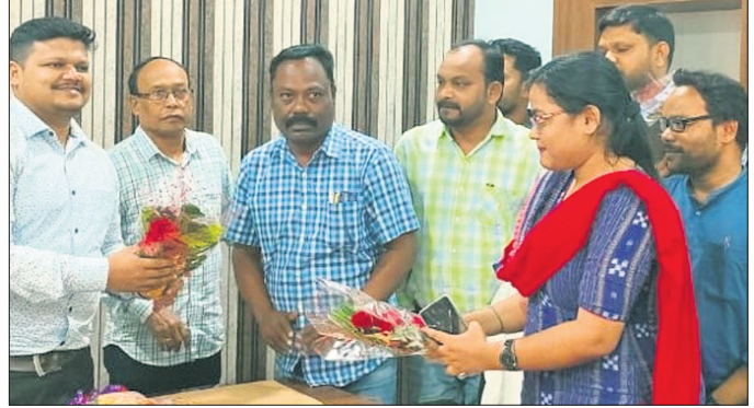
କାର୍ଯ୍ୟରେ ଯୋଗଦେବା ଅବସରରେ ବିଡିଓଙ୍କୁ ଅଧିକାରୀମାନେ ଶୁଭେଚ୍ଛା ଜଣାଉଛନ୍ତି ।