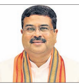
କେନ୍ଦ୍ରମନ୍ତ୍ରୀ ଧର୍ମେନ୍ଦ୍ର ପ୍ରଧାନ