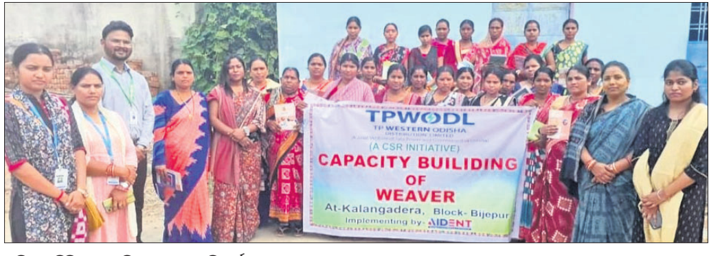
ପ୍ରଶିକ୍ଷଣ ଶିବିରରେ ମହିଳା ବୁଣାକାର ଶିକ୍ଷାର୍ଥୀ।

ବରଗଡ଼ ଜିଲ୍ଲାରେ ଥିବା ବିଭିନ୍ନ ମହିଳା ସ୍ୱୟଂ ସହାୟକ ଗୋଷ୍ଠୀର ବୁଣାକାରମାନଙ୍କ ପାଇଁ ଚିପିଡବ୍ଲ୍ୟୁଓଡିଏଲ୍ ପକ୍ଷରୁ ଏକ ପ୍ରଶିକ୍ଷଣ ଶିବିର ଆୟୋଜିତ ହୋଇଯାଇଛି। କମ୍ପାନୀ ଉଦ୍ୟୋଗୀ ଡାକିବା ପ୍ରକଳ୍ପ ମାଧ୍ୟମରେ ବରଗଡ଼ ଜିଲ୍ଲାର ବିଜେପୁର ଓ ଖାରବନ୍ଧ ବ୍ଲକ୍‌ର ୨୯୨୧ ହିତାଧିକାରୀଙ୍କ ସହ ୮୫ ମହିଳା ସ୍ୱୟଂ ସହାୟକ ଗୋଷ୍ଠୀଙ୍କୁ ସହାୟତା ଯୋଗାଇ ଦେଇଛି। ସେହିପରି ପରେ ଜିଲ୍ଲାର ବରପାଲି ଅଞ୍ଚଳର ସ୍ୱୟଂ ସହାୟକ ଗୋଷ୍ଠୀର ମହିଳା ବୁଣାକାରମାନଙ୍କ ପାଇଁ ଲିମ୍ବା ହସ୍ତତନ୍ତ ଓ ବୟନ ବିଭାଗ ସହଯୋଗରେ ଏକ ୬ ଦିନିଆ ପ୍ରଶିକ୍ଷଣ ଶିବିର ଆୟୋଜିତ ହୋଇଥିଲା। ଏଥିରେ ୮ଟି ସ୍ୱୟଂ ସହାୟକ ଗୋଷ୍ଠୀର ୮୦ଜଣ