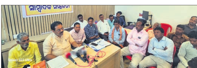
ଖବରଦାତା ସମ୍ମିଳନୀରେ ଆବାହକ ସୂଚନା ଦେଉଛନ୍ତି

ଶ୍ରମିକ ମାରାଣୀନୀତି, ଦାବନ ସମସ୍ୟା, ବ୍ୟୋଧନ ମଦ କୋଠି ଇତ୍ୟାଦି ଦିନକୁ ଦିନ ବୃଦ୍ଧି ପାଇବାରେ ଲାଗିଛି। ଜିଲା ପ୍ରଶାସନରେ ବାରମ୍ବାର ଜଣାଇଲେ ମଧ୍ୟ କୌଣସି ସୁଧର ମିଳନାହିଁ। ଏହାର ପ୍ରତିବାଦରେ ଆସନ୍ତା ଫେବୃଆରୀ ୧୨ରେ ଜିଲା ଶ୍ରମିକ ମହାସଂଘ ପକ୍ଷରୁ ୮ ଘଣ୍ଟିଆ ନୂଆପଡ଼ା ଜିଲା ବନ୍ଦ ଡାକରା ଦିଆଯାଇଛି। ଏ ନେଇ ନୂଆପଡ଼ା ଜିଲା ଶ୍ରମିକ ମହାସଂଘ ପକ୍ଷରୁ ଏରିଗେସନ ଛକ କାର୍ଯ୍ୟାଳୟରେ ଖବରଦାତା ସମ୍ମିଳନୀରେ ଆବାହକ ସୂଚନା ଦେଉଛନ୍ତି।