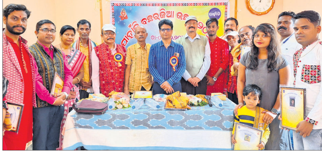
ପ୍ରତିଭା ସମ୍ମାନ କାର୍ଯ୍ୟକ୍ରମରେ ଅତିଥିଙ୍କ ସହ ଅନ୍ୟମାନେ।

ଓଡ଼ିଶାର ଭିତ୍ତିଭୂମି ବିକାଶରେ ଏମ୍‌ସିଏଲ୍‌ର ଯୋଗଦାନ ସମ୍ବଲପୁର, ୬/୨ (ବି.ଶିଳ୍ପର) ମହାନଦୀ କୋଇଲା କୋଇଲା କମ୍ପାନୀ (ଏମ୍‌ସିଏଲ୍) ସମ୍ବଲପୁର କର୍ପୋରେଟ୍ ଅଫିସ୍ ବ୍ୟତୀତ ଅନୁଗୋଳ, ଖାରସିଂହପୁର ଓ ସୁନ୍ଦରଗଡ଼ ଜିଲ୍ଲାରେ ବ୍ୟାପକ ଭାବେ କୋଇଲା ଖନନ କରୁଛି। ସମ୍ପ୍ରତି ସାରା ଦେଶରେ ବିଦ୍ୟୁତ୍ ରାହିତ ବୃଦ୍ଧି ହେବୁ କୋଇଲା ଉତ୍ପାଦନ ବୃଦ୍ଧି ଅନିବାର୍ଯ୍ୟ ହୋଇପାରିଛି। ଏମ୍‌ସିଏଲ୍ ଗାହକୀ ବୃଦ୍ଧି କରିବା ନେଇ ଗୁରୁତ୍ୱପୂର୍ଣ୍ଣ ଭାବେ କରାଯାଉଛି। ଏମ୍‌ସିଏଲ୍ ପୂର୍ବେ ଏମ୍‌ସିଏଲ୍‌ର କୋଇଲା ଉତ୍ପାଦନ ୧୪୮ ମିଲିୟନ ଟନ ଥିବାବେଳେ ଚଳିତ ଆର୍ଥିକ ବର୍ଷରେ ୨୦୦ ମିଲିୟନ ଟନରୁ ଅଧିକ ହୋଇଛି। ମୁଖ୍ୟତଃ ଖୋଲାପୁର୍ଣ୍ଣ ଖଣି ଯୋଗୁ ଏହି ଉତ୍ପାଦନ ବୃଦ୍ଧି ସମ୍ଭବ ହୋଇଛି। ସେହିପରି ସିଏସ୍‌ଆର୍ ଜରିଆରେ କମ୍ପାନୀ ଜନହಿತକର କାର୍ଯ୍ୟ ସହ ପ୍ରଦୃଷ୍ଟି ନିୟନ୍ତ୍ରଣ, ଜଳ ସଂରକ୍ଷଣ ପ୍ରତି ଗୁରୁତ୍ୱ ଦେଇଆସିଛି। କମି ହରାଇଥିବା ବ୍ୟକ୍ତିଙ୍କ ସମେତ ଖଣି ଅଞ୍ଚଳର ପାରିବାହିକ ଉନ୍ନତି କରୁଛି। କମ୍ପାନୀ ରାଜ୍ୟର ଚିକିତ୍ସା କେନ୍ଦ୍ର ଭିତ୍ତିଭୂମି ବିକାଶ ସହ ବିଭିନ୍ନ ସ୍ଥାନରେ ସ୍ୱାସ୍ଥ୍ୟ ଶିବିର ଆୟୋଜନ, ସ୍ଥାନୀୟ ସରକାରୀ ସ୍ୱାସ୍ଥ୍ୟ କେନ୍ଦ୍ରକୁ ଆବଶ୍ୟକ ସାମଗ୍ରୀ ଉପକରଣ ପ୍ରଦାନ ସହ ୧୬ କୋଟି ବିନିଯୋଗ ୩୦ଟି କାବନ ରକ୍ଷାକାରୀ ଆୟୁର୍ଲାଭ ଯୋଗାଇଛି। ବିଭିନ୍ନ ଉଚ୍ଚ ବିଦ୍ୟାଳୟର ଉପାଧ୍ୟକ୍ଷ ପାଇଁ ୩୩ କୋଟି ଟଙ୍କା ପ୍ରଦାନ କରିଛି। ୩୮ କୋଟି ଟଙ୍କା ବ୍ୟୟରେ କମ୍ପାନୀ ରାୟଗଡ଼ା, ନୂଆପଡ଼ା, ବଲାଙ୍ଗୀର ଓ କନ୍ଧମାଳ ଜିଲ୍ଲାରେ ବିଭିନ୍ନ ବିକାଶମୁଳକ ପ୍ରକଳ୍ପ ହାତକୁ ନେଇଛି। ସେହିପରି ୩୫ କୋଟି ଟଙ୍କା ବ୍ୟୟରେ ସମ୍ବଲପୁର ଓ ଯାଜପୁର ଜିଲ୍ଲାରେ ଷ୍ଟାଡ଼ିୟମ ନିର୍ମାଣ କାର୍ଯ୍ୟ ଶେଷ ହୋଇଛି। ଓଡ଼ିଶା ରାଜ୍ୟର ଜନସାଧାରଣଙ୍କ ସହ କମ୍ପାନୀ ଜଡ଼ିତ ଅଛି ବୋଲି ଏମ୍‌ସିଏଲ୍ ଜନସମ୍ପର୍କ ବିଭାଗ ପକ୍ଷରୁ ସୂଚିତ କରାଯାଇଛି।