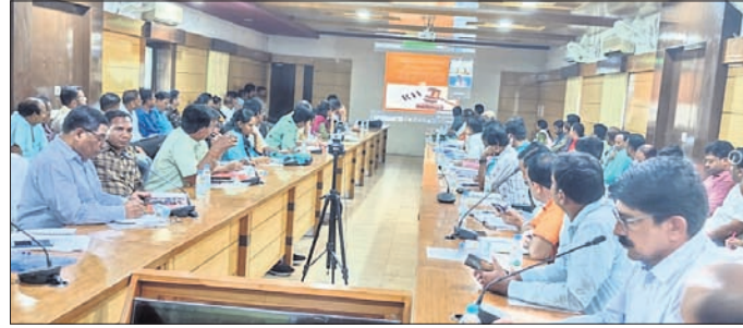
ଜନ ସୂଚନା ଅଧିକାର ନିୟମ ସମ୍ପର୍କିତ କର୍ମଶାଳା