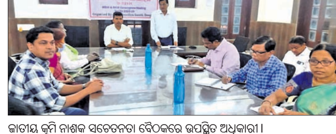
ଜାତୀୟ କୃମି ନାଶକ ସଚେତନତା ବୈଠକରେ ଉପସ୍ଥିତ ଅଧିକାରୀ।