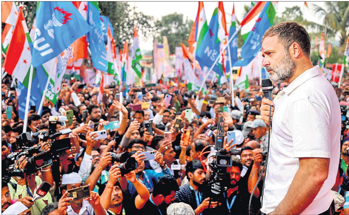
ଝାଡ଼ଖଣ୍ଡ-ଓଡ଼ିଶା ସୀମାନ୍ତ ବାଂଶଯୋର ପୀଠକ ନିକଟରେ ମଙ୍ଗଳବାର ଆୟୋଜିତ ଜନସମାବେଶରେ କଂଗ୍ରେସ ନେତା ରାହୁଲ ଗାନ୍ଧୀ ଉଦ୍‌ଘୋଷଣା ଦେଉଛନ୍ତି।

ଓଡ଼ିଶାରେ ପହଞ୍ଚିଲା କଂଗ୍ରେସର ଭାରତ ଯୋଡ଼ା ନ୍ୟାୟ ଯାତ୍ରା