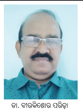
ଡା. ବାବୁଶାହୁର ପରିଡ଼ା

କରିବାକୁ ମିଶ୍ରିତ ମାଛଚାଷ କୁହାଯାଏ। ସେହିପରି ସବୁଜ ଗୋଷାଦ୍ୟ ଫସଲ ମିଶ୍ରିତ ଚାଷ ହିସାବରେ ସକର ହାତୀଆ ଘାସ ସହ ବରଗୁଡ଼ି, ଓସ, ବରସମ୍ ଆଦି ରତ୍ନ ଅନୁଯାୟୀ ଚାଷ କରାଯାଇଥାଏ। ମକା, ଏସ୍ପି ଚେରା, ବାଜରା ବରଗୁଡ଼ି ଆଦି ମିଶ୍ରିତ ଚାଷ ଭାବରେ ଗ୍ରହଣ କରାଯାଇଥାଏ। ପ୍ରତି ୩ ଧାଡ଼ି ମକା, ଏସ୍ପି ଚେରା ବା ବାଜରା ଲଗାଇବା ପରେ ଧାଡ଼ିଏ ଲେଖାଏଁ ବରଗୁଡ଼ି ମିଶ୍ରିତ ଚାଷଭାବେ ଲଗାଯାଇଥାଏ। ସେହିପରି ଛଟା ବୁଣାରେ ୩:୧ ଅନୁପାତରେ ଉପରେଲ୍ ମିଶ୍ରିତ ଚାଷ କରାଯାଇପାରିବ। ପ୍ରାଣୀ ପାଳନରେ ମିଶ୍ରିତ ଚାଷ ଭାବରେ ଗୋପାଳନ ସହ ମେଣ୍ଡା ପାଳନ ସହଜରେ କରାଯାଇ ପାରିବ। କୁକୁଡ଼ା ପାଳନ ସହ ବତକ ପାଳନ କରିବା ଅନୁଚିତ। କାରଣ ବତକ ବାଡ଼ି ମୁରେ ବାହକ ସାଜିଥାନ୍ତି। ସେହିଭଳି ମାଂସକ କୁକୁଡ଼ା ସହିତ ଅଣ୍ଡାଦିଆ କୁକୁଡ଼ା ପାଳନ କରିବା ଅନୁଚିତ।