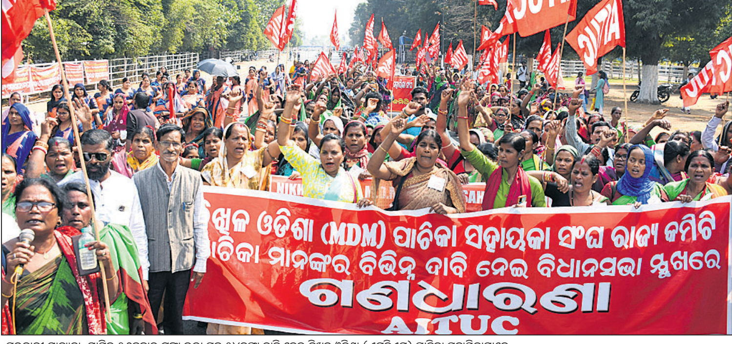
ସରକାରୀ ମାନ୍ୟତା, ମାସିକ ୨୬ହଜାର ଟଙ୍କା ଭରା ସହ ୧୪ପଦା ଦାବି ନେଇ ନିଶ୍ଚଳ ଓଡ଼ିଶା (ଏନଡିଏନ) ପାର୍ଟିକା ସହାୟକାମାନେ ମଙ୍ଗଳବାର ଭୁବନେଶ୍ୱର ଲୋକ ସଭା ପରିଷଦରେ ଧାରଣା ଦେବା ସହ ବିକ୍ଷୋଭ କରୁଛନ୍ତି।