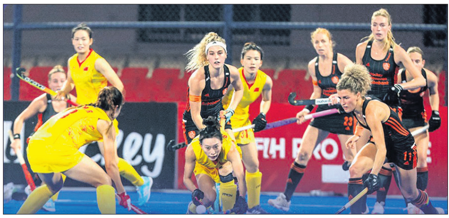
ନେଦରଲାଣ୍ଡ ଓ ଚାଇନା ମଧ୍ୟରେ ଅନୁଷ୍ଠିତ ମ୍ୟାଚ।

ଆରମ୍ଭ କରିଥିବା ନେଦରଲାଣ୍ଡ ପରବର୍ତ୍ତୀ ମ୍ୟାଚରେ ଘରୋଇ ଭାବେ ୩-୧ ଗୋଲରେ ପରାସ୍ତ କରିଥିଲା। ଅନ୍ୟପକ୍ଷରେ କ୍ରମାଗତ ୨ଟି ମ୍ୟାଚ ଜିତିବା ପରେ ଚାଇନା ବିଜୟ ଧାରାରେ ବ୍ରେକ୍ ଲାଗିଛି। ଏହି ଦଳ ନିଜ ପ୍ରଥମ ୨ଟି ମ୍ୟାଚରେ ଭାରତକୁ ୨-୧ ଓ ଅଷ୍ଟ୍ରେଲିଆକୁ ୩-୦ରେ ହରାଇଥିଲା। ନେଦରଲାଣ୍ଡ ଚଳିତ ସିଜନରେ ଏପର୍ଯ୍ୟନ୍ତ ୬