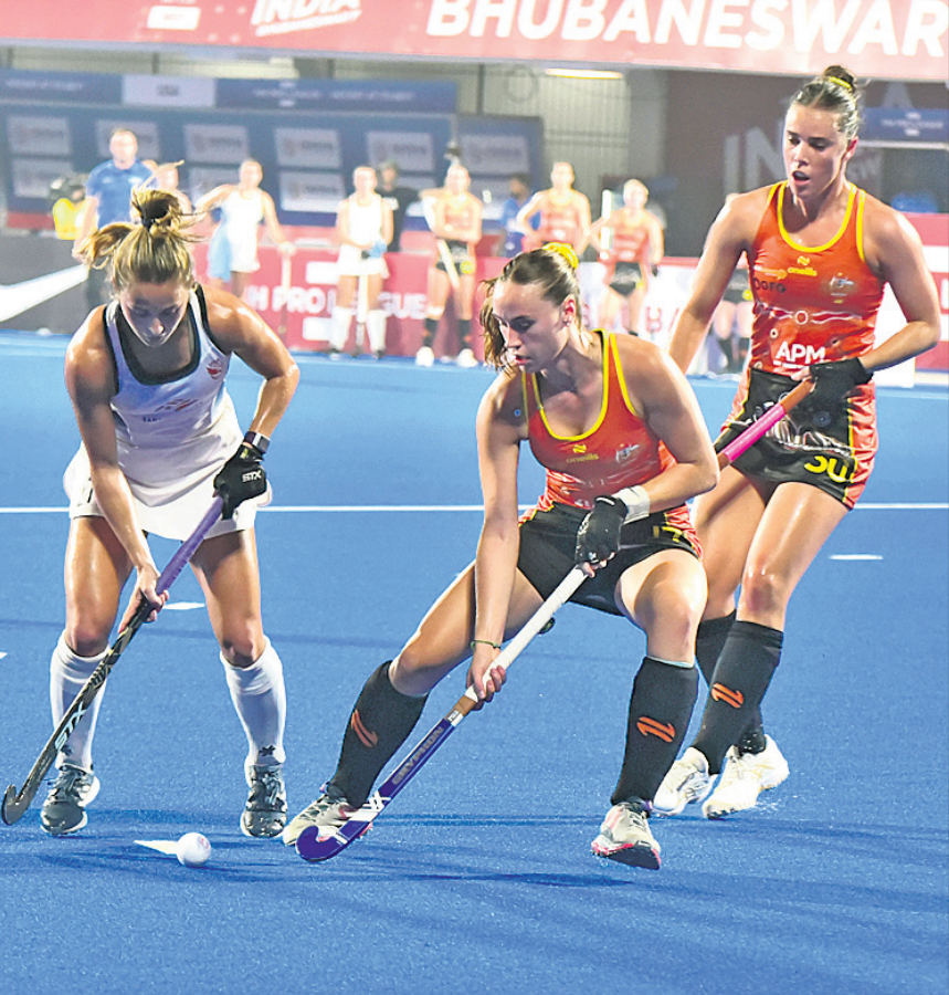
ଅଷ୍ଟ୍ରେଲିଆ-ଆମେରିକା ମ୍ୟାଚର ଏକ ସଂଘର୍ଷପୂର୍ଣ୍ଣ ମୁହୂର୍ତ୍ତ

ଆସିଥିଲେ। ଅଗ୍ରଣୀ ନେଦରଲାଣ୍ଡ ନେଦରଲାଣ୍ଡ ବେଶି ସମୟ ନେଇ ନ ଥିଲା। ୨୫ତମ ମିନିଟରେ ଆଉ ଏକ ଫିଲ୍ଡ ଗୋଲ ମାଧ୍ୟମରେ ଭିନ୍ନ ମାର୍କିନ ଦଳକୁ ୨-୧ରେ ଅଗ୍ରଣୀ କରିଥିଲେ। ଅଣଖେଳୁଆଡ଼ ପ୍ରଦର୍ଶନ ପାଇଁ ୨୬ତମ ମିନିଟରେ ଚାଇନାର ମା ନିଜକୁ ଗ୍ରାନ୍ଦ କାଟି ମିଳିଥିଲା। ତୃତୀୟ କ୍ୱାର୍ଟରରେ ଗୋଲ ପରିଶୋଧ ପାଇଁ ଚାଇନା ଉଦ୍ୟମରେ ଥିବାବେଳେ