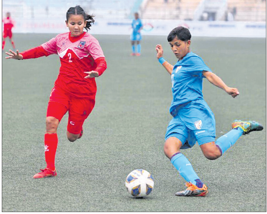
ଭାରତ-ନେପାଳ ମ୍ୟାଚରେ ବଲ୍କୁ ନିୟନ୍ତ୍ରଣ କରିବା ପାଇଁ ଦୁଇ ଖେଳାଳିଙ୍କ ମଧ୍ୟରେ ସଂଘର୍ଷ।