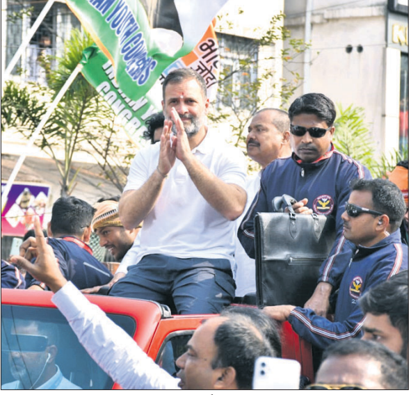
ଉଦ୍‌ଘୋଷଣାରେ ଭୁବନେଶ୍ୱର ପର୍ଯ୍ୟନ୍ତ ରାହୁଲ ଗାନ୍ଧୀଙ୍କ ରୋଡ୍ ଶୋ। ଚଳାଇଛନ୍ତି। ଏହାର ସମସ୍ତ ଦୁର୍ଗତ୍ୟ ୩୦ ଲକ୍ଷରୁ ଉର୍ଦ୍ଧ୍ୱ ବେକାର ମୁକ୍ତ ପାଇଁ ମେଣ୍ଟରେ ଦେଖାଯାଇଛି। ମୁକ୍ତ ଦାବନ ଖଟିବାକୁ ଅନ୍ୟ ଖଣିଆଦାନପୂର୍ଣ୍ଣ ଓଡ଼ିଶା ପ୍ରଦେଶରେ ରାଜ୍ୟକୁ ଯାଉଛନ୍ତି। ଫୁଲ୍-୧