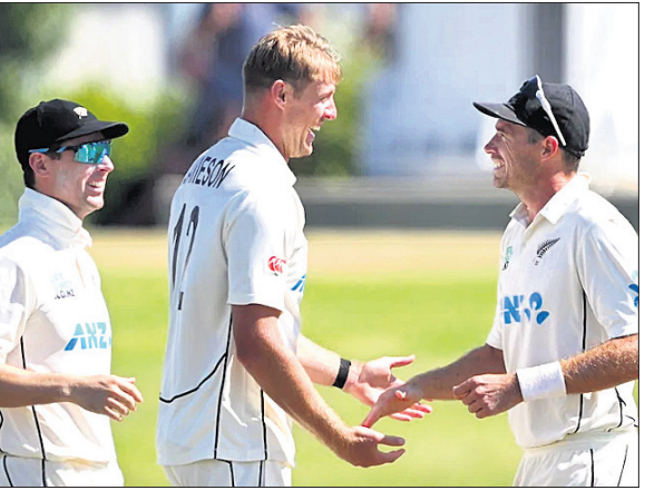
ଉଇକେଟ ନେବାପରେ କାଇଲ ଜେମିସନ୍ଙ୍କ ବଧେଇ ।