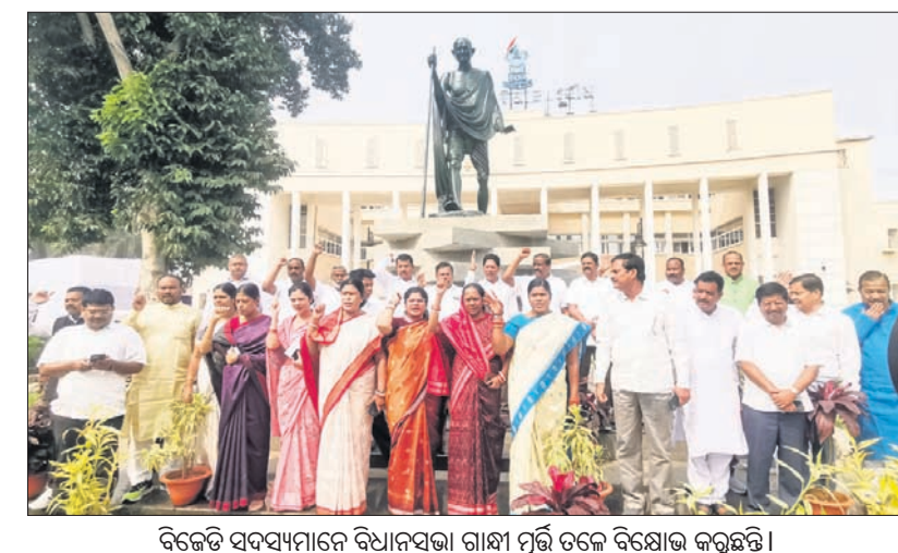
ବିଜେଡି ସଦସ୍ୟମାନେ ବିଧାନସଭା ଗାନ୍ଧୀ ମୂର୍ତ୍ତି ତଳେ ବିସୋଧ କରୁଛନ୍ତି।

ବିଧାନସଭାରେ ପ୍ରବଳ ହୋଇଛି। ବିଜେଡି ସଦସ୍ୟମାନେ ମଧ୍ୟ ପରା ପ୍ରସଙ୍ଗରେ ଭାଜପା କ୍ଷମାପ୍ରାର୍ଥନା କରୁ ବାଦି କରି ନିକ ସିଂ ନିକଟରେ ଛିଡ଼ା ହୋଇ ପାଟିପୁଡ଼ି କରିଥିଲେ। ଭାଜପା ସଦସ୍ୟମାନେ ଜୟ ଶ୍ରୀରାମ କହୁଥିବା ବିଜେଡି ସଦସ୍ୟମାନେ ଜୟ ଜଗନ୍ନାଥ ଘୋରାନ ଦେଉଥିଲେ। ଗୃହ ଏକପ୍ରକାର ରଣକ୍ଷେତ୍ର ପାଲଟିଥିଲା। ପରିସ୍ଥିତି ନିୟନ୍ତ୍ରଣ ବାହାରକୁ ଯାଉଥିବା ଦେଖି ବାରସ୍ଥିତି ମାତ୍ର ଅଧିନିତ ପରେ ଗୃହ କାର୍ଯ୍ୟକୁ ପର୍ଯ୍ୟନ୍ତ ୧୧ଟା ୩୦ ମିନିଟ ପର୍ଯ୍ୟନ୍ତ ମୁଲତବୀ ଘୋଷଣା କରିଥିଲେ। ଏହି ସମୟରେ ବିଜେଡି ସଦସ୍ୟମାନେ ବିଧାନସଭା ବାହାରେ ଥିବା ଗାନ୍ଧୀ ମୂର୍ତ୍ତି ନିକଟରେ ଧାରଣା ଦେଇଥିଲେ। ପରା ହତ୍ୟା ଘଟଣାକୁ ନେଇ ଭାଜପା ନେତାମାନେ ରାଜନୀତି କରିବା ସହ ତଦନ୍ତକୁ ବାରବଣା କରିବାକୁ ଚେଷ୍ଟା କରିଛନ୍ତି। ପରା ହତ୍ୟାକାରୀଙ୍କୁ ପୁରଣା ଦେବାକୁ ଉଦ୍ୟମ କରିଥିବା ଭାଜପା ନେତାମାନେ କ୍ଷମା ମାଗୁ ବୋଲି ଦାବି କରିଥିଲେ। ପୂର୍ବାହ୍ନ ୧୧ଟା ୩୦ ମିନିଟରେ ଗୃହ କାର୍ଯ୍ୟ ଆରମ୍ଭ ହୋଇଥିଲେ ମଧ୍ୟ ଭାଜପା ସଦସ୍ୟମାନେ ପୂର୍ବରୁ ହକ୍ ଗୋଳ କରୁଥିଲେ। ବାରସ୍ଥିତି ଗୃହକୁ ୨ଟି ପର୍ଯ୍ୟାୟରେ ଅପରାହ୍ଣ ୪ଟା ପର୍ଯ୍ୟନ୍ତ ମୁଲତବୀ ଘୋଷଣା କରିଥିଲେ। ଅପରାହ୍ଣରେ ମଧ୍ୟ ଗୃହକାର୍ଯ୍ୟ ସ୍ଵାଭାବିକ ହୋଇପାରି ନ ଥିଲା। ସମାନ ଅବସ୍ଥା ଦେଖିବାକୁ ମିଳୁଥିଲା। ଭାଜପା ସଦସ୍ୟମାନେ ହାତରେ ପ୍ୟୁକାଟି ଧରି ଜୋରଦାର ପ୍ରତିବାଦ କରିଥିଲେ। ଅର୍ପଣ ଚାଉଳକୁ ନେଇ ଭାଜପା ଓ ବିଜେଡି ସଦସ୍ୟଙ୍କ ମଧ୍ୟରେ ଆରୋପ ହେବାକୁ ଅପରାହ୍ଣରେ ଭାଜପା ସଦସ୍ୟମାନେ