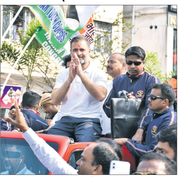
ଉଦ୍‌ବୋଧନ ଶକ୍ତିକୁ ପାନପୋଷ ପର୍ଯ୍ୟନ୍ତ ରାହୁଲ ଗାନ୍ଧୀଙ୍କ ରୋଡ୍ ଶୋ। ଚଳାଇଛନ୍ତି। ଏହାର ସମସ୍ତ ଦୁଶ୍ୱାର ପାଇଁମେଣ୍ଡରେ ଦେଖାଯାଉଛି। ୩୦ ଲକ୍ଷରୁ ଉର୍ଦ୍ଧ୍ୱ ବେକାର ମୁକ୍ତ ମୁକ୍ତ ଦାବୀ ଖଟିବାକୁ ଅନ୍ୟ ରାଜ୍ୟକୁ ଯାଉଛନ୍ତି। ପୃଷ୍ଠା-୭