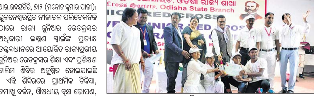
ପୁରସ୍କୃତ ଛାତ୍ରମାନଙ୍କର ସମାବେଶ

କହିଛନ୍ତି ଯେ, କେହି ଦୁର୍ଭିକ୍ଷ ବାରମ୍ବାର ପାଇବାର କେନ୍ଦ୍ରୀୟ କାର୍ଯ୍ୟକ୍ରମରେ ଯୋଗଦାନ କରୁଥିବା ଛାତ୍ରମାନଙ୍କର ସମାବେଶ ଯାଚାଯାଉଛି। ଏହା ପରେ ପ୍ରତିଯୋଗିତା ଆରମ୍ଭ ହେଉଛି। ଏହା ପରେ ପ୍ରତିଯୋଗିତା ଆରମ୍ଭ ହେଉଛି।