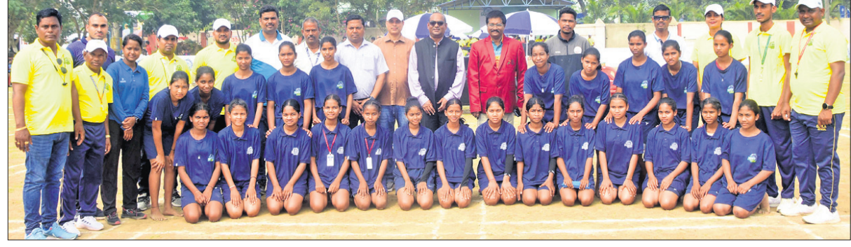
ପୁରୀରେ ରୁଧିର ଆରମ୍ଭ ହୋଇଛି। ରାଜ୍ୟ ଜ୍ୟୋତ୍ସ୍ନା କୋର୍ ଗ୍ରାମୀଣ ପ୍ରତିଯୋଗିତା ଆରମ୍ଭ ହୋଇଛି।

ନୂଆ ଓ କାର୍ଯ୍ୟକ୍ରମ ମାଧ୍ୟମରେ ରାଜ୍ୟର ୩୧୪ ବ୍ଲକ୍ରେ ଖୋଖୋ ପ୍ରତିଯୋଗିତା ଅନୁଷ୍ଠିତ ହୋଇ ଶ୍ରେଷ୍ଠ ଖେଳାଳିଙ୍କୁ ନେଇ ଜିଲାସ୍ତରୀୟ ପ୍ରତିଯୋଗିତା ହୋଇଥିଲା।