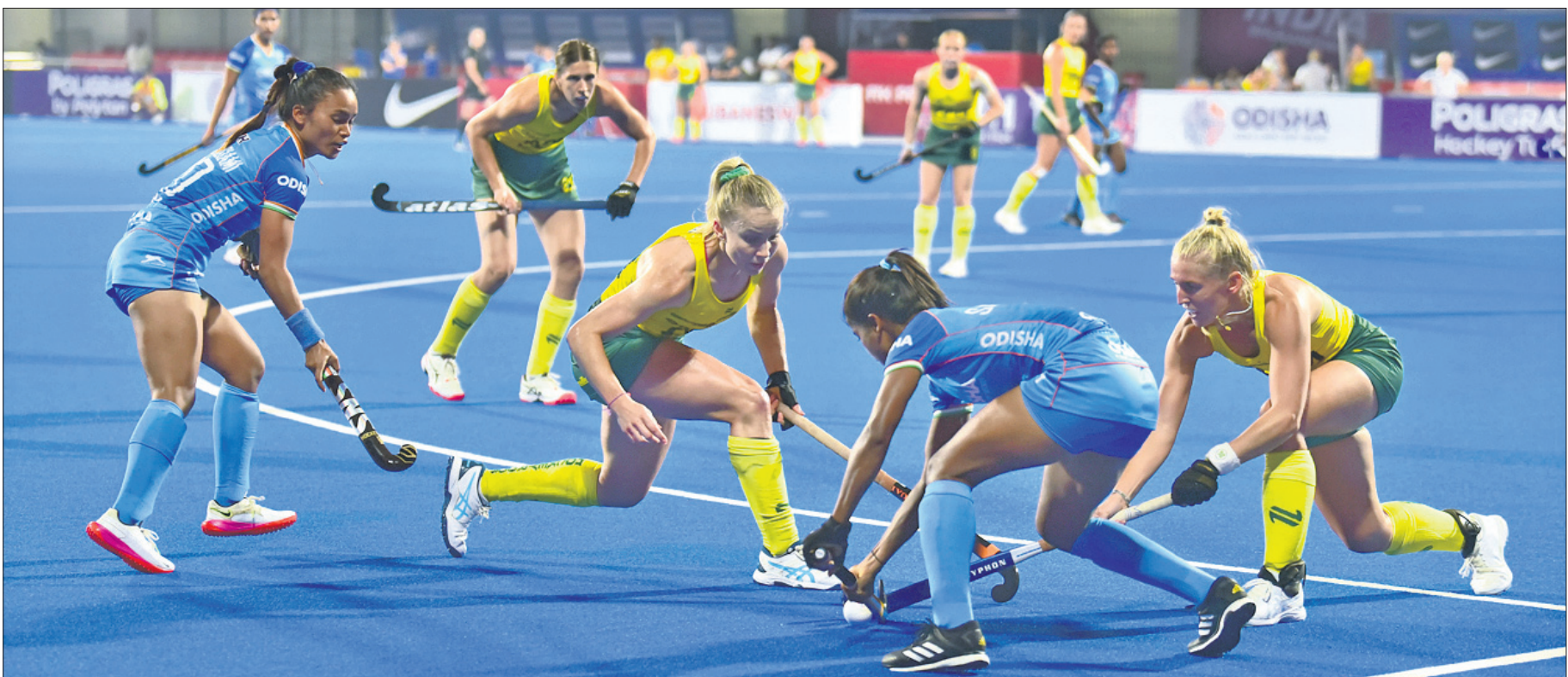
କଳିଙ୍ଗ ଷ୍ଟାଡିୟମରେ ଚାଲିଥିବା ଏଏଆଇଏଏ ମହିଳା ହକି ପ୍ରୋ ଲିଗ୍ରେ ଭୁବନେଶ୍ୱରର ଅନୁଷ୍ଠିତ ଭାରତ-ଅଷ୍ଟ୍ରେଲିଆ ମ୍ୟାଚର ଏକ ସଂଘର୍ଷପୂର୍ଣ୍ଣ ମୁହୂର୍ତ୍ତ।

ଫେଲୋରୀ, ୨୦୨୨ (ପି.ଟି.) ଭାରତୀୟ କ୍ରିକେଟ ଦଳର ଷ୍ଟାର ଭଲକେଟକିପର ରିଷଭ ପନ୍ଥ ଆସନ୍ତା ଆଇପିଏଲ୍ରେ ପ୍ରତ୍ୟାବର୍ତ୍ତନ କରିବେ।