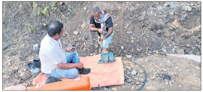
କେନ୍ଦ୍ରୀୟ କାର୍ଯ୍ୟକ୍ରମରେ ଯୋଗଦାନ କରୁଥିବା ଛାତ୍ରମାନଙ୍କର ସମାବେଶ

ଦାରିଙ୍ଗବାଡ଼ି/ବ୍ରାହ୍ମଣୀଗାଁ, ୭୧୨ (ଅଭୁତ ସାହୁ/ ମନୋରଞ୍ଜନ ରଣା)