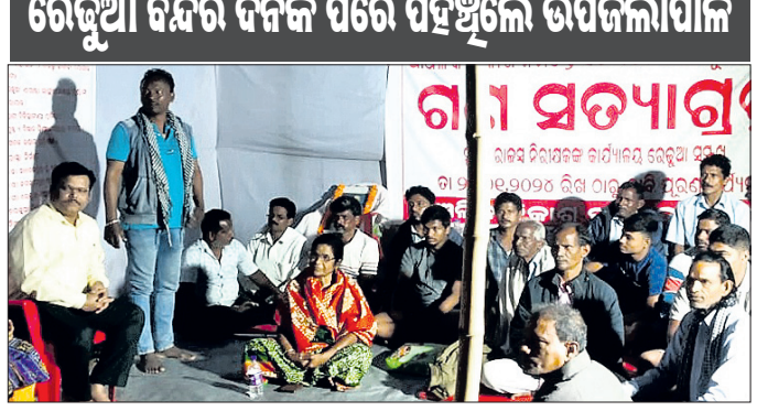
ସତ୍ୟାଗ୍ରହୀଙ୍କ ସହ ଉପରୋକ୍ତ ଆଲୋଚନା କରୁଛନ୍ତି ।