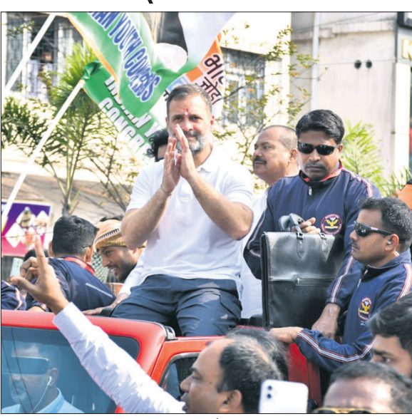
ଭୁବନେଶ୍ୱର ଯାତ୍ରାରେ ପାର୍ଟିନରଶିପ୍ ପର୍ଯ୍ୟନ୍ତ ରାଜୁ ଗାନ୍ଧୀଙ୍କ ରୋଡ୍ ଶୋ। ଚଳାଇଛନ୍ତି। ଏହାର ସମସ୍ତ ଦୁଶ୍ୱାର ପାଇଁ ମେଣ୍ଟରେ ଦେଖାଯାଉଛି। ୩୦ ଲକ୍ଷରୁ ଉର୍ଦ୍ଧ୍ୱ ବେକାର ମୁକ୍ତ ମୁକ୍ତ ଦାବୀ ଖଟିବାକୁ ଅନ୍ୟ ରାଜ୍ୟକୁ ଯାଉଛନ୍ତି। ଫୁଲ୍-୧

ଭୁବନେଶ୍ୱର, ୭/୨ (ଅନିଲ ଦାସ) ଦେଶରେ ଆରାଜକତା ଓ ଦୁଶ୍ୱାର ରାଜନୀତି ଚାଲିଛି। ଏହା ବିରୋଧରେ ଗତବର୍ଷ କମ୍ପ୍ୟୁଟର କମ୍ୟୁନିଟି ପର୍ଯ୍ୟନ୍ତ ଭାରତ ଯୋଡ଼ା ଯାତ୍ରା କରାଯାଇଥିଲା। ଏବର୍ଷ ଦେଶରେ ଶାନ୍ତି ଓ ନ୍ୟାୟ ପାଇଁ ମଣିପୁରରୁ ମହାରାଷ୍ଟ୍ର ଭାରତ ଯୋଡ଼ା ନ୍ୟାୟ ଯାତ୍ରା କରାଯାଇଛି। ଦେଶରେ ଭାଜପା ଓ ଆର୍କଏସ୍‌ଏସ୍ ଦ୍ୱାରା ସୃଷ୍ଟି କରୁଛନ୍ତି କିନ୍ତୁ ଆମେ 'ଦୁଶ୍ୱାର ବଜାରରେ ଭଲପାଇବାର ଦୋକାନ' ଖୋଲିବୁ। ଭୁବନେଶ୍ୱର ଓଡ଼ିଶା ଗସ୍ତର ଦ୍ୱିତୀୟ ଦିବସରେ ରାଉରକେଲାଠାରେ ଆୟୋଜିତ ରୋଡ୍ ଶୋରେ ଉଦ୍‌ଘାଟନା କରା ଯାଇଛି। ଏହା ପରେ ନେତା ରାଜୁ ଗାନ୍ଧୀ ଏହା କହିଛନ୍ତି। ସେ କହିଛନ୍ତି, ଏହି ପ୍ରଦେଶରେ ଭାଜପା ଓ ବିଜେଡି ପାର୍ଟିନରଶିପ୍ରେ ସରକାର