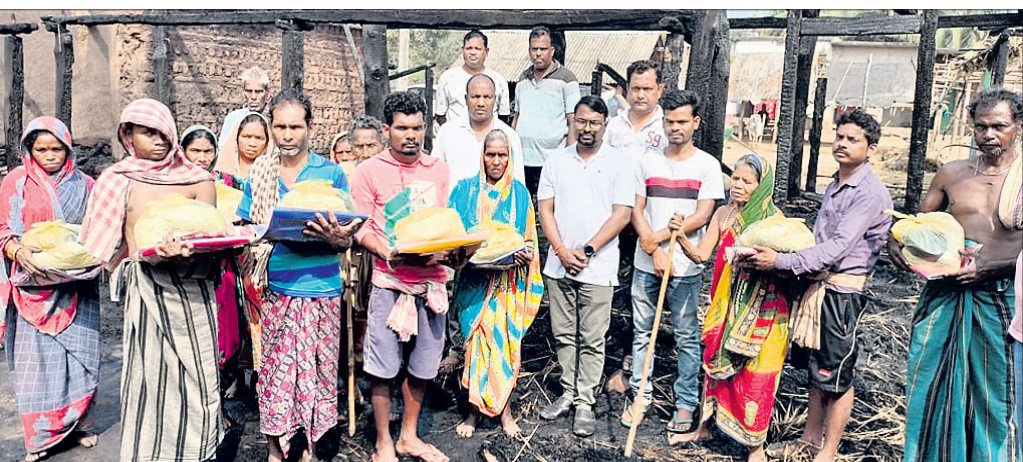
ଅଗ୍ନି ବିପଦକୁ ସହାୟତା ପ୍ରଦାନ କରାଯାଇଛି ।

ନୂଆଗାଁ/ଓଡ଼ଗାଁ, ୭।୨ (ଧନେଶ୍ୱର ସାହୁ/ଆର୍ଦର୍ଶ କୁମାର ପଟ୍ଟନାୟକ)