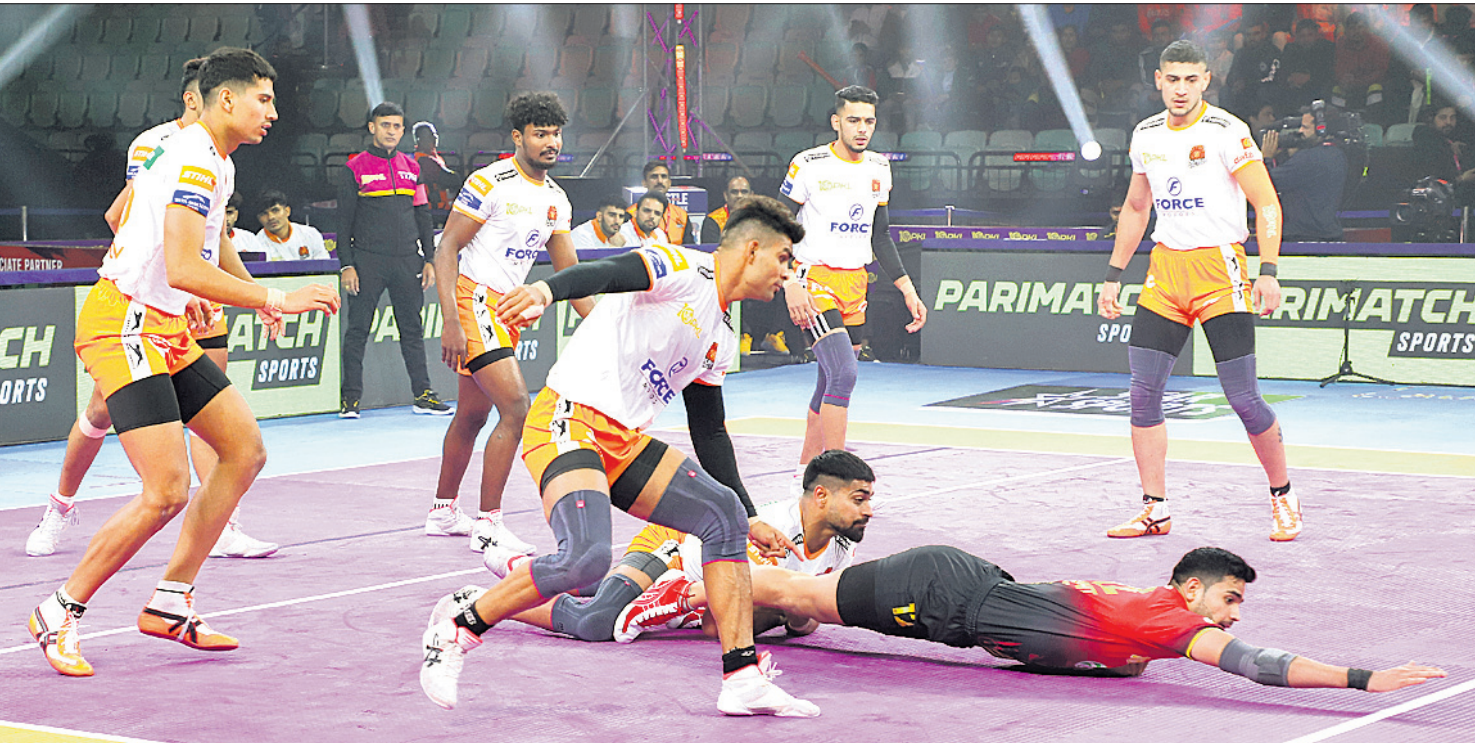
ନୂଆଦିଲ୍ଲୀ: ପ୍ରୋ କବାଡ଼ିର ରୁଧିର ପୁନେରି ପଲଟନ ଓ ବେଙ୍ଗାଲୁରୁ ବୁଲ୍ଲ ମଧ୍ୟରେ ଅନୁଷ୍ଠିତ ମ୍ୟାଚ । ଏଥିରେ ପୁନେରି ପଲଟନ ୪୦-୩୧ ପଏଣ୍ଟରେ ବିଜୟ ହୋଇଛି ।