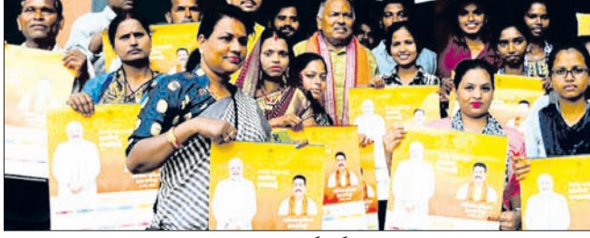
ସମ୍ମିଳନୀରେ ଯୋଗ ଦେଇଥିବା ଲୋକମାନେ କର୍ମଚାରୀମାନେ ।