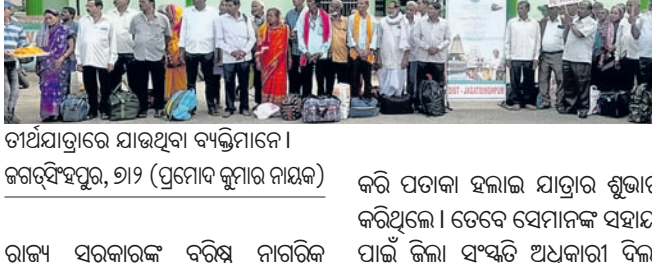
ତୀର୍ଥଯାତ୍ରାରେ ଯାଉଥିବା ବ୍ୟକ୍ତିମାନେ । ଜଗଦ୍ଦୀହପୁର, ୭୨