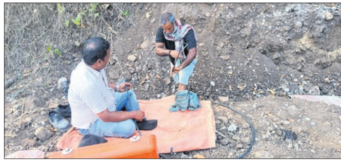
କେବଳ ଯୋଗ୍ୟ କାର୍ଯ୍ୟ ଚାଲିଛି।

ଦାରିକାଦାଡ଼ି ବ୍ଲକ୍ ଦୁର୍ଗମ ପଞ୍ଚାୟତ ଉପାଧିକାରୀ, ଡ୍ରାଫ୍ଟିଙ୍ଗାଣା, ଡାକ୍ତରଖାନାରେ ୪ ମାସ ହେଲା ବିଦ୍ୟୁତ୍ ସଂଲଗ୍ନ ନେଟୱାର୍କ ଫୋଲ୍ଡ ଯୋଗୁଁ ହଜାର ହଜାର ଗ୍ରାହକ ହଇଜାଣ ହେଉଛନ୍ତି। କରୁଣାକାଳୀନ ସେବା ପାଇବାପାଇଁ ଏବେ ଅନ୍ତର୍ଜାତୀୟ ମାଧ୍ୟମରେ ସମସ୍ତ ସରକାରୀ କାର୍ଯ୍ୟ ଚାଲୁଥିବା ବେଳେ ଆଧାର ଲିଙ୍କ୍ ହେଉ ନିର୍ଦ୍ଦିଷ୍ଟ ବ୍ୟାଙ୍କରେ ଲୋକଙ୍କ ନେଶିଦେବା ହେଉ ସବୁଠି ସମସ୍ୟା ଦେଖାଦେଇଛି। ସେହିପରି ରୋଗୀଙ୍କୁ ଜରୁରୀ ସେବା ଯୋଗାଇବା ପାଇଁ ଆଞ୍ଚଳିକ ସ୍ତରୀୟ ଉପାଧିକାରୀଙ୍କୁ ପୂର୍ଣ୍ଣ ଆଧାର ଲିଙ୍କ୍ ହେଉ ନିର୍ଦ୍ଦିଷ୍ଟ ବ୍ୟାଙ୍କରେ ଲୋକଙ୍କ ନେଶିଦେବା ହେଉ ସବୁଠି ସମସ୍ୟା ଦେଖାଦେଇଛି। ଏବେ ଅନ୍ତର୍ଜାତୀୟ ମାଧ୍ୟମରେ ସମସ୍ତ ସରକାରୀ କାର୍ଯ୍ୟ ଚାଲୁଥିବା ବେଳେ ଆଧାର ଲିଙ୍କ୍ ହେଉ ନିର୍ଦ୍ଦିଷ୍ଟ ବ୍ୟାଙ୍କରେ ଲୋକଙ୍କ ନେଶିଦେବା ହେଉ ସବୁଠି ସମସ୍ୟା ଦେଖାଦେଇଛି।