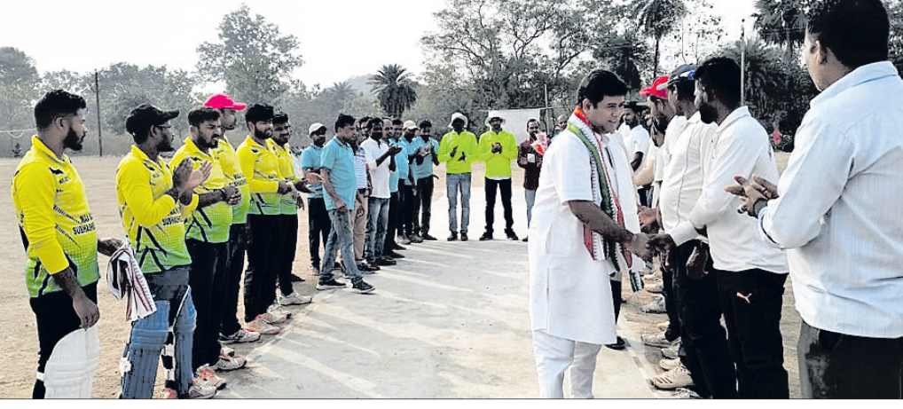
ଅତିଥିମାନେ ଖେଳାଳିମାନଙ୍କ ସହ ପରିଚିତ ହେଉଛନ୍ତି ।