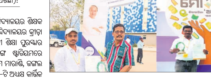
ପ୍ରଦାନ କରିଛନ୍ତି। ଏହି ପରିପ୍ରେକ୍ଷାରେ ରାଜଗଡ଼ ବ୍ଲକ୍ ଶିକ୍ଷକଙ୍କୁ ବିଭିନ୍ନ ମହତ୍ତ୍ୱପୂର୍ଣ୍ଣ କର୍ମାଚାରୀଙ୍କୁ ସମ୍ମାନିତ କରାଯାଇଛି।

ରାଜପତି ଜିଲା ରାଜଗଡ଼ ସରକାରୀ ଉଚ୍ଚ ବିଦ୍ୟାଳୟ ଶିକ୍ଷକ ସମାଜଦ୍ୱାରା କେ.ଏମ୍. ଭାଲିଆସାହି ଉଚ୍ଚ ବିଦ୍ୟାଳୟ କ୍ରୀଡ଼ା ଶିକ୍ଷକ ଅଭିଭାବକ ସମାଜ ସେଠାକୁ ପୁଞ୍ଜିମାଳା ଶିକ୍ଷା ପୁରସ୍କାର ପ୍ରଦାନ କରାଯାଇଛି। ଭୁବନେଶ୍ୱର କଳିଙ୍ଗ ଶ୍ୱାସିକାଳୟରେ ଆୟୋଜିତ ସମାରୋହରେ ଶିକ୍ଷାମାଳା ପୁରାଣୀ, ଜଗଜ୍ଞ ଓ ପରିବେଶ ମନ୍ତ୍ରୀ ପ୍ରଦାନ ଅର୍ପଣ ଏବଂ ୫-ଟି ଅଧ୍ୟକ୍ଷ କାର୍ଯ୍ୟ ପାଠିଆୟକ ଉପସ୍ଥିତରେ ପୁଞ୍ଜିମାଳା ନବୀନ ପଞ୍ଚମାୟକ ପୁସ୍ତିକା ଏବଂ ପ୍ରମାଣ ପତ୍ର ସହ ଉଭୟଙ୍କୁ ୨୫ ହଜାର ଟଙ୍କା ଲେଖାଏଁ