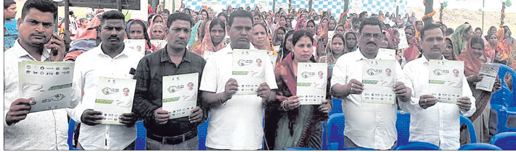
ଜଗନ୍ନାଥପ୍ରସାଦରେ ଆମ ଓଡ଼ିଶା ନବୀନ ଓଡ଼ିଶା କାର୍ଯ୍ୟକ୍ରମରେ ସୂଚନା ପୁସ୍ତିକାକୁ ପ୍ରଦର୍ଶନ କରାଯାଇଛି ।